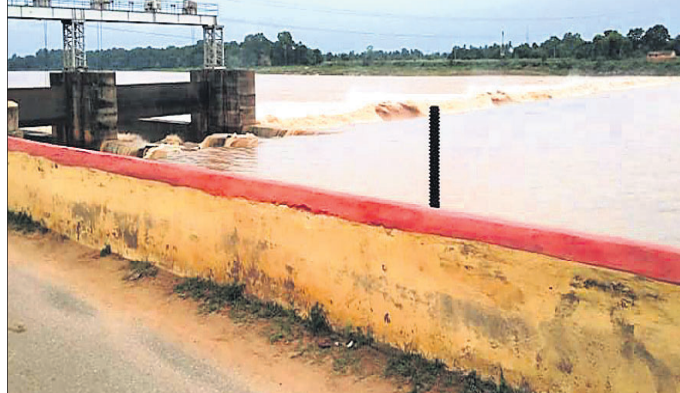
ଆଖୁଆପଦା ଆନିକଟରେ ବନ୍ୟାକଳ।