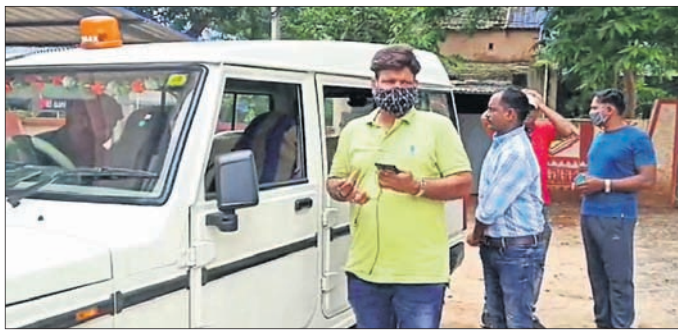
ପାରଳାଖେମୁଣ୍ଡି ବଳାଙ୍ଗୀର ବାହାରିଥିବା ପୋଲିସ୍ ଟିମ୍।