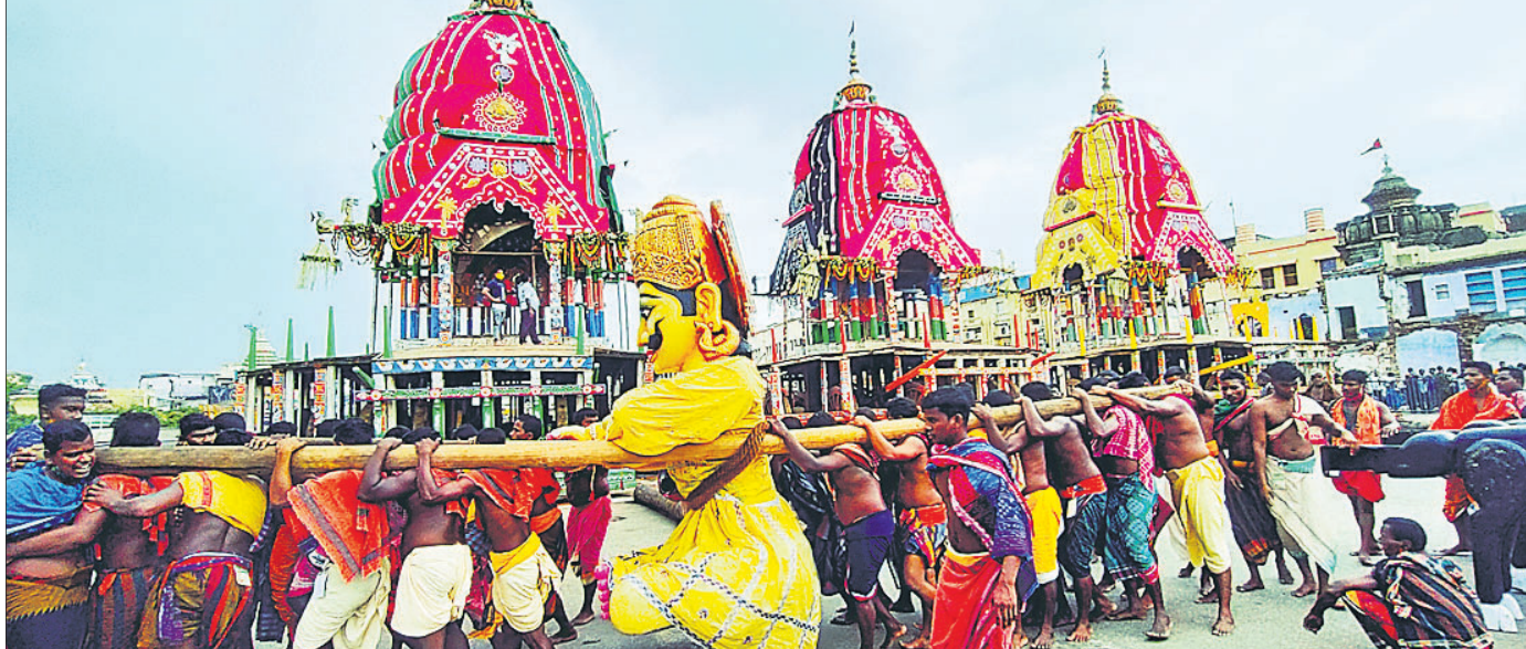
ଭୋଇ ସେବକମାନେ ଶନିବାର ତିନିରଥର ସାରଥିକୁ ବାହାର କରି ବୋଇବେଦକୁ ବୋହି ନେଇଛନ୍ତି।