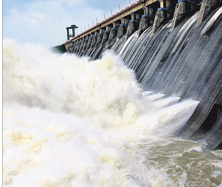
ହାରାକୁଦ ତ୍ୟାମ୍ବରୁ ୪ ଗେଟ୍ ଦେଇ ଜଳ ନିଷ୍କାସିତ ହେଉଛି।