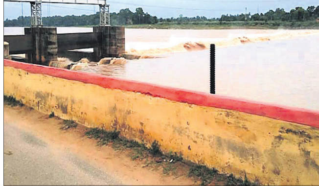
ଆଖୁଆପଦା ଆନିକଟରେ ବନ୍ୟାକଳ।