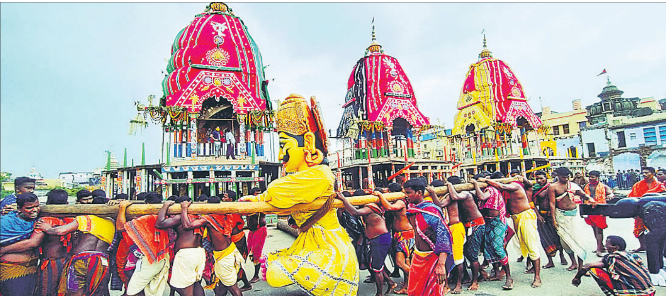
ଭୋଇ ସେବକମାନେ ଶନିବାର ତିନିରଥର ସାରଥିକୁ ବାହାର କରି ବୋଇବେଦକୁ ବୋହି ନେଇଛନ୍ତି।

କରିବାକୁ ସମୟ ଦିଆଗଲା । ସେହିଭଳି ପୁଣି ଥରେ ବିଦ୍ୟାଭାରତୀଙ୍କୁ ପଚରାଉଚୁରା ପାଇଁ ଚାକ ଘର କଠିପଦା ଗୋଡ଼ାକୁ ଆହୁରଣ କରାଯାଇଛି। ତାଙ୍କୁ ଖଲାସ ପାଇ ନିଧି ଶତଯତ୍ନ କରାଯାଇଛି। ଏହାଛଡ଼ା ଆମ୍ଭଙ୍କୁ ଅଟକାଇଥିବା ରୁକ୍ଷି ଓଆଇସି ମନତା ପଣ୍ଡା, ରୋଷେୟା ମନୁ କମ୍ପୁ ମଧ୍ୟ ଠିକ୍ ଭାବେ ଜେରା କରାଗଲା ନାହିଁ । ସମସ୍ତ ଘଟଣାକୁ ଦେଖିଲେ ଅଭିଯୁକ୍ତଙ୍କୁ ଖସାଇବାକୁ ପୋଲିସ୍ ସେମାନଙ୍କ ସ୍ଵତନ୍ତ୍ର ମିଳାଇଥିବା ନେଇ ସେ ସ୍ଵାଧୀନ ଅଭିଯୋଗ ଆଣିଛନ୍ତି । ଏମିତିକି କେତେଶାସ୍ତ୍ର ବିଦ୍ୟାଭାରତୀଙ୍କୁ ପ୍ୟାମିଲି ଚେନସିନ ମିଳିପାରିବ ତାର ବ୍ୟବସ୍ଥା ପୋଲିସ୍ କରୁ ବୋଲି ସେ ଆରୋପ ଲଗାଇଛନ୍ତି। ଯଦି ନ୍ୟାୟ ନ ମିଳେ ତେବେ ହାଇକୋର୍ଟ ଓ ସୁପ୍ରିମକୋର୍ଟ ପର୍ଯ୍ୟନ୍ତ ଯିବେ ବୋଲି ସେ କହିଛନ୍ତି ।