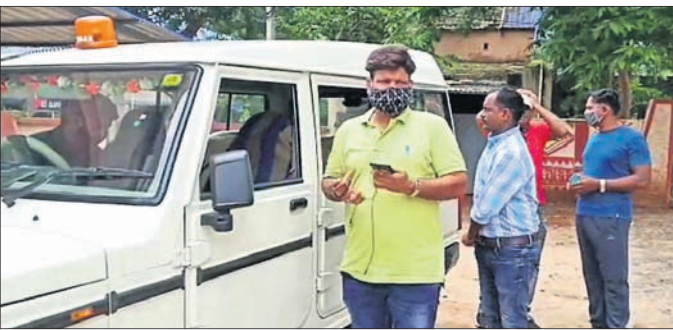
ପାରଳାଖେମୁଣ୍ଡି ବଳାଙ୍ଗୀର ବାହାରିଥିବା ପୋଲିସ୍ ଟିମ୍।