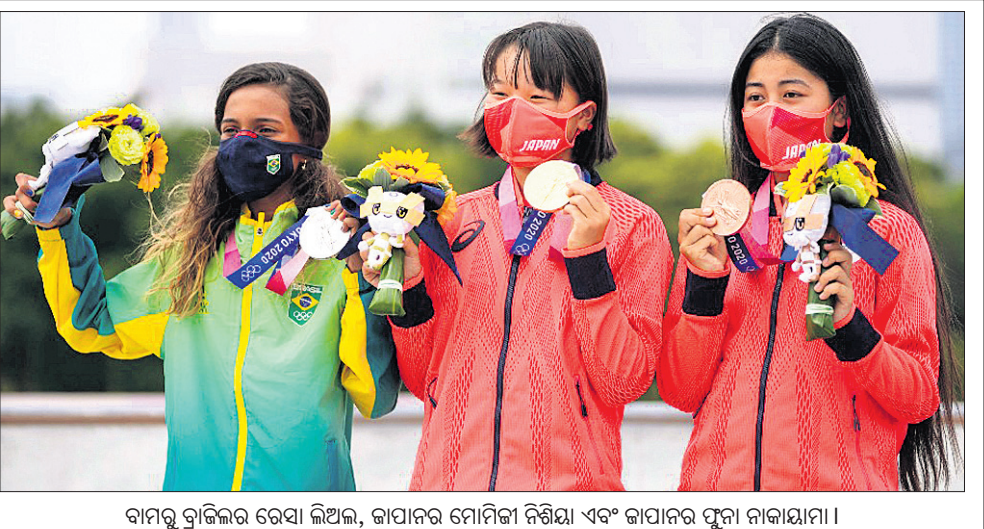
ବାମରୁ ବ୍ରାଜିଲର ଭେୟା ଲିୟାଲ, ଜାପାନର ମୋନିକା ନିଶ୍ଚିତା ଏବଂ ଜାପାନର ଯୁନା ନାକାୟାମା

ଟୋକିଓ, ୨୨୭: ଟୋକିଓ ଅଲିମ୍ପିକ୍ସରେ ସ୍ପର୍ଶ ପଦକ ହାସଲ କରିବାକୁ ଚ୍ୟୁଆଁ ମୋନିକା ନିଶ୍ଚିତା ସ୍ପର୍ଶ ପଦକ ହାସଲ କରିଛନ୍ତି। ସେହିପରି ଟ୍ରାଜିକର ୧୩ ବର୍ଷୀୟା ଖେଳାଳି ଭେୟା ଲିୟାଲ ରୌପ୍ୟ ପଦକ ହାସଲ କରିଛନ୍ତି। ସେହିପରି ଜାପାନର ଅନ୍ୟତମ ଖେଳାଳି ଯୁନା ନାକାୟାମା ଏହି ଲଢ଼େଇରେ ତ୍ରୋଜି ପଦକ ଜିତିଛନ୍ତି। ମୋନିକା ସୋମବାର ୧୩ ବର୍ଷ ୩୩୦ ଦିନ ବୟସରେ ସ୍ପର୍ଶ ପଦକ ଜିତି ଅନ୍ୟତମ ସର୍ବନିମ୍ନ ଅଲିମ୍ପିକ୍ସ ସ୍ପର୍ଶ ପଦକ ବିଜୟିନୀ ସାବ୍ୟସ୍ତ ହୋଇଛନ୍ତି।