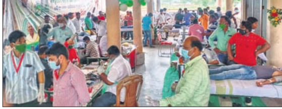
ଶିବିରରେ ରତ୍ନ ସଂଗ୍ରହ କରାଯାଇଛି।

ସୋରଡ଼ା, ୨୬/୭ (ଡି.ଏନ.ଏ.)-ରଞ୍ଜନା ଜିଲ୍ଲା ସୋରଡ଼ା ବିଧାୟକ ପୂର୍ଣ୍ଣଚନ୍ଦ୍ର ସ୍ଵାଇଁକ ବାପାଙ୍କ ଶ୍ରାବ୍ଧ ଦିବସ ଉପଲକ୍ଷେ ସୋମବାର ପୈତୃକ ଗ୍ରାମରେ ଜୀବନ ବିରୁଦ୍ଧ କାର୍ଯ୍ୟକ୍ରମ ଅନୁଷ୍ଠିତ ହୋଇଥିଲା।