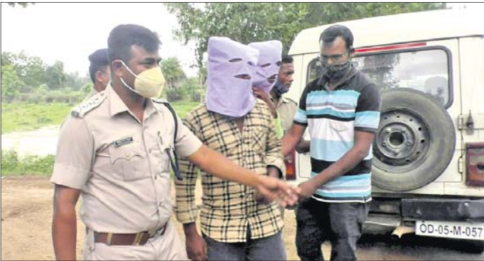
ପୋଲିସ୍ ଟିମ୍ ଅଭିଯୁକ୍ତଙ୍କୁ ନେଇ ୨୬ ନମ୍ବର ଜାତୀୟ ରାଜପଥରେ ଲୁଚ୍ ସିନ୍ ରିକ୍ରେଟ୍ କରୁଛି ।