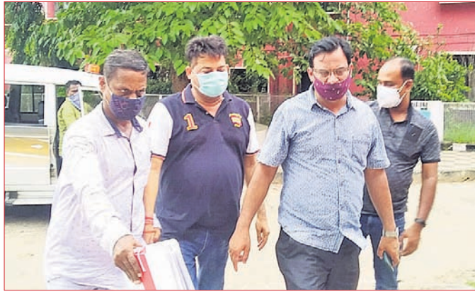
ବାଲେଶ୍ଵର କୋର୍ଟରେ ଚିତ୍ରପଞ୍ଚ ଠକେଇ ଅଭିଯୁକ୍ତ ହାଜର କରିବାକୁ ନିଆଯାଇଛି। ଦେଇ ସାଧାରଣ ଜନତାଙ୍କୁ ଆକର୍ଷିତ କରିବା ସହ ଅନଧିକୃତ ଭାବରେ ବହୁ ନିବେଶକଙ୍କଠାରୁ ବିପୁଳ ପରିମାଣର ଅର୍ଥସଂଗ୍ରହ କରିଥିବା ନେଇ ବାଲେଶ୍ଵର କୋର୍ଟରେ ହାଜର ହୋଇଥିବା ଅଭିଯୁକ୍ତ ଚିତ୍ରପଞ୍ଚ ଠକେଇ ଅଭିଯୁକ୍ତ ଗିରଫ କରାଯାଇଛି।

୧୫ କୋଟି ଟଙ୍କା ଚଳୁ କରି ଫେରାର ଥିବା ଜଣେ ଚିତ୍ରପଞ୍ଚ ଠକେଇ ଅଭିଯୁକ୍ତ ଭୁବନେଶ୍ଵରସ୍ଥିତ ଅର୍ଥନୈତିକ ଅପରାଧ ଶାଖା (ଇଓଡବ୍ଲ୍ୟୁ) ରବିବାର କୋଲକାତାରୁ ଗିରଫ କରାଯାଇଛି।