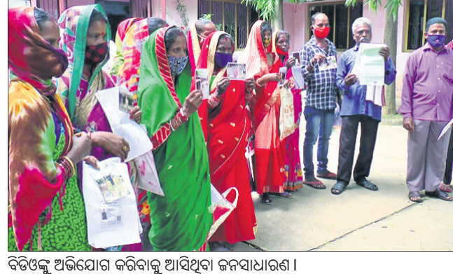
ବିଡ଼ଓଇ ଅଭିଯୋଗ କରିବାକୁ ଆସିଥିବା ଜନସାଧାରଣ।

ବ୍ଲକ୍ ପ୍ରଶାସନକୁ ହିତାଧିକାରୀ ଅବଗତ କରିଥିଲେ ବି ଏପ୍ରତି କେହି କଣ୍ଠପାତ କଲୁ ନ ଥିବା ସେମାନେ ଅଭିଯୋଗ କରିଛନ୍ତି।