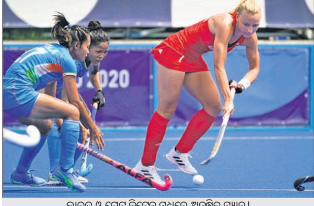
ଭାରତ ଓ ଗ୍ରେଟ୍ ବ୍ରିଟେନ ମଧ୍ୟରେ ଅନୁଷ୍ଠିତ ମ୍ୟାଚ।

କରିଥିଲା। ସେହିପରି ୬ଟି ପେନାଲ୍ଟି କର୍ମରୁ ବ୍ରିଟେନ ଗୋଟିଏଗୁ ଗୋଲରେ ପରିଣତ କରିଥିଲା। ଆକ୍ରମଣାତ୍ମକ ଖେଳ ପ୍ରଦର୍ଶନ କରି ବ୍ରିଟେନ ଭାରତୀୟ ଡିଫେନ୍ସ ଉପରେ ଗାଢ଼ ପ୍ରୟୋଗ କରିବାରେ ସଫଳ ହୋଇଥିଲା। ୩ ପରାଜୟ ସହ କୌଣସି ପଏଣ୍ଟ ହାସଲ ନ କରି ଭାରତ ଏବେ ପୁଲ୍-୧ ଚାଲିବାର ପଞ୍ଚମ ଗ୍ଲାନରେ ରହିଛି। ଅନ୍ୟପକ୍ଷେ ନେବରଲାଣ୍ଡ ୩ଟି ମ୍ୟାଚ ଖେଳି ୩ଟି ବିଜୟ ସହ ୯ ପଏଣ୍ଟ ହାସଲ କରି ଶୀର୍ଷରେ ରହିଛି। କର୍ମୀନା ୩ଟି ମ୍ୟାଚରେ ୯ ପଏଣ୍ଟ ହାସଲ କରିଥିଲେ ମଧ୍ୟ ଗୋଲ ବ୍ୟବଧାନ ଦୃଷ୍ଟିକୋଣରୁ ଦ୍ୱିତୀୟ, ବ୍ରିଟେନ ୩ଟି ମ୍ୟାଚ ଖେଳି ୨-୦ ବିଜୟ ଓ ୧ ପରାଜୟ ସହ ୬ ପଏଣ୍ଟ ହାସଲ କରି ତୃତୀୟ, ଆୟଲ୍ୟାଣ୍ଡ ଗୋଟିଏ ବିଜୟ ସହ ୩ ପଏଣ୍ଟ ପାଇ ତତ୍ତ୍ୱେ ଗ୍ଲାନରେ ରହିଛି। ସେହିପରି ଦକ୍ଷିଣ ଆଫ୍ରିକା କୌଣସି ପଏଣ୍ଟ ନ ପାଇ ଅଜିତ ତଥା ୩ଷ୍ଠ ଗ୍ଲାନରେ ରହିଛି।