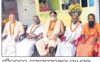
ବୈଠକରେ ଯୋଗଦେଇଥିବା ସାଧୁସନ୍ଥ

ଓ ଭାରତ ଆଦି ଗଛର ସାମାଜିକ ମୌଳିକତତ୍ତ୍ୱକୁ ଜନପୂଜା କରାଇବା, ଆଦି ପ୍ରସଙ୍ଗ ଉପରେ ଆଲୋଚନା ହୋଇଥିଲା। ପରେ ଆଧ୍ୟାତ୍ମିକ ପରିଷଦ