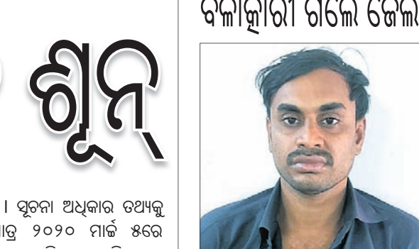
ବ୍ରହ୍ମପୁର ଅଫିସ, ୨୮୭

ପାଇଁ ପ୍ରସ୍ତୁତ ଶେଷ ହୋଇଛି। ପୂର୍ବତନ ସିଡିଏମ୍ ଏମ୍ବୁଲେନ୍ସ ଓ ସ୍ୱାସ୍ଥ୍ୟକର୍ମୀ ପଞ୍ଚାୟତ ବିରୋଧରେ କାର୍ଯ୍ୟାନୁଷ୍ଠାନକୁ ଦ୍ୱାରଦ୍ୱାରା ବନ୍ଦ କରିବାକୁ ଯୁକ୍ତି ଦିଆଯାଇଛି।