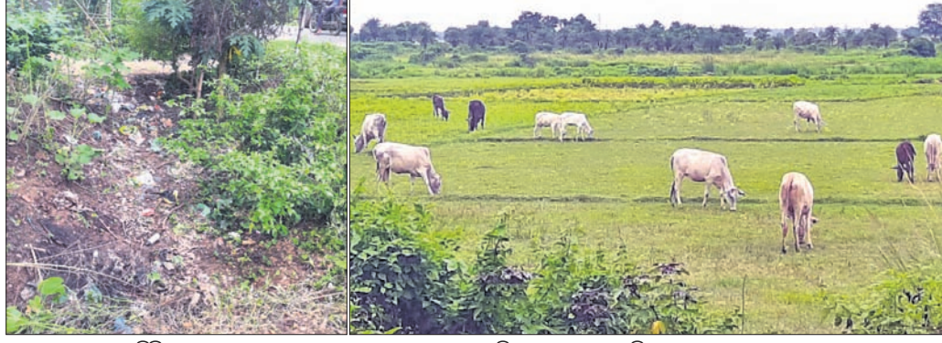
କେନାଲ ଶୁଖିଲା ପଡ଼ିଛି।

କେନାଲ ଅଛି, ହେଲେ ପାଣି ନାହିଁ ଫଳରେ ଚାଷଜମି ପଡ଼ିଆ ପଡ଼ିଛି। ପଡ଼ିଆ ଜମିରେ ଲୋକେ ଗୋରୁ ଚରାଇବାକୁ ଛାଡ଼ି