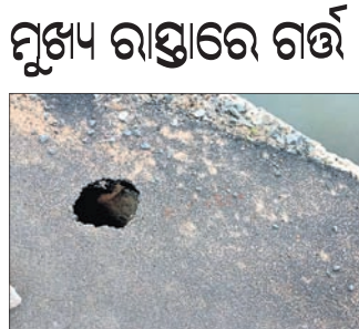
ଗଞ୍ଜାମ, ୨୮୭ (ଡି.ଏନ.ଏ.): ଗଞ୍ଜାମ ସହର ଟ୍ରିଭେଣା ମଠ ଛକ ବିସ୍ଫୋଟପାଇଁ ମାଧ୍ୟମ ମୁଖ୍ୟରାସ୍ତା ପାର୍ଶ୍ୱରେ ଏକ ଗର୍ତ୍ତ ସୃଷ୍ଟି ହୋଇଛି।

ସାପ କାମୁଡ଼ାରେ ମହିଳାଙ୍କ ମୃତ୍ୟୁ ବ୍ରହ୍ମପୁର ଅଫିସ, ୨୮୭: ସାପ କାମୁଡ଼ାରେ ଗୁରୁତର ଥିବା ଜଣେ ମହିଳାଙ୍କର ଏମ୍ବୁଲେନ୍ସରେ ଗୋଟିଏ ଘଣ୍ଟା ଧରି ଚିକିତ୍ସା କରାଯାଇଥିଲା।