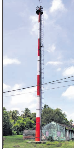
ରୁକ୍ ସେହି ଭାବରେ ନିର୍ମିତ ସୁନାମି ସତର୍କ ସୂଚନା ଗାଞ୍ଜାର।

ସତର୍କ ସୂଚନା ଗାଞ୍ଜାରରେ ସାମାନ୍ୟ ତ୍ରୁଟି ରହିଲେ ସୁନାମି ସମ୍ପର୍କରେ ଯୋଜ୍ଞା ମାରିବା ଅସମ୍ଭବ ନୁହେଁ। ଏହି ସତର୍କ ସୂଚନା ଗାଞ୍ଜାରର ହାଇଡ୍ରୋଗ୍ରାଫିଠାରେ ପୂର୍ଣ୍ଣ ନିୟନ୍ତ୍ରଣ କ୍ଷମ ରହିଛି। ଏହାକୁ କେନ୍ଦ୍ର