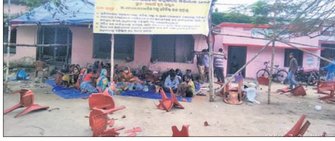
ଲୁକ କାର୍ଯ୍ୟକ୍ରମ ଆନାରେ ଧାରଣାକାରୀଙ୍କ ଭଙ୍ଗାଯାଇଥିବା ଚେୟାର।

ରାତିରେ କେତେକଣ ଦୁର୍ଭିକ୍ଷ ଧାରଣାକାରୀମାନଙ୍କୁ ରାତିକୁଲକ କରି ଆକ୍ରମଣ କରିଥିବା ଅଭିଯୋଗ ହୋଇଛି।