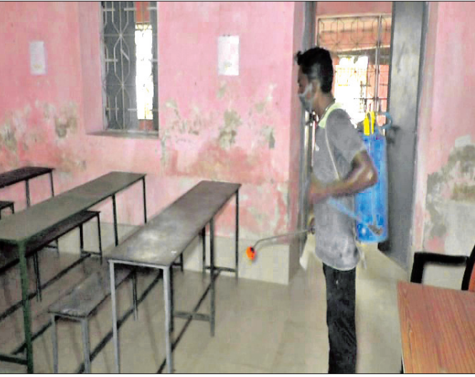
ବଲାଙ୍ଗୀର ପୃଥ୍ୱୀରାଜ ହାଇସ୍କୁଲ ପରୀକ୍ଷା କେନ୍ଦ୍ରକୁ ସାମାଜିକ କରାଯାଇଛି ।

ବଲାଙ୍ଗୀର ଜିଲା ଶିକ୍ଷା ଅଧିକାରୀଙ୍କ ଅଫିସ ସ୍ୱତନ୍ତ୍ର ମିଲିଥିବା ସୂଚନା ପ୍ରତ୍ୟେକ ମାଟ୍ରିକ୍ ଇମ୍ପ୍ରୁଭମେଣ୍ଟ ପରୀକ୍ଷା ପାଇଁ ଜିଲ୍ଲାରେ ୧୫ଟି ସେକ୍ସର କରାଯାଇଛି । ଏହି ୧୫ଟି ପରୀକ୍ଷା କେନ୍ଦ୍ରରେ ୨୯୫୫ ଜଣ ପରୀକ୍ଷାର୍ଥୀଙ୍କୁ ମିଲିଥିବା ସୂଚନା ପ୍ରତ୍ୟେକ ମାଟ୍ରିକ୍ ଇମ୍ପ୍ରୁଭମେଣ୍ଟ ପରୀକ୍ଷା ପାଇଁ ଜିଲ୍ଲାରେ ୧୫ଟି ସେକ୍ସର କରାଯାଇଛି । ଏହି ୧୫ଟି ପରୀକ୍ଷା କେନ୍ଦ୍ରରେ ୨୯୫୫ ଜଣ ପରୀକ୍ଷାର୍ଥୀଙ୍କୁ ମିଲିଥିବା ସୂଚନା ପ୍ରତ୍ୟେକ ମାଟ୍ରିକ୍ ଇମ୍ପ୍ରୁଭମେଣ୍ଟ ପରୀକ୍ଷା ପାଇଁ ଜିଲ୍ଲାରେ ୧୫ଟି ସେକ୍ସର କରାଯାଇଛି । ଏହି ୧୫ଟି ପରୀକ୍ଷା କେନ୍ଦ୍ରରେ ୨୯୫୫ ଜଣ ପରୀକ୍ଷାର୍ଥୀଙ୍କୁ ମିଲିଥିବା ସୂଚନା ପ୍ରତ୍ୟେକ ମାଟ୍ରିକ୍ ଇମ୍ପ୍ରୁଭମେଣ୍ଟ ପରୀକ୍ଷା ପାଇଁ ଜିଲ୍ଲାରେ ୧୫ଟି ସେକ୍ସର କରାଯାଇଛି ।