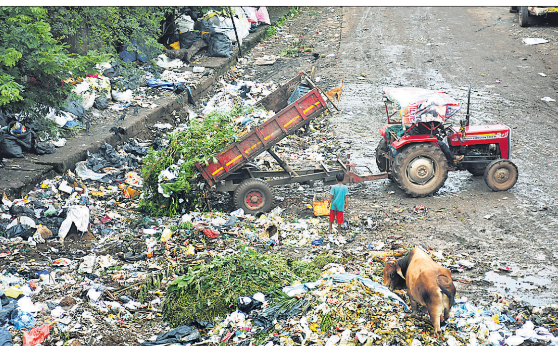
ତେଜୁରୁ ଆମନ୍ତ୍ରଣ: ସତରତନତା ଉତ୍ତରକୁ ଚଳ ଓ ସୁନିର୍-୧ ମାକେଟ ଅଞ୍ଚଳରେ ଅଧିଆ ଗବା। ବର୍ଷା ପାଣି ସହ ପଚାଶଟା ଆବର୍ଜନା ରାସ୍ତାରେ ଜମି ରହିଛି।

ବାଲିପାଳ, ୨୯।୭(ଡି.ଏନ.ଏ.): ଭଦ୍ରକ ଜିଲ୍ଲା ବାଲିପାଳ ଗୋଷ୍ଠୀ ସ୍ୱାସ୍ଥ୍ୟକେନ୍ଦ୍ରରେ ଜଣେ କର୍ମଚାରୀ ଲାଞ୍ଚ ନେଇଥିବାର ଭିଡିଓ ସାମାଜିକ ଗଣମାଧ୍ୟମରେ ଭାଇରାଲ ହେବାରେ ଲାଗିଛି। ସ୍ୱାସ୍ଥ୍ୟକେନ୍ଦ୍ର ଅଧିକ ଭିଡରେ କର୍ମଚାରୀ ଜଣଙ୍କ ଜରୁ ଓ ମୃତ୍ୟୁ ସାର୍ଟିଫିକେଟ୍ ପାଇଁ ଲାଞ୍ଚ ନେଉଥିବା କ୍ୟାମେରାରେ କ୍ୟପ୍ ହୋଇଛି। ସେ ଲାଞ୍ଚ ନେଇ ଚେପୁଲ ଡଳେ ଫିକ୍ସି ଦେଉଥିବା ଭଲ ଭିଡିଓରେ ଦେଖିବାକୁ ମିଳିଛି। ଅନ୍ୟପକ୍ଷେ ସମ୍ପୂର୍ଣ୍ଣ କର୍ମଚାରୀ ଏହାରୁ ଅସ୍ୱାକାର କରିଛନ୍ତି। ତଦତ୍ତ କରାଯାଇ ଲାଞ୍ଚ ନେଉଥିବା କର୍ମଚାରୀଙ୍କ ବିରୋଧରେ କାର୍ଯ୍ୟାନୁଷ୍ଠାନ ପାଇଁ ବାଲିପାଳ ଅଞ୍ଚଳବାସୀ ବାଟି କରିଛନ୍ତି। ପ୍ରକାଶ ହେ, ଆବେଦନର ୬ ଦିନ ମଧ୍ୟରେ କିଛି ଓ ମୃତ୍ୟୁ ପ୍ରମାଣପତ୍ର ଦେବାକୁ ନିୟମ ଥିବାବେଳେ ଏହି ସ୍ୱାସ୍ଥ୍ୟକେନ୍ଦ୍ରରେ ଅତିକମରେ ୨୦୩ ମାସ ବୌଦ୍ଧବାକୁ ପଡ଼ିଥାଏ। ଏହି ବିଭାଗରେ ଥିବା କର୍ମଚାରୀ ପ୍ରମାଣପତ୍ର ଦେବାରେ ବିଳମ୍ବ ଏବଂ ନିର୍ଦ୍ଧାରିତ ମୂଲ୍ୟଠାରୁ ଅଧିକ ଆବାସ କରୁଥିବା ବାରମ୍ବାର ଅଭିଯୋଗ ହୋଇଆସୁଥିଲା। କର୍ମଚାରୀ ଲାଞ୍ଚ ନେବା ସମ୍ପର୍କରେ ସ୍ୱାସ୍ଥ୍ୟକେନ୍ଦ୍ର ମୁଖ୍ୟ ଚିକିତ୍ସାଧିକାରୀଙ୍କ ସହ ଯୋଗାଯୋଗ ହୋଇପାରି ନାହିଁ।