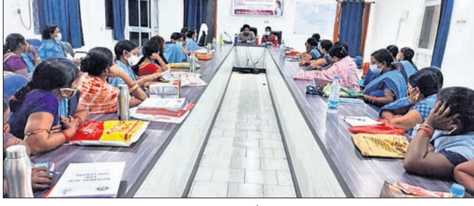
ପ୍ରଶିକ୍ଷଣ ଶିବିରରେ ଉପସ୍ଥିତ ଡାକ୍ତର ଓ ଆଶାକର୍ମୀମାନେ ।

ମହେଶ୍ୱର ହିନ୍ଦୀ ନୋଡାଲ ହାଇସ୍କୁଲ, କଟାକର ନୋଡାଲ ହାଇସ୍କୁଲ, ବଲାଙ୍ଗୀର ସରକାରୀ ବାଳିକା ହାଇସ୍କୁଲ ଗୁଡ଼ିକ ଏବଂ ଧର୍ମପୁତ୍ରା ଜବାହରଲାଲ ହାଇସ୍କୁଲରେ ପରୀକ୍ଷା ସେକ୍ସର କରାଯାଇଛି । କୋଭିଡ୍ ଗାଇଡଲାଇନ୍ ପାଳନ କରାଯାଇ ପରୀକ୍ଷା ପରିଚାଳନା ବ୍ୟବସ୍ଥା କରାଯାଇଛି । ପରୀକ୍ଷାରଠାରୁ ଦୂରତା ରକ୍ଷା କରି ପରୀକ୍ଷାର୍ଥୀମାନେ ପରୀକ୍ଷା କେନ୍ଦ୍ରରେ ବସିବେ । ମୁକ୍ତ ଓ ଅବାଧ ପରୀକ୍ଷା ପରିଚାଳନା ପାଇଁ ବୋର୍ଡ୍ ପକ୍ଷରୁ ଗୋଟିଏ ଓ ଜିଲା ଶିକ୍ଷା ବିଭାଗରୁ ଗୋଟିଏ ଏଭଲିକ୍ସ ପରୀକ୍ଷା ପ୍ରକଳ୍ପ ଗଠନ କରାଯାଇଛି । ପରୀକ୍ଷା ଅବକାଶଭର ବ୍ୟବସ୍ଥା କରାଯାଇଛି ବୋଲି ଜିଲ୍ଲା ଓ ବେହେରା ସୂଚନା ଦେଇଛନ୍ତି ।