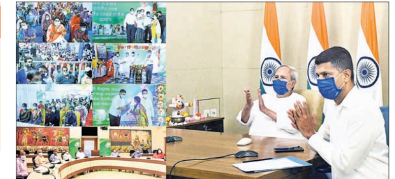
ଭୁବନେଶ୍ଵର, ୨୯୭ (ବୁଧବାର)

ଗୁଭାରଣ କଲେ ମୁଖ୍ୟମନ୍ତ୍ରୀ ■ ମାଲକାନଗିରି ଜିଲ୍ଲାରେ ଭିତ୍ତିମୂଳକ ଚାଉଳ ପ୍ରଦାନ ଆରମ୍ଭ ■ ସ୍ଵାଭିମାନର ସହ ବଞ୍ଚିବା ଅଧିକାରରୁ ଗରିବ ଲୋକଙ୍କୁ କେହି ବଞ୍ଚିତ କରିପାରିବେ ନାହିଁ: ମୁଖ୍ୟମନ୍ତ୍ରୀ