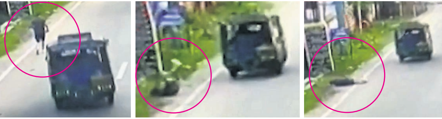
ଧାନବାଦ ଜିଲ୍ଲା ଅତିରିକ୍ତ ବିଚାରପତି ଉତ୍ତମ ଆନନ୍ଦଙ୍କୁ ଅଟୋରୁ ମଡ଼ାଇ ହତ୍ୟା କରାଯାଇଥିବା ବେଳର ଦୁର୍ଘଟଣା ସିଦ୍ଧିଚିତ୍ରି ପୁଟେକରେ କଏବ ହୋଇଛି।