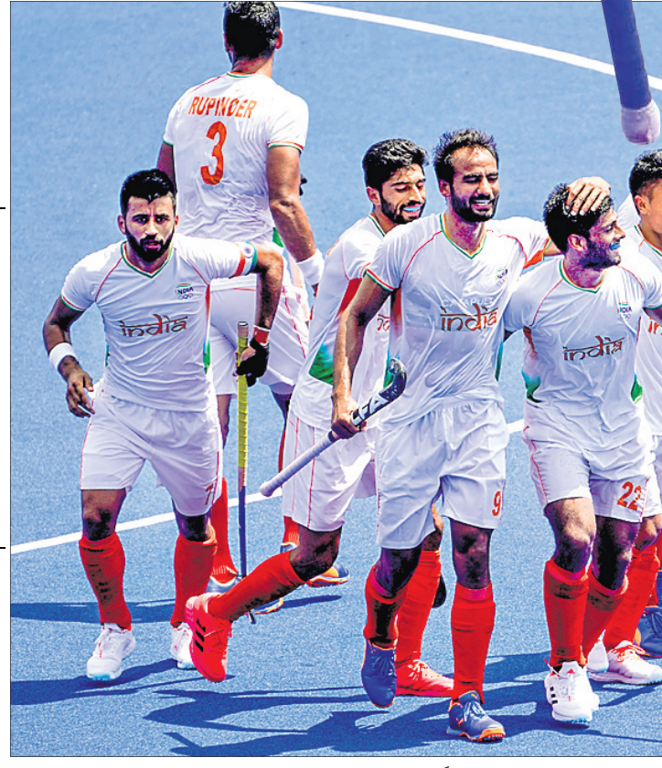
ବିଜୟ ହାସଲ ପରେ ଖୁସି ମୁହୂର୍ତ୍ତରେ ଭାରତୀୟ ହକି ଦଳ।