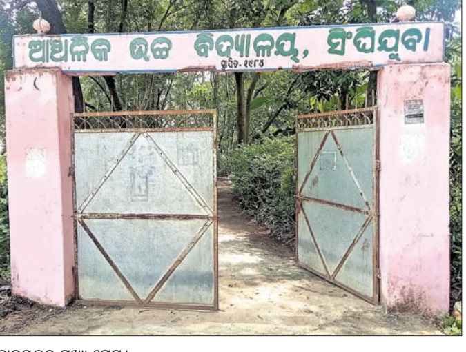
ହାଇସ୍କୁଲର ପୁଞ୍ଜ୍ୟ ରେଟ୍ ।