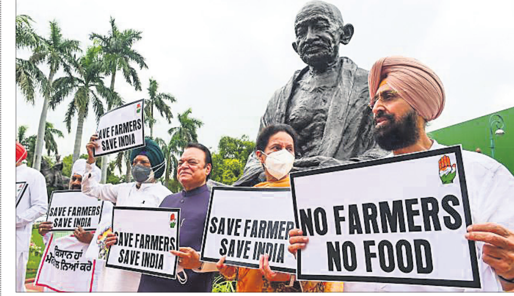
କୃଷି ଆଇନ ଉଲ୍ଲେଖ କରିବେ କଂଗ୍ରେସ ଏମ୍ପିମାନେ ପାର୍ଲିମେଣ୍ଟ ଆଗରେ ବିକ୍ଷୋଭ କରୁଛନ୍ତି।