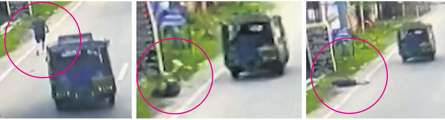
ଧାନବାଦ ଜିଲ୍ଲା ଅତିରିକ୍ତ ବିଚାରପତି ଉତ୍ତମ ଆନନ୍ଦଙ୍କୁ ଅଟୋରୁ ମଡ଼ାଇ ହତ୍ୟା କରାଯାଇଥିବା ବେଳର ଦୁର୍ଘଟଣା ସିଦ୍ଧିଚିତ୍ରି ପୁରୋକ୍ତରେ କଏବ ହୋଇଛି।