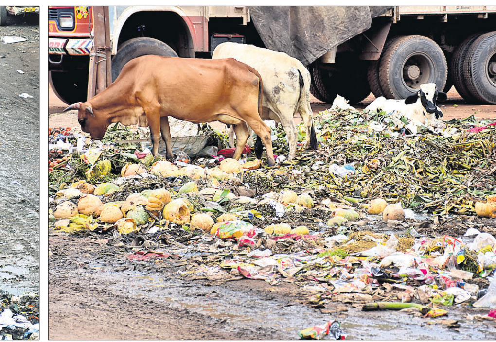
ତେଜୁର ଆମନ୍ତ୍ରଣ: ସତ୍ୟନଗର ଉତ୍ତରବିକ୍ରମ ଓ ମୁନି-୧ ମାର୍କେଟ ଅଞ୍ଚଳରେ ଅତିଆ ଗବା। ବର୍ଷା ପାଣି ସହ ପଚାଶଟା ଆବର୍ଜନା ରାସ୍ତାରେ କମି ରହିଛି।