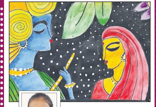
ପ୍ରତିଲିପି ପୁସ୍ତକ କ୍ଲାସ-୪, କେ. ଭି. ଆଇଏନ୍ଏସ୍, ଚିଲିକା