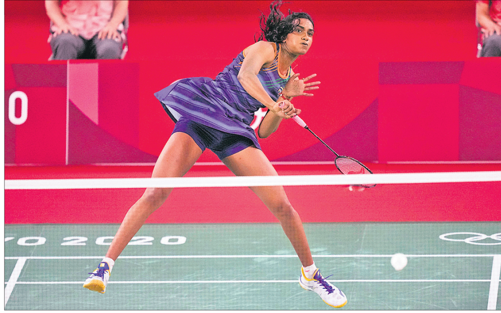
ଶୁକ୍ରବାର କ୍ୱାର୍ଟର ଫାଇନାଲ ମ୍ୟାଚ୍ ଅବସରରେ ପି.ଭି. ସିନ୍ଧୁ।

ଟୋକିଓ, ୩୦।୭ ଭାରତୀୟ ମହିଳା ବ୍ୟାଡମିଣ୍ଟନ ପ୍ରତିଯୋଗିତାରେ ସିନ୍ଧୁ ଅଲିମ୍ପିକ୍ସ ସେମିଫାଇନାଲରେ ପ୍ରବେଶ କରିଛନ୍ତି। ମହିଳା ସିଙ୍ଗଲ୍ ଲଭେଷ୍ଟର କ୍ୱାର୍ଟର ଫାଇନାଲରେ ସେ ଶୁକ୍ରବାର ବିଶ୍ୱର ୫ ନମ୍ବର ଖେଳାଳି ଜାପାନର ଅକାନେ ଯାମାଗୁଚିଙ୍କୁ ସିଧାସଳଖ ଗେମ୍ରେ ହରାଇ ସେମିଫିନାଲ ଉଠିଛନ୍ତି। ୨୦୧୬ ରିଓ ଅଲିମ୍ପିକ୍ସରେ ରୌପ୍ୟ ପଦକ ହାସଲ କରିଥିବା ସିନ୍ଧୁ ଯାମାଗୁଚିଙ୍କୁ ୨୧-୧୩, ୨୨-୨୦ରେ ମାତ୍ର ୫୬ ମିନିଟ୍ରେ ପରାସ୍ତ କରି ପଦକ ଆଡ଼କୁ ଅଗ୍ରଗତି କରିଛନ୍ତି। ଫାଇନାଲରେ ଅଲିମ୍ପିକ୍ ପଦକ ହାସଲଠାରୁ ସିନ୍ଧୁ ଆଉ ଗୋଟିଏ ପାଦ ଦୂରରେ ରହିଛନ୍ତି। ଏଥର ତାଙ୍କ ପାଖରେ ସ୍ୱର୍ଣ୍ଣ ପଦକ ହାସଲ କରିବାର ସୁଯୋଗ ରହିଛି। ସିନ୍ଧୁ ଏବେ ସେମିଫିନାଲ ଖେଳାଳୀଙ୍କ ଲାଇନରେ ଉପସ୍ଥାନ କରି ଯିବାକୁ ମଧ୍ୟରେ ଖେଳାଳିଙ୍କୁ ଥିବା କ୍ୱାର୍ଟର ଫାଇନାଲ ବିଜୟିନୀଙ୍କୁ ଭେଟିବେ। ଶନିବାର ରାତି ସେମିଫାଇନାଲ ମୁକାବିଲାରେ ଅବତୀର୍ଣ୍ଣ ହେବେ। ଷଷ୍ଠ ସିଦ୍ଧି ପୂର୍ବରୁ ଯାମାଗୁଚିଙ୍କୁ ୧୧୧୧ ପରାସ୍ତ କରିଥିବା ବେଳେ