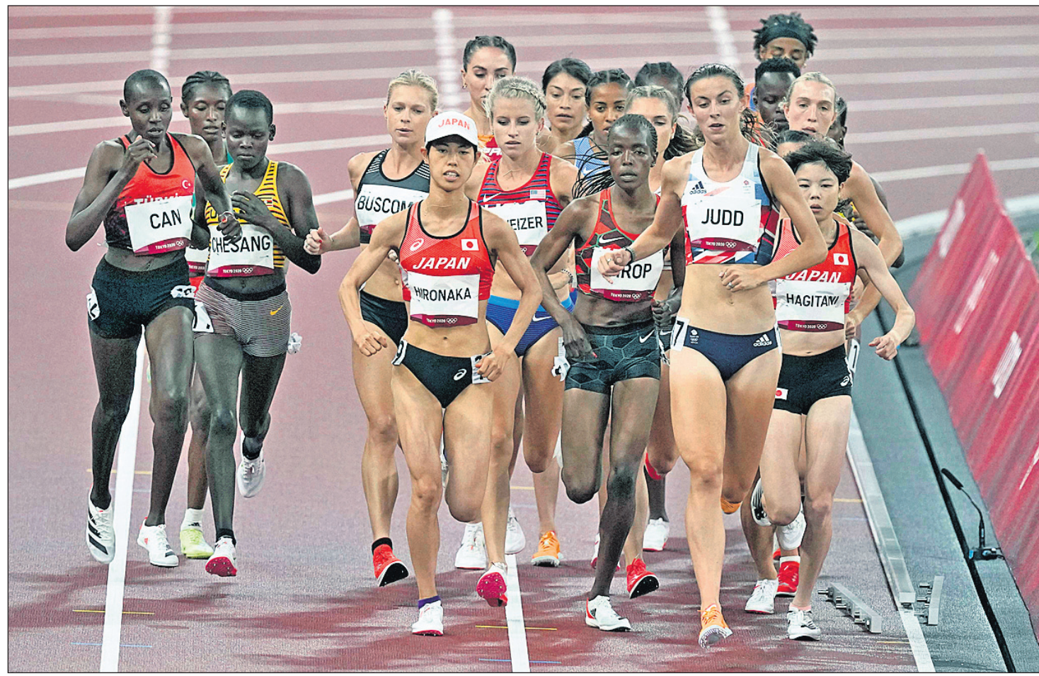
ଟୋକିଓ ଅଲିମ୍ପିକ୍ସର ଶୁକ୍ରବାର ଅନୁଷ୍ଠିତ ମହିଳା ୫୦୦୦ ମିଟର ରେସ୍ ଏକ ହିଟ୍ ଅବସରରେ ପ୍ରତିଯୋଗୀମାନେ ।