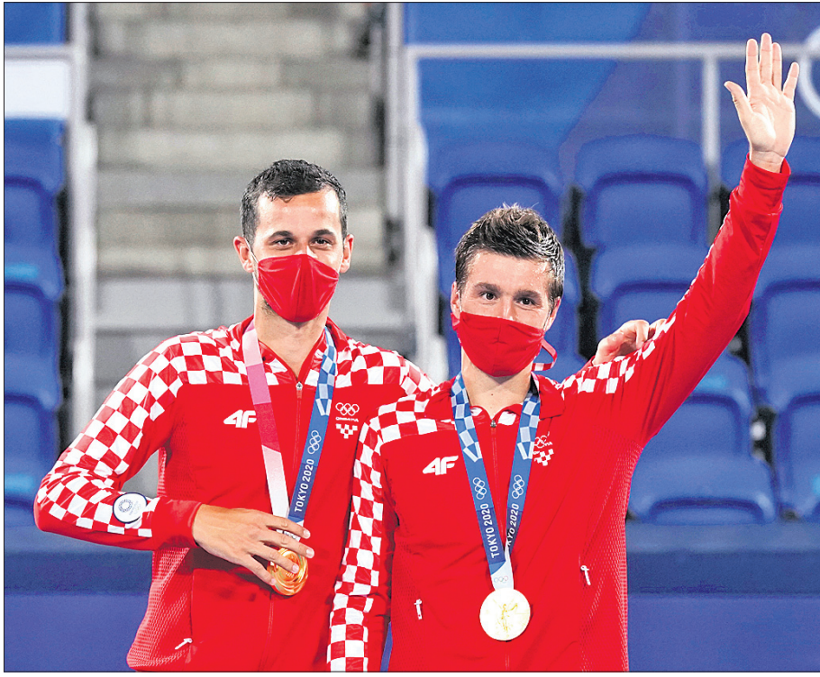
ଗୋଲ୍‌ଓ ଅଲିମ୍ପିକ୍ ପୁରୁଷ ଡବଲ୍ ଟେନିସ୍ ସର୍ବ୍ ପଦକ ବିଜୟୀ କ୍ରୋଏସିଆର ମେଡ୍ ପାଭିକ୍ (ବାମ) ଓ ନିକୋଲା ମେକଟିକ୍।