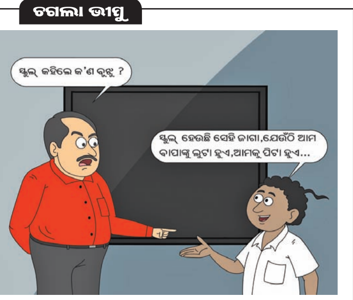
ଶୁଲ କହିଲେ କ'ଣ କୁହୁ ? ଶୁଲ ହେଉଛି ସେହି ଜାଗା, ସେଇଠି ଆମ ବାପାଙ୍କୁ କୁଟା ହୁଏ, ଆମକୁ ପିଟା ହୁଏ...