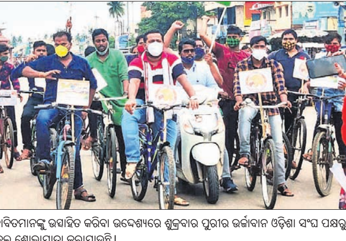
ଅଲିମ୍ପିକ୍ସରେ ଭାଗ ନେଇଥିବା ଭାରତୀୟ ଜୁଡ଼ୋ ବିତମାନଙ୍କୁ ଉଦ୍‌ଘାଟନ କରିବା ଉଦ୍ଦେଶ୍ୟରେ ଶୁକ୍ରବାର ପୁରୀର ଉର୍ଦ୍ଧାବାନ ଓଡ଼ିଶା ସଂଘ ପକ୍ଷରୁ ଗ୍ରାମଦିଗଠାରୁ ଗୁଣ୍ଡିଚା ମନ୍ଦିର ପର୍ଯ୍ୟନ୍ତ ସାଲକେଲ ଶୋଭାଯାତ୍ରା କରାଯାଇଛି।

ଭୁବନେଶ୍ୱର, ୩୦।୭ (ବ୍ୟୁରୋ) ଓଡ଼ିଶା ପୋଲିସର ୧୦ଜଣ ଅତିରିକ୍ତ ଏସ୍ପି ଓ ୭ଜଣ ଡିଏସ୍ପିଙ୍କୁ ବଦଳି କରାଯାଇ ନୂଆ ନିଯୁକ୍ତି ଦିଆଯାଇଛି। ଶୁକ୍ରବାର ଏନେଇ ପୋଲିସ ମୁଖ୍ୟାଳୟରୁ ବିଜ୍ଞପ୍ତି ପ୍ରକାଶ ପାଇଛି।