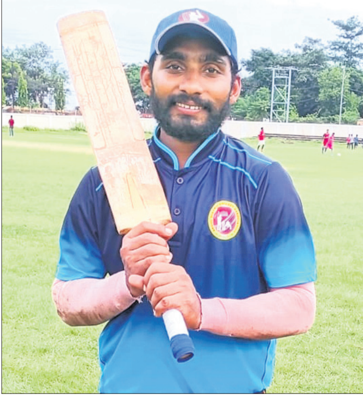
ଶତକ ହାସଲକାରୀ ରାଜ୍ୟର ଗୋଲ୍‌ହାଣ୍ଡି।

କଳାହାଣ୍ଡି କପ୍ କ୍ରିକେଟ ଇକୋର୍ସ, କଟକ-ବି, ଭୁବନେଶ୍ଵର-ଏ, ବାଲେଶ୍ଵର, ଖୋର୍ଦ୍ଧା ବିଜୟ।