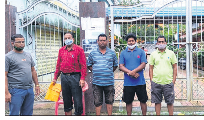
ପୌରପାଳିକା ଅଫିସ୍ ଫାଟକ ସମ୍ମୁଖରେ ଲୋକେ ପ୍ରତିବାଦ କରୁଛନ୍ତି।

ଲଗାଣ ବର୍ଷା ଯୋଗୁ କେନ୍ଦୁଝର ସହରରେ କୃତ୍ରିମ ବନ୍ୟା ସୃଷ୍ଟି ହୋଇଛି। ଲୋକଙ୍କ ଘରେ ବର୍ଷା ପାଣି ଜମି ରହିଛି। ଏହାର ପ୍ରତିବାଦରେ ସହରବାସୀ ଶୁକ୍ରବାର କେନ୍ଦୁଝରଗଡ଼ ପୌରପାଳିକା କାର୍ଯ୍ୟାଳୟ ମୁଖ୍ୟ ଫାଟକରେ ତାଲିକା ପକାଇ ଦେଇଥିଲେ। ମଦନମୋହନ କର ଗଳିରେ ବସବାସ କରୁଥିବା ଲୋକେ ପୂର୍ବରୁ ଏହି ସମସ୍ୟା ଆକର୍ଷଣ କରିଥିଲେ। ମାତ୍ର ଏଥିରେ ସୁଫଳ ନ ମିଳିବାରୁ ଶୁକ୍ରବାର ପୂର୍ବାହ୍ନରେ ସମସ୍ତେ କାର୍ଯ୍ୟ ବନ୍ଦ କରି ଧାରଣାରେ ବସିଛନ୍ତି। ଦାବି ପୂରଣ ନ ହେଲେ ଆଗାମୀ ଦିନରେ ମେଡିକାଲ କଲେଜ ଓ ହସ୍ପିଟାଲକୁ ଅଟକି କରାଯିବ ବୋଲି ଚେତାବନୀ ସେମାନେ ଦେଇଛନ୍ତି।