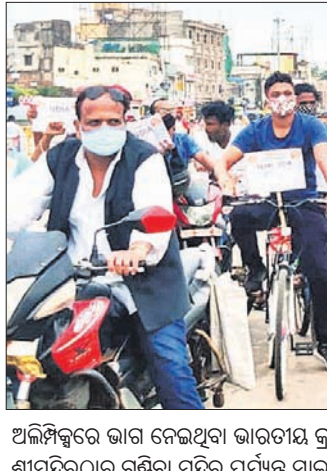
ଅଲିମ୍ପିକ୍ସରେ ଭାଗ ନେଇଥିବା ଭାରତୀୟ ଜୁଡ଼ୋ ବିତମାନଙ୍କୁ ଉଦ୍‌ଘାଟନ କରିବା ଉଦ୍ଦେଶ୍ୟରେ ଶୁକ୍ରବାର ପୁରୀର ଉର୍ଦ୍ଧାବାନ ଓଡ଼ିଶା ସଂଘ ପକ୍ଷରୁ ଗ୍ରାମଦିଗଠାରୁ ଗୁଣ୍ଡିଚା ମନ୍ଦିର ପର୍ଯ୍ୟନ୍ତ ସାଲକେଲ ଶୋଭାଯାତ୍ରା କରାଯାଇଛି।