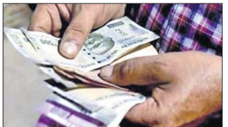
କେନ୍ଦ୍ରରେ ମଧ୍ୟ ଏହାର ମୂଲ୍ୟ ୧୨୭.୮ ପଏଣ୍ଟରେ ରହିଥିଲା। ବର୍ତ୍ତମାନ ଏହା ୧.୨ ପଏଣ୍ଟ ବୃଦ୍ଧି କରୁଛି।

ଦେଶର ଶିଳ୍ପ ଶ୍ରମିକଙ୍କ ପାଇଁ ସର୍ବଭାରତୀୟ ଖାଉଟି ମୂଲ୍ୟପୂର୍ତ୍ତୀ ଏକ ନିକଟରେ ପ୍ରକାଶ ପାଇଛି। ଉକ୍ତ ପୂର୍ତ୍ତୀ ଅନୁସାରେ ୨୦୨୧ ମେରେ ଏହାର ମୂଲ୍ୟ ୧୨୦.୬ ପଏଣ୍ଟ ରହିଥିଲା, ଯାହା ୨୦୨୧ ଜୁନରେ ୧.୧ ପଏଣ୍ଟ ବୃଦ୍ଧି ୧୨୧.୭ ପଏଣ୍ଟରେ ପହଞ୍ଚିଛି।