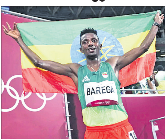
ଇଥିଓପିଆର ସେଲେମନ ବାରେଗା।

ଟୋକିଓ, ୩୦।୭ (ଏପି): ଟୋକିଓ ଅଲିମ୍ପିକ୍ସର ଟ୍ରାକ୍ ଆଣ୍ଡ ଫିଲ୍ଡ ଲଭେଷ୍ଟରେ ପ୍ରଥମ ସ୍ୱର୍ଣ୍ଣ ପଦକ ହାସଲ କରିଛନ୍ତି ଇଥିଓପିଆର ସେଲେମନ ବାରେଗା। ପୁରୁଷ ୧୦,୦୦୦ ମିଟର ରେସ୍ରେ ୨୭ ମିନିଟ୍ ୪୩.୨୨ ସେକେଣ୍ଡ ସମୟ ନେଇ ସେ ସ୍ୱର୍ଣ୍ଣ ପଦକ ହାସଲ କରିଛନ୍ତି। କେବଳ ସେତିକି ନୁହେଁ ବିଶ୍ୱ ଚାମ୍ପିୟନ ଏବଂ ବିଶ୍ୱ ରେକର୍ଡଧାରୀ ଉଗାଷ୍ଟାର ମିଟର ରେସ୍ରେ ୨୭ ମିନିଟ୍ ୪୩.୨୨ ସେକେଣ୍ଡ ସମୟ ନେଇ ସେ ସ୍ୱର୍ଣ୍ଣ ପଦକ ହାସଲ କରିଛନ୍ତି। କେବଳ ସେତିକି ନୁହେଁ ବିଶ୍ୱ ଚାମ୍ପିୟନ ଏବଂ ବିଶ୍ୱ ରେକର୍ଡଧାରୀ ଉଗାଷ୍ଟାର ମିଟର ମେଡାଲି ଲଭେଷ୍ଟ ଥିଲା।