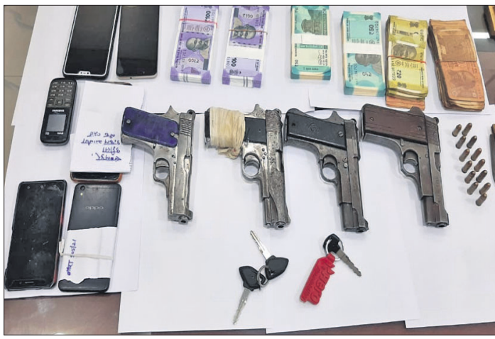
କିରୋଇସ୍ଥିତ ଉତ୍କଳ ଗ୍ରାମ୍ୟବ୍ୟାଙ୍କରୁ ଡକ୍ଟର ଡକ୍ଟର ୪ ଅଭିଯୁକ୍ତ ଓ ଜବତ ସାମଗ୍ରୀ।