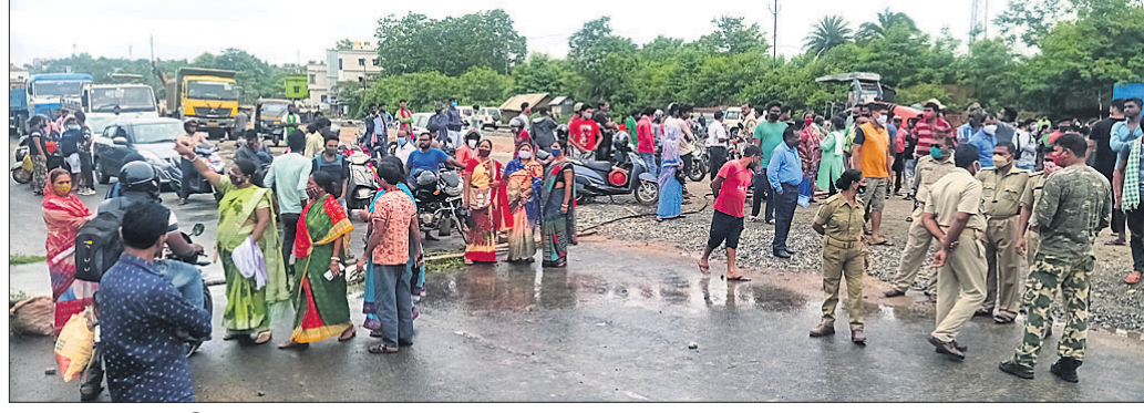
ରାସ୍ତାରୋକ୍ଵେରେ ସାମିଲ ହୋଇଥିବା ଅଞ୍ଚଳବାସୀ।

ବାରିପଦା ଅଫିସ୍, ୩୦।୭: ମୟୂରଭଞ୍ଜ ଜିଲ୍ଲା ବାରିପଦା ଟାଉନ ଥାନା ବେଳ ଯାଇଥିବା ୧୮୩୦.୫୫ ଟଙ୍କା ଉପରେ ଦାମଦୋରପୁର ଓ ଛକରେ ଗଳାପୋଲ ନିର୍ମାଣ ଦାବିରେ ସ୍ଥାନୀୟ ଲୋକେ ଶୁକ୍ରବାର ରାସ୍ତା ଅବରୋଧ କରିଥିଲେ। ଅଞ୍ଚଳର ଶତାଧିକ ମହିଳାପୁରୁଷ ଏକତ୍ରିତ ହୋଇ ପୂର୍ବାହ୍ନ ୯ଟାରୁ ମଧ୍ୟାହ୍ନ ୧୨ଟା ପର୍ଯ୍ୟନ୍ତ ବିରୋଧ ପ୍ରଦର୍ଶନ କରିଥିଲେ। ବାରମ୍ବାର ଦାବି ସତ୍ତ୍ୱେ ଜିଲ୍ଲା ପ୍ରଶାସନ କିମ୍ବା ଜାତୀୟ ରାଜପଥର ପ୍ରକଳ୍ପ ନିର୍ଦ୍ଦେଶକଙ୍କ ପକ୍ଷରୁ ସମସ୍ୟା