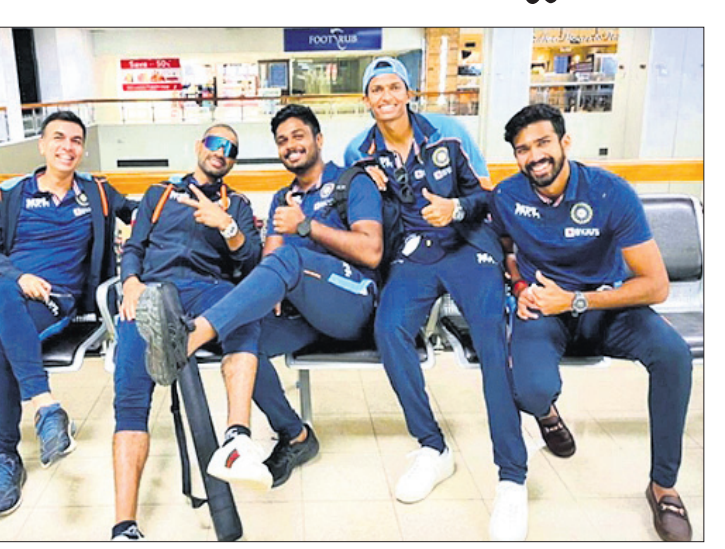
ସ୍ଵେଚ୍ଛା ପ୍ରତ୍ୟାବର୍ତ୍ତନ ଅବସରରେ ଭାରତୀୟ ଖେଳାଳି।

କଲମ୍‌ସୋ, ୩୦.୭ (ପି.ଟି.): ଶିଖର ଧାଓନଙ୍କ ନେତୃତ୍ଵାଧୀନ ଭାରତୀୟ ସାମିତ ଓଭର ଦଳ ଶୁକ୍ରବାର ସଞ୍ଚାୟରେ ବେଙ୍ଗାଲୁରୁରେ ପହଞ୍ଚିଛି। କୋଭିଡ୍ ଚେଷ୍ଟାରେ ପଞ୍ଚିତ ଯୋଗୁଁ କ୍ରୀଡ଼ା ଗୋଥାମ, ଯୁଜବେନ୍ଦ୍ର ଚହଲ ଓ ଜୁନାଲ ପାଣ୍ଡା ପ୍ରମୁଖ ଆସିନାହାନ୍ତି। ଗୁଜୁରାଟ ଅନୁଷ୍ଠିତ ତୃତୀୟ ତଥା ଅନ୍ତିମ ଅନ୍ତର୍ଜାତୀୟ ଚି୨୦ ମ୍ୟାଚ୍‌ରେ ଖ୍ରୀଲଙ୍କା ୬ ଉତ୍କଳେଟରେ ଭାରତକୁ ପରାସ୍ତ କରି ୩ ମ୍ୟାଚ୍ ବିଶିଷ୍ଟ ସିରିଜ୍ ୨-୧ରେ ବିଜୟ ହାସଲ କରିଛି। ଏହି ମ୍ୟାଚ୍‌ରେ ପ୍ରଥମେ ବ୍ୟାଟିଂ କରିଥିବା ଭାରତ ନିର୍ଦ୍ଧାରିତ ଓଭରରେ ୮