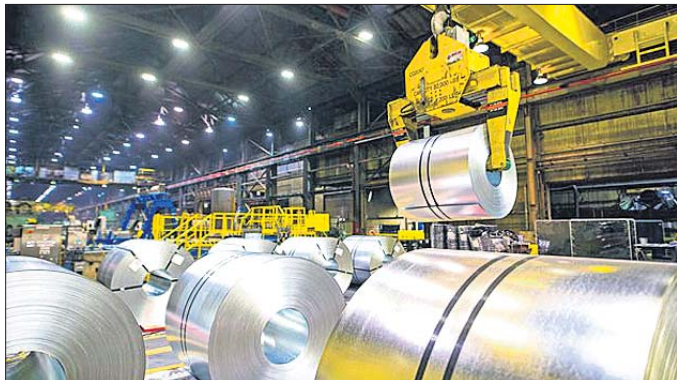
ଲକ୍ଷ୍ମୀ, ସିଂହପୁର ଏବଂ ବିନ୍ଦୁପୁର ରହିଥିବା ଜଣାପଡ଼ିଛି।

କୋର ସେକ୍ଟରରେ ଅଭିବୃଦ୍ଧି ହେଉଛି ୮.୯% ରହିଛି। ଗତବର୍ଷ କରୋନା ଯୋଗୁ ବଜାର ପ୍ରଭାବିତ ହୋଇଥିବା ବେଳେ ଉତ୍ପାଦନ ପ୍ରଭାବିତ ହୋଇଥିଲା। ଲୋ ବେସ୍ ଇଫୋର୍ସ ଯୋଗୁ ଚଳିତ ବର୍ଷ ଅଭିବୃଦ୍ଧି ହେଉଥିବା କୁହାଯାଉଛି।