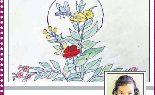
ପଦ୍ମାବତୀ ଶବର କ୍ଲାସ-୬, ସରକାରୀ ପ୍ର ଉପା ବିଦ୍ୟାଳୟ, ଶୁକ୍ଳପୁଣ୍ଡି, ଦୁଆପଡ଼ା