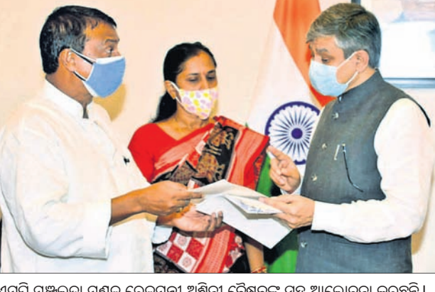
ଏମ୍ପି ମଞ୍ଜୁଲତା ମହାନ୍ତି ରେଳ ଡିଭିଜନ ଅଧିକାରୀଙ୍କ ସହ ଆଲୋଚନା କରୁଛନ୍ତି।