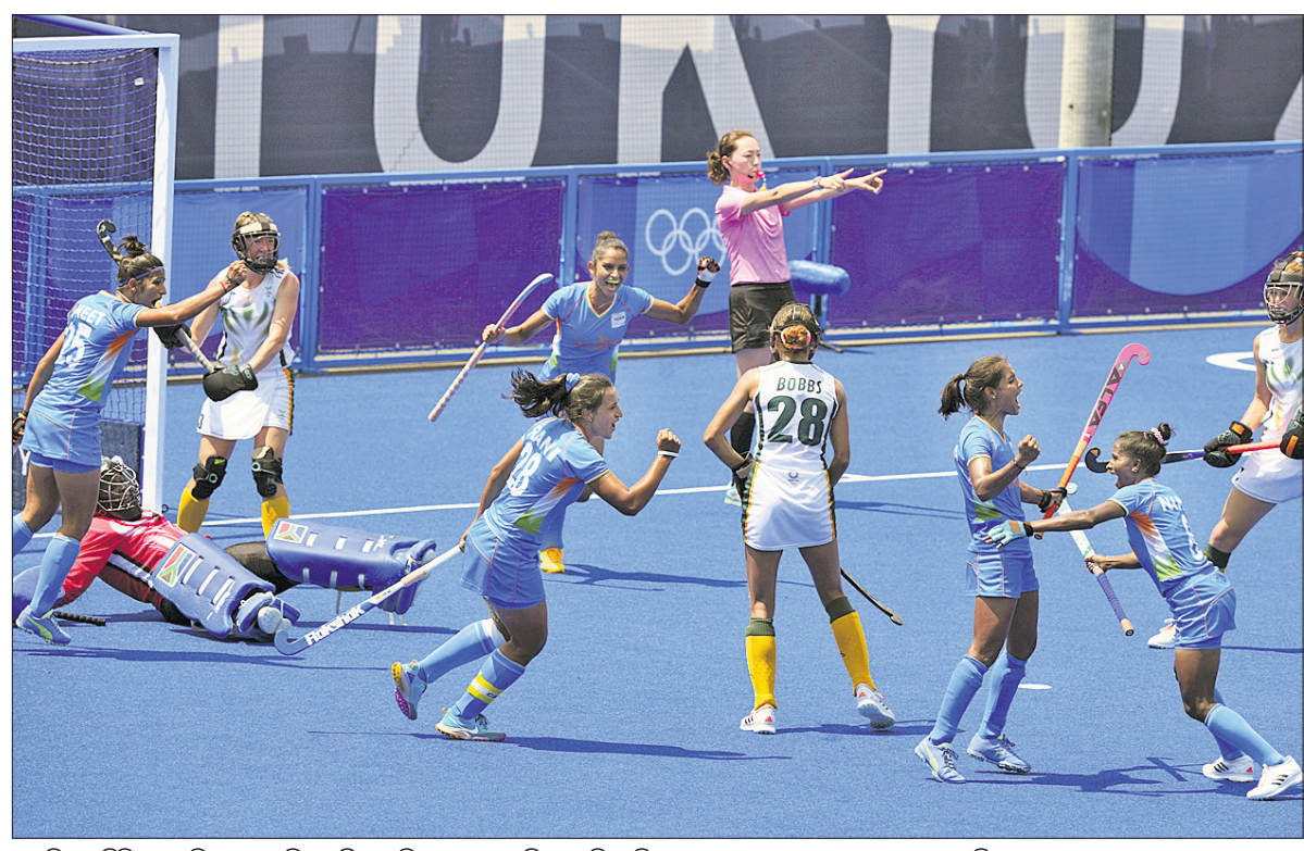
ଗୋଳିଓ ଅଲିମ୍ପିକ୍ସର ଶନିବାର ଅନୁଷ୍ଠିତ ମହିଳା ହକି ମ୍ୟାଚରେ ଦକ୍ଷିଣ ଆଫ୍ରିକା ବିପକ୍ଷରେ ଏକ ଗୋଲ ଷ୍ଟୋର ପରେ ଉଲ୍ଲସିତ ଭାରତୀୟ ଦଳ।