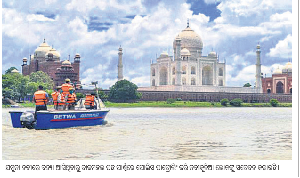
ସମୁଦ୍ର ନଦୀରେ ବନ୍ୟା ଆସିଥିବାରୁ ଚାକମହଲ ସହ ପାର୍ଶ୍ୱରେ ପୋଲିସ ପାଟ୍ରୋଲିଂ କରି ନଦୀକୁଲିଆ ଲୋକଙ୍କୁ ସତରତ କରାଯାଇଛି।