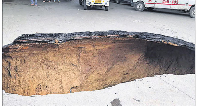
ଦିଲ୍ଲୀର ଆଇଆଇଟି ପ୍ଲାଏଓଭର ତଳ ରାସ୍ତାରେ ଦୃଷ୍ଟି ହୋଇଥିବା ଖାତ।

ଦୃଷ୍ଟି ହୋଇଥିଲା। ପରେ ସେହି ରାସ୍ତା ଦେଇ ଗ୍ରାମିକ ପୋଲିସ ଚକାଚକ ବନ୍ଦ କରାଯାଇଥିଲା। ଏହାର କାରଣ ଜଣାପଡ଼ିନାହିଁ। ଦିଲ୍ଲୀ ଜଳ ବୋର୍ଡ଼ ସହ ଏହାକୁ ଶେଷରେ ଲାଇଭ୍‌ରେ ଫାଟ ଯୋଗୁ ଏପରି ହୋଇଥିବା ସନ୍ଦେହ କରାଯାଇଛି।