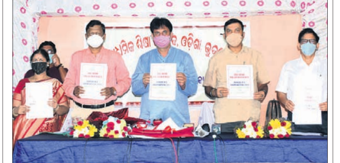
ଉଚ୍ଚ ମାଧ୍ୟମିକ ଶିକ୍ଷା ପରିଷଦ କାର୍ଯ୍ୟାଳୟରେ ଶନିବାର ସନ୍ଧ୍ୟାରେ ଗଣଶିକ୍ଷା ମନ୍ତ୍ରୀ ସମୀର ରଞ୍ଜନ ଦାଶ ମୁକ୍ତ ୨ ବିଜ୍ଞାନ ଓ ବାଣିଜ୍ୟ ପରୀକ୍ଷା ପ୍ରକାଶ କରୁଛନ୍ତି ।