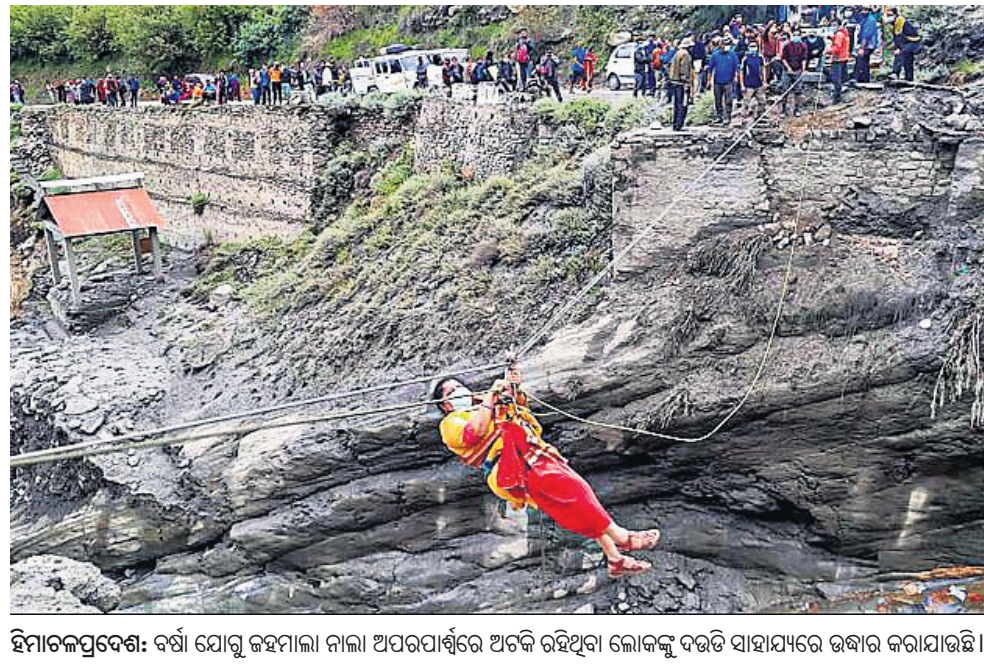
ହିମାଚଳପ୍ରଦେଶ: ବର୍ଷା ଯୋଗୁ କହମାଳା ନାଲା ଅପରପାର୍ଶ୍ୱରେ ଅଟକି ରହିଥିବା ଲୋକଙ୍କୁ ବଢ଼ି ସାହାଯ୍ୟରେ ଉଦ୍ଧାର କରାଯାଇଛି।

ପୋଲିସ ପ୍ରଶାସନର ପ୍ରତ୍ୟେକ କାର୍ଯ୍ୟରେ 'ଦେଶ ପ୍ରଥମେ, ସର୍ବଦା ପ୍ରଥମେ' ଭାବନା ପ୍ରତିଫଳିତ ହେବା ଉଚିତ। ଲୋକମାନଙ୍କ ମଧ୍ୟରେ ପୋଲିସ ପ୍ରତି ଥିବା ଡର ତଥା ନିକାରାତ୍ମକ ଧାରଣା ହଟାଇବା ପାଇଁ ସେମାନେ କାର୍ଯ୍ୟ କରିବା ଆବଶ୍ୟକ ବୋଲି ପ୍ରଧାନମନ୍ତ୍ରୀ ନରେନ୍ଦ୍ର ମୋଦି ଶନିବାର ନବନିଯୁକ୍ତ ଭାରତୀୟ ପୋଲିସ ସେବା (ଆଇପିଏସ୍) ଅଧିକାରୀଙ୍କୁ ସମ୍ବୋଧନ କରି କହିଛନ୍ତି। ସର୍କାର ବଳଭାଜି ପଡ଼େଲ କାତୀୟ ପୋଲିସ ଏକାଡେମୀରେ ଭିତ୍ତି ଉପରେ କର୍ମଚାରୀଙ୍କୁ ଉପାଦେଇ ଆଇପିଏସ୍ ଟ୍ରେନିଙ୍ଗ୍ ସହ ଆଲୋଚନା କରି ପ୍ରଧାନମନ୍ତ୍ରୀ କହିଛନ୍ତି, 'ଏକ ଭାରତ, ଶ୍ରେଷ୍ଠ ଭାରତ'ର ପତାକା ବହନ କରୁଥିବାରୁ ସେମାନଙ୍କ ପ୍ରତ୍ୟେକ କାର୍ଯ୍ୟ କାତୀୟ ସ୍ୱାର୍ଥ ଏବଂ ଦୃଷ୍ଟିକୋଣ ଦ୍ୱାରା ପରିଚାଳିତ ହେବା କରୁଣା। ପୋଲିସ ପ୍ରତି ଲୋକଙ୍କ ମନରେ ଥିବା ନିକାରାତ୍ମକ ଧାରଣା ହଟାଇବା ଏକ ବଡ଼ ଚ୍ୟାଲେଞ୍ଜ। କରୋନା ମହାମାରୀବେଳେ କନ୍ୟାଧାରଣାକ ପ୍ରତି ପୋଲିସର ସେବା ଦେଖି ଏହା ଧାରଣା କିଛି ମାତ୍ରାରେ ହ୍ରାସିଥିଲା। କିନ୍ତୁ ଏବେ ପୁଣି ପୁରୁଣା ଛିତି ଫେରିଥିବା ସେ ପ୍ରକାଶ କରିଥିଲେ। ଏହି ଅବସରରେ କାତୀୟ ବିପର୍ଯ୍ୟୟ ମୁକାବିଲା ବଳ(ଏନଡିଆର୍ଏସ୍)ର ୭୫ ବର୍ଷ ଧରି ଭାରତ ଉନ୍ନତ ପୋଲିସ ଦେବା ଏବଂ ପୋଲିସ ଟ୍ରେନିଂ ଭିତ୍ତିପୂର୍ଣ୍ଣ ବିଆର୍‌ପିଏସ୍ ଯବାନ ରହିଛି ଓ ଏହି କିଛି ବର୍ଷ ମଧ୍ୟରେ ଏଥିରେ ବେଶ୍ ପରିବର୍ତ୍ତନ ଆସିଥିବା ପ୍ରଧାନମନ୍ତ୍ରୀ କହିଥିଲେ।