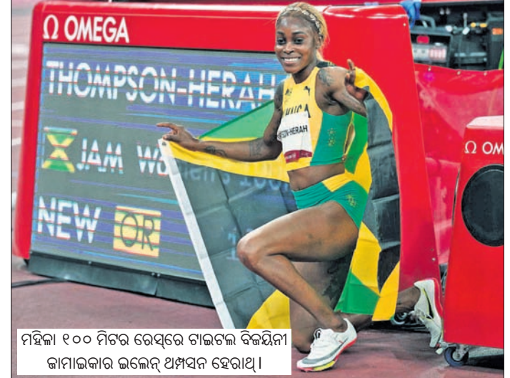
ମହିଳା ୧୦୦ ମିଟର ରେସ୍‌ରେ ଚାଇନିଜ ବିଜୟିନୀ ଜାମାଲିଆର ଇଲେନ୍ ଅମ୍ପସନ ହେବାକୁ।

ଟୋକିଓ, ୩୧।୭ (ଏପି): ଜାମାଲିଆର ଇଲେନ୍ ଅମ୍ପସନ ହେବାକୁ ଅଲିମ୍ପିକ୍ସ ମହିଳା ୧୦୦ ମିଟର ରେସ୍‌ରେ ସ୍ୱର୍ଣ୍ଣ ପଦକ ହାସଲ କରିଛନ୍ତି। ସେ ପୂର୍ବରୁ ୧୦.୬୧ ସେକେଣ୍ଡରେ ଅତିକ୍ରମ କରିଥିଲେ। ଏହାଦ୍ୱାରା ସେ ମହିଳା ୧୦୦ ମିଟରରେ ଫ୍ଲୋରାସ୍ ଗ୍ରୀଟ୍‌ସ୍‌ଙ୍କ ୩୩ ବର୍ଷର ପୁରୁଣା ରେକର୍ଡକୁ ଭଙ୍ଗ କରିଦେଇଛନ୍ତି। ଗ୍ରୀଟ୍‌ସ୍‌ଙ୍କ ଗୋପନ ୧୯୮୮ ସିଓଲ ଅଲିମ୍ପିକ୍ସରେ ୧୦.୬୨ସେକେଣ୍ଡ ଗାଲ୍‌ମିଂ ସହ ରେକର୍ଡ ପ୍ରତିଷ୍ଠା କରିଥିଲେ। ଅମ୍ପସନ ତାଙ୍କ ନିକଟତମ ପ୍ରତିଦ୍ୱନ୍ଦ୍ୱୀ ଶେଲି ଆନ୍ ଫ୍ରେଜର୍-ପ୍ରାଇସ୍‌କୁ ୧.୧୩ ସେକେଣ୍ଡରେ ପଛରେ ପକାଇ ଦେଇଥିଲେ। ଶେରିକା କ୍ୟାକସନ ୧୦.୬୬ ସେକେଣ୍ଡ ଗାଲ୍‌ମିଂରେ ବ୍ରୋଞ୍ଜ ଜିତିଥିଲେ। ଆଗକୁ ୨୦୦ ମିଟରରେ ଫ୍ରେଜର୍ ପ୍ରାଇସ୍ ଓ ଅମ୍ପସନ ହେବାକୁ ମଧ୍ୟରେ ପୁଣି ମୁକାବିଲା ହେବ। ଅମ୍ପସନ ହେଉଛନ୍ତି ଏହି ଇଭେଣ୍ଟର ଗତପରର ଚାମ୍ପିୟନ।