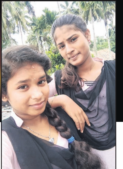
ଲକ୍ଷ୍ମୀପ୍ରସାଦଙ୍କୁ ସହ ଲୋକନିତ