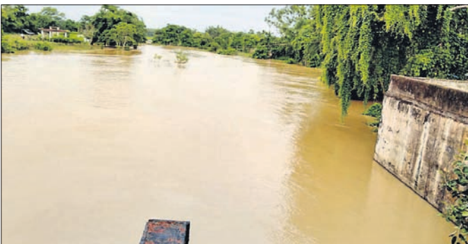
ଜଳକା ନଦୀରେ ପ୍ରସାହିତ ବନ୍ୟାଜଳ ।