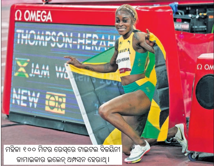
ମହିଳା ୧୦୦ ମିଟର ରେସ୍‌ରେ ଚାଇନିଜ ବିଜୟିନୀ ଜାମାଇକାର ଇଲେନ୍ ଅମ୍ପସନ ହେବାଥି।

ଟୋକିଓ, ୩୧।୭ (ଏପି): ଜାମାଇକାର ଇଲେନ୍ ଅମ୍ପସନ ହେବାଥି ଅଲିମ୍ପିକ୍ସ ମହିଳା ୧୦୦ ମିଟର ବୌଦ୍ଧ ଜିତି ସ୍ୱର୍ଣ୍ଣ ପଦକ ହାସଲ କରିଛନ୍ତି। ସେ ଦୂରତାକୁ ୧୦.୬୧ ସେକେଣ୍ଡରେ ଅତିକ୍ରମ କରିଥିଲେ। ଏହାଦ୍ୱାରା ସେ ମହିଳା ୧୦୦ ମିଟରରେ ଫ୍ଲୋରେନ୍ସ ଗ୍ରିଫିଥ୍‌ସ୍ ୩୩ ବର୍ଷର ପୁରୁଣା ରେକର୍ଡକୁ ଭଙ୍ଗ କରିଦେଇଛନ୍ତି। ଗ୍ରିଫିଥ୍ ଜୋଏନର ୧୯୮୮ ସିଓଲ ଅଲିମ୍ପିକ୍ସରେ ୧୦.୬୨ସେକେଣ୍ଡ ଗାଇମିଂ ସହ ରେକର୍ଡ ପ୍ରତିଷ୍ଠା କରିଥିଲେ। ଅମ୍ପସନ ତାଙ୍କ ନିକଟତମ ପ୍ରତିଦ୍ୱନ୍ଦ୍ୱୀ ଶେଲି ଆନ୍ ଫ୍ରେଜର୍-ପ୍ରାଇସଙ୍କୁ .୧୩ ସେକେଣ୍ଡରେ ପଛରେ ପକାଇ ଦେଇଥିଲେ। ଶେରିକା କ୍ୟାକସନ ୧୦.୭୬ ସେକେଣ୍ଡ ଗାଇମିଂରେ ବ୍ରୋଞ୍ଜ ଜିତିଥିଲେ। ଆଗରୁ ୨୦୦ ମିଟରରେ ଫ୍ରେଜର୍ ପ୍ରାଇସ୍ ଓ ଅମ୍ପସନ ହେବାଥିଙ୍କ ମଧ୍ୟରେ ପୁଣି ମୁକାବିଲା ହେବ। ଅମ୍ପସନ ହେଉଛନ୍ତି ଏହି ଇଭେଣ୍ଟର ଗତଥର ଚାମ୍ପିୟନ।