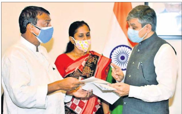
ଏମ୍ପି ମଞ୍ଜୁଲତା ମଞ୍ଜୁଳ ରେଳମନ୍ତ୍ରୀ ଅଶ୍ୱିନୀ ବୈଷ୍ଣବଙ୍କ ସହ ଆଲୋଚନା କରୁଛନ୍ତି।