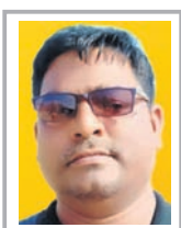
ଡିଲେଗେଟସ୍ ଦାସ, ଖୋର୍ଦ୍ଧା