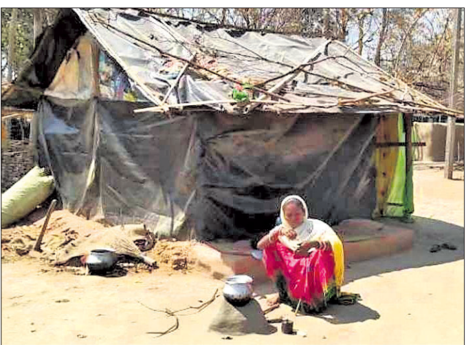
ପଲିଥିନ କୁଡ଼ିଆ ସନ୍ଧ୍ୟାଖରେ ଲିପ୍ତିମୟୀ ।

ରୋଷେଇ କରିବା ପାଇଁ ଖୋଲା ଆକାଶ ତଳେ ବୁଲି କରି ରୋଷେଇ କରିବାକୁ ପଡ଼ୁଛି । ସ୍ୱାମୀ ଯାହା ପଠାଡିଆର ଗାଁରେ ଯେତେବେଳେ ଯାହା ମୂଲ ମରୁଚା କରି ଲିପ୍ତି ତାଙ୍କ ଗୁଜରାଣ ମେଣ୍ଟାନ୍ତି । ତାଙ୍କ ଅସହାୟ ଭାବେ ପଲିଥିନ ଟାଣି କି ଶୀତ କି ବର୍ଷା ଭାଗ୍ୟକୁ ଆଦରି ପଡି ରହିଛନ୍ତି ।