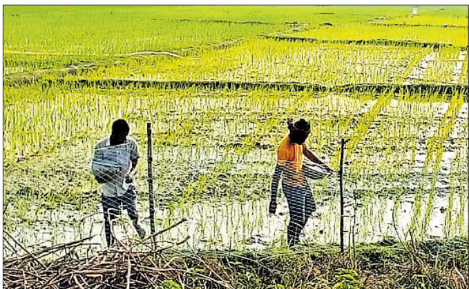
ଚାଷଜମିରେ ଚାଷୀ ସାର ପକାଉଛନ୍ତି।

ଜିଲା କୃଷି ବିଭାଗ ସୂଚନା ମୁତାବକ ଚଳିତବର୍ଷ ଜିଲାରେ ୧ ଲକ୍ଷ ୬୧ ହଜାର ୫ ଶହ ହେକ୍ଟର ଜମିରେ କେବଳ ଖରିଫ ଧାନ ଚାଷ ଲାଗି ଲକ୍ଷ୍ୟ ଧାର୍ଯ୍ୟ ରଖାଯାଇଛି। ବର୍ତ୍ତମାନ ସୁଦ୍ଧା ପ୍ରାୟ ୨୦ ହଜାର ହେକ୍ଟର ଜମିରେ ଚଳିପକା ଏବଂ ରୁଆ ପୋଡ଼ା ଆରମ୍ଭ ହୋଇଯାଇଛି। ତେବେ ଖରିଫ