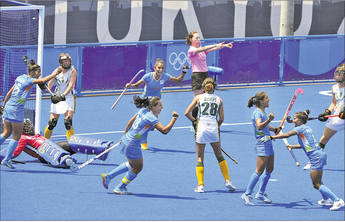
ଟୋକିଓ ଅଲିମ୍ପିକ୍ସର ଶନିବାର ଅନୁଷ୍ଠିତ ମହିଳା ହକି ମ୍ୟାଚରେ ଦକ୍ଷିଣ ଆଫ୍ରିକା ବିପକ୍ଷରେ ଏକ ଗୋଲ ଷ୍ଟୋର ପରେ ଉଲ୍ଲସିତ ଭାରତୀୟ ଦଳ ।