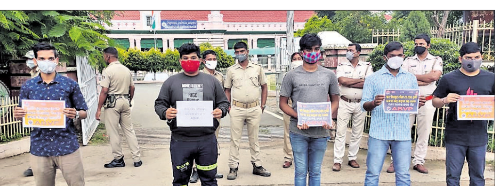
ଏବିଭିପି କର୍ମକର୍ତ୍ତାମାନେ ବିକ୍ଷୋଭ ପ୍ରଦର୍ଶନ କରୁଛନ୍ତି ।