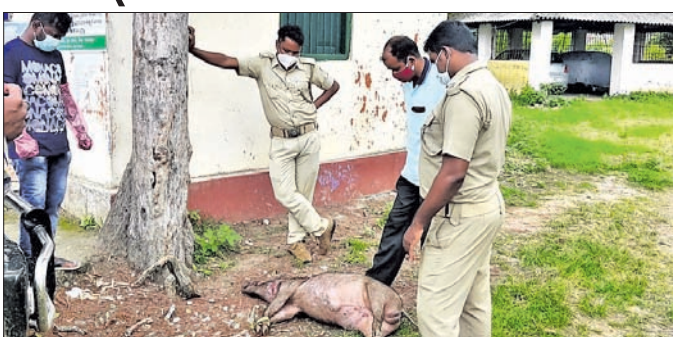
ମୃତ ବାର୍ହାକୁ ବ୍ୟବଚ୍ଛେଦ ପାଇଁ ନିରୀକ୍ଷଣ କରାଯାଉଛି।