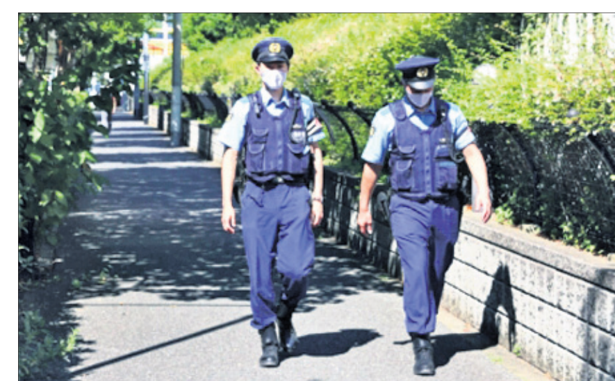
ଆଥଲେଟ୍ ଭିଲେଜରେ ଜାପାନ ପୋଲିସଙ୍କ ପାଗ୍ରୋଲ୍ ।