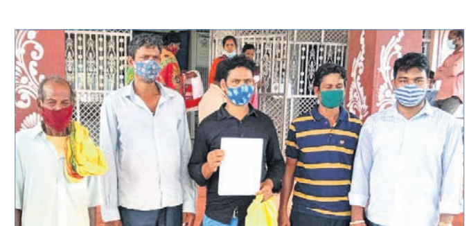
ଜିଲାପାଳଙ୍କୁ ଦାବିପତ୍ର ଦେବାକୁ ଆସିଥିବା ପରବଳ ଗ୍ରାମବାସୀ।

ଗ୍ରାମାଞ୍ଚଳର ବିକାଶ ପାଇଁ ସରକାର କୋଟିକୋଟି ଟଙ୍କା ବ୍ୟୟ କରିଛନ୍ତି। ସରକାରଙ୍କ ପକ୍ଷରୁ ବିଭିନ୍ନ ଯୋଜନାରେ ଆୟୁଥିବା ଅର୍ଥ ସ୍ଥାନୀୟ ଯୁଗରେ ବ୍ୟାପକ ହରିକୁଟି ଚାଲିଛି।