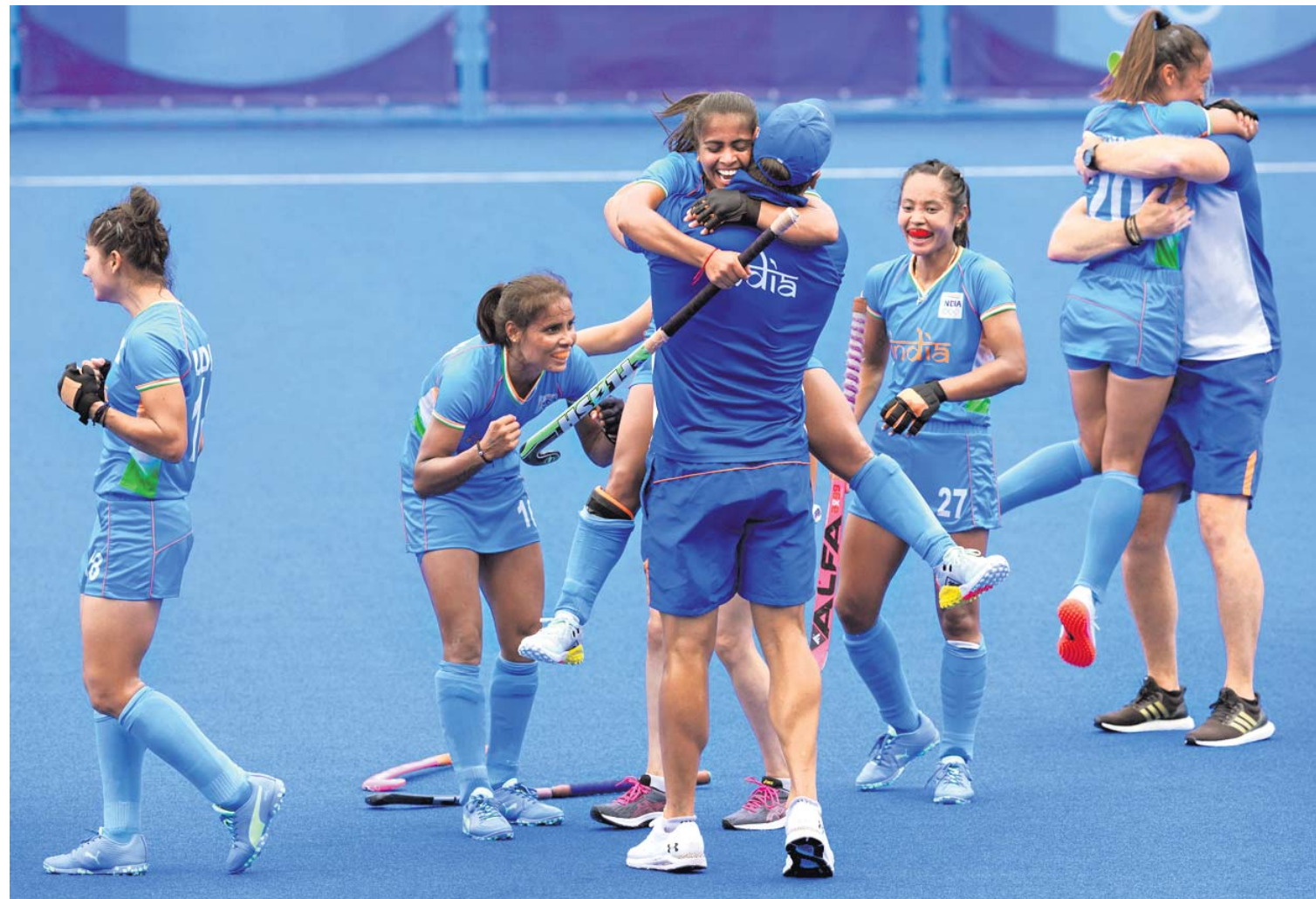
ଟୋକିଓ ଅଲିମ୍ପିକ୍ସର ଯୋଗ୍ୟତା ପ୍ରମାଣ କରିବା ପାଇଁ ଆଜି ମହିଳା ଦଳ ଖେଳିବ।

କ୍ରିକେଟ ଖେଳିବେ ଜାହ୍ନବୀ ବଲିଉଡ ନାୟିକା ଜାହ୍ନବୀ କପୁରଙ୍କୁ ଶରଣ ଶର୍ମାଙ୍କ ଫିଲ୍ମରେ କ୍ରିକେଟର ଭୂମିକାରେ ଦେଖିବାକୁ ମିଳିବ।