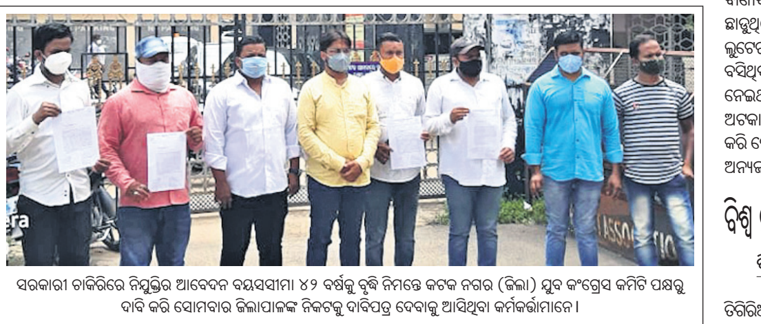
ସରକାରୀ ଚାକିରିରେ ନିଯୁକ୍ତି ଆବେଦନ କରିଥିବା ୫୨ ବର୍ଷରୁ କମ୍ ବୟସ୍କ ନିମନ୍ତେ କଟକ ନଗର (ଜିଲ୍ଲା) ଯୁବ କର୍ମଗ୍ରହଣ କମିଟି ପକ୍ଷରୁ ଦାବି କରି ଯୋଗଦାନ କିଲାପାଳଙ୍କ ନିକଟକୁ ଦାବିପତ୍ର ଦେବାକୁ ଆସିଥିବା କର୍ମଚାରୀମାନେ।

ନିଆଳି, ୨୮ (ଡି.ଏନ୍.ଏ.): ନିର୍ଦ୍ଦେଶ ୫-ଟି ନିର୍ଦ୍ଦେଶକୁ ବିଚିତ୍ର ଉଲ୍ଲଙ୍ଘନ କରିଥିବା ଅଭିଯୋଗ ହୋଇଛି। ନିର୍ଦ୍ଦେଶ ୫-ଟି ନିର୍ଦ୍ଦେଶକୁ ବିଚିତ୍ର ଉଲ୍ଲଙ୍ଘନ କରିଥିବା ଅଭିଯୋଗ ହୋଇଛି।