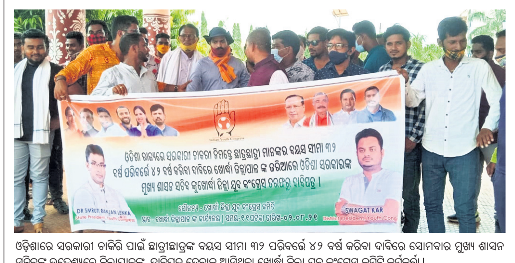
ଓଡ଼ିଶାରେ ସରକାରୀ ଚାକିରି ପାଇଁ ଛାତ୍ରାଭ୍ୟାସ କରୁଥିବା ବୟସ ସୀମା ୩୨ ପରିବର୍ତ୍ତନ କରିବା ଦାବିରେ ସୋମବାର ପୁଖ୍ୟ ଶାସନ ସମିତିର ଉଦ୍ଦେଶ୍ୟରେ ଜିଲାପାଳଙ୍କୁ ଦାବିପତ୍ର ଦେବାକୁ ଆସିଥିବା ଖୋର୍ଦ୍ଧା ଜିଲା ଯୁବ କଂଗ୍ରେସ କମିଟି କର୍ମକର୍ମୀ।

ଦେଲେ ୧୧ଟି ମିଶନ ଶକ୍ତି ଗୃହ ନିର୍ମାଣ ପାଇଁ ଅର୍ଥ ମଞ୍ଜୁର ହୋଇଛି। ଲୁକ ସଦର ମହାକୁମ୍ଭା, ଏନ୍ଏସିଏ ଏବଂ ପୌରାଞ୍ଚଳରେ ମିଶନ ଶକ୍ତି ଭବନ ନିର୍ମାଣ କରାଯିବ।