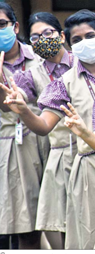
ସିବିଏସ୍ ଦଶମ ଶ୍ରେଣୀ ପରୀକ୍ଷାଫଳ ମଙ୍ଗଳବାର ପ୍ରକାଶ ପାଇବା ପରେ ଖୁସି ମନାଉଛନ୍ତି ଭୁବନେଶ୍ୱରର ବିଜେଇଏମ୍ ସ୍କୁଲ ଛାତ୍ରୀମାନେ।

ଭୁବନେଶ୍ୱର, ୩୮ (ବ୍ୟବହାର) କେନ୍ଦ୍ରୀୟ ମାଧ୍ୟମିକ ଶିକ୍ଷା ବୋର୍ଡ (ସିବିଏସ୍) ଦଶମ ଶ୍ରେଣୀ ପରୀକ୍ଷାଫଳ ମଙ୍ଗଳବାର ପ୍ରକାଶ ପାଇଛି। ଚଳିତବର୍ଷ ରେକର୍ଡ ପାସ୍ ହାର ଅର୍ଥାତ୍ ୯୯.୦୪ ପ୍ରତିଶତ ହୋଇଛି। ୨୦,୯୭,୧୨୮ ଛାତ୍ରଛାତ୍ରୀ ମାତ୍ର ପଞ୍ଜୀକରଣ କରିଥିବାବେଳେ ସେମାନଙ୍କ ମଧ୍ୟରୁ ୨୦,୭୭,୯୯୭ ଜଣ ପାସ୍ କରିଛନ୍ତି। ଛାତ୍ରଙ୍କଠାରୁ ଛାତ୍ରୀଙ୍କ ପାସ୍ ହାର ୦.୩୫ ପ୍ରତିଶତ ଅଧିକ ରହିଛି। ଛାତ୍ରୀଙ୍କ ପାସ୍ ହାର ୯୯.୨୪% ହୋଇଥିବା ବେଳେ ଛାତ୍ରଙ୍କ ପାସ୍ ହାର ୯୮.୮୯%। ୫୭,୮୨୪ ଜଣ ଛାତ୍ରଛାତ୍ରୀ ୯୫%ରୁ ଅଧିକ ନମ୍ବର ରଖିଛନ୍ତି। ସେହିପରି ୨,୦୦,୯୨୨ ଛାତ୍ରଛାତ୍ରୀ ୯୦ରୁ୯୫ ପ୍ରତିଶତ ନମ୍ବର ନମ୍ବର ରଖିଛନ୍ତି। ତେବେ କେନ୍ଦ୍ରୀୟ ବିଦ୍ୟାଳୟରେ ଶତ ପ୍ରତିଶତ ପିଲା ପାସ୍ କରିଥିବା ବେଳେ