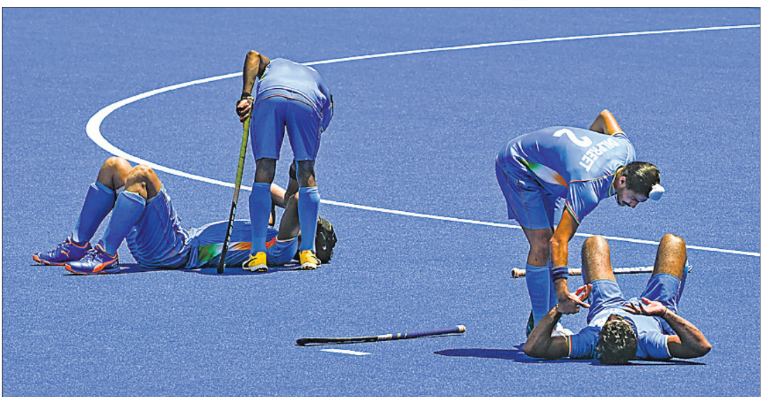
ସେମିଫାଇନାଲରେ ବେଲଜିୟମ ନିକଟରୁ ପରାସ୍ତ ହେବା ପରେ ଦ୍ରୋଞ୍ଜୀପାଇଁ ଭାରତୀୟ ଖେଳାଳି।

ଟୋକିଓ, ୩୮ ଦୀର୍ଘ ୪୧ ବର୍ଷ ପରେ ଭାରତୀୟ ପୁରୁଷ ହକି ଦଳର ଅଲିମ୍ପିକ୍ସ ସ୍ୱର୍ଣ୍ଣ ପଦକ ହାସଲ କରିବା ଆଶା ଅପୂରଣୀୟ ରହିଛି। ମଙ୍ଗଳବାର ଅନୁଷ୍ଠିତ ସେମିଫାଇନାଲ ମ୍ୟାଚ୍‌ରେ ଭାରତ ୨-୫ରେ ବେଲଜିୟମଠାରୁ ପରାସ୍ତ ହୋଇଛି। ଫଳରେ ଭାରତ ଫାଇନାଲ ମ୍ୟାଚ୍ ଖେଳିବା ଆଶା ଧୂଳିସାଜ ହୋଇଛି। ଭାରତ ଏବେ ଦ୍ରୋଞ୍ଜୀ ପଦକ ପାଇଁ ଗୁରୁତ୍ୱପୂର୍ଣ୍ଣ ଲଢ଼ିବାକୁ ଭେଟିବ। ଜର୍ମାନୀ ମଙ୍ଗଳବାର ଖେଳାଯାଇଥିବା ଅନ୍ୟ ଏକ ସେମିଫାଇନାଲ ମ୍ୟାଚ୍‌ରେ ଅଷ୍ଟ୍ରେଲିଆଠାରୁ