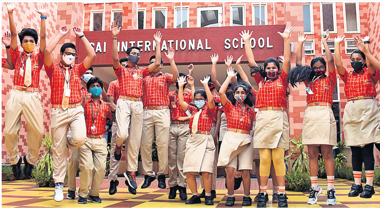
ସିବିଏସ୍‌ଇ ଦଶମ ପରୀକ୍ଷାଫଳ ପ୍ରକାଶ ପରେ ଭୁବନେଶ୍ୱର ସାଇ ଇଣ୍ଟରନାଶନାଲ୍ ସ୍କୁଲର ଛାତ୍ରାଛାତ୍ର ଖୁସି ମନାଉଛନ୍ତି

ଦେଶରେ ସିବିଏସ୍‌ଇ ଦଶମ ପରୀକ୍ଷାଫଳ ମଙ୍ଗଳବାର ପ୍ରକାଶ ପାଇଛି। ଏଥର କୋଭିଡ଼ ଯୋଗୁ ପରୀକ୍ଷା ବାତିଲ ହୋଇଥିଲା। ତେଣୁ ବିକଳ ମୂଲ୍ୟାୟନ ମାଧ୍ୟମରେ ଫଳ ପ୍ରକାଶ ପାଇଛି। ସର୍ବାଧିକାଂଶ ପ୍ରତିଶତ ୯୯.୦୪% ପାସ ହାର ରହିଥିବାବେଳେ ଭୁବନେଶ୍ୱର ରିଜିଷ୍ଟ୍ରରେ ୯୯.୬୨% ରହିଛି। ଯାହାକୁ ନେଇ ଛାତ୍ରାଛାତ୍ରୀ, ଅଭିଭାବକ ଏବଂ ଶିକ୍ଷୟିତ୍ରୀଶିକ୍ଷକଙ୍କ ମଧ୍ୟରେ ବେଶ୍ ଉତ୍ସାହ ଦେଖିବାକୁ ମିଳିଛି। ଅଧିକାଂଶ ପିଲା ସେମାନଙ୍କ ନମ୍ବରକୁ ନେଇ ଖୁସି ଥିବାବେଳେ ଅନେକେ ପରୀକ୍ଷା ହୋଇଥିଲେ ଅଧିକ ନମ୍ବର ରଖିଥିଲେ ବୋଲି ପ୍ରକାଶ କରିଛନ୍ତି। ପିଲାମାନଙ୍କ ଏହି ସଫଳତାକୁ ନେଇ ଧରିତ୍ରୀର ମତାମତଭିତ୍ତିକ ଉପସ୍ଥାପନା-