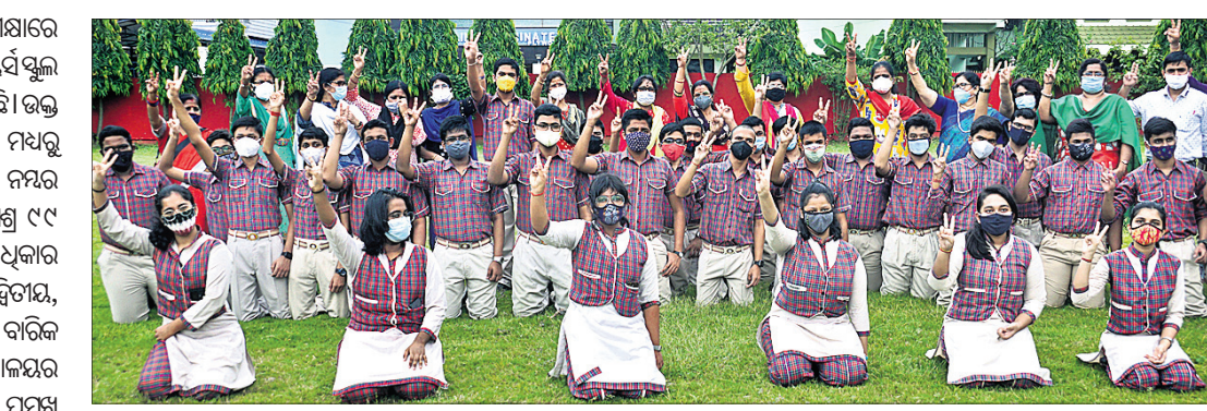
ଫଳ ପ୍ରକାଶ ପରେ କଟକ ସିବିଏସ୍‌ଲ ଡିଏଭି ପବ୍ଲିକ୍ ସ୍କୁଲର ଛାତ୍ରାଛାତ୍ରୀ ଖୁସି ମନାଉଛନ୍ତି।