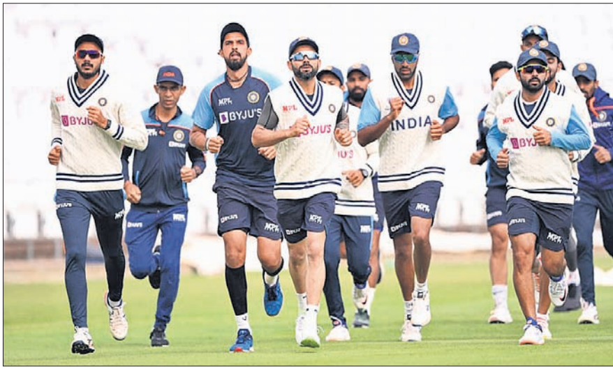
ଟ୍ରେଣିଂ ଟ୍ରିକ୍ ଗ୍ରାଉଣ୍ଡରେ ଭାରତୀୟ ଦଳର ଅଭ୍ୟାସ ।

ନିର୍ଦ୍ଦେଶକ, ମାଟ (ପି.ଟି.) ଭାରତ ଓ ଘରୋଇ ଇଂଲଣ୍ଡ ମଧ୍ୟରେ ବୁଧବାରଠାରୁ ଆରମ୍ଭ ହେବାକୁ ଯାଉଛି ୫ ମ୍ୟାଚ ବିଶିଷ୍ଟ ହାର୍ଡସ୍ପୋର୍ଟାଲ ଟେଷ୍ଟ ସିରିଜ୍ । ଗ୍ଲାନାୟ ଟ୍ରେଣିଂ ଟ୍ରିକ୍ ଗ୍ରାଉଣ୍ଡରେ ଉଭୟ ଦଳ ପ୍ରଥମ ଟେଷ୍ଟ ମ୍ୟାଚରେ ପରସ୍ପରକୁ ଭେଟିବେ । ବିରାଟ କୋହଲିଙ୍କ ନେତୃତ୍ୱାଧୀନ ଭାରତୀୟ ଦଳ ଏହି ସିରିଜରେ ନିଜ ଚ୍ୟାଲେଞ୍ଜର ସମ୍ମୁଖୀନ ହେବ । ଦଳ ଚୟନ ନେଇ ଅଧିନାୟକ କୋହଲି ବୃତ୍ତରେ ପଡିବେ ।