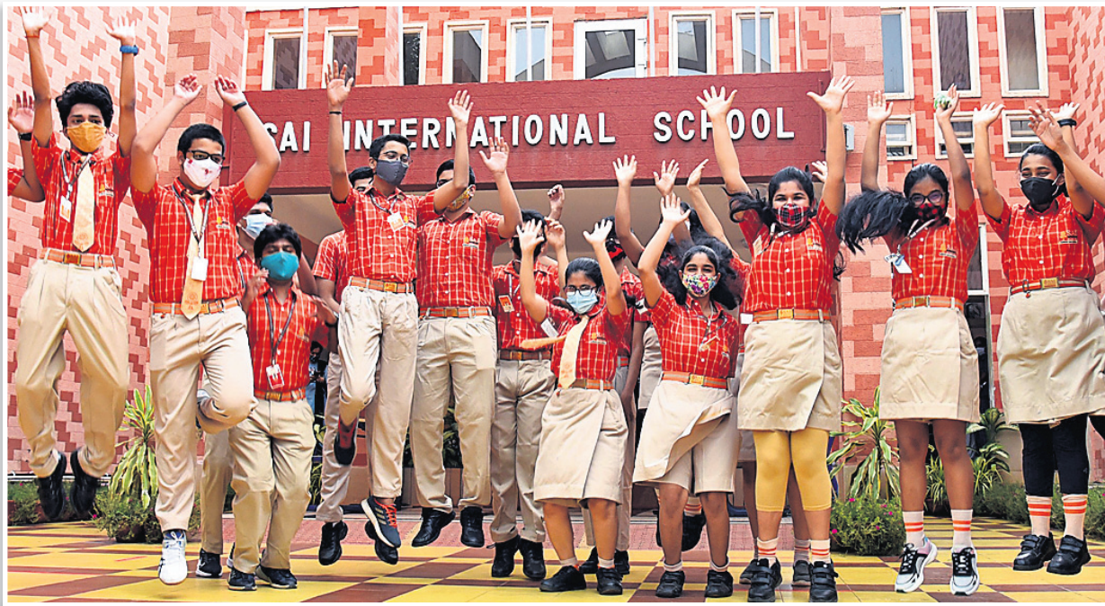
ସିବିଏସ୍‌ଲ ଦଶମ ପରୀକ୍ଷାଫଳ ପରେ ଭୁବନେଶ୍ୱର ସାଇ ଇଣ୍ଟରନାଶନାଲ ସ୍କୁଲର ଛାତ୍ରାଛାତ୍ରୀ ଖୁସି ମନାଉଛନ୍ତି।

ଦେଶରେ ସିବିଏସ୍‌ଲ ଦଶମ ପରୀକ୍ଷାଫଳ ମଙ୍ଗଳବାର ପ୍ରକାଶ ପାଇଛି ଏଥର କୋଭିଡ଼ ଯୋଗୁ ପରୀକ୍ଷା ବାତିଲ ହୋଇଥିଲା। ତେଣୁ ବିକଳ ମୂଲ୍ୟାୟନ ମାଧ୍ୟମରେ ଫଳ ପ୍ରକାଶ ପାଇଛି। ସର୍ବାଧିକାଂଶ ପ୍ରାଥମିକ ଶ୍ରେଣୀରେ ୯୯.୦୪% ପାସ ହାର ରହିଥିବାବେଳେ ଭୁବନେଶ୍ୱର ରିଜିୟନରେ ୯୯.୬୨% ରହିଛି। ଯାହାକୁ ନେଇ ଛାତ୍ରାଛାତ୍ରୀ, ଅଭିଭାବକ ଏବଂ ଶିକ୍ଷୟିତ୍ରୀଶିକ୍ଷକଙ୍କ ମଧ୍ୟରେ ବେଶ୍ ଉତ୍ସାହ ଦେଖିବାକୁ ମିଳିଛି। ଅଧିକାଂଶ ପିଲା ସେମାନଙ୍କ ନମ୍ବରକୁ ନେଇ ଖୁସି ଥିବାବେଳେ ଅନେକେ ପରୀକ୍ଷା ହୋଇଥିଲେ ଅଧିକ ନମ୍ବର ରଖିଥିବାକୁ ବୋଲି ପ୍ରକାଶ କରିଛନ୍ତି। ପିଲାମାନଙ୍କ ଏହି ସଫଳତାକୁ ନେଇ ଧରିତ୍ରୀର ମତାମତଭିତ୍ତିକ ଉପସ୍ଥାପନା-