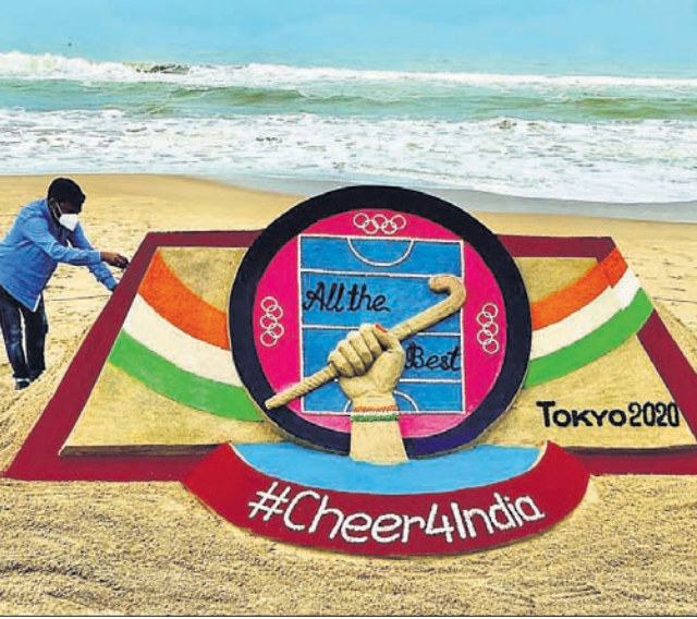
ପୂର୍ବ ବେଳାରେ ମଙ୍ଗଳବାର ସୁଦର୍ଶନ ପଟ୍ଟାଭିଷେକ କଳା ମାଧ୍ୟମରେ ଭାରତୀୟ ମହିଳା ହକି ଦଳକୁ ଶୁଭେଚ୍ଛା ଜଣାଉଛନ୍ତି।

ଭୁବନେଶ୍ୱର, ଗାମ୍ (ସ୍ୱରୋ) ୨୦୦୬ ଅନୁଯାୟୀ ନିର୍ବାଚନ ଆୟୋଗ କୋର୍ଟଙ୍କ ଦ୍ୱାରା ହେଉଥିବା ସମସ୍ତ ନିର୍ବାଚନ କାର୍ଯ୍ୟକୁ ସମାପ୍ତ କରିବା ପାଇଁ ରାଜ୍ୟପାଳଙ୍କୁ ଭେଟିଲା ଭାଜପା।