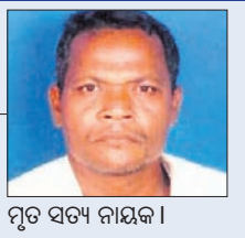
ମୃତ ସତ୍ୟ ନାୟକ।