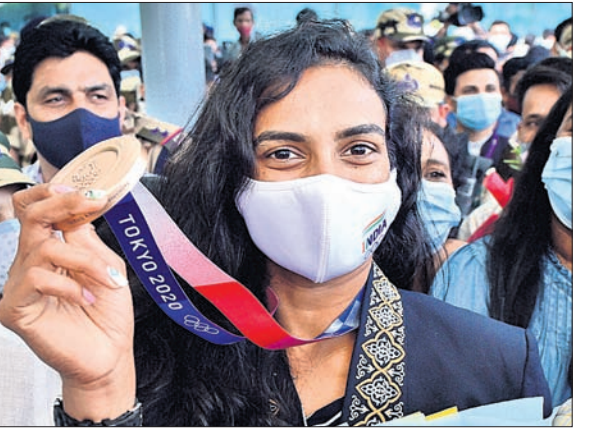
ଅଲିମ୍ପିକ୍ସ ବ୍ରୋଞ୍ଜ ପଦକ ପ୍ରଦର୍ଶନ କରୁଥିବା ପି.ଭି. ସିନ୍ଧୁ ।