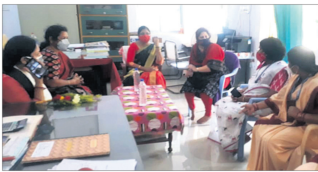
ରାଜ୍ୟ ଶିଶୁ ଅଧିକାର ଓ ସୁରକ୍ଷା ଆୟୋଗ ଅଧିକାରୀ ସମ୍ପାଦକ ପ୍ରଧାନ ଓ ଅନ୍ୟମାନେ।

ରାଜ୍ୟରେ କୋଭିଡ଼ ନିୟନ୍ତ୍ରଣକୁ ଆସିବା ପରେ ସରକାର ପ୍ରଥମ ପର୍ଯ୍ୟାୟରେ ଦଶମ ଏବଂ ଦ୍ୱାଦଶ ଶ୍ରେଣୀ ପାଠପଢ଼ା ଆରମ୍ଭ କରିଛନ୍ତି। ଏନେଇ ସ୍କୁଲ ଓ ଶିଶୁଶିକ୍ଷା ବିଭାଗ ପକ୍ଷରୁ ମାର୍ଗଦର୍ଶିକା ଜାରି କରାଯାଇଛି। ବିଦ୍ୟାଳୟରେ ଏସ୍ଆଇସି ଗାଇଡଲାଇନ କିପରି ପାଳନ କରାଯାଉଛି ତାହାକୁ ତଦାରଖ ଲାଗି ମଙ୍ଗଳବାର ରାଜ୍ୟ ଶିଶୁ ଅଧିକାର ଓ ସୁରକ୍ଷା ଆୟୋଗ ଅଧିକାରୀ ସମ୍ପାଦକ ପ୍ରଧାନ ଖୋର୍ଦ୍ଧା ଗସ୍ତରେ ଆସି ବିଭିନ୍ନ ବିଦ୍ୟାଳୟ ପରିଦର୍ଶନ କରିଛନ୍ତି। ପ୍ରଥମେ ଗୁରୁଜଙ୍ଗ ହାଇସ୍କୁଲ, ନବଦୋୟ ବିଦ୍ୟାଳୟ, ମହିଳା ମହାବିଦ୍ୟାଳୟ ଏବଂ ବାଣୀପାଣି ଶିଶୁ ବିଦ୍ୟାଳୟ ଆଦି ବିଭିନ୍ନ ପରିଦର୍ଶନ କରିଥିଲେ। ବିଦ୍ୟାଳୟ ପରିସର ସ୍ୱଚ୍ଛତା, ବିଶେଷାଧିନ, ପିଲାଙ୍କୁ