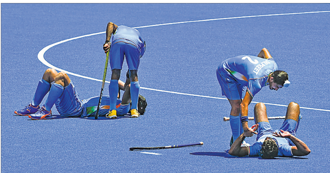
ସେମିଫାଇନାଲରେ ବେଲଜିୟମ ନିକଟରୁ ପରାସ୍ତ ହେବା ପରେ ଦ୍ରୋଞ୍ଜୀଭାବେ ଭାରତୀୟ ଖେଳାଳି।

ଦୀର୍ଘ ୪୧ ବର୍ଷ ପରେ ଭାରତୀୟ ପୁରୁଷ ହକି ଦଳର ଅଲିମ୍ପିକ୍ସ ସ୍ୱର୍ଣ୍ଣ ପଦକ ହାସଲ କରିବା ଆଶା ଅପୂରଣୀୟ ରହିଛି। ମଙ୍ଗଳବାର ଅନୁଷ୍ଠିତ ସେମିଫାଇନାଲ ମ୍ୟାଚ୍‌ରେ ଭାରତ ୨-୫ରେ ବେଲଜିୟମଠାରୁ ପରାସ୍ତ ହୋଇଛି। ଫଳରେ ଭାରତ ଫାଇନାଲ ମ୍ୟାଚ୍ ଖେଳିବା ଆଶା ଧୂଳିସାଜ ହୋଇଛି। ଭାରତ ଏବେ ଦ୍ରୋଞ୍ଜୀ ପଦକ ପାଇଁ ଗୁରୁତ୍ୱପୂର୍ଣ୍ଣ ଲଢ଼ିବାକୁ ଭେଟିବ। ଜର୍ମାନୀ ମଙ୍ଗଳବାର ଖେଳାଯାଇଥିବା ଅନ୍ୟ ଏକ ସେମିଫାଇନାଲ ମ୍ୟାଚ୍‌ରେ ଅଷ୍ଟ୍ରେଲିଆଠାରୁ