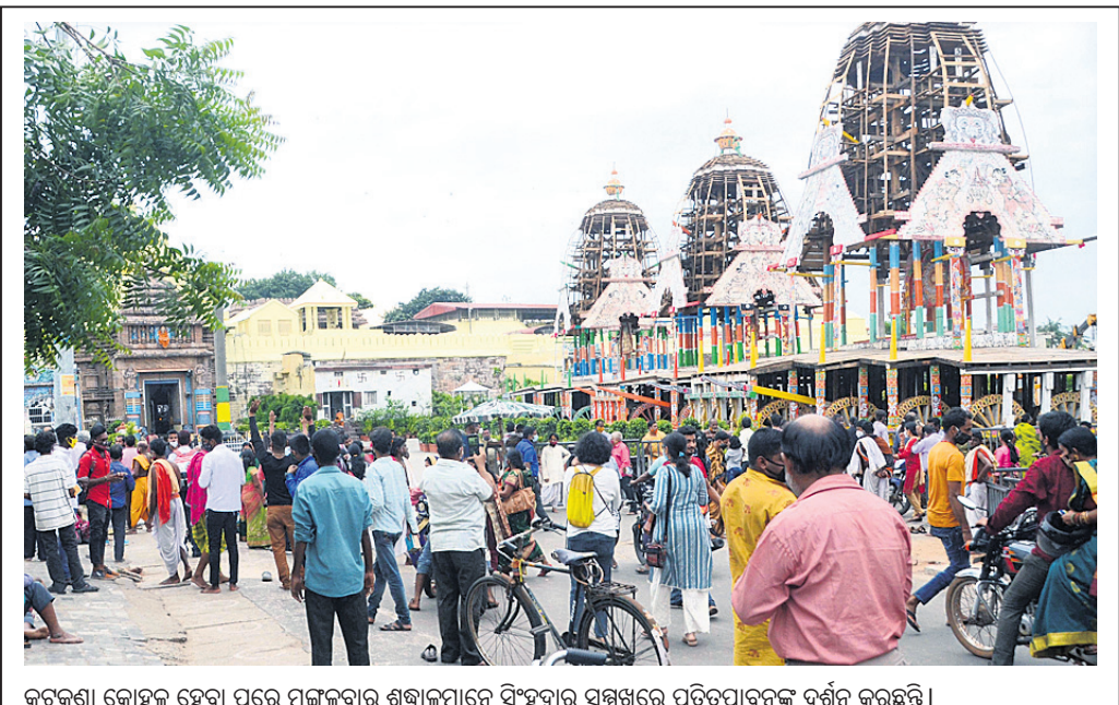
କଟକଶା ବୋହେଇ ହେବା ପରେ ମଙ୍ଗଳବାର ଶ୍ରଦ୍ଧାଳୁମାନେ ସିଂହଦ୍ୱାର ସମ୍ମୁଖରେ ପତିତପାବନକ ଦର୍ଶନ କରୁଛନ୍ତି।