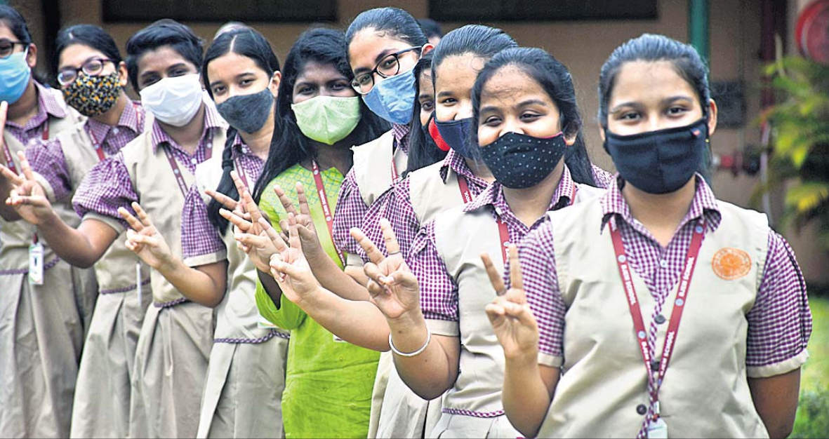
ସିବିଏସ୍‌ଲ ଦଶମ ଶ୍ରେଣୀ ପରୀକ୍ଷାଫଳ ମଙ୍ଗଳବାର ପ୍ରକାଶ ପାଇବା ପରେ ଖୁସି ମନାଉଛନ୍ତି ଭୁବନେଶ୍ୱରର ବିକେଜଏମ୍ ସ୍କୁଲ ଛାତ୍ରୀମାନେ ।