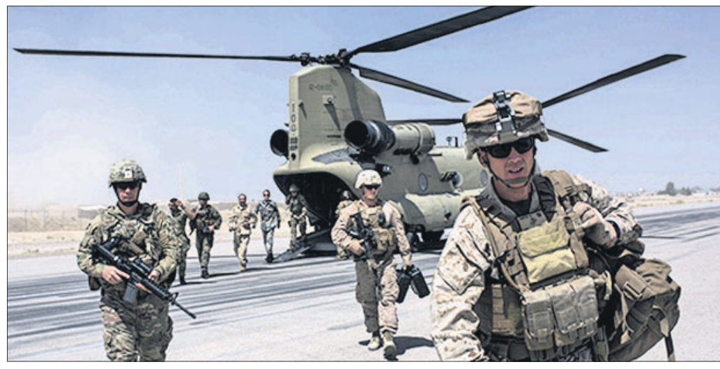
ଆତଙ୍କବାଦୀଙ୍କ ଦଖଲରେ ଅଧିକାଂଶ ଅଞ୍ଚଳ

ଆମକୁ ୨୦ ବର୍ଷ ଧରି ଚାଲିଥିବା ଯୁଦ୍ଧର ବନ୍ଧୁକୁ ବନ୍ଦ କରିବାକୁ ପଡ଼ିବ। ୨୦୨୧ ଏପ୍ରିଲ ୧୪ରେ ଏମିତି ଘୁଣ୍ଟି ବ୍ରେକ୍ କରିଥିଲେ ବାଲତେନ୍ ପ୍ରଶାସନର ବରିଷ୍ଠ ଜଣେ ଅଧିକାରୀ। ଆମେରିକା ରାଷ୍ଟ୍ରପତି ଜୋ ବାଇଡେନ୍ ଘୋଷଣା କରିଥିଲେ, ଆଫଗାନିସ୍ତାନରୁ ସମସ୍ତ ଆମେରିକୀୟ ସୈନ୍ୟଙ୍କୁ ପ୍ରତ୍ୟାହାର କରାଯିବ। ଏହି ପ୍ରକ୍ରିୟା ମେ ପହିଲାକୁ ଆରମ୍ଭ ହୋଇଥିବାବେଳେ ସେପ୍ଟେମ୍ବର ସୁଦ୍ଧା ଶେଷ ହେବ। ୯/୧୧ ଆତଙ୍କବାଦୀ ଆକ୍ରମଣର ଦିନ ବାର୍ଷିକୀ ପାଳନବେଳକୁ ଆଫଗାନିସ୍ତାନରୁ ସବୁ ସୈନ୍ୟ ଫେରିଆସିଥିବେ ବୋଲି ବାଇଡେନ୍ ହାଲତ୍ ହାଉସ୍ ଟ୍ରିଟି ଉତ୍ସୁକ୍ତ ଦିଶୁଛନ୍ତି। ୨୦୦୧ ସେପ୍ଟେମ୍ବର ୧୧। ଏହି ଦିନ ମଧ୍ୟପ୍ରାଚ୍ୟ ଓ କେନ୍ଦ୍ରୀୟ ଏସିଆରେ ଦୀର୍ଘକାଳୀନ ଯୁଦ୍ଧ ଭିତରକୁ ଆମେରିକାକୁ ଚାଣି ନେଇଥିଲା ବିଶ୍ୱ ବାଣିଜ୍ୟ ସଙ୍ଗଠନ (ଡିଏମ୍‌ଆଇ)।