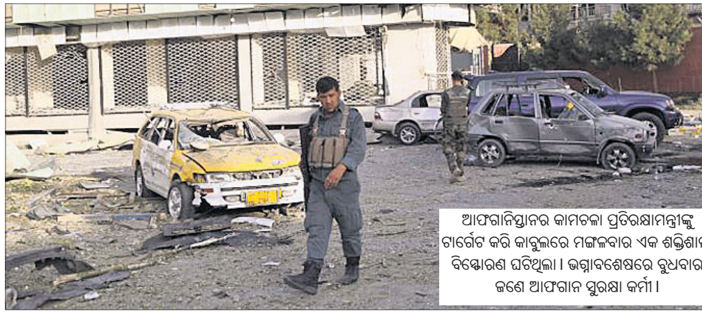
ଆଫଗାନିସ୍ତାନର କାମଗଳା ପ୍ରତିରକ୍ଷାମନ୍ତ୍ରୀଙ୍କୁ ଚାର୍ଜେଟ କରି କାବୁଲରେ ମଙ୍ଗଳବାର ଏକ ଶକ୍ତିଶାଳୀ ବିସ୍ଫୋରଣ ଘଟିଥିଲା। ଭଗ୍ନାବଶେଷରେ ରୁଧିରୀ ଜଣେ ଆଫଗାନ ସୁରକ୍ଷା କର୍ମୀ।