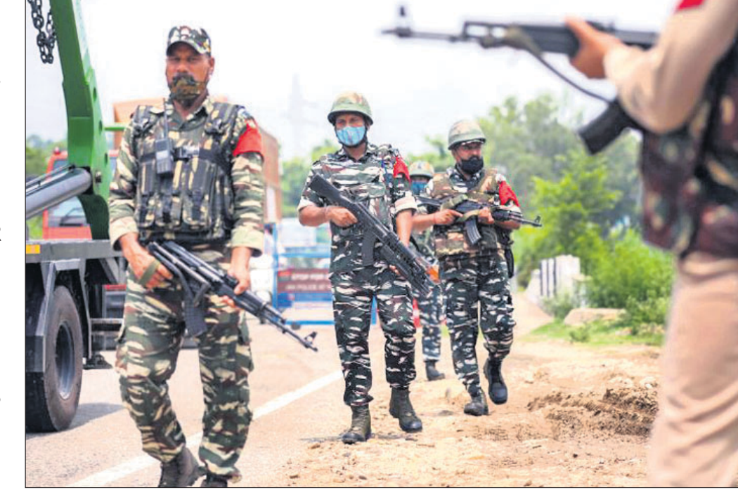
୩୭୦ ଉଚ୍ଚେଦର ୨ ବର୍ଷ ପୂର୍ଣ୍ଣ ଅବ୍ୟବହିତ ପୂର୍ବରୁ ରୁଧିରୀର କଣ୍ଠ-କଣ୍ଠାର ଜାତୀୟ ରାଜପଥରେ ପୁଠେଇ ସାମ୍ବାର୍ଯ୍ୟ ସମାପନ।