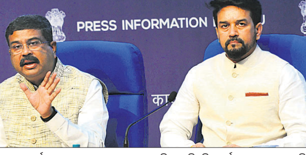
କେନ୍ଦ୍ରମନ୍ତ୍ରୀ ଧର୍ମେନ୍ଦ୍ର ପ୍ରଧାନ ଓ ଅନୁରାଗ ଠାକୁର କ୍ୟାବିନେଟ୍ ନିଷ୍ପତ୍ତି ସମ୍ପର୍କରେ ସୂଚନା ଦେଇଛନ୍ତି।

ପ୍ରଧାନମନ୍ତ୍ରୀ ନରେନ୍ଦ୍ର ମୋଦିଙ୍କ ଅଧିକାରୀଙ୍କୁ ରୁଧିରୀ ଅନୁଷ୍ଠିତ କେନ୍ଦ୍ର କ୍ୟାବିନେଟ୍ ବୈଠକରେ ଶିକ୍ଷା ଯୋଜନା ୨.୦ ଲାଗୁ ନିଷ୍ପତ୍ତିକୁ ମଞ୍ଜୁରୀ ମିଳିଛି। ୧ ଏପ୍ରିଲ୍ ୨୦୨୧ରୁ ୩୯ ମାର୍ଚ୍ଚ ୨୦୨୬ ପର୍ଯ୍ୟନ୍ତ ଏହା କାର୍ଯ୍ୟକାରୀ ହେବ ବୋଲି କେନ୍ଦ୍ର ଶିକ୍ଷା ମନ୍ତ୍ରୀ ଧର୍ମେନ୍ଦ୍ର ପ୍ରଧାନ ସୂଚନା ଦେଇଛନ୍ତି। ୨ ଲକ୍ଷ ୯୪ ହଜାର ୨୮୩ କୋଟି ଟଙ୍କାର ଏହି ଯୋଜନାରେ କେନ୍ଦ୍ରର ଅଂଶ ୧ ଲକ୍ଷ ୮୫ ହଜାର ୩୯୮ କୋଟି ରହିବ। ପ୍ରି ସ୍କୁଲକୁ ହାବେଶ ଶ୍ରେଣୀ ପର୍ଯ୍ୟନ୍ତ ଏହି ଯୋଜନା କାର୍ଯ୍ୟକାରୀ ହେବ। ଏହାବାଦ୍ ସରକାରୀ ସ୍କୁଲରେ ପ୍ଲେ ସ୍କୁଲ ଆରମ୍ଭ କରାଯିବା ସହ ବିଦିଧି ଭାଷା ଓ ଦକ୍ଷତାବୃଦ୍ଧି ଭିତ୍ତିକ ପାଠ୍ୟକ୍ରମ ରହିବ। ଏହାପ୍ରାୟ ୨୦୨୬ ମଧ୍ୟରୁ ପ୍ରତିଷ୍ଠା କରାଯିବ। ସରକାରୀ ସ୍କୁଲରେ ପ୍ରି-ପ୍ରାଥମିକ ପାଠ୍ୟକ୍ରମ ପ୍ରକ୍ଷେପିତ ୫ ଶହ ଟଙ୍କା