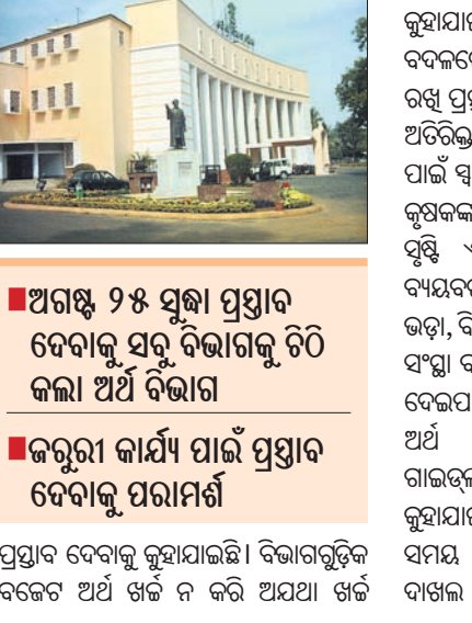
ଅଗଷ୍ଟ ୨୫ ସୁଦ୍ଧା ପ୍ରସ୍ତାବ ଦେବାକୁ ସବୁ ବିଭାଗକୁ ଚିଠି କଲା ଅର୍ଥ ବିଭାଗ

ଭୁବନେଶ୍ୱର, ୪୮୮ (ବ୍ୟୁରୋ): ଆସନ୍ତା ବିଧାନସଭାରେ ୨୦୧୯-୨୨ ଆର୍ଥିକବର୍ଷ ଲାଗି ଅତିରିକ୍ତ ବଜେଟ୍ ଉପସ୍ଥାପନ ହେବ।