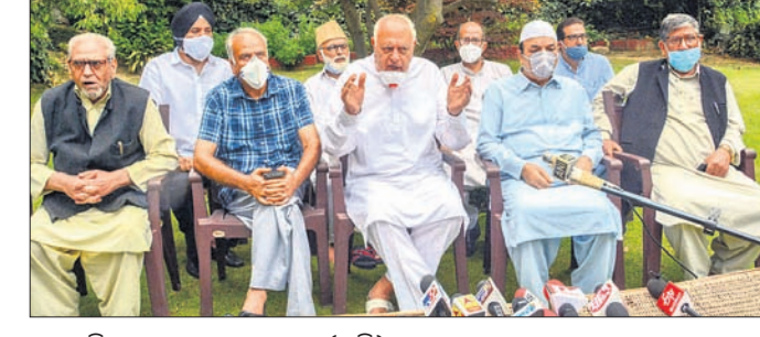
ଏନସି ଅଧ୍ୟକ୍ଷ ଫାରୁକ୍ ଅବଦୁଲ୍ଲା(ମଝି)ଙ୍କ ସହ ରୂପକାର ମେଝର ନେତାମାନେ।

ଅବସରରେ ନ୍ୟାଶନାଲ୍ କନଫରେନ୍ସ (ଏନସି) ଉପାଧ୍ୟକ୍ଷ ଓମାର ଅବଦୁଲ୍ଲା ୭ ମାସ ଅବଧିର ଗୃହବନ୍ଦୀ ସ୍ମୃତିକୁ ସ୍ମରଣ କରିଛନ୍ତି। କେନ୍ଦ୍ରର ଏହି ପଦକ୍ଷେପକୁ ସେ ଅନାଦକ, ଅପ୍ରତ୍ୟାଶିତ ଓ ଅସାଧାରଣ ଝଟକା ବୋଲି ଅଭିହିତ କରିଛନ୍ତି। ଏହାସହ ଦିନେ ନା ଦିନେ କଣ୍ଠ- କଣ୍ଠାରବାସୀଙ୍କୁ ନ୍ୟାୟ ମିଳିବ ବୋଲି