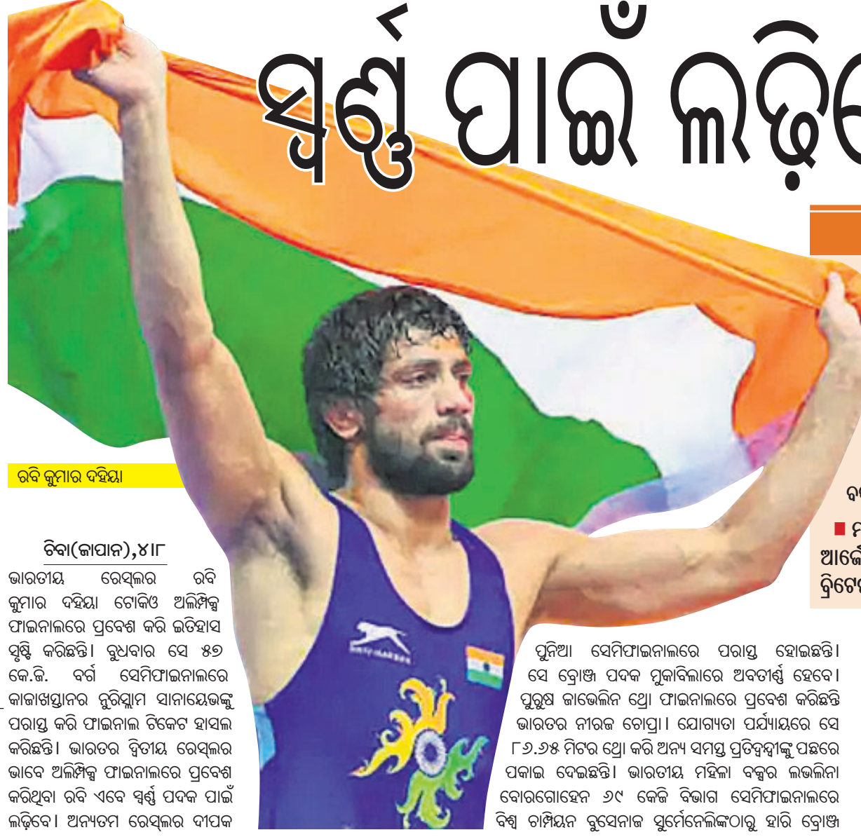
ରବି କୁମାର ଦହିୟା

ଟିବା(ଜାପାନ), ୪୮୮ ଭାରତୀୟ ରେସଲିଂ ରବି କୁମାର ଦହିୟା ଟୋକିଓ ଅଲିମ୍ପିକ୍ସ ଫାଇନାଲରେ ପ୍ରବେଶ କରି ଇତିହାସ ସୃଷ୍ଟି କରିଛନ୍ତି। ସୁଧାବୀର ସେ ୫୭ କେ.ଜି. ବର୍ଗ ସେମିଫାଇନାଲରେ କାକାଶିୟାନର ଦୁରିୟାମ ସାନାୟେଜିକୁ ପରାସ୍ତ କରି ଫାଇନାଲ ଟିକେଟ ହାସଲ କରିଛନ୍ତି। ଭାରତର ଦ୍ୱିତୀୟ ରେସଲିଂ ଭାବେ ଅଲିମ୍ପିକ୍ସ ଫାଇନାଲରେ ପ୍ରବେଶ କରିଥିବା ରବି ଏବେ ସ୍ୱର୍ଣ୍ଣ ପଦକ ପାଇଁ ଲଢ଼ିବେ। ଅନ୍ୟତମ ରେସଲିଂ ଦୀପକ