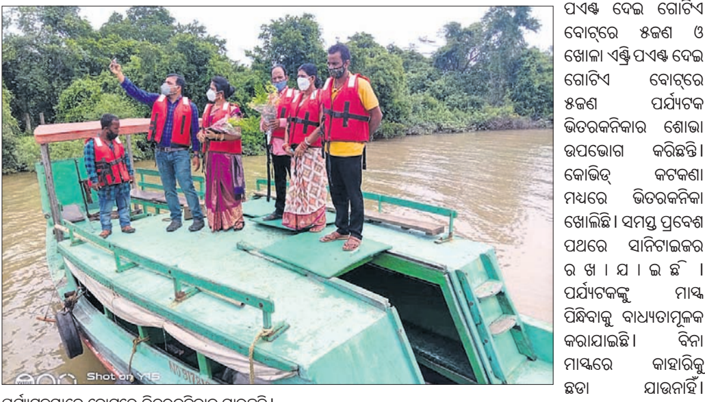
ପର୍ଯ୍ୟଟକମାନେ ବୋଟରେ ଭିତରକନିକାକୁ ଯାଉଛନ୍ତି।

ଦିଶ୍ୱ ପ୍ରସିଦ୍ଧ ଭିତରକନିକା ଜାତୀୟ ଉଦ୍ୟାନ ଦେଶ ବିଦେଶର ପର୍ଯ୍ୟଟକଙ୍କ ପାଇଁ ଗୁରୁବାରଠାରୁ ଖୋଲିଛି। ବରକା କୁମ୍ଭୀର ପ୍ରକଳ୍ପର ରକ୍ତ ଓ କୋଭିଡ଼ କଟକଣା ପାଇଁ ବାଧ୍ୟ ୯୭ ଦିନ ଭିତରକନିକା ବନ୍ଦ ରହିବା ପରେ ଖୋଲାଯାଇଛି। ଗୁରୁବାରଠାରୁ ଦିନରେ ଆସୁଥିବା ଓ ରାତ୍ରି ଯାପନ କରୁଥିବା ସମସ୍ତ ପର୍ଯ୍ୟଟକଙ୍କ ପାଇଁ ଭିତରକନିକା ଖୋଲାଯାଇଛି। ଦୀର୍ଘଦିନ ପରେ ଭିତରକନିକା ଜାତୀୟ ଉଦ୍ୟାନ ପର୍ଯ୍ୟଟକଙ୍କ ପାଇଁ ଖୋଲାଯାଇଥିବାରୁ ପର୍ଯ୍ୟଟକମାନଙ୍କୁ ରାଜନଗର ଜୁଣା ଜଙ୍ଗଲ ବନଖଣ୍ଡ (ବନ୍ୟଜୀବୀ) ପକ୍ଷରୁ ସ୍ୱାଗତ କରାଯାଇଛି। ଭିତରକନିକା ଜାତୀୟ ଉଦ୍ୟାନର ମୁଖ୍ୟ ଫାଟକ ତାଳମାଳଠାରେ ପର୍ଯ୍ୟଟକମାନଙ୍କୁ ପୁଷ୍ପଗୁଚ୍ଛ ସହିତ ମିଠା ଖୁଆଇ ସ୍ୱାଗତ କରାଯାଇଥିଲା। ଏସିଏସ୍ ବିରଞ୍ଚି ନାରାୟଣ ସାମଲ ଓ ରେଞ୍ଜି ଅଫିସର ମାନସ କୁମାର ଦାସ ପର୍ଯ୍ୟଟକମାନଙ୍କୁ ସ୍ୱାଗତ କରିଥିଲେ। ରୁପ୍ରି ପ୍ରବେଶ ପଥରେ