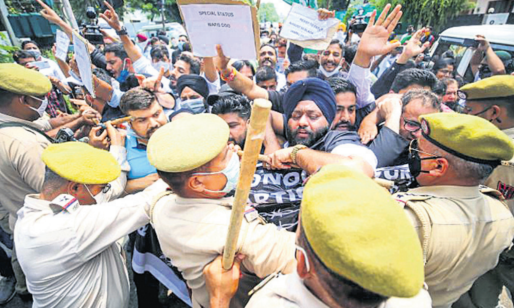
ଶ୍ରୀନଗରରେ ପିଡିପି ପକ୍ଷରୁ ବିରୋଧ ବେଳେ ପୋଲିସ୍ ସହ ଦକ୍ଷାୟ କର୍ମୀଙ୍କ ସଂଘର୍ଷ।

କନ୍ୟା/ଶ୍ରୀନଗର, ୫୮ ୨୦୧୯ ଅଗଷ୍ଟ ୫ରେ କେନ୍ଦ୍ର ସରକାର ଜନ୍ମ-କର୍ମାଣ୍ଡରୁ ସ୍ୱତନ୍ତ୍ର ମାନ୍ୟତା ପ୍ରଦାନକାରୀ ସମ୍ବିଧାନର ଅନୁଚ୍ଛେଦ ୩୭୦କୁ ଉଚ୍ଛେଦ କରିଥିଲେ। ଗୁରୁବାର ଏହାର ଦ୍ୱିତୀୟ ବର୍ଷ ପୂର୍ଣ୍ଣ ଅବସରରେ ଭାରତୀୟ ପକ୍ଷରୁ ଜନ୍ମ-କର୍ମାଣ୍ଡରେ ଉତ୍ସବ ପାଳନ କରାଯାଇଥିବାବେଳେ