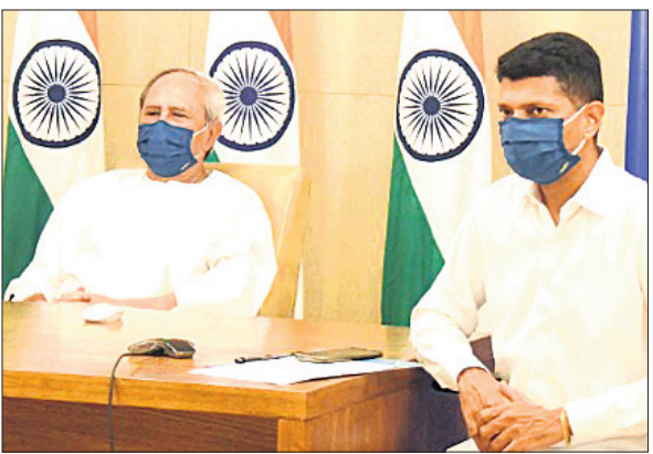
ଚାଷୀଙ୍କୁ ସହାୟତା ଘୋଷଣା ଅବସରରେ ମୁଖ୍ୟମନ୍ତ୍ରୀ ଏବଂ ୫-ଟି ସଚିବ।

ମୁଖ୍ୟମନ୍ତ୍ରୀ ନବୀନ ପଟ୍ଟନାୟକ ଗୁରୁବାର ରାଜ୍ୟର ଦୁଗ୍ଧ ଚାଷୀମାନଙ୍କୁ ସ୍ୱତନ୍ତ୍ର କୋଭିଡ୍ ସହାୟତା ପ୍ରଦାନ କରିଛନ୍ତି। ଏହାଦ୍ୱାରା ୧ ଲକ୍ଷ ଦୁଗ୍ଧଚାଷୀ ୬୦୦୦ ଟଙ୍କା ପର୍ଯ୍ୟନ୍ତ ସହାୟତା ପାଇଛନ୍ତି। ସମୁଦାୟ ୧୧ କୋଟି ଟଙ୍କାର ସହାୟତା ଦିଆଯାଇଛି। ଏହି ଅବସରରେ ମୁଖ୍ୟମନ୍ତ୍ରୀ କହିଛନ୍ତି, ରାଜ୍ୟ ସରକାର ସବୁବେଳେ ଗରିବ ଲୋକଙ୍କ ସାଥୀରେ ଅଛନ୍ତି। ସେମାନଙ୍କ ସ୍ୱାର୍ଥର ସୁରକ୍ଷା ପାଇଁ କାମ କରୁଛନ୍ତି। ଗରିବ ଲୋକଙ୍କ ଉପରେ କୋଭିଡ୍ ମହାମାରୀର ପ୍ରଭାବ କମ୍ କରିବା ପାଇଁ ରାଜ୍ୟ ସରକାର ଛୋଟ ଦୋକାନୀ, ଛୋଟ ଚାଷୀ, ମିଶନ ଶକ୍ତିର ମା'ମାନଙ୍କ ଆକାଉଣ୍ଟରେ ୨୦୦୦ କୋଟିରୁ ଅଧିକ ଟଙ୍କା ଜମା କରାଯାଇଛି ବୋଲି ମୁଖ୍ୟମନ୍ତ୍ରୀ କହିଛନ୍ତି। ଛୋଟ ଚାଷୀଙ୍କ ରୋଜଗାରରେ ରୋପାକନର ଅବଦାନ ବିଷୟ ଉଲ୍ଲେଖ କରି ମୁଖ୍ୟମନ୍ତ୍ରୀ କହିଛନ୍ତି ଯେ ଏହା ସେମାନଙ୍କ ରୋଜଗାର ବଢାଇବା ସହିତ ଗ୍ରାମ ଅର୍ଥନୀତିକୁ ମଧ୍ୟ ବଳବତ୍ତର କରିବ। ମା'ମାନଙ୍କ ରୋଜଗାର ବଢାଇବା ସହିତ ସାଧାରଣ ଲୋକ ବିଶେଷକରି ପିଲାମାନଙ୍କ ପୁଷ୍ଟି ସାଧନରେ ସୁଦୃଢ ବନ୍ଧୁତା ବଢ଼ାଇବା ଉଦ୍ଦେଶ୍ୟ ଥିବ ବୋଲି ମୁଖ୍ୟମନ୍ତ୍ରୀ କହିଛନ୍ତି।