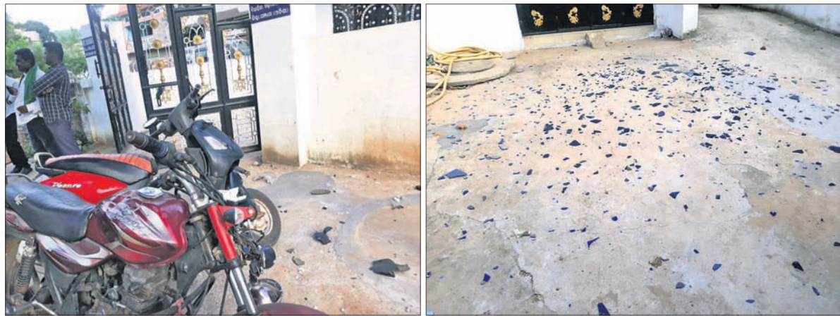
ଖଲିକୋଟର ଖଲିକୋଟ ବିଧାନସଭାଙ୍କ ଘରକୁ ପଥର ମାଡ଼ କରାଯାଇଛି।

ରାଜ୍ୟର ଜିଲ୍ଲା ଖଲିକୋଟ ଆନା ଅନ୍ତର୍ଗତ କେଶପୁରରେ ରାଜନୈତିକ ଶତ୍ରୁତାକୁ ଗୁରୁତ୍ୱ ଦେଇ ଖଲିକୋଟ ବିଧାନସଭାଙ୍କ ଘରକୁ ପଥର ମାଡ଼ କରାଯାଇଛି।