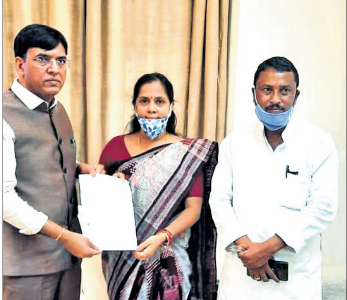
ଏମ୍ପି ମଞ୍ଜୁଲତା ମଣ୍ଡଳ ସ୍ୱାସ୍ଥ୍ୟମନ୍ତ୍ରୀ ମନମୁଖ ଲାଲ୍ ମାଣ୍ଡବ୍ୟଙ୍କୁ ସ୍ୱାଗତପତ୍ର ପ୍ରଦାନ କରୁଛନ୍ତି।