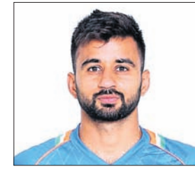
ନବୀନ ପଟ୍ଟନାୟକଙ୍କୁ ଦେଇଛନ୍ତି ଏକି ଐତିହାସିକ ତ୍ରୋଞ୍ଚି-୪

ଟୋକିଓ ଅଲିମ୍ପିକ୍ସରେ ଦୀର୍ଘ ୪୧ ବର୍ଷ ପରେ ପୁରୁଷ ହକି ଦଳ ପଦକ ପାଇଛି। ଜର୍ମାନୀକୁ ୫-୪ ଗୋଲରେ ଚକମା ଦେଇ ତ୍ରୋଞ୍ଚି ପଦକ ହାସଲ କରିଛି। ଭାରତୀୟ ପୁରୁଷ ହକି ଦଳର ଅଧିନାୟକ ମନ୍‌ପ୍ରୀତ ସିଂ ଏହି ସଫଳତାର ସମସ୍ତ ଶ୍ରେୟ ସେ ମୁଖ୍ୟମନ୍ତ୍ରୀ