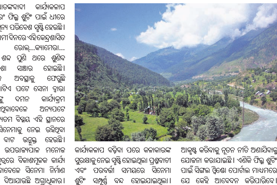
କାର୍ଯ୍ୟକଳାପ ବନ୍ଦିତା ପରେ କଳାକାରଙ୍କ ସୁରକ୍ଷାକୁ ନେଇ ସୃଷ୍ଟି ହୋଇଥିଲା ପ୍ରଶ୍ନାବଳୀ ଏବଂ ପରବର୍ତ୍ତୀ ସମୟରେ ସିନେମା ଶୁଟିଂ ସମ୍ପୂର୍ଣ୍ଣ ବନ୍ଦ ହୋଇଯାଇଥିଲା। ତେବେ କଣ୍ଠାରରେ ଫିଲ୍ମ ଶୁଟିଂ ଲାଗି ସେଠାକାର ପ୍ରଶାସନ ପୁଣିଥରେ ଅଣ୍ଟାଭିଡ଼ିଛି। ବଲିଉଡ୍ ଫିଲ୍ମ ନିର୍ମାତାଙ୍କୁ ଆକୃଷ୍ଟ କରିବାକୁ ନୂତନ ନୀତି ଅଣାଯିବାକୁ ଯୋଜନା କରାଯାଇଛି। ଏଣିକି ଫିଲ୍ମ ଶୁଟିଂ ପାଇଁ ସୁରକ୍ଷା ଓ ପୋର୍ଟାଲ ମାଧ୍ୟମରେ ଯେ କେହି ଆବେଦନ କରିପାରିବେ। ବଲିଉଡ୍, ଓଡ଼ିଆ, ରିଆଲିଟି ଶୋ, ଷ୍ଟେସ୍ ସିରିଜ୍ ପାଇଁ ସମସ୍ତ ଏକ୍ସକ୍ଲୁସିଭ୍ ଶୁଟିଂ ଲାଗି ଅନୁମତି ମିଳିବ। ଏଥିରେ ସୃଷ୍ଟି ହେଉଥିବା

ଶ୍ରୀନଗର: କଣ୍ଠାରକୁ ବାଦ୍‌ରେଇ ଭାରତୀୟ ପର୍ଯ୍ୟଟନର ପରିକଳ୍ପନା କରିବା କଷ୍ଟକର। ଏହାର ନୈସର୍ଗିକ ସୌନ୍ଦର୍ଯ୍ୟ କେବଳ ଦେଶୀୟ ନୁହେଁ, ବିଦେଶୀ ପର୍ଯ୍ୟଟକଙ୍କୁ ମଧ୍ୟ ଆକର୍ଷିତ କରେ। ଖାସ୍ ଏହି କାରଣରୁ ଭାରତୀୟ ଭୂଗର୍ଭ ବୋଲାଉଥିବା କଣ୍ଠାର ଏକଦା ପାଲଟିଥିଲା ବଲିଉଡ୍ ଫିଲ୍ମ ଶୁଟିଂର ପ୍ରମୁଖ କେନ୍ଦ୍ରସ୍ଥଳ। ହେଲେ ଆତଙ୍କବାଦୀ ନୁହଁ ତେବେ ପରେ ଏହି ଧାରାରେ ଲାଗିଯାଇଛି ବ୍ରେକ୍। ଭଲ ଏବଂ ସୁରକ୍ଷା କାରଣରୁ ସିନେ ନିର୍ଦ୍ଦେଶକ ଉପଯୁକ୍ତ ଶୁଟିଂ ସ୍ଥାନ ଖୋଜିବାକୁ ବିଦେଶୀ ପୁଣି ହୋଇଥିବାବେଳେ ଦୀର୍ଘ ଦଶନ୍ଧି ଧରି କଣ୍ଠାରରେ ବଲିଉଡ୍ ଫିଲ୍ମ ଶୁଟିଂ ହୋଇନାହିଁ। ହେଲେ ସମ୍ଭାଷନ ୩୭୦ ଧାରା, ଆର୍ଟିକଲ ୩୫ (ଏ)କୁ ହଟାଇ ଦିଆଯିବା ପରେ କଣ୍ଠାର ଉପତ୍ୟକାରେ କେବଳ ଆତଙ୍କବାଦୀ କାର୍ଯ୍ୟକଳାପ କମିନାହିଁ, ବରଂ ଫିଲ୍ମ ଶୁଟିଂ ପାଇଁ ଧାରା ଧାରା ଭିତ୍ତିରେ ପରିବେଶ ସୃଷ୍ଟି ହେଉଛି। ଫଳରେ ଆଗାମୀ ଦିନରେ ଏହି କେନ୍ଦ୍ରସ୍ଥଳୀରୁ ଆକର୍ଷଣ କେବଳ ଦେଶୀୟ ନୁହେଁ, ବିଦେଶୀ ପର୍ଯ୍ୟଟକଙ୍କୁ ମଧ୍ୟ ଆକର୍ଷିତ କରିବ। ଖାସ୍ ଏହି କାରଣରୁ ଭାରତୀୟ ଭୂଗର୍ଭ ବୋଲାଉଥିବା କଣ୍ଠାର ଏକଦା ପାଲଟିଥିଲା ବଲିଉଡ୍ ଫିଲ୍ମ ଶୁଟିଂର ପ୍ରମୁଖ କେନ୍ଦ୍ରସ୍ଥଳ। ହେଲେ ଆତଙ୍କବାଦୀ ନୁହଁ ତେବେ ପରେ ଏହି ଧାରାରେ ଲାଗିଯାଇଛି ବ୍ରେକ୍। ଭଲ ଏବଂ ସୁରକ୍ଷା କାରଣରୁ ସିନେ ନିର୍ଦ୍ଦେଶକ ଉପଯୁକ୍ତ ଶୁଟିଂ ସ୍ଥାନ ଖୋଜିବାକୁ ବିଦେଶୀ ପୁଣି ହୋଇଥିବାବେଳେ ଦୀର୍ଘ ଦଶନ୍ଧି ଧରି କଣ୍ଠାରରେ ବଲିଉଡ୍ ଫିଲ୍ମ ଶୁଟିଂ ହୋଇନାହିଁ। ହେଲେ ସମ୍ଭାଷନ ୩୭୦ ଧାରା, ଆର୍ଟିକଲ ୩୫ (ଏ)କୁ ହଟାଇ ଦିଆଯିବା ପରେ କଣ୍ଠାର ଉପତ୍ୟକାରେ