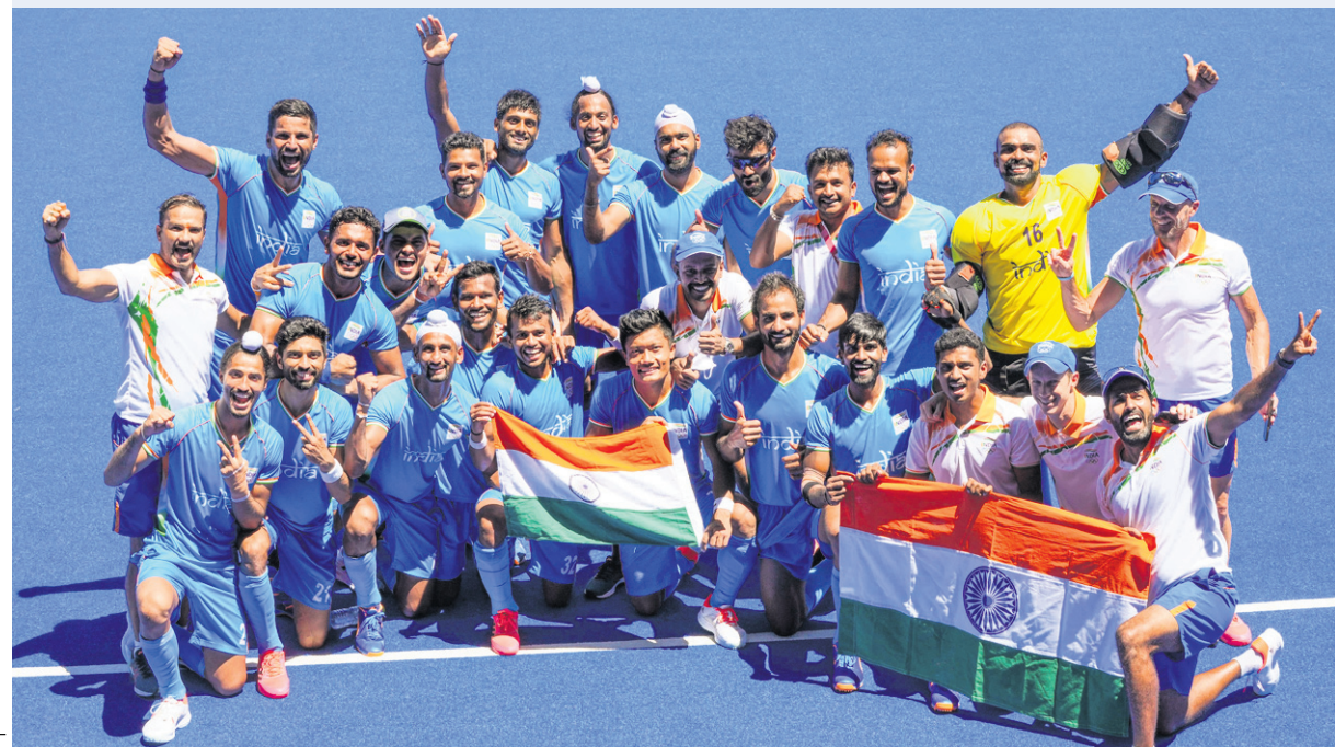
୪୧ ବର୍ଷ ପ୍ରତୀକ୍ଷାର ଅନ୍ତ ଟୋକିଓ ଅଲିମ୍ପିକ୍ସରେ ଗୁରୁବାର ଜର୍ମାନୀ ବିପକ୍ଷ ମ୍ୟାଚ୍‌ରେ ତ୍ରୋଞ୍ଚି ପଦକ ବିଜୟ ପରେ ଉଲ୍ଲସିତ ଭାରତୀୟ ପୁରୁଷ ହକି ଦଳ।