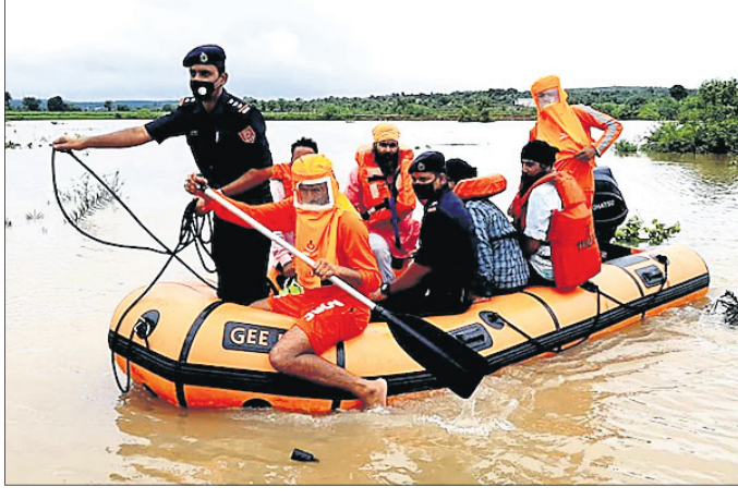
ଉଦ୍ଧାର ଓ ରିଲିଫ୍ କାର୍ଯ୍ୟରେ ଏନ୍‌ଡିଆର୍‌ଏଫ୍ ଟିମ୍।

ଏବଂ ବିଏସ୍‌ଏଫ୍ ସହାୟତା ନିୟୋଜିତ ବନ୍ୟା ସ୍ଥିତି ଉପରେ ନଜର ରଖୁଛନ୍ତି। ସେ ଆକାଶମାର୍ଗରୁ ବନ୍ୟାଞ୍ଚଳ ଦେଖିବା