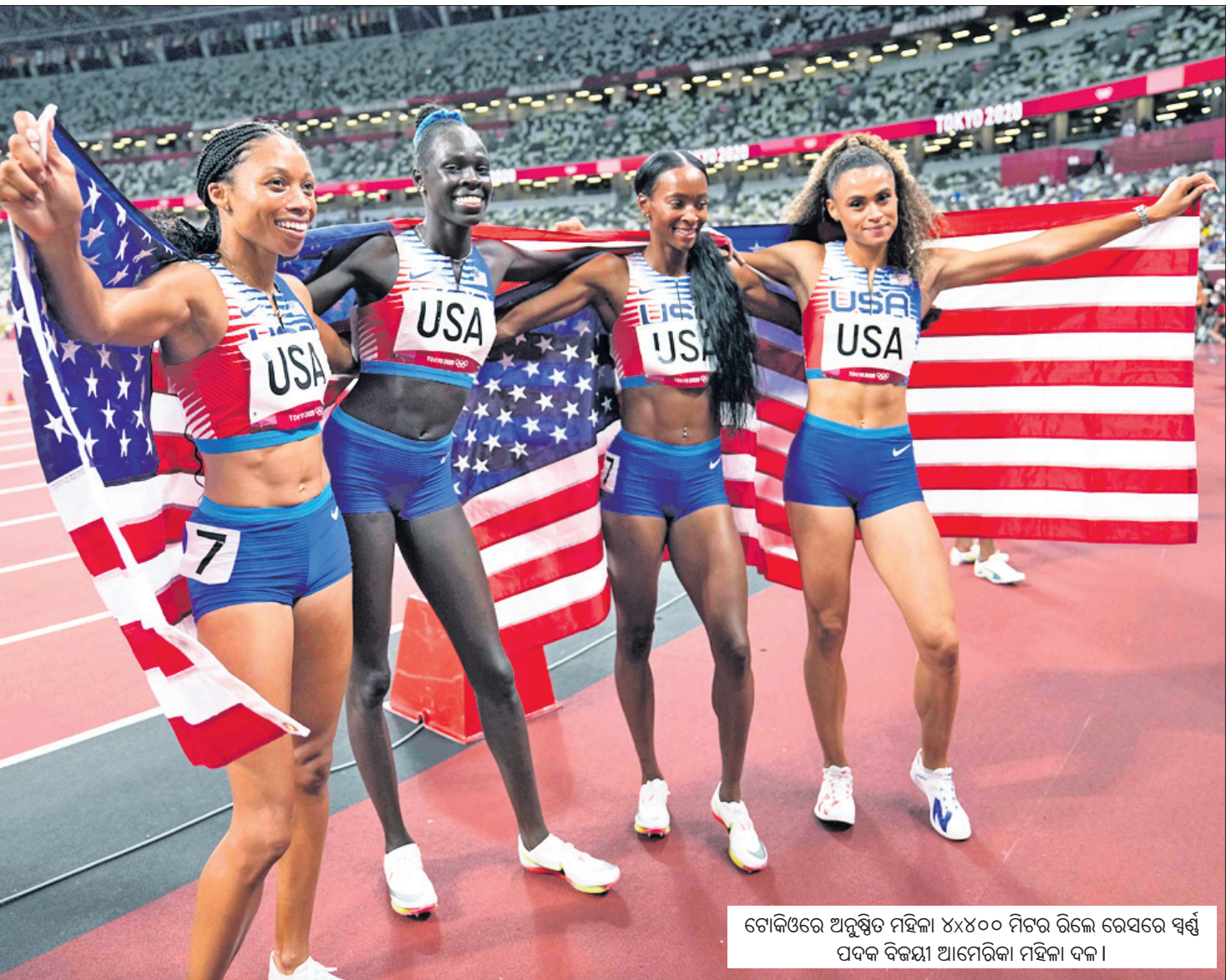
ଟୋକିଓରେ ଅନୁଷ୍ଠିତ ମହିଳା ୪x୪୦୦ ମିଟର ରିଲେ ରେସରେ ସ୍ୱର୍ଣ୍ଣ ପଦକ ବିଜୟୀ ଆମେରିକା ମହିଳା ଦଳ।

ଟୋକିଓ, ୭୮ (ପି.ଟି.) ରେସ୍‌ଲିଂ ବଜରଙ୍ଗ ପୁନିଆ ଅଲିମ୍ପିକ୍ ବ୍ରୋଞ୍ଜ ଜିତିବା ପରେ ତାଙ୍କ ପ୍ରତି ଅଭିନନ୍ଦନର ପୁଅ ଛୁଟିବାରେ ଲାଗିଛି। ରାଷ୍ଟ୍ରପତି ରାମନାଥ କୋବିନ୍ଦ ଓ ପ୍ରଧାନମନ୍ତ୍ରୀ ନରେନ୍ଦ୍ର ମୋଦି ମଧ୍ୟ ଶୁଭେଚ୍ଛା ଜ୍ଞାପନ କରିଛନ୍ତି। ଭାରତୀୟ ରେସ୍‌ଲିଂ ପାଇଁ ଏହା ଏକ ସ୍ୱତନ୍ତ୍ର ମୁହୂର୍ତ୍ତ ବୋଲି ରାଷ୍ଟ୍ରପତି ରୁଇଟ୍ କହିଛନ୍ତି। ସେ କହିଛନ୍ତି, ବଜରଙ୍ଗ ଜଣେ ପ୍ରତିଭାସମ୍ପନ୍ନ ରେସ୍‌ଲର। ସେ ବର୍ଷ ବର୍ଷ ଧରି ସ୍ଥିର ପ୍ରଦର୍ଶନ କରି ଆସୁଛନ୍ତି। ତାଙ୍କର ଏହି ସଫଳତା ଦେଶବାସୀଙ୍କ ଲାଗି ଖୁସି ଆଣି ଦେଇଛି। ପ୍ରଧାନମନ୍ତ୍ରୀ ମୋଦି କହିଛନ୍ତି, ବ୍ରୋଞ୍ଜ ସଫଳତା ଯୋଗୁ ବଜରଙ୍ଗ ପ୍ରତ୍ୟେକ ଭାରତୀୟଙ୍କୁ ଗର୍ବିତ କରିବା ସହ ଆନନ୍ଦିତ କରିପାରିଛନ୍ତି। ୨୦୦୮ ଅଲିମ୍ପିକ୍ ସ୍ୱର୍ଣ୍ଣ ବିଜୟୀ ଶୁଭେଚ୍ଛା ଅଭିନନ୍ଦନ ଦିଆ ବଜରଙ୍ଗଙ୍କ ପ୍ରଭାବୀ ପ୍ରଦର୍ଶନର ଉକ୍ତ ପ୍ରଶଂସା କରିଛନ୍ତି। କ୍ରୀଡ଼ାମନ୍ତ୍ରୀ ଅନୁରାଗ ଠାକୁର କହିଛନ୍ତି, ସେ ନିଜେ ଏହି ମୁକାବିଲାକୁ ଉପଭୋଗ କରିଥିଲେ। ପ୍ରଭାବୀ ପ୍ରଦର୍ଶନ ସହ ଦର୍ଶନୀୟ ଫିନିଶ୍ ଦେଖି ରୋମାଞ୍ଚକ ଥିଲା। କ୍ରିକେଟ ଆଇକନ ସଚିନ ଟେଣ୍ଡୁଲକର କହିଛନ୍ତି ବଜରଙ୍ଗ ଯେପରି ଭାବେ ବିଜୟ ଲାଭ କଲେ ତାହା ଆମମାନଙ୍କୁ ପ୍ରସାଦିତ କରିଦେଇଥିଲା।