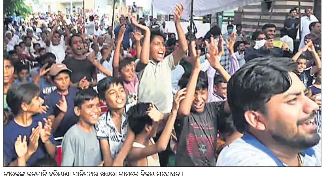
ନୀରଜଙ୍କ ଜନ୍ମଦିନ ହରିୟାଣା ପାଳିପଡାରେ ଖଣ୍ଡା ଗ୍ରାମରେ ବିଭବ ସମାବେଶ।