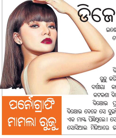
ପର୍ନୋଗ୍ରାଫି ମାମଲା ରୁଜୁ