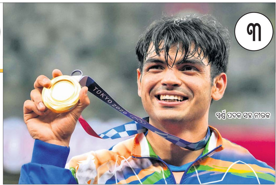
ସର୍ବ ପଦକ ସହ ନୀରଜ

ଜିମ୍ ଜାତି ଜାଭେଲିନ ଥିବା ଆରମ୍ଭ କରିଥିବା ନୀରଜ ଚୋପ୍ରା ଦିନେ ଭାରତ ପାଇଁ ଆଥଲେଟିକ୍ସରେ ପ୍ରଥମ ଅଲିମ୍ପିକ୍ସ ପଦକ ହାସଲ କରିବେ ବୋଲି କେହି ଭାବି ନ ଥିଲେ। ତଳିତ ୨୦୨୧ ଚୋକିଓ ଅଲିମ୍ପିକ୍ସରେ ପ୍ରଥମଥର ଅଂଶଗ୍ରହଣ କରି ଜାଭେଲିନରେ ସର୍ବ ପଦକ ହାସଲ କରି ନୀରଜ ଇତିହାସ ସୃଷ୍ଟି କରିଛନ୍ତି। ସେ ଚୋକିଓ ଫାଇନାଲରେ ୮୭.୫୮ ମିଟର ଜାଭେଲିନ ଥିବା କରି ସର୍ବମୁଖ୍ୟ ସଫଳତା ହାସଲ କରିଥିଲେ ମଧ୍ୟ ତାଙ୍କ ବ୍ୟକ୍ତିଗତ ଶ୍ରେଷ୍ଠ ପ୍ରଦର୍ଶନ ୮୮.୦୭ ମିଟର ରହିଛି। ପଦାର୍ପଣରେ ଅଲିମ୍ପିକ୍ସ ସର୍ବ ପଦକ ହାସଲ କରିଥିବାକୁ ତାଙ୍କର ଏହି ସଫଳତା ଭାରତୀୟ କ୍ରୀଡ଼ା ପାଇଁ ଏକ ଶୁଭ ସୂଚନା ବୋଲି ବିବେଚନା କରାଯାଉଛି।