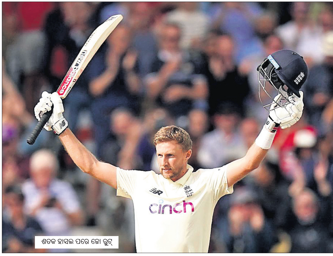
ଶତକ ହାସଲ ପରେ ଜୋ ରୁଟ୍

ନଟିଂହାମ, ୭୮ ଚେଷ୍ଟ ଟ୍ରିକ୍‌ରେ ଭାରତ ଓ ଘରୋଇ ଇଂଲଣ୍ଡ ମଧ୍ୟରେ ଚାଲିଥିବା ପ୍ରଥମ ଚେଷ୍ଟ ମ୍ୟାଚ୍ ଏବେ ରୋମାଞ୍ଚକ ମୋଡ଼ରେ ନେବାକୁ ଯାଉଛି। ଦ୍ୱିତୀୟ ଇନିଂସରେ ଇଂଲଣ୍ଡ ଅଧିନାୟକ ଜୋ ରୁଟ୍ ଶତକୀୟ ଇନିଂସ ଖେଳି ଭାରତୀୟ ବୋଲରଙ୍କୁ ନିରାଶ କରିଛନ୍ତି। ପ୍ରଥମ ଇନିଂସରେ ପଛରେ ପଡିଥିବା ଇଂଲଣ୍ଡ ଦ୍ୱିତୀୟ ଇନିଂସରେ