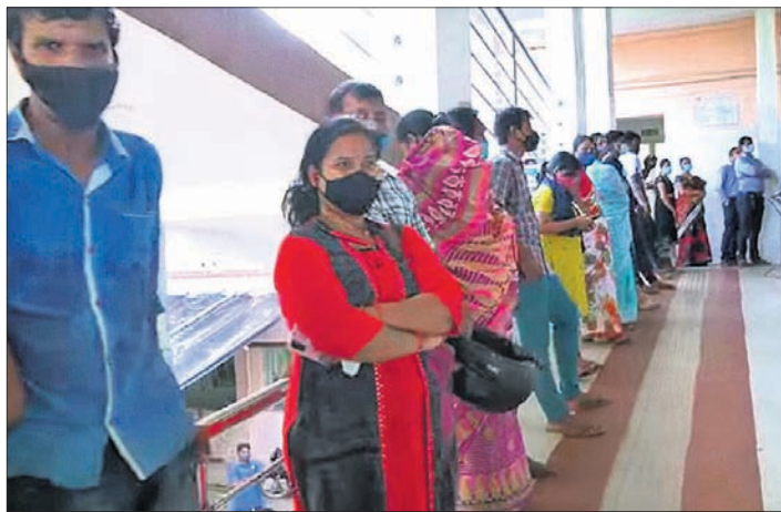
ଅଗଷ୍ଟ ୬ରେ ବିଏମ୍ସି ହସ୍ପିଟାଲରେ କରୋନା ଟିକା ନେବାକୁ ଅପେକ୍ଷା କରିଥିବା ଭୁବନେଶ୍ୱରବାସୀ

ରାଜଧାନୀ ଭୁବନେଶ୍ୱରରେ ଶତପ୍ରତିଶତ ଟିକାକରଣ ହୋଇଥିବାନେଇ ଗତ ୩୧ ତାରିଖରେ ଭୁବନେଶ୍ୱର ମହାନଗର ନିଗମ(ବିଏମ୍ସି) ପକ୍ଷରୁ ସୂଚନା ଦିଆଯାଇଥିଲା । ହେଲେ ବାସ୍ତବ ଚିତ୍ର କିନ୍ତୁ ଭିନ୍ନ । ଏବେ ବି ସହରର ଟିକାକରଣ କେନ୍ଦ୍ର ସମ୍ମୁଖରେ ଲୋକଙ୍କ ଭିଡ଼ ଦେଖିବାକୁ ମିଳୁଛି । ଏପରିକି ଅନେକ ଟିକା ନେଇ ନଥିବା ପ୍ରକାଶ କରୁଛନ୍ତି । କେଉଁ ତଥ୍ୟ ଆଧାରରେ ବିଏମ୍ସି କର୍ତ୍ତୃପକ୍ଷ ଏଭଳି ସୂଚନା ଦେଲେ ତାହା ଟିକା ନେଇ ନ ଥିବା ଲୋକମାନେ ପ୍ରଶ୍ନ କରୁଛନ୍ତି । ଭୁବନେଶ୍ୱର ବାସୀଙ୍କୁ ଟିକାକରଣ ସମ୍ପର୍କରେ ଧରିତ୍ରୀ ପକ୍ଷରୁ ଅଗଷ୍ଟ ୬ତାରିଖ ଶୁକ୍ରବାର ବିଭିନ୍ନ ଲୋକଙ୍କୁ ଭେଟି ସେମାନଙ୍କ ପ୍ରତିକ୍ରିୟା ନିଆଯାଇଥିଲା । ଏପରି କି