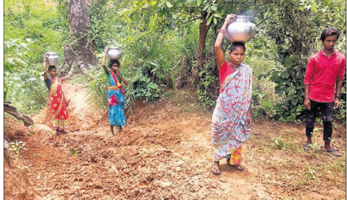
ମହିଳାମାନେ ଝରଣାରୁ ପାଣି ସଂଗ୍ରହ କରି ନେଉଛନ୍ତି।

ରାୟଗଡ଼ା ଜିଲ୍ଲା ଚନ୍ଦ୍ରପୁର ବ୍ଲକ ଡାକଟିମୁଣ୍ଡି ପଞ୍ଚାୟତର ଡାକଟିମୁଣ୍ଡି ଗ୍ରାମ। ଗାଁରେ ୧୦୦ ଉର୍ଦ୍ଧ୍ୱ ଆଦିବାସୀ ପରିବାର ବସବାସ କରୁଛନ୍ତି। ପଞ୍ଚାୟତ କାର୍ଯ୍ୟାଳୟଠାରୁ ମାତ୍ର ୫ କି.ମି. ଦୂରରେ ରହିଛି ଏହି ଗାଁ।