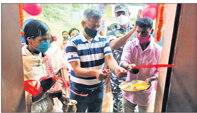
ଜିଲ୍ଲାପାଳ ଚଷ୍ମା ପରୀକ୍ଷାର ଶୁଭାରମ୍ଭ କରୁଛନ୍ତି।

ରାୟଗଡ଼ା ଜିଲ୍ଲା କଲ୍ୟାଣସିଂହପୁର ବ୍ଲକ ପାର୍ଯ୍ୟାୟ ପଞ୍ଚାୟତର ଚୁକ୍ତିନି ଗ୍ରାମରେ ଆଦିମ ଜନଜାତି ତଙ୍ଗରିଆଙ୍କ ବିନା ମୂଲ୍ୟରେ ଚଷ୍ମା ପରୀକ୍ଷା, ଚିକିତ୍ସା ଓ ଅସ୍ତ୍ରୋପଚାର ନିମନ୍ତେ ଓଡ଼ିଶା ଆଦିବାସୀ ଚଷ୍ମା ଅଧ୍ୟୟନ ଗବେଷଣା ପ୍ରକଳ୍ପ ଶୁକ୍ରବାର ଆରମ୍ଭ ହୋଇଛି।