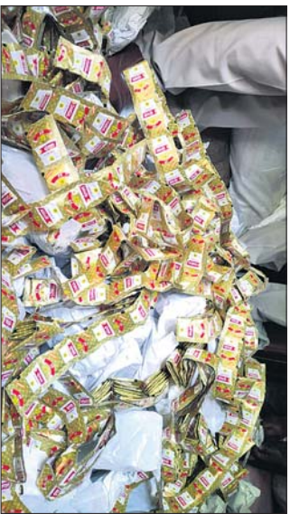
ମୁକାମେଶ୍ୱର ଗ୍ରାମରେ ଥିବା କାରଖାନାରୁ ଜବତ ନକଲି ସାମଗ୍ରୀ।