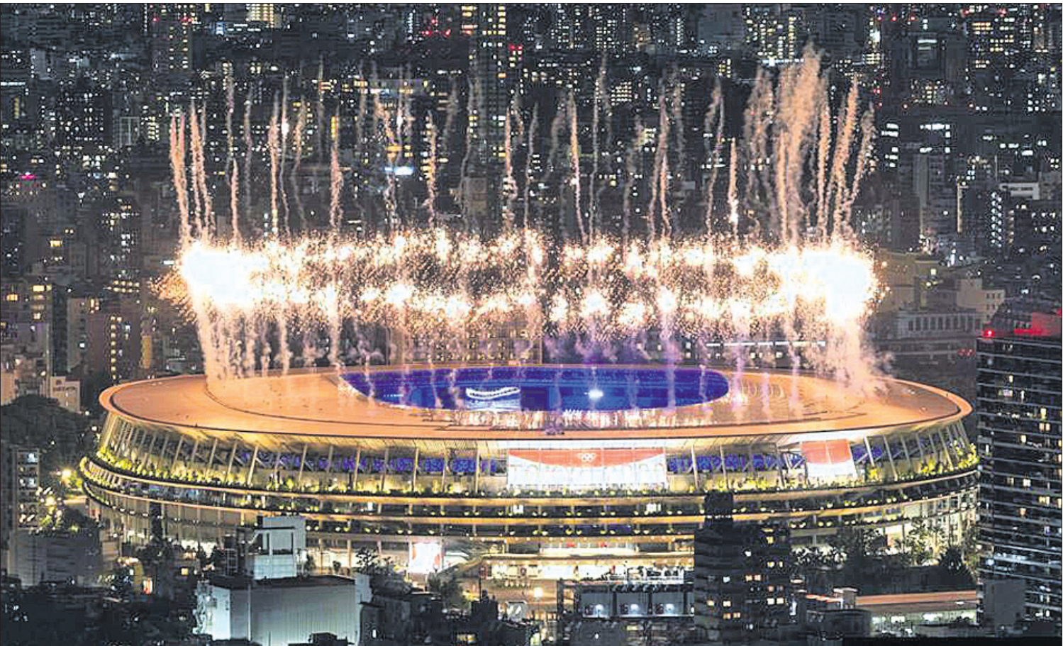
ଗୋକିଠି ଅଲିମ୍ପିକ୍ ଉଦ୍‌ଯାପନା ଉତ୍ସବରେ ରବିବାର ନ୍ୟାଶନାଲ ଷ୍ଟାଡ଼ିୟମରେ ଅନୁଷ୍ଠିତ ଆତସବାହି କାର୍ଯ୍ୟକ୍ରମ ।