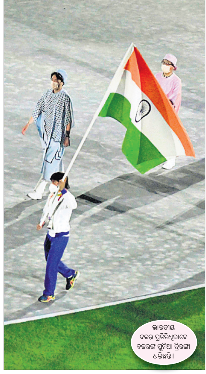
ଭାରତୀୟ ଦଳର ପ୍ରତିନିଧିତ୍ୱରେ ବଜ୍ରରଙ୍ଗ ପୁନି ରାଜା ଧରିଛନ୍ତି।