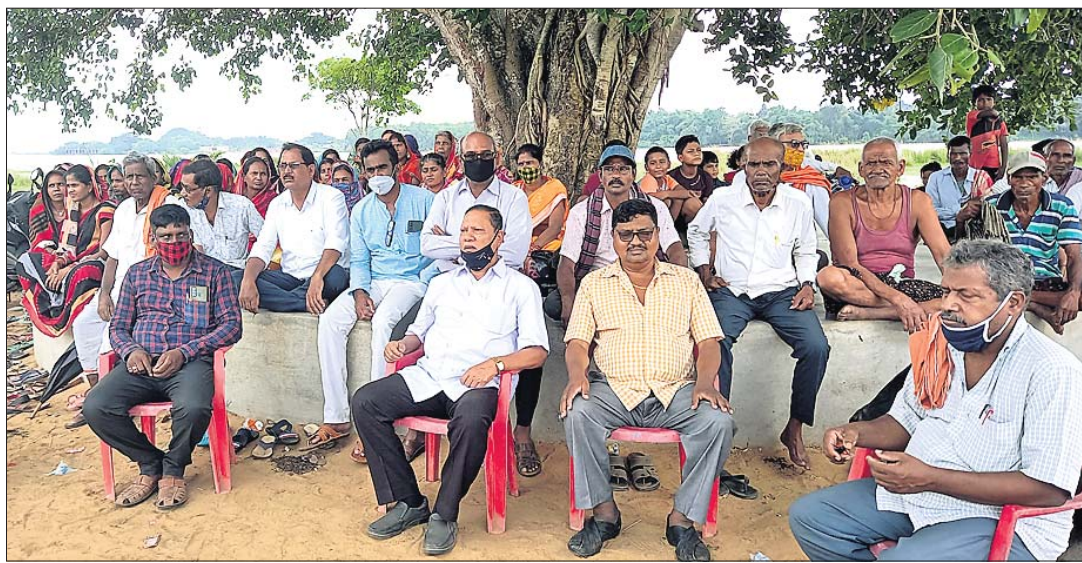
ବରୁଣାପଡ଼ାରେ ପ୍ରକଳ୍ପକୁ ବିରୋଧ ଲାଗି ଏକତ୍ର ହୋଇଥିବା ରାଜକନିକାବାସୀ।

କେନ୍ଦ୍ରାପଡ଼ା ଜିଲ୍ଲା ରାଜକନିକା ବ୍ଲକ୍ ବରୁଣାପଡ଼ା ନିକଟ ଖରସୁଡ଼ା ନଦୀରୁ ଉତ୍ପନ୍ନ ଠୁଳକୁ ପାଣିଦେବା ପ୍ରସଙ୍ଗରେ ଅଞ୍ଚଳବାସୀଙ୍କ ତୀବ୍ର ବିରୋଧ ଯୋଗୁ ୨୦୨୦ ଡିସେମ୍ବରରୁ ବନ୍ଦ ରହିଥିଲା।