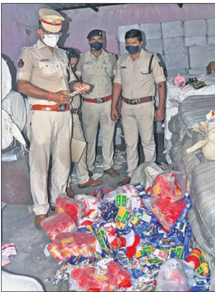
କଟକ ମାଲଗୋଦାମ ଅଞ୍ଚଳର ଗୋଦାମରେ ପୋଲିସର ଚଢ଼ାଉ।