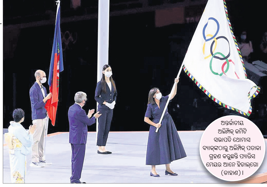
ଅନ୍ତର୍ଜାତୀୟ ଅଲିମ୍ପିକ୍ କମିଟି ସଭାପତି ଥୋମାସ ବ୍ୟାକ୍‌କଠାରୁ ଅଲିମ୍ପିକ୍ ପତାକା ଗ୍ରହଣ କରୁଛନ୍ତି ପ୍ୟାରିସ ମେୟର ଆନେ ହିଟାଲଗୋ (ଡାହାଣ)।