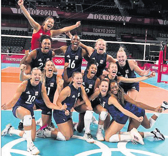
ସ୍ୱର୍ଣ୍ଣ ପଦକ ବିଜୟୀ ଆମେରିକା ମହିଳା ଭଲିବଲ୍ ଦଳ।

କୋର୍ଟ ଦାୟିତ୍ୱ ଗ୍ରହଣ କରିଥିଲେ। ଆମେରିକା ମହିଳା ଦଳକୁ ଅଲିମ୍ପିକ୍ସ ଚାମ୍ପିୟନ କରାଇ ପାରିଥିବାରୁ ତାଙ୍କର ଏକ ଲକ୍ଷ୍ୟ ପୂରଣ ହୋଇଛି ବୋଲି କିରାଲି କହିଛନ୍ତି। ସୂଚନାଯୋଗ୍ୟ, ଆର୍ଜେଣ୍ଟିନାଠାରୁ ପରାସ୍ତ ହୋଇଛି।