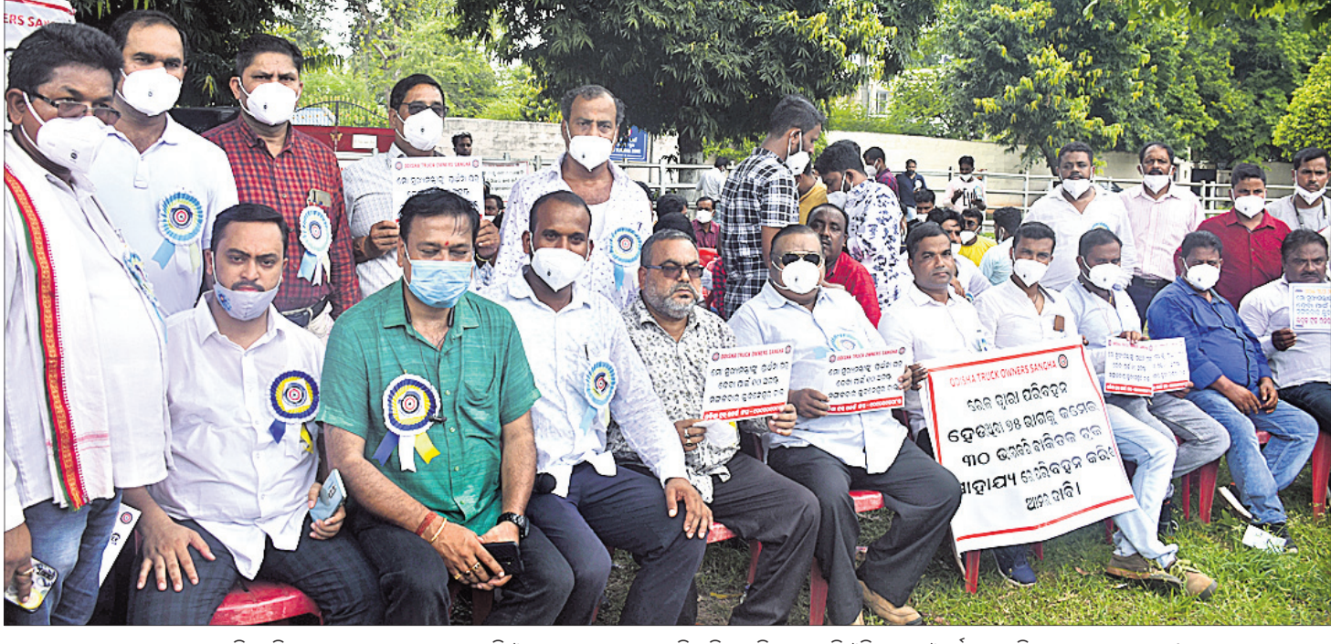
କୁଚନେଶ୍ୱର ପିଏମ୍‌ଜିରେ ମଙ୍ଗଳବାର ଖୋଳ, ଭଡ଼ା ବୁଦ୍ଧି ଓ ଜବରଦସ୍ତ ବ୍ରକ୍ ଛଡ଼ାଇ ନିଆଯିବାକୁ ବିରୋଧ କରି ଓଡ଼ିଶା ଟ୍ରିକ୍ ଓନର୍ସ ଆସୋସିଏସନ ପକ୍ଷରୁ ଧାରଣା।