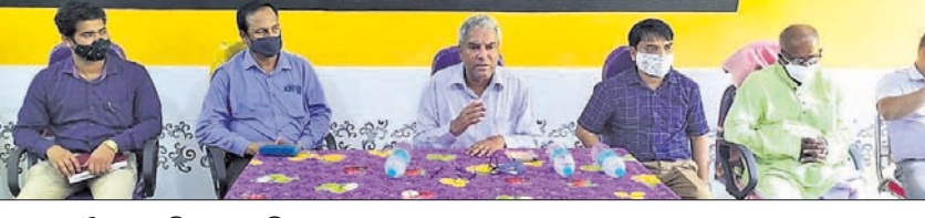
ସମୀକ୍ଷା ବୈଠକରେ ବିଧାୟକ ଅଶ୍ୱିନୀ କୁମାର ପାତ୍ରଙ୍କ ସହ ଅନ୍ୟ ଅଧିକାରୀ।