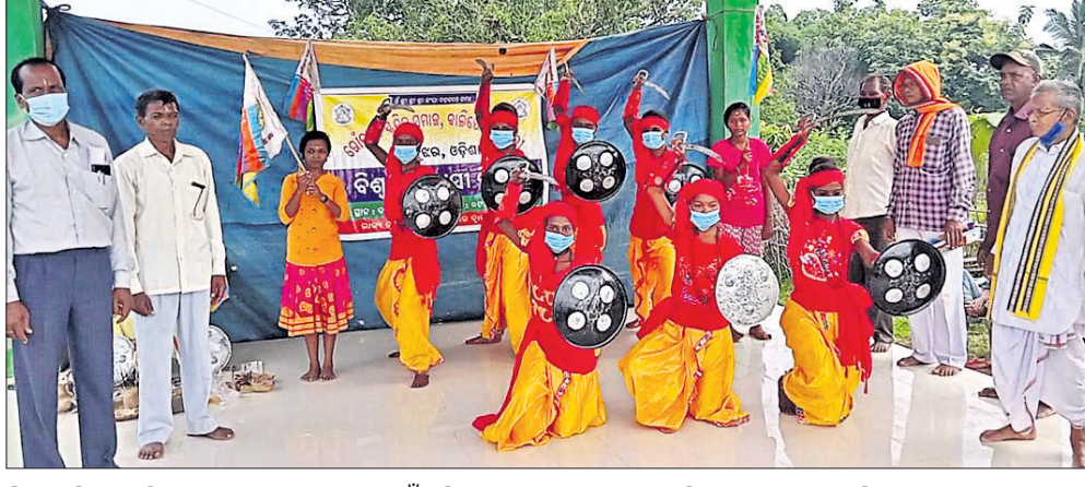
ବିଶ୍ୱ ଆଦିବାସୀ ଦିବସ ପାଳନ ଅବସରରେ ଗୌଡ଼ ଶିଳ୍ପୀଙ୍କ ଦ୍ୱାରା ଖଣ୍ଡା ନୃତ୍ୟ ପରିବେଷଣ କରାଯାଇଛି।