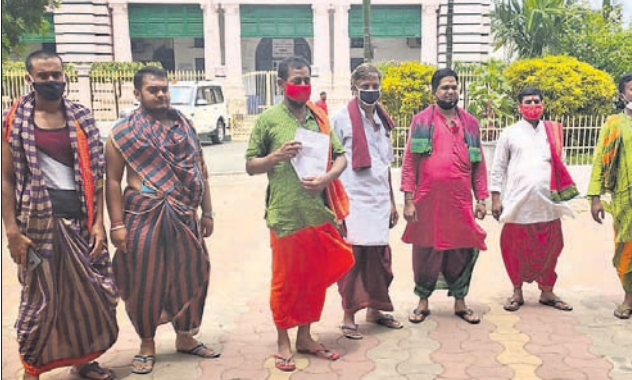
ଜିଲ୍ଲାପାଳଙ୍କୁ ଦାବିପତ୍ର ଦେବାକୁ ଆସିଥିବା ମନ୍ଦିର ପୂଜକ