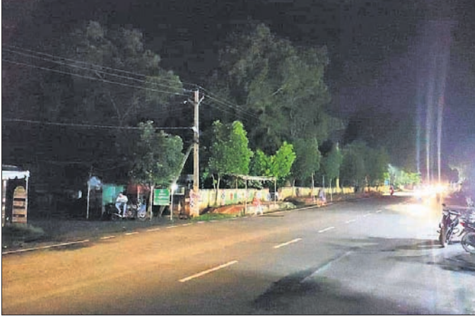
ସହରରେ ଜଳୁ ନ ଥିବା ଷ୍ଟିର୍ ଲାଇଟ

ମୟୂରଭଞ୍ଜ ଜିଲ୍ଲାର ପୌର ଓ ବିଜ୍ଞାପିତ ପରିଷଦ ଅଞ୍ଚଳରେ ଆଲୋକାକରଣ ପାଇଁ କୋଟି କୋଟି ଟଙ୍କା ଖର୍ଚ୍ଚ କରାଯାଇଛି। ମାତ୍ର ରକ୍ଷଣାବେକ୍ଷଣ ଅଭାବରୁ ୫ ହଜାର ଷ୍ଟିର୍ ଲାଇଟ ଜଳୁ ନାହିଁ। ଏହାର ସୁଯୋଗରେ ଅସାମାଜିକ କାର୍ଯ୍ୟକଳାପ ବୃଦ୍ଧି ପାଇଛି। ସହରବାସୀ ଦେଉଥିବା ହୋଲିଡ଼ି ଟ୍ୟାକ୍ସ କାମରେ ଲାଗୁ ନ ଥିବାରୁ ଅସବୋଧ ଦେଖାଦେଇଛି। ଜିଲ୍ଲାର ବାରିପଦା ମ୍ୟୁନିସିପାଲିଟି ଅଧୀନ ୨୮ ଖର୍ଚ୍ଚରେ ୨ଲକ୍ଷରୁ ଉର୍ଦ୍ଧ୍ୱ ଲୋକ ବାସ କରୁଛନ୍ତି। କେନ୍ଦ୍ର ସରକାରଙ୍କ ଯୋଜନା ଏନର୍ଜି ଏଫିସିଏନ୍ସି ସର୍ଭିସ ଲିମିଟେଡ଼ (ଇଇଏଏସ୍‌ଏଲ୍) ଜରିଆରେ ଆସ୍ଥା ସଂସ୍ଥା ପକ୍ଷରୁ ୨୦୧୪-୧୫ରେ ଆଲୋକାକରଣ ପାଇଁ ୪୫୦୦ ଏଲଇଡି ଷ୍ଟିର୍ ଲାଇଟ ବ୍ୟବସ୍ଥା କରାଯାଇଥିଲା। ସମସ୍ତ ଖର୍ଚ୍ଚର ମୁଖ୍ୟ ରାସ୍ତାରେ ୩୫ ଖର୍ଚ୍ଚରୁ ଆରମ୍ଭ କରି ୧୧୦ଖର୍ଚ୍ଚ ପର୍ଯ୍ୟନ୍ତ ଏଲଇଡି ଷ୍ଟିର୍ ଲାଇଟ ଲଗାଯାଇଛି। ଏହାର ମରାମତି ପାଇଁ ପରିଚାଳନା ଦାୟିତ୍ୱରେ ଥିବା ସଂସ୍ଥା ପକ୍ଷରୁ ଜିଲ୍ଲାରେ ଜଣେ ମାତ୍ର ଟେକ୍ନିସିଆନ ରହିଛନ୍ତି। ଲାଇଟ୍‌ଗୁଡ଼ିକ କଣ୍ଟ୍ରୋଲ କରିବା ପାଇଁ ବାରିପଦା ମ୍ୟୁନିସିପାଲିଟିରେ