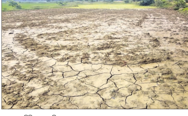
ଶୁଖିଲା ପଡ଼ିଛି ଚାଷ ଜମି।

ଚାଷୀ ବହୁଳ ଡେଲକୋଇ ଅଞ୍ଚଳରେ ବର୍ଷାର ଅଭାବ ଯୋଗୁ ଅଧିକାଂଶ ଜମି ଶୁଖିଲା ପଡ଼ିଛି । ଧାନ, ଚୁଆ ବିହୁଡ଼ା ଅଧାରେ ରହିଛି। ଚାଷୀ ମାନେ ଧାନ କରଜ କରି ଧାନ ବିହନ, ସାର, ଔଷଧ ଆଣିଥିବାରୁ ଏବେ ଚିକିତ୍ସାରେ ପଡ଼ିଛନ୍ତି। ମୌସମୀ ବର୍ଷା ଓ ଲଘୁତାପ ବର୍ଷା ଏହି ଅଞ୍ଚଳରେ ଯଯାଏ ସକ୍ରିୟ ହୋଇପାରିନାହିଁ। କୃଷି ବିଭାଗ ସୂଚନା ଅନୁଯାୟୀ ଏହି ଅଞ୍ଚଳରେ ୧୬ ହଜାର ହେକ୍ଟରରୁ ଅଧିକ ଚାଷ ଜମି ରହିଛି। ସେହିପରି ୧୨ଟି କ୍ଷୁଦ୍ର ଜଳସେଚନ ବାସନ୍ତୀ ରାସ୍ତାର କୋଷ୍ଠା ନିକଟରେ ପ୍ରାୟତଃ ଚାଷ ଉପରେ ନିର୍ଭର କରିଥାନ୍ତି। ୧୯୯୯-୨୦ ମସିହାରେ ଅଗଷ୍ଟ ମାସ ସୁଦ୍ଧା ୪୪ ମି.ମି. ବର୍ଷା ହୋଇଥିବା ବେଳେ ଚଳିତ ବର୍ଷ ମାତ୍ର ୨୨ ମି.ମି. ବର୍ଷା ହୋଇଥିବା କୃଷି ବିଭାଗ ପକ୍ଷରୁ ସୂଚନା