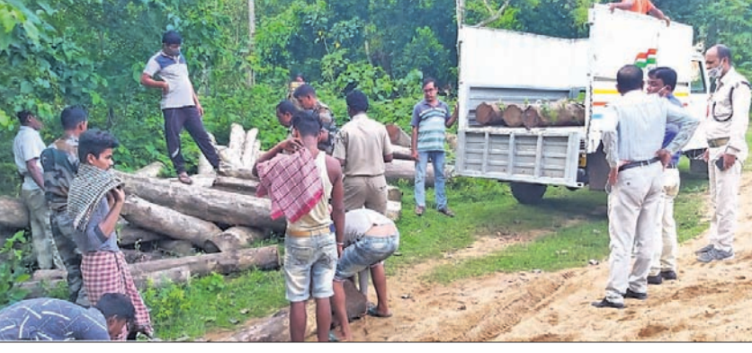
କାଠଗୁଡ଼ିକୁ ଜବତ କରି ନିଆଯାଇଛି।