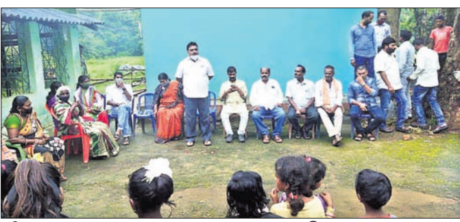
ବୈଠକରେ ମନ୍ତ୍ରୀଙ୍କ ସମେତ ଅନ୍ୟମାନେ ଆଲୋଚନା କରୁଛନ୍ତି ।