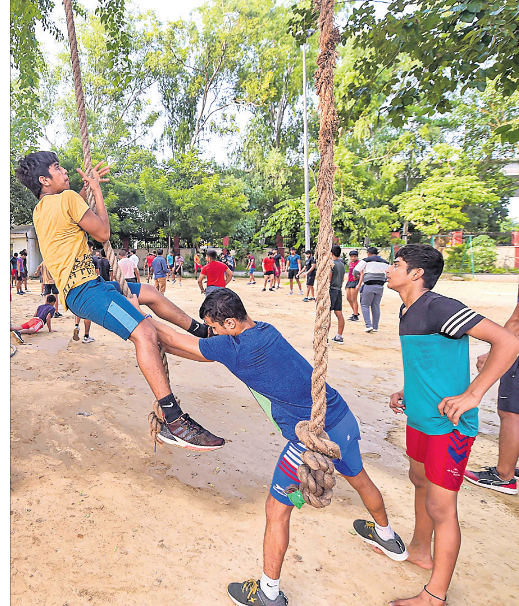
ନ୍ୟୁଆଇଲାସ୍ଥିତ ଛତ୍ରସାଲ କ୍ଷୁଦ୍ରିତମରେ ରେଭ୍‌କମାନଙ୍କୁ ଚାଲିମ ଦିଆଯାଉଛି।

ନ୍ୟୁଆଇଲା, ୧୦୮ (ପି.ଟି.): ଭାରତୀୟ ଆର୍ମିର 'ମିଶନ ଅଲିମ୍ପିକ୍ ଫ୍ରେଜ୍' ଅଧ୍ୟାନରେ ବର୍ତ୍ତମାନ ୪୫୦ରୁ ଅଧିକ ସିନିୟର ଆଥଲେଟ ଟ୍ରେନିଂ ନେଉଛନ୍ତି ବୋଲି ଜଣେ ସିନିୟର ଅଧିକାରୀ କହିଛନ୍ତି। ଇଣ୍ଡିଆନ୍ ସ୍ପୋର୍ଟସ୍ ନାଉଟ୍ ୨୦୧୬ ମେ'ରେ ଆର୍ମିରେ ଯୋଗଦେବା ପରଠାରୁ ମିଶନ ଅଲିମ୍ପିକ୍ ଫ୍ରେଜ୍ ଅଧ୍ୟାନରେ ଟ୍ରେନିଂ ନେବା ଲାଗି ମନୋନୀତ ହୋଇଥିଲେ। ଗୋଟିଏ ଅଲିମ୍ପିକ୍ସରେ ସେ ସ୍ୱର୍ଣ୍ଣ ପଦକ ଜିତିଛନ୍ତି। 'ମିଶନ ଅଲିମ୍ପିକ୍ ଫ୍ରେଜ୍' ଭାରତୀୟ ଆର୍ମିର ଏକ ସ୍ୱତନ୍ତ୍ର କାର୍ଯ୍ୟକ୍ରମ। ଏଥିରେ ୧୧ଟି ଖେଳର ଉଦ୍‌ଯାତନା ଜ୍ରାଡ଼ାବିରୁଦ୍ଧ ଚିହ୍ନ କରାଯାଇ ବିଜିତ କାମ୍ୟ ଓ ଅନ୍ତର୍ଜାତୀୟ ପ୍ରତିଯୋଗିତା ପାଇଁ ସେମାନଙ୍କୁ ଟ୍ରେନିଂ ଦିଆଯାଇଥାଏ। ଆର୍ମି ଅଧିକାରୀଙ୍କ କହିବା ଅନୁସାରେ ମିଶନ ଅଲିମ୍ପିକ୍ ଫ୍ରେଜ୍ରେ ୫ଟି ନୋଡ୍ ରହିଛି। ସେଗୁଡ଼ିକ ହେଲା ରୋଲ୍ ନୋଡ୍, ମାର୍କମ୍ୟାନସିପ୍ ନୋଡ୍ (ଶୁଭରମାନଙ୍କ ଲାଗି), ଇକ୍ସ୍ଟ୍ରିମାନ୍ ନୋଡ୍, ସେଲିଂ ନୋଡ୍ ଏବଂ ଆର୍ମି ହୋର୍ଡ୍ ଇନ୍‌ସ୍ପିରାସନ୍ (ଏସ୍‌ଏଆଇ)। ଏସ୍‌ଏଆଇ ୬ଟି ବିଭାଗ ଯଥା ଆଥଲେଟିକ୍ସ, ଆର୍ଟିଷ୍ଟି, ବକ୍ସିଂ, ରେଭ୍‌ଲିଂ, ଫ୍ରେଜିଲିଟି, ଫେନ୍‌ସିଂ ଓ ଡାଇଭିଂରେ ୨୦୦ରୁ ଅଧିକ ସିନିୟର ଆଥଲେଟଙ୍କୁ ଟ୍ରେନିଂ ଦିଆଯାଇଥାଏ। ପ୍ରାୟ ୧୦୦ରୁ ଅଧିକ ମାର୍କମ୍ୟାନସିପ୍ ନୋଡ୍‌ରେ ଟ୍ରେନିଂ ନେଉଛନ୍ତି। ରୋଲ୍ ନୋଡ୍, ସେଲିଂ ନୋଡ୍ ଓ ଇକ୍ସ୍ଟ୍ରିମାନ୍ ନୋଡ୍‌ରେ ବର୍ତ୍ତମାନ ଯଥାକ୍ରମେ ୯୦, ୫୦ ଓ ୧୦ ସିନିୟର ଆଥଲେଟ ଟ୍ରେନିଂ ନେଉଛନ୍ତି।