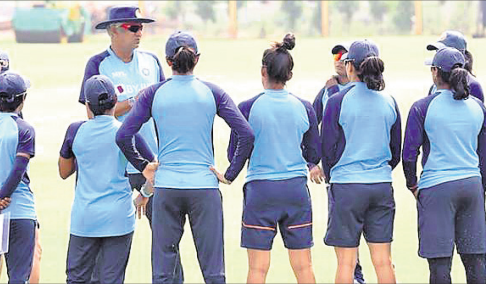
ନ୍ୟୁଆଇଲା, ୧୦୮ (ପି.ଟି.)

ଭାରତୀୟ ମହିଳା କ୍ରିକେଟ ଦଳ ଆସନ୍ତା ସେପ୍ଟେମ୍ବର-ଅକ୍ଟୋବରରେ ଅଷ୍ଟ୍ରେଲିଆ ତୁରରେ ଯିବ। ଟ୍ରେନିଂ କ୍ୟାମ୍ପରେ ଯୋଗଦେବା ଲାଗି ଖେଳାଳିମାନେ ବେଙ୍ଗାଲୁରୁରେ ପହଞ୍ଚିବାରେ ଲାଗିଲେଣି। ପୂର୍ଣ୍ଣାଙ୍ଗ ରୁର୍ ପାଇଁ ଯଦିଓ ଖେଳାଳି ଯୋଷଣା କରାଯାଇ ନାହିଁ, ମଙ୍ଗଳବାର ସନ୍ଧ୍ୟା ସୁଦ୍ଧା ୩୦ କ୍ରିକେଟରଙ୍କୁ ବେଙ୍ଗାଲୁରୁରେ ପହଞ୍ଚିବା ଲାଗି କୁହାଯାଇଛି। ଛଅ ଦିନ କ୍ୱାରାଣ୍ଟାଇନ୍ରେ ରହିବା ପରେ ଖେଳାଳିମାନେ ଟ୍ରେନିଂ ଆରମ୍ଭ କରିବେ। ବର୍ତ୍ତମାନ ଦି ହେଣ୍ଡେଡ୍ ଟୁର୍ନାମେଣ୍ଟରେ ଭାଗ ନେଉଥିବା ହରମନପ୍ରୀତ କୌର, କୁଚି ମହାନ୍ତ, ଜେମିମା ରୋଡ୍ରିଗ୍ସ୍‌ଏଚ୍,