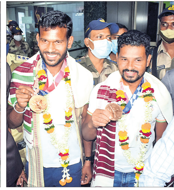
ଭୁବନେଶ୍ୱର ବିମାନ ବନ୍ଦରରେ ମହିଳା ହକି ଅଲିମ୍ପିଆନ ଦୀପଗ୍ରୋସ ଏଙ୍କା, ନମିତା ଚପୋ ଓ ଅଲିମ୍ପିକ୍ ହକି ଟ୍ରୋଫି ପଦକ ବିଜେତା ଅମିତ ରୋହିଦାସ, ବୀରେନ୍ଦ୍ର ଲାଜାଙ୍କୁ ସ୍ୱାଗତ ସମ୍ବର୍ଦ୍ଧନା ଜ୍ଞାପନ କରାଯାଇଛି।