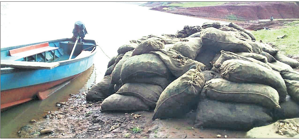
ଚିତ୍ରକୋଣ୍ଡାର ଯନ୍ତାଘାଟରେ ପଢ଼ିରହିଥିବା ବିହନ ବସ୍ତା ।