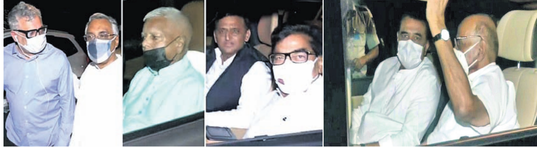
ବରିଷ୍ଠ କଂଗ୍ରେସ ନେତା କପିଳ ସିବଲଙ୍କ ବାସଭବନରେ ଯୋଗଦେଇ ନେତାମାନେ।

କମ୍ପାନିର ଶୁଭେଚ୍ଛା ଜଣାଇବା ପରେ ସେ ସେଠାକୁ ବାହାରିଯାଇଥିଲେ। ସିବଲଙ୍କ ସହ ସାକ୍ଷାତ୍ ପରେ ସେଠାରେ କ'ଣ ହୋଇଥିଲା ତାଙ୍କୁ ଜଣାନାହିଁ। ବିଜେଡି ନିଜ ସମ୍ବନ୍ଧରେ ଆଖିପଛୁଆ ବଜାୟ ରଖିବ। ଭାରତୀୟ ବିରୋଧୀରେ ଏକ ସଂଯୁକ୍ତ ମେଣ୍ଟ ଗଠନ ହେଲେ ଏଥିରେ ବିଜେଡି ସାମିଲ ହେବ ନାହିଁ ବୋଲି ସେ ସମ୍ବେଦ ଦେଇଛନ୍ତି।