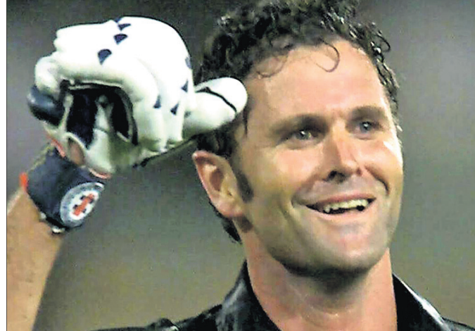
ମେଲବୋର୍ନ, ୧୦୮ (ପି.ଟି.)

ଝେଲିକ୍ସି। ୫୧ ବର୍ଷୀୟ ଏହି ପୂର୍ବତନ ଲୁକ୍ସମାଣ୍ଡର ପୂର୍ବତନ ଅଲରାଉଣ୍ଡର କ୍ରିୟା କେନ୍ଦ୍ରଙ୍କ ସାମ୍ବ୍ୟାବସ୍ଥା ଗୁରୁତର ହୋଇପଡ଼ିଛି। ସେ ଆକର୍ଷକ ବେହୋସ ହୋଇପଡ଼ିବା ପରେ କାନବେରାସ୍ଥିତ ଏକ ହସ୍ପିଟାଲରେ ତାଙ୍କୁ ଲାଲପ୍ ସପୋର୍ଟରେ ରଖାଯାଇଛି। ତାଙ୍କୁ ଖୁବ୍ ଶୀଘ୍ର ସିଡ଼ନରେ ଥିବା ଏକ ସ୍ୱତନ୍ତ୍ର ମାରିନୋ ତରଫରୁ ପ୍ରତିନିଧିତ୍ୱ କରୁଛନ୍ତି। ଦୁଇ ଭାଇଙ୍କୁ ସାନ ମାରିନୋ ନାଗରିକତା ପ୍ରଦାନ କରିଥିଲା। ୨୦୧୯ ବିଶ୍ୱ ଚାମ୍ପିୟନସିପରେ ପଞ୍ଚମ ସ୍ଥାନରେ ରହି ଅଭିଯାନ ଶେଷ କରିଥିଲେ। ଅଲିମ୍ପିକ୍ସ ଉଦ୍‌ଯାତନା ଉପରେ ସାନ ମାରିନୋ ପତାକା ବହନ କରିଥିଲେ।