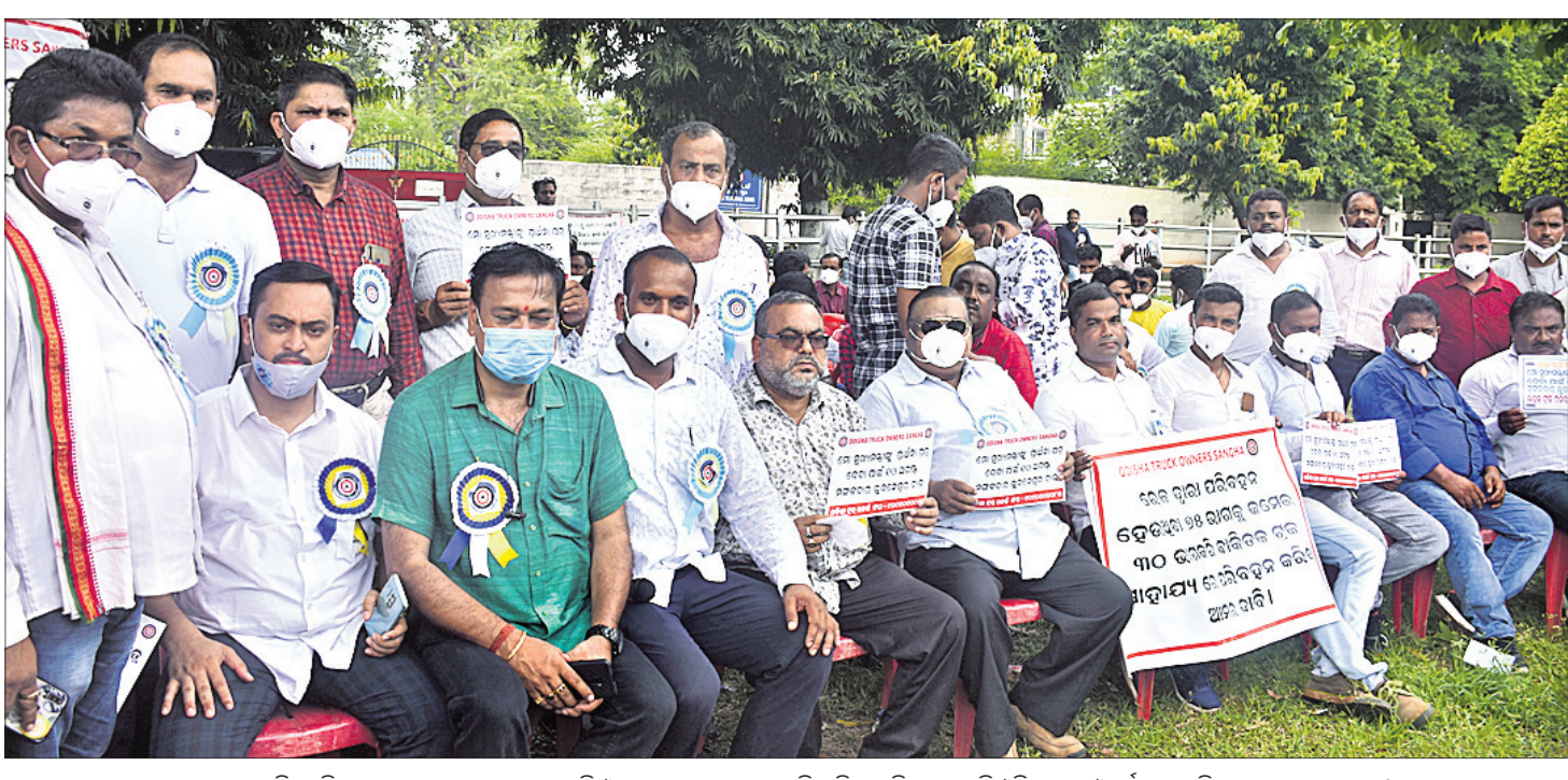
କୁଜନେଶ୍ୱର ପିଏମ୍‌ଜିରେ ମଙ୍ଗଳବାର ଖାଲୁ, ଭଦ୍ରା ବୁଦ୍ଧି ଓ ଜବରଦସ୍ତ ବ୍ରହ୍ମ ଛଡ଼ାଳ ନିଆଯିବାକୁ ବିରୋଧ କରି ଓଡ଼ିଶା ଟ୍ରକ ଓନର୍ସ ଆସୋସିଏସନ ପକ୍ଷରୁ ଧାରଣା।