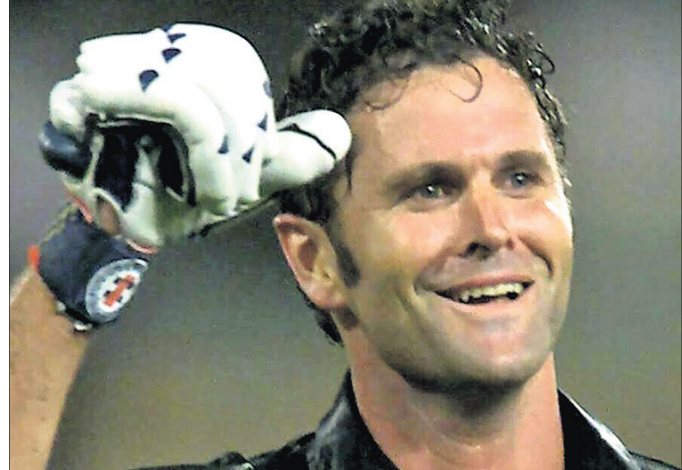
ମେଲବୋର୍ନ, ୧୦୮ (ପି.ଟି.)