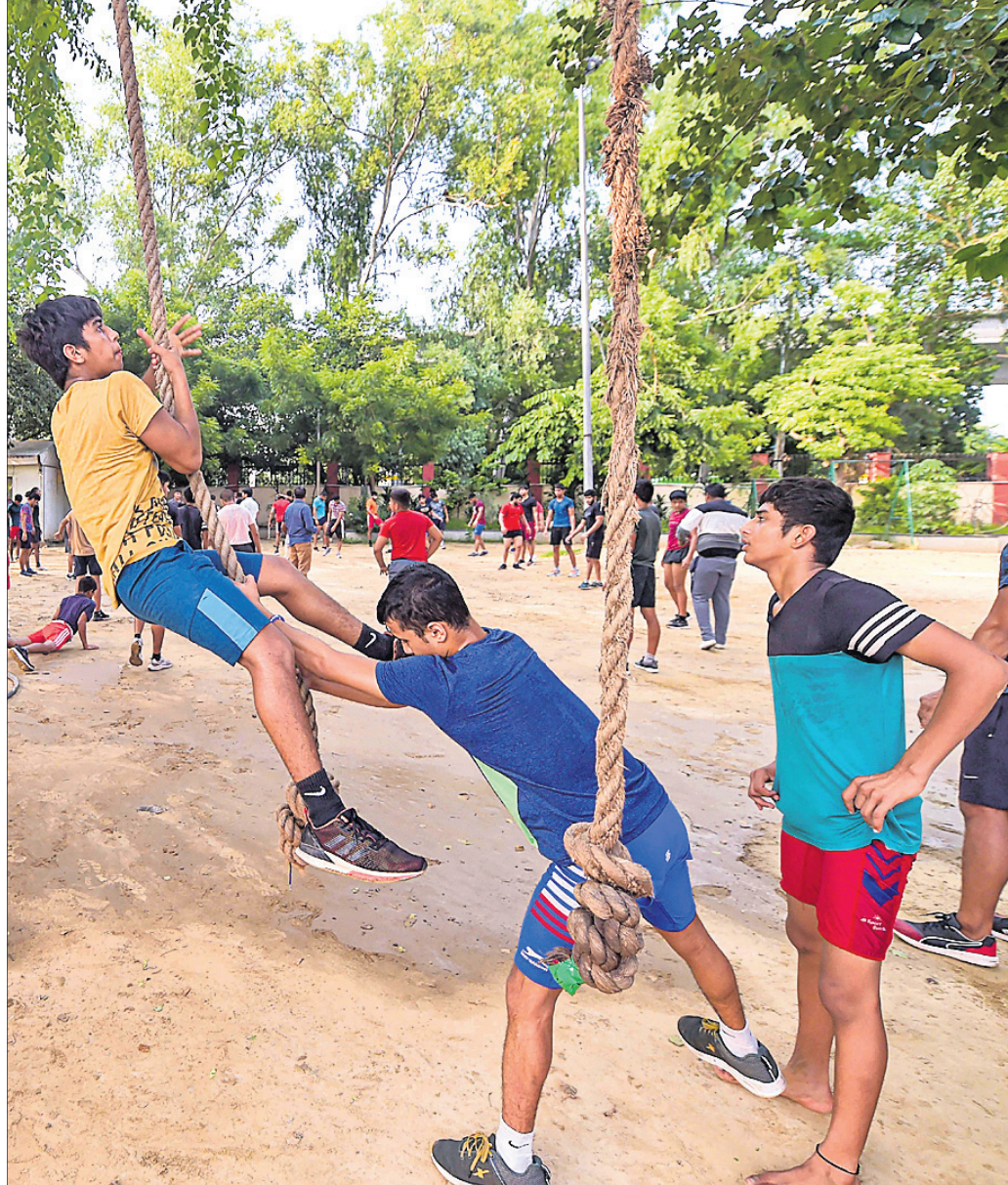
ନୁଆଦିଲ୍ଲାସ୍ଥିତ ଛତ୍ରସାଲ କ୍ଷୁଦ୍ରିତମରେ ରେଭ୍‌ଲିଂ ନୋଡ୍ ଡାଲିମି ଦିଆଯାଇଛି।

ନୁଆଦିଲ୍ଲା, ୧୦୮ (ପି.ଟି.): ଭାରତୀୟ ଆର୍ମିର 'ମିଶନ ଅଲିମ୍ପିକ୍ ଫ୍ରିଜ୍' ଅଧୀନରେ ବର୍ତ୍ତମାନ ୪୫୦ରୁ ଅଧିକ ସିନିୟର ଆଥଲେଟ ଟ୍ରେନିଂ ନେଉଛନ୍ତି ବୋଲି ଜଣେ ସିନିୟର ଅଧିକାରୀ କହିଛନ୍ତି। ଡାଲିମିନ୍ ଫ୍ରିଜ୍‌ର ନୀରବ ଚୋପ୍ରା ୨୦୧୬ ମେ'ରେ ଆର୍ମିରେ ଯୋଗଦେବା ପରଠାରୁ ମିଶନ ଅଲିମ୍ପିକ୍ ଫ୍ରିଜ୍ ଅଧୀନରେ ଟ୍ରେନିଂ ନେବା ଲାଗି ମନୋନୀତ ହୋଇଥିଲେ। ଗୋକିଓ ଅଲିମ୍ପିକ୍ସରେ ସେ ସ୍ୱର୍ଣ୍ଣ ପଦକ ଜିତିଛନ୍ତି। 'ମିଶନ ଅଲିମ୍ପିକ୍ ଫ୍ରିଜ୍' ଭାରତୀୟ ଆର୍ମିର ଏକ ସ୍ୱତନ୍ତ୍ର କାର୍ଯ୍ୟକ୍ରମ। ଏଥିରେ ୧୧ଟି ଖେଳର ଉଦ୍‌ଘାଟନା କ୍ରୀଡ଼ାବିତ୍‌ଙ୍କୁ ଚିହ୍ନ କରାଯାଇ ବିଭିନ୍ନ ଜାତୀୟ ଓ ଅନ୍ତର୍ଜାତୀୟ ପ୍ରତିଯୋଗିତା ପାଇଁ ସେମାନଙ୍କୁ ଟ୍ରେନିଂ ଦିଆଯାଇଥାଏ। ଆର୍ମି ଅଧିକାରୀଙ୍କ କହିବା ଅନୁସାରେ ମିଶନ ଅଲିମ୍ପିକ୍ ଫ୍ରିଜ୍‌ରେ ୫ଟି ନୋଡ୍ ରହିଛି। ସେଗୁଡ଼ିକ ହେଲା ରୋଲ୍ ନୋଡ୍, ମାର୍କମ୍ୟାନସ୍ଥିପ୍ ନୋଡ୍ (ଶୁଟରମାନଙ୍କ ଲାଗି), ଇକ୍ସ୍‌ପ୍ରେସ୍ ନୋଡ୍, ସେଲିଂ ନୋଡ୍ ଏବଂ ଆର୍ମି ହୋର୍ଡ୍ ଇନ୍‌ସ୍ପିରାସନ୍ (ଏସ୍‌ଏଆଇ)। ଏସ୍‌ଏଆଇ ୬ଟି ବିଭାଗ ଯଥା ଆଥଲେଟିକ୍ସ, ଆର୍ଟିଷ୍ଟିକ୍, ବକ୍ସିଂ, ରେଭ୍‌ଲିଂ, ଫ୍ରେଜିଲିଟି, ଫ୍ରେନ୍‌ସିଂ ଓ ଡାଲିଜିଂରେ ୨୦୦ରୁ ଅଧିକ ସିନିୟର ଆଥଲେଟଙ୍କୁ ଟ୍ରେନିଂ ଦିଆଯାଇଥାଏ। ପ୍ରାୟ ୧୦୦ଶୁଟର ମାର୍କମ୍ୟାନସ୍ଥିପ୍ ନୋଡ୍‌ରେ ଟ୍ରେନିଂ ନେଉଛନ୍ତି। ରୋଲ୍ ନୋଡ୍, ସେଲିଂ ନୋଡ୍ ଓ ଇକ୍ସ୍‌ପ୍ରେସ୍ ନୋଡ୍‌ରେ ବର୍ତ୍ତମାନ ଯଥାକ୍ରମେ ୯୦, ୫୦ ଓ ୧୦ ସିନିୟର ଆଥଲେଟ ଟ୍ରେନିଂ ନେଉଛନ୍ତି।