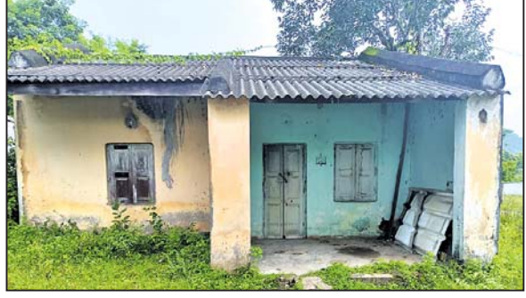
ସ୍ୱାସ୍ଥ୍ୟକେନ୍ଦ୍ରରେ ଥିବା ଡାକ୍ତରଙ୍କ କ୍ୱାର୍ଟର୍ସ ।

ଗାଁଠାରୁ ସହରଯାଏ ମାଗଣା ସ୍ୱାସ୍ଥ୍ୟସେବା ଯୋଗାଇ ଦେବା ପାଇଁ ସରକାର ବିଭିନ୍ନ ଯୋଜନା କାର୍ଯ୍ୟକାରୀ କରିଛନ୍ତି । ସେଥିପାଇଁ ଆବଶ୍ୟକ କର୍ମଚାରୀ ମଧ୍ୟ ନିଯୋଜିତ କରାଯାଇଛି । ତେବେ ସେହି କର୍ମଚାରୀମାନଙ୍କ ରହିବା ପାଇଁ କ୍ୱାର୍ଟର୍ସ ନାହିଁ । କର୍ମଚାରୀ ଭଡ଼ା ଘର ଖୋଜୁଥିଲେ ମଧ୍ୟ ମିଳୁ ନ ଥିବା ଅଭିଯୋଗ ହୋଇଛି । ନୟାଗଡ଼ ଜିଲ୍ଲା ମହିପୁର ଗୋଷ୍ଠୀ ସ୍ୱାସ୍ଥ୍ୟକେନ୍ଦ୍ର ଅଧୀନରେ ରହିଛି ନୂଆଗାଁ ପ୍ରାଥମିକ ସ୍ୱାସ୍ଥ୍ୟକେନ୍ଦ୍ର । ନୂଆଗାଁ ବୁକର ପ୍ରାୟ ୧୧ ପଞ୍ଚାୟତର ଲୋକମାନଙ୍କ ସ୍ୱାସ୍ଥ୍ୟସେବାକୁ ଦୃଷ୍ଟିରେ ରଖି ୧୯୮୦ରେ ଏହି ୧୦ଶଯ୍ୟା ବିଶିଷ୍ଟ ସ୍ୱାସ୍ଥ୍ୟକେନ୍ଦ୍ର ପ୍ରତିଷ୍ଠା କରାଯାଇଥିଲା । ଉଚ୍ଚ ଡାକ୍ତରଖାନାଟି ୫୦୯.୩୦୫ ରାଜପଥ ପାର୍ଶ୍ୱରେ ରହିଥିବାରୁ ଅନେକ ପଥଚାରୀ ଉଚ୍ଚ ଡାକ୍ତରଖାନା ଉପରେ ନିର୍ଭର କରିଥାନ୍ତି । ହେଲେ ଏହି ପ୍ରାଥମିକ ସ୍ୱାସ୍ଥ୍ୟକେନ୍ଦ୍ର ନାନା ସମସ୍ୟା ମଧ୍ୟରେ ଚାଲିଛି । ଡାକ୍ତର ନାହାନ୍ତି । ଦିନରେ ଫାର୍ମାସିଷ୍ଟ ଡାକ୍ତରଖାନାକୁ ଚଳାନ୍ତି । ଅପରାହ୍ଣ ୫ଟା