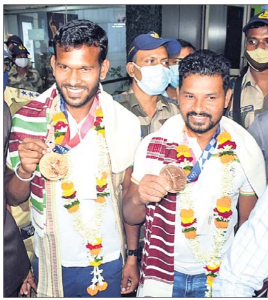
ଭୁବନେଶ୍ୱର ବିମାନ ବନ୍ଦରରେ ମହିଳା ହକି ଅଲିମ୍ପିଆନ ଦୀପଗ୍ରୋସ ଏଙ୍କା, ନମିତା ଚପୋ ଓ ଅଲିମ୍ପିକ୍ ହକି ଟ୍ରୋଫି ପଦକ ବିଜେତା ଅମିତ ରୋହିଦାସ, ବୀରେନ୍ଦ୍ର ଲାଜାଙ୍କୁ ମଙ୍ଗଳବାର ରାତିରେ ସ୍ୱାଗତ ସମ୍ବର୍ଦ୍ଧନା ଜାପାନ କରାଯାଇଛି।