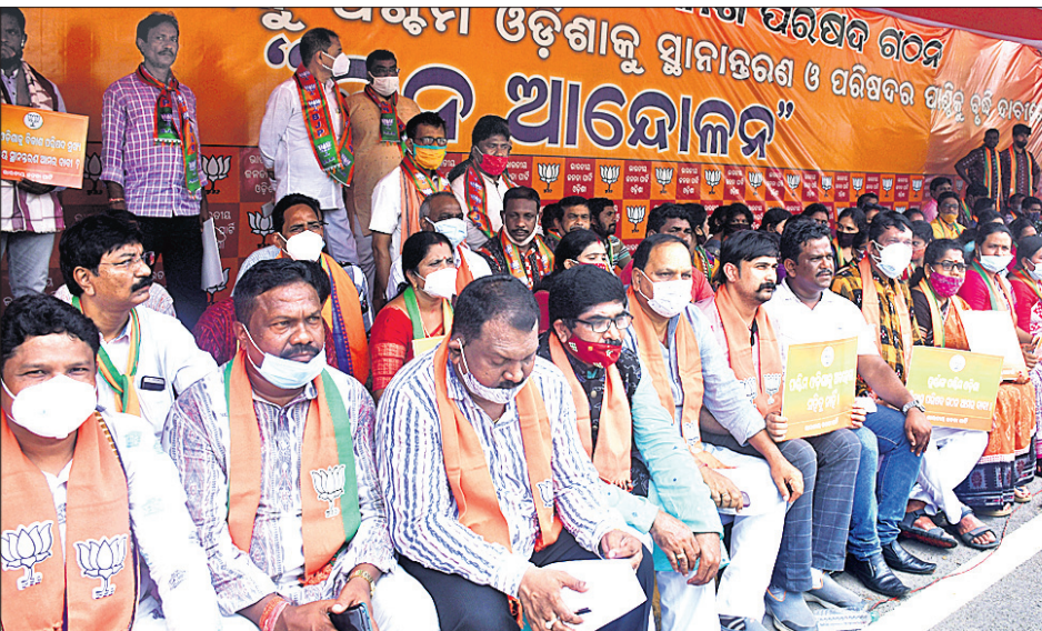
ପୂର୍ଣ୍ଣାଙ୍ଗ ପଞ୍ଜିନୀ ଓଡ଼ିଶା ବିକାଶ ପରିଷଦ ଗଠନ ଦାବିରେ ମଙ୍ଗଳବାର ରାଜଭବନ ସମ୍ମୁଖରେ ଭାଜପା ପକ୍ଷରୁ ଧାରଣା।