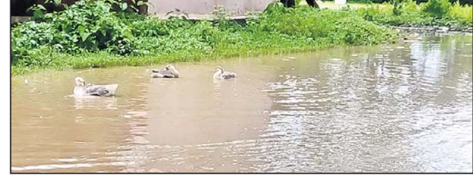
ପାଣିରେ ପହଁରୁଥିବା ହଂସ ।

ବାଘମାରି-ବଲାଙ୍ଗୀର ଟାଙ୍ଗନା ରାଜପଥ କର୍ଷିଣୋ-ବାଣପୁର ମୁଖ୍ୟରାସ୍ତା(କଂସାରୀ ସମାଜ କଲ୍ୟାଣ ସଦନ ଓ ଗାନ୍ଧୀପାର୍କ ନିକଟ) ଉପରେ ବର୍ଷାଜଳ ଜମି ରହୁଥିବାରୁ ତାହା ପୋଖରୀର ଭ୍ରମ ସୃଷ୍ଟି କରୁଛି । ପ୍ରାୟ ଏକ ଫୁଟ ଉଚ୍ଚର ବର୍ଷା ପାଣି ଜମି ରହିଛି । ପରିସ୍ଥିତି ଏମିତି ହେଉଛି ଯେ, ସେହି ପାଣିରେ ରାଜହଂସ ପହଁରୁ ଥିବା ଦେଖିବାକୁ ମିଳିଛି । ପୂର୍ବ ବିଭାଗର ଦାୟିତ୍ୱହୀନତା ଯୋଗୁ ଏକଜି ପରିସ୍ଥିତି ସୃଷ୍ଟି ହୋଇଥିବା ଅଭିଯୋଗ ହୋଇଛି । ସମସ୍ୟାର ସମାଧାନ ପାଇଁ ମହାନଦୀ ମାଳବନ୍ଧରେ ଏକ ନୂତନ ସୁଲଭ୍ ରେଟ୍ ନିର୍ମାଣ କିମ୍ବା ରାସ୍ତାକୁ ଅଧିକ ଉଚ୍ଚ କରିବା ଆବଶ୍ୟକ ରହିଛି ବୋଲି ସାଧାରଣରେ ମତ ପ୍ରକାଶ ପାଇଛି । ବିଭାଗୀୟ କର୍ତ୍ତୃପକ୍ଷ ଏମିତିରେ ବିହିତ ପଦକ୍ଷେପ ଗ୍ରହଣ କରିବାକୁ ଦାବି ହେଉଛି ଟାଙ୍ଗନା ପାଣି, ବର୍ଷା ଜଳ ଓ ନିକଟସ୍ଥ ପାହାଡ଼ରୁ ବହି ଆସୁଥିବା ନିକଟରୁ ମହାନଦୀ ମାଳବନ୍ଧ ସହ ସଂଯୋଗ ହୋଇଛି । କର୍ଷିଣୋ ବଜାରଠାରୁ