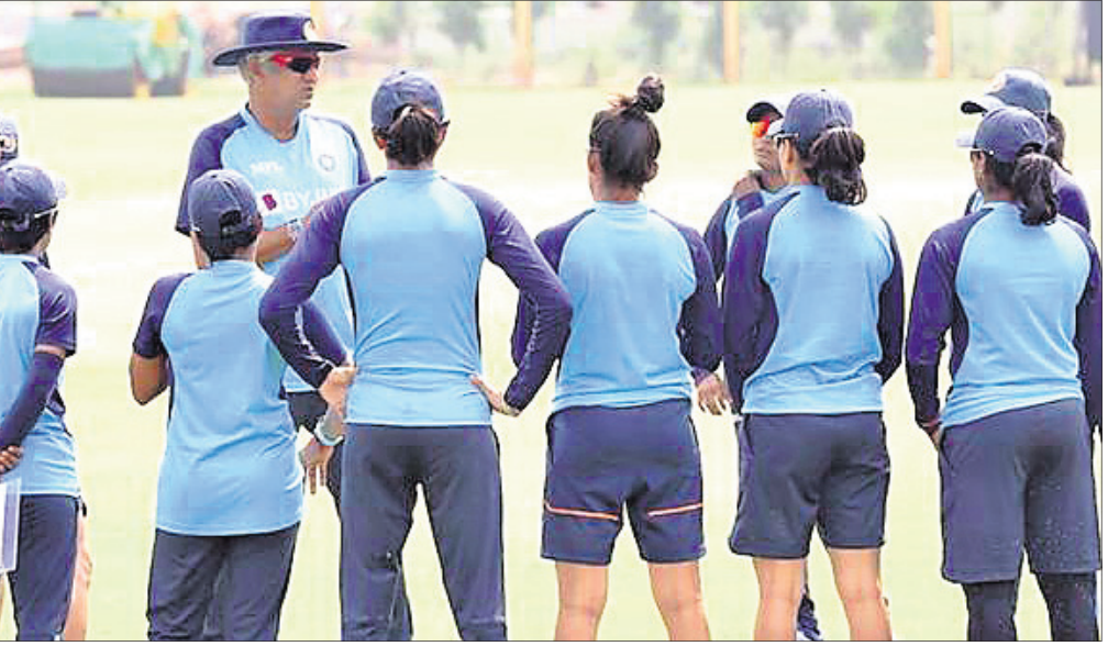
ନୁଆଦିଲ୍ଲା, ୧୦୮ (ପି.ଟି.)

ଭାରତୀୟ ମହିଳା କ୍ରିକେଟ ଦଳ ଆସନ୍ତା ସେପ୍ଟେମ୍ବର-ଅକ୍ଟୋବରରେ ଅଷ୍ଟ୍ରେଲିଆ ଚୁର୍ରେ ଯିବ। ଟ୍ରେନିଂ କ୍ୟାମ୍ପରେ ଯୋଗଦେବା ଲାଗି ଖେଳାଳିମାନେ ବେଙ୍ଗାଳୁରୁରେ ପହଞ୍ଚିବାରେ ଲାଗିଲେଣି। ପୂର୍ଣ୍ଣାଙ୍ଗ ଚୁର୍ ପାଇଁ ଯଦିଓ ଖେଳାଳି ଯୋଷଣା କରାଯାଇ ନାହିଁ, ମଙ୍ଗଳବାର ସନ୍ଧ୍ୟା ସୁଦ୍ଧା ୩୦ କ୍ରିକେଟରଙ୍କୁ ବେଙ୍ଗାଳୁରୁରେ ପହଞ୍ଚିବା ଲାଗି କୁହାଯାଇଛି। ଛଅ ଦିନ କ୍ୱାରାଣ୍ଟାଇନ୍ରେ ରହିବା ପରେ ଖେଳାଳିମାନେ ଟ୍ରେନିଂ ଆରମ୍ଭ କରିବେ। ବର୍ତ୍ତମାନ ଦି ହେଣ୍ଡ୍ରୁ ଚୁର୍ନାମେଣ୍ଟରେ ଭାଗ ନେଉଥିବା ହରମନପ୍ରୀତ କୌର, କ୍ୱିଟ ମହାନା, ଜେମିମା ରୋଡ୍ରିଗ୍ସ୍‌ଏସ୍,