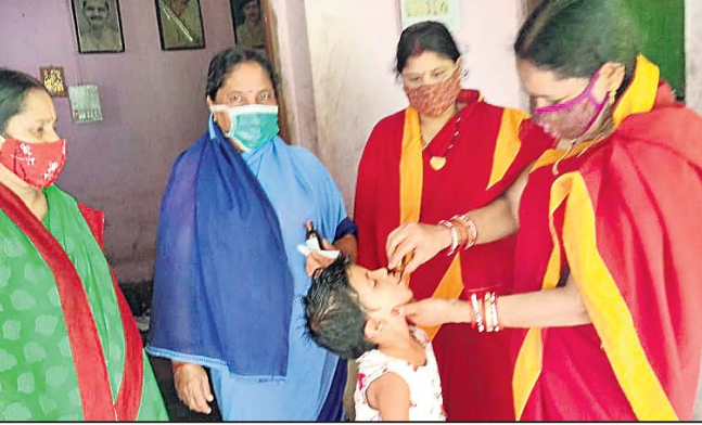
ଅଜନାତ କର୍ମୀମାନେ ଜଣେ ଶିଶୁକୁ କୃମିନାଶକ ଔଷଧ ଖୁଆଉଛନ୍ତି ।