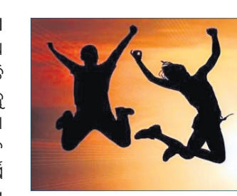
ଆଜି ଅନ୍ତର୍ଜାତୀୟ ଯୁବ ଦିବସ

ଦେଶ ପ୍ରଗତିର ଉତ୍ସର୍ଗ ଯୁବଶକ୍ତି। ସେମାନଙ୍କ ଦ୍ୱାରା ହେଉଥିବା ବହୁବିଧ କାର୍ଯ୍ୟ ଉପରେ ଦେଶର ଅର୍ଥନୀତି ନିର୍ଭର କରିଥାଏ। ଯୁବବର୍ଗ ଆଗକୁ ବଢିବା ପଥରେ ରହିଥିବା ସମସ୍ୟା ଏବଂ ସେସବୁର ସଫଳ ସମାଧାନ ଦିଗରେ ସଚେତନତା ସୃଷ୍ଟି ଲାଗି ପ୍ରତିବର୍ଷ ଅଗଷ୍ଟ ୧୨ରେ ଅନ୍ତର୍ଜାତୀୟ ଯୁବ ଦିବସ ପାଳନ କରାଯାଇଥାଏ। ୨୦୦୦ ମସିହାରେ କାଟିସଂଘ ପକ୍ଷରୁ ଯୁବ ଶିକ୍ଷା, ଗୋଷ୍ଠୀ ଉନ୍ନୟନ, ପରିବେଶୀୟ ଗୁପ୍ତ ଗଠନ, ବିଭିନ୍ନ ସାମାଜିକ ପ୍ରକଳ୍ପରେ ସ୍ୱେଚ୍ଛାସେବୀ ଭାବରେ ଯୁବବର୍ଗଙ୍କ ଯୋଗଦାନକୁ ଦୃଷ୍ଟିରେ ରଖି ଅନ୍ତର୍ଜାତୀୟ ଯୁବ ଦିବସ ଆରମ୍ଭ ହୋଇଥିଲା। ସାମ୍ପ୍ରତିକ କରୋନା ମହାମାରୀ ଯୋଗୁଁ ଯୁବବର୍ଗ ଅର୍ଥ ବ୍ୟୟକୁ ବିଚ୍ଛିନ୍ନ ହୋଇଛନ୍ତି। ଏପରିସ୍ଥିତିରେ ଯୁବବର୍ଗଙ୍କ କାନ୍ଧରେ ବଡ଼ ଦାୟିତ୍ୱ ଲଦି ହୋଇ