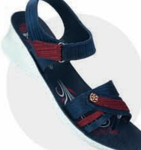
₹329.00 | 8563