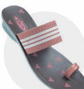
₹279.00 | 8195