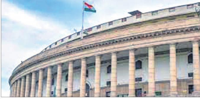
ନୂଆଦିଲ୍ଲୀ, ୧୯୮୮ (ପି.ଟି.)

ପାର୍ଲାମେଣ୍ଟର ମୋଦିଙ୍କୁ ଆଧିକାରୀ ଅଗଷ୍ଟ ୧୩ ଯାଏ ତାଲିବାକୁ ଥିବାବେଳେ ଏହାର ବୁଲ୍‌ଚି ପୂର୍ବରୁ ରୁଧିରାଣ ଲୋକ ସଭାକୁ ସାଇନ୍-ଏ-ଡିଆ ଘୋଷଣା କରାଯାଇଛି। ଜୁଲାଇ ୧୯୯୬ ମୋଦିଙ୍କୁ ଆଧିକାରୀ ଆରମ୍ଭ ହୋଇଥିଲାବେଳେ ଚୋପାସ୍ ଗୁପ୍ତଚରାଗିରି ବିବାଦ, କୃଷି ଆଇନ ଓ ଅନ୍ୟାନ୍ୟ ପ୍ରସଙ୍ଗକୁ ନେଇ ବିରୋଧୀ ଦଳଗୁଡ଼ିକ ପାର୍ଲାମେଣ୍ଟର ଉଭୟ ଗୃହକୁ ଅଟକ କରି ରଖିଥିଲେ। ଅଧିକାରୀ ଦିନ ପ୍ରବଳ ହଟଗୋଲ ଯୋଗୁ ପ୍ରଶ୍ନୋତ୍ତର କାଳ ବାଧ୍ୟାପ୍ରାପ୍ତ ହୋଇଥିଲା। ଏହା ମଧ୍ୟରେ ଓଡ଼ିସି