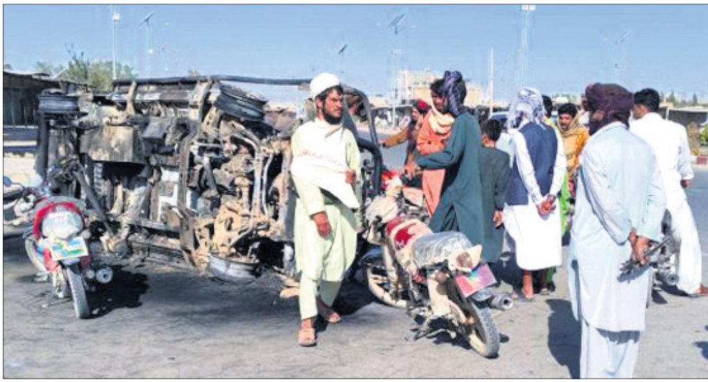
ଆଫଗାନିସ୍ତାନର ଫାରାହ ସହରରେ ଆତଙ୍କବାଦୀମାନେ ପୋଡ଼ି ଦେଇଥିବା ଗାଡ଼ିକୁ ଲୋକେ ଦେଖୁଛନ୍ତି।

ଉତ୍ତରପୂର୍ବଞ୍ଚଳରେ ଥିବା ସ୍ଥାନୀୟ ସେନା ମୁଖ୍ୟମନ୍ତ୍ରୀଙ୍କୁ କବ୍ଜା କରିଥିବା ଜଣେ ଅଧିକାରୀ ରୁଧିରାଣ କହିଛନ୍ତି। ବଡ଼ଖଣ୍ଡ, ବାୟଲାନ ଏବଂ ଫାରାହ ପ୍ରଦେଶର ରାଜଧାନୀ ତାଲିବାନ୍ ଦଖଲ କରିଥିବା ପରେ ତାଲିବାନ୍ ସରକାରଙ୍କ ଉପରେ ଅଧିକ ଚାପ ପଡ଼ିଛି। ଆତଙ୍କବାଦୀଙ୍କଠାରୁ କାବୁଲ ପ୍ରତି ସିଧା ବିଦ୍ରୋହ ହୋଇ ନ ଥିଲେ ମଧ୍ୟ ସେମାନେ ଯୋଡ଼ିଯିବେ ତାହା ସ୍ପଷ୍ଟ ହୋଇଥିବା ପରେ ତାଲିବାନ୍ ଆତଙ୍କବାଦୀଙ୍କୁ ବନ୍ଦୀ କରିବା ଲାଗିଛି, ଆଫଗାନ ଉତ୍ତର ଆଫଗାନିସ୍ତାନ ଉପରେ ସରକାରଙ୍କ ନିୟନ୍ତ୍ରଣ ପୂର୍ଣ୍ଣ ଭଙ୍ଗି ପଡ଼ିବ। ଆମେରିକା ଓ ନାଟୋ ସେନା ପ୍ରତ୍ୟାହାର ତୁରନ୍ତ ପର୍ଯ୍ୟାୟରେ ଆତଙ୍କବାଦୀଙ୍କୁ କବଳରୁ ନିଜ ନିୟନ୍ତ୍ରଣରେ ରଖିପାରିବେ ତାହା ନେଇ ପ୍ରଶ୍ନବାଦୀ ପୂର୍ଣ୍ଣ ହୋଇଛି। ତାଲିବାନ୍ ଆତଙ୍କବାଦୀଙ୍କ ମୁକାବିଲା କରି ନ ପାରି ପହଞ୍ଚୁଥିବାବେଳେ ତାଲିବାନ୍ ଆତଙ୍କବାଦୀ ଦେଶର ପ୍ରାୟ ଦୁଇତୃତୀୟାଂଶକୁ ନିଜ ନିୟନ୍ତ୍ରଣକୁ ନେଇଯାଇଛନ୍ତି। ସେମାନେ ଆଉ ୩ଟି ପ୍ରାଦେଶିକ ରାଜଧାନୀ ସମେତ ଆତଙ୍କବାଦୀଙ୍କୁ କବଳରୁ ନିଜ ନିୟନ୍ତ୍ରଣରେ ରଖିପାରିବେ ତାହା ନେଇ ପ୍ରଶ୍ନବାଦୀ ପୂର୍ଣ୍ଣ ହୋଇଛି। ତାଲିବାନ୍ ଆତଙ୍କବାଦୀମାନେ ରାସ୍ତାରେ ଜଣେ ଦେଉଛନ୍ତି। ହିଂସାକାଣ୍ଡ ଭୟରେ ହଜାର ହଜାର ସାଧାରଣ ଜନତା ରାଜଧାନୀକୁ ଯାଇଯାଇଛନ୍ତି। ଆମେରିକା ପକ୍ଷରୁ