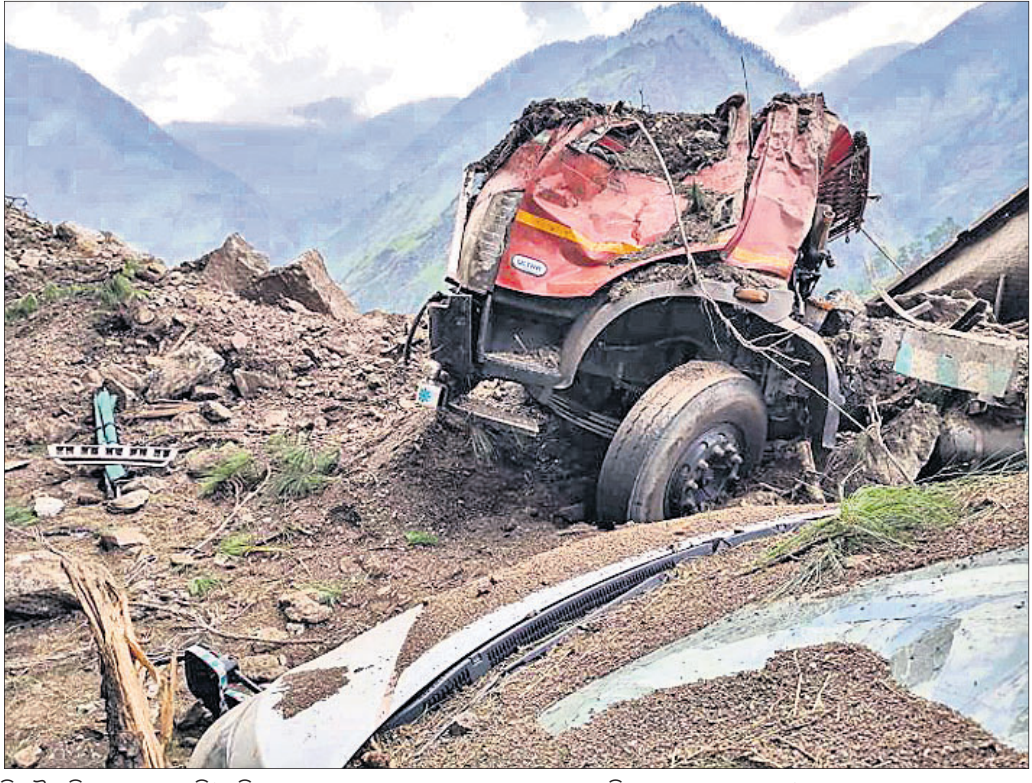
କିନୋର ଜିଲା ରେକୋର ପିଓ-ଶିମ୍ଲା ରାଜପଥରେ ଭୁଷ୍ଟକନ ଯୋଗୁ ଖାତରେ ଚାପି ହୋଇଯାଇଥିବା ବ୍ରୁକ୍ ଓ କାର୍।

ଠାକୁର କହିଛନ୍ତି। ପ୍ରଧାନମନ୍ତ୍ରୀ ନରେନ୍ଦ୍ର ମୋଦି ଏବଂ ସ୍ୱରାଷ୍ଟ୍ର ମନ୍ତ୍ରୀ ଅମିତ୍ ଶାହା ହିମାଚଳପ୍ରଦେଶ ମୁଖ୍ୟମନ୍ତ୍ରୀଙ୍କ ସହ କଥା ହୋଇଛନ୍ତି ଏବଂ ସମସ୍ତ ସମ୍ଭାଷଣ ସହାୟତା ଯୋଗାଇଦେବାର ପ୍ରତିଶ୍ରୁତି ଦେଇଛନ୍ତି। ହିମାଚଳ ସଡ଼କ ପରିବହନ ବସ୍ ସମେତ ଅନ୍ୟ କେତେକ ଗାଡ଼ି ଭୁଷ୍ଟକନ ଯୋଗୁ ମାଟି ଅତଡ଼ା ତଳେ ଯୋଡି ହୋଇପଡ଼ିଥିବା ପଡ଼ିଥିବା ମୁଖ୍ୟମନ୍ତ୍ରୀ ଠାକୁର ବିଧାନସଭାକୁ ଜଣାଇଛନ୍ତି। ଉଦ୍ଧାର କାର୍ଯ୍ୟରେ ଏନ୍ଡିଆରଏଫ୍, ଆଇଟିସିପି, ସିଆଇଏସ୍ଏଫ୍ ଏବଂ ଗ୍ଲାନାୟ ପୋଲିସ୍ ନିୟୋଜିତ ହୋଇଥିବାବେଳେ ସେନା ପକ୍ଷରୁ ମଧ୍ୟ ସହାୟତା ପ୍ରଦାନ ଦିଆଯାଇଛି। ପୂରନାୟୋଗ୍ୟ, ହିମାଚଳପ୍ରଦେଶରେ ଗତ କିଛି ସପ୍ତାହ ହେଲା ପ୍ରବଳ ବର୍ଷା ଲାଗି ରହିଥିବାରୁ ଏକାଧିକ ଭୁଷ୍ଟକନ ଘଟଣାଗଣି। ଗତ ମାସରେ ୯୭ ପୁଷ୍ପା-୨