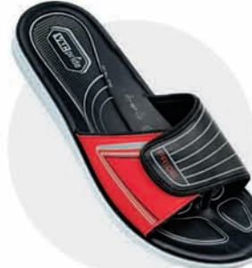
₹319.00 | 3792