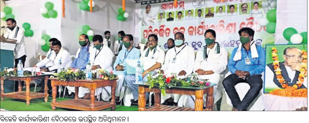
ବିଜେଡି କାର୍ଯ୍ୟକାରୀତା ବୈଠକରେ ଉପସ୍ଥିତ ଅତିଥିମାନେ।