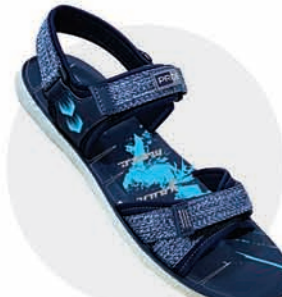
₹339.00 | 3542