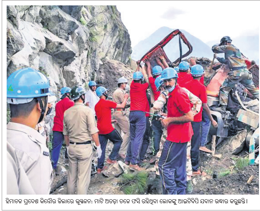
ହିମାଚଳ ପ୍ରଦେଶ କିରୋରି ଜିଲ୍ଲୀରେ ଭୂସଙ୍କଳ: ମାଟି ଅତୀତ ତଳେ ଫସି ରହିଥିବା ଲୋକଙ୍କୁ ଆଇଡିସିସି ଯବାନ ଉଦ୍ଧାର କରୁଛନ୍ତି।

କେରଳରେ କୋଭିଡ଼ ଟିକାର ବୁଲ୍‌ଚି ଡୋଜ୍ ନେଇଥିବା ୪୦ ହଜାରରୁ ଉର୍ଦ୍ଧ୍ୱ ଲୋକ ପୁଣିଥରେ କରୋନାରେ ସଂକ୍ରମିତ ହୋଇଛନ୍ତି। ସମସ୍ତ ମାମଲାରେ ନମୁନା ଜିନୋମ୍ ସିକ୍ୱେନ୍ସିଂ ପାଇଁ ପଠାଇବାକୁ କେନ୍ଦ୍ର ସରକାର କେରଳକୁ ନିର୍ଦ୍ଦେଶ ଦେଇଛନ୍ତି। ଯଦି ଭୁତାଣୁ ଅଧିକ ନୂଆ ରୂପ ନେଇଥାଏ, ତେବେ ଏହା ବାସ୍ତବରେ ଚିତ୍କାର କାରଣ। ତେବେ ଏହି ସଂକ୍ରମଣ ତେଜ୍ଜ୍ୱା ଭାରିଆଣ୍ଡ ଯୋଗୁ ହୋଇଛି କି ନାହିଁ ତାହା ଜଣାପଡ଼ିନାହିଁ। ଟିକା ନେବା ପରେ କରୋନାରେ ସଂକ୍ରମଣ ହେବା ମାମଲା କେରଳର ପଥନମୁଖରେ ସର୍ବାଧିକ ଦେଖାଯାଇଛି। ଉଚ୍ଚ ଲିଭାରେ ପ୍ରଥମ ଡୋଜ୍ ନେଇଥିବା ୧୪,୯୨୪ ଜଣ ଏବଂ ଦ୍ୱିତୀୟ ଡୋଜ୍ ନେଇଥିବା ୫,୦୪୨ ଜଣ ସଂକ୍ରମିତ ହୋଇଛନ୍ତି।