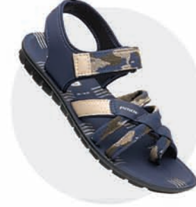
₹289.00 | 3507