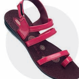
₹279.00 | 8570