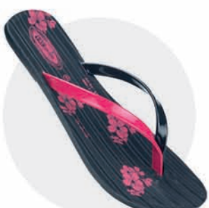
₹189.00 | 8337