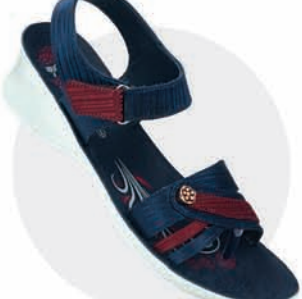
₹329.00 | 8563