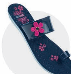
₹229.00 | 8199