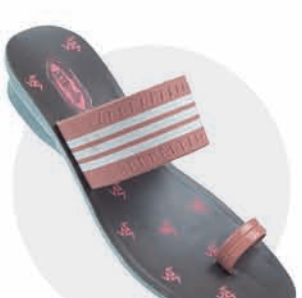
₹279.00 | 8195