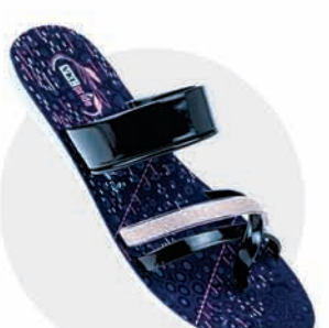
₹234.00 | LP1300