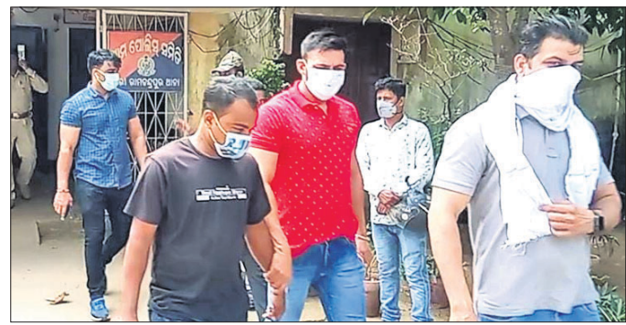
ବରା ରାମଚନ୍ଦ୍ରପୁର ଥାନାରୁ ପ୍ରାଚୀନଙ୍କୁ ନିଆଯାଇଛି ।