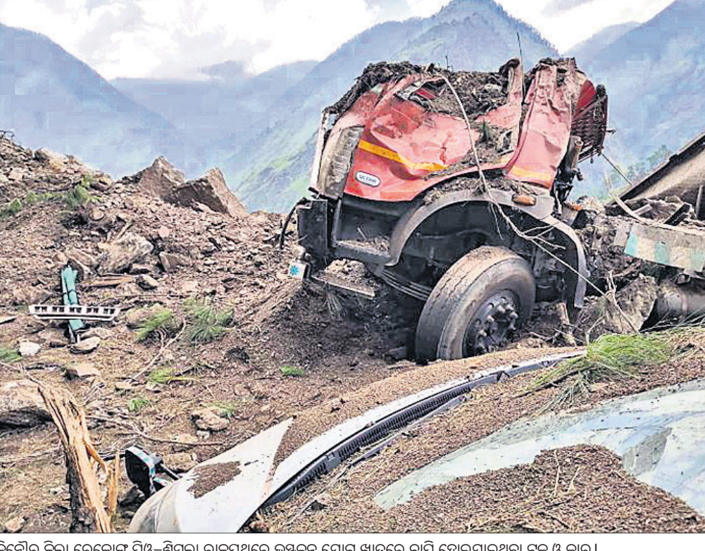
କିନ୍ନୋର ଜିଲ୍ଲା ରେକୋଙ୍ଗ ପିଓ-ଶିମ୍ପଳା ରାଜପଥରେ ଭୃଷ୍ଟାଳନ ଯୋଗୁ ଖାତରେ ଚାପି ହୋଇଯାଇଥିବା ବସ୍ ଓ କାର୍।