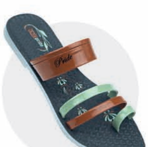
₹259.00 | 8198