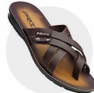
₹289.00 | 3290