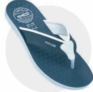
₹279.00 | 3400