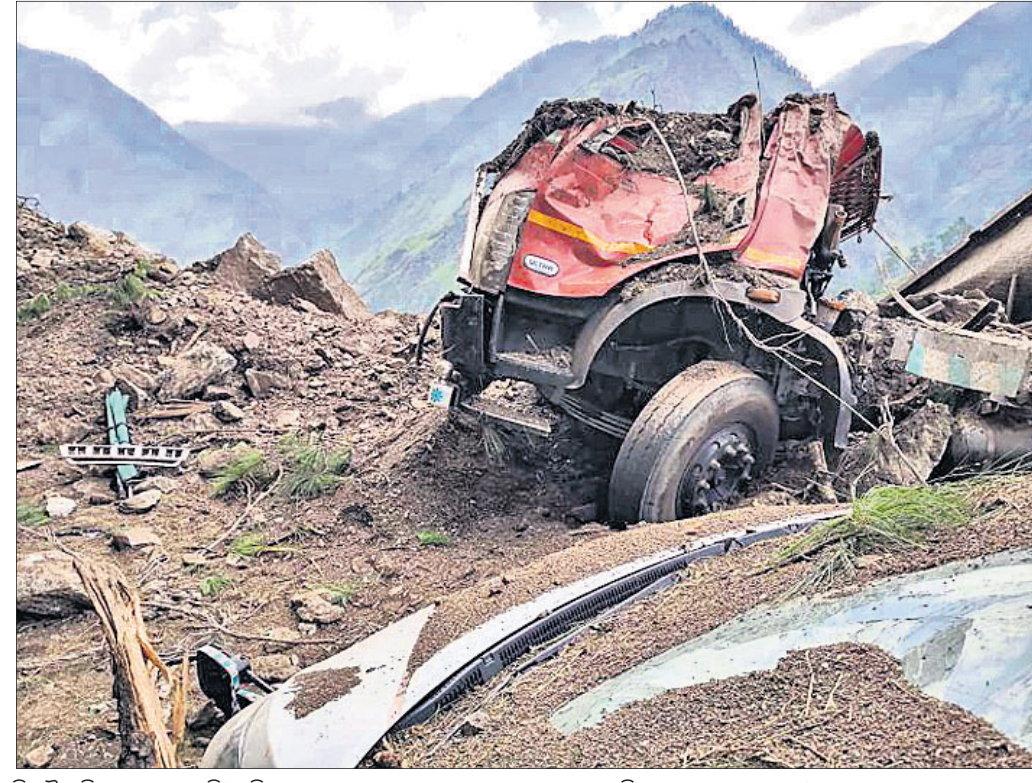
କିନୋର ଜିଲା ରେକୋର୍ଡ ପିଓ-ଶିମଲା ରାଜପଥରେ ଭୃଷ୍ଟକର୍ମ ଯୋଗୁ ଖାତରେ ଚାପି ହୋଇଯାଇଥିବା ଟ୍ରକ୍ ଓ କାର୍।

ଠାକୁର କହିଛନ୍ତି। ପ୍ରଧାନମନ୍ତ୍ରୀ ନରେନ୍ଦ୍ର ମୋଦି ଏବଂ ସ୍ୱରାଷ୍ଟ୍ର ମନ୍ତ୍ରୀ ଅମିତ୍ ଶାହା ହିମାଚଳପ୍ରଦେଶ ମୁଖ୍ୟମନ୍ତ୍ରୀଙ୍କ ସହ କଥା ହୋଇଛନ୍ତି ଏବଂ ସମସ୍ତ ସମ୍ଭାଷଣ ସହାୟତା ଯୋଗାଇଦେବାର ପ୍ରତିଶ୍ରୁତି ଦେଇଛନ୍ତି। ହିମାଚଳ ସଡ଼କ ପରିବହନ ବସ୍ ସମେତ ଅନ୍ୟ କେତେକ ଗାଡ଼ି ଭୃଷ୍ଟକର୍ମ ଯୋଗୁ ମାଟି ଅତଡ଼ା ତଳେ ଯୋଡ଼ିହୋଇ ପଡ଼ିଥିବା ପୁଖ୍ୟମନ୍ତ୍ରୀ ଠାକୁର ବିଧାନସଭାକୁ ଜଣାଇଛନ୍ତି। ଉଦ୍ଧାର କାର୍ଯ୍ୟରେ ଏନ୍ଡିଆର୍କଏଫ୍, ଆଇଟିବିପି, ସିଆଇଏସ୍ଏଫ୍ ଏବଂ ଗ୍ଲାନାୟ ପୋଲିସ ନିୟୋଜିତ ହୋଇଥିବାବେଳେ ସେନା ପକ୍ଷରୁ ମଧ୍ୟ ସହାୟତା ପ୍ରଦାନ ଦିଆଯାଇଛି। ସୂଚନାଯୋଗ୍ୟ, ହିମାଚଳପ୍ରଦେଶରେ ଗତ କିଛି ସପ୍ତାହ ହେଲା ପ୍ରବଳ ବର୍ଷା ଲାଗି ରହିଥିବାରୁ ଏକାଧିକ ଭୃଷ୍ଟକର୍ମ ଘଟିଲାଣି। ଗତ ମାସରେ ୯୯ ପୃଷ୍ଠା-୨