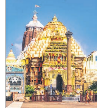
ନୁହେଁ। ପୁରୀ ସହରର ବାସିନ୍ଦା ହୋଇଥିବା ଯେକୌଣସି ପରିବହନପତ୍ର ଦେଖାଇ ଶ୍ରୀମନ୍ଦିର ପ୍ରବେଶ କରିହେବ। ୯୯ ପୃଷ୍ଠା-୨

ଦୀର୍ଘ ଅଦେଇ ମାସ ପରେ କରୋନା କଟକଣା କୋହଳ ଯୋଗୁ ଶ୍ରୀମନ୍ଦିର ପ୍ରଶାସନ ପକ୍ଷରୁ ଏସ୍‌ଓପି ପ୍ରକାଶ ପାଇଛି। ଗୁରୁବାରଠାରୁ ଶ୍ରୀମନ୍ଦିର ଖୋଲିବ। ପ୍ରଥମ ଦୁଇଦିନ ଅର୍ଥାତ୍ ୧୨ ଓ ୧୩ ତାରିଖରେ ଶ୍ରୀମନ୍ଦିର ସେବାୟତଙ୍କ ପରିବାର ସଦସ୍ୟଙ୍କୁ ଦର୍ଶନ ସୁଯୋଗ ମିଳିବ। ଏହାପରେ ଆସନ୍ତା ୧୬ତାରିଖରୁ ପୁରୀ ସହରବାସୀ ଶ୍ରୀମନ୍ଦିରରେ ଦର୍ଶନ କରିପାରିବେ। ପୁରୀ ସହରବାସୀ ଓ ସେବାୟତ ପରିବାର ସଦସ୍ୟଙ୍କ ପାଇଁ ଆର୍ଡି-ପିସିଆର୍ ଟେଷ୍ଟ କିମ୍ବା ଡବଲ୍ ଡିଟେକ୍ଟ କୋଭିଡ୍ ଟିକା ବାଧ୍ୟତାମୂଳକ