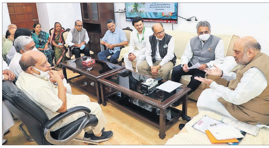
ବିଜେଡି ଏମ୍ପିମାନେ ରୁଧିର ରାଜ୍ୟ ଅମିତ ଶାହାଙ୍କ ସହ ଆଲୋଚନା କରୁଛନ୍ତି।

ଭୁବନେଶ୍ୱର, ୧୧୮ (ବୁଧବାର) - ପଞ୍ଚୁଆ ବର୍ଗ ଗଣନାକୁ ନେଇ ରାଜନୀତି ଜୋର ଧରିଛି। ଏହି ବର୍ଗ ପାଇଁ ବିଭିନ୍ନ ରାଜ୍ୟରୁ ଦାବି ହେଉଥିବାବେଳେ ଓଡ଼ିଶା ପକ୍ଷରୁ ମଧ୍ୟ ଜନଗଣନାରେ ପଞ୍ଚୁଆବର୍ଗ ଛାଡ଼ି ଗଣନା କରିବାକୁ ଦାବି କରାଯାଇଛି। ଏ ନେଇ ବିଜେଡି ସଂସଦୀୟ ଦଳ ପ୍ରତିନିଧି ମଣ୍ଡଳୀ ରୁଧିର ରାଜ୍ୟ ଅମିତ ଶାହାଙ୍କୁ ପାଇଁମେଣ୍ଟରେ ଡାକି ବାରମ୍ବାର ଭେଟି ଏକ ସ୍ମାରକପତ୍ର ପ୍ରଦାନ କରିଛନ୍ତି। ଏକ କେନ୍ଦ୍ରୀୟ ଆଇନ ପ୍ରଣୟନ କରି ସଂରକ୍ଷଣକୁ ୫୦%ରୁ ଅଧିକ ବୃଦ୍ଧି କରିବା ଓ ଏସ୍‌ଇସିସି/ଓସିସିସିକୁ ବିହର ଏବଂ ଜାତିଭିତ୍ତିକ ଜନଗଣନା କରିବା ବିଷୟରେ ପ୍ରସ୍ତାବ ଦିଆଯାଇଛି। ସମଗ୍ର ଦେଶରେ ଶିକ୍ଷାଗତ ଓ ଆର୍ଥିକ ଦୁର୍ବଳ ଶ୍ରେଣୀମାନଙ୍କ ସ୍ୱାର୍ଥକୁ ଦୃଷ୍ଟିରେ ରଖି ମଣ୍ଡଳୀ କମିଶନ ପଞ୍ଚୁଆ ଜାତି ଓ ବର୍ଗର ତାଲିକା ପ୍ରକାଶ କରିଛନ୍ତି। ୧୯୯୩ରେ ଏସ୍‌ଇସିସି ଦାବି କମିଶନଙ୍କ ୧୮୧ ଜାତି ସୁପାରିସ କରିଥିବାବେଳେ ଏହି ସଂଖ୍ୟା ଏବେ ୨୦୮କୁ ବୃଦ୍ଧିପାଇଛି। ତାହାକୁ