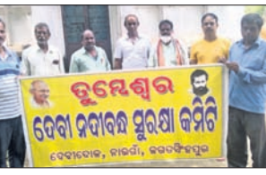
ନାଉରା, ୧୧୮୮ (ସ.ପ୍ର.): ନରଗାଁ ବୁକ୍ କଲଜ ପ୍ରତିଷ୍ଠା ପାଇଁ ଗଭୀର ମନୋନିବେଶ କରାଯାଉଛି।

ନାଉରା, ୧୧୮୮ (ସ.ପ୍ର.): ନରଗାଁ ବୁକ୍ କଲଜ ପ୍ରତିଷ୍ଠା ପାଇଁ ଗଭୀର ମନୋନିବେଶ କରାଯାଉଛି। ଗଭୀର ମନୋନିବେଶ କରାଯାଉଛି।