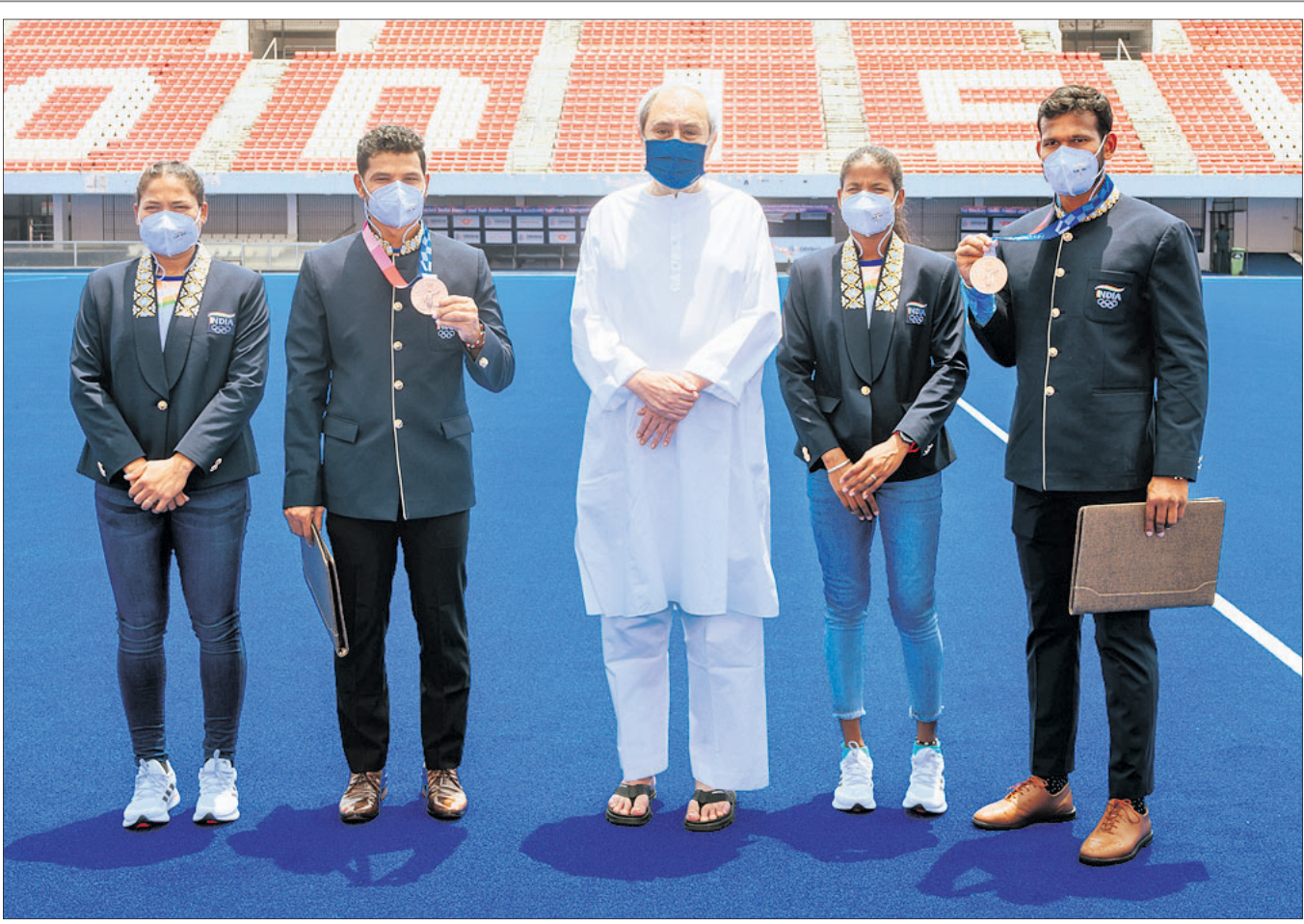
ଭୁବନେଶ୍ୱର କଳିଙ୍ଗ ଷ୍ଟାଡ଼ିୟମରେ ବୁଧବାର ସମ୍ବର୍ଦ୍ଧନା ଅବସରରେ ପୁଖ୍ୟମନ୍ତ୍ରୀ ନବୀନ ପଟ୍ଟନାୟକଙ୍କ ସହ ହକି ଖେଳାଳି ଦୀପ୍ତଗ୍ରୀୟ ଏସ୍, ବୀରେନ୍ଦ୍ର ଲାଜ୍ଜା, ନମିତା ଚପ୍ପୋ ଓ ଅମିତ୍ ରୋହିତାସ୍।