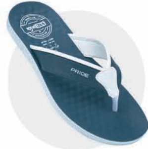
₹279.00 | 3400