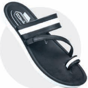
₹279.00 | 3061