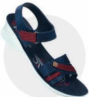
₹329.00 | 8563