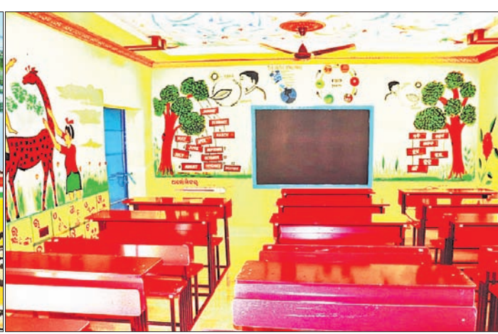
ରାଜନଗର ବ୍ଲକରେ ଥିବା ବିଦ୍ୟାଳୟଗୁଡ଼ିକର ପ୍ରବେଶ ପଥ ଓ ଶ୍ରେଣୀଗୃହ ରଙ୍ଗ ଦିଆଯିବା ସହ ଶିକ୍ଷଣୀୟ ତଥ୍ୟ ଲେଖାଯାଇଛି।