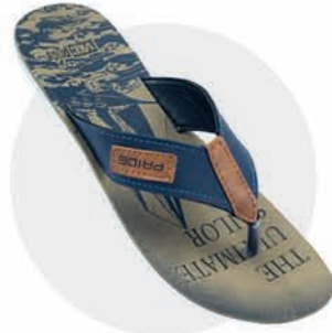
₹249.00 | 3386