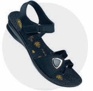
₹279.00 | 8568