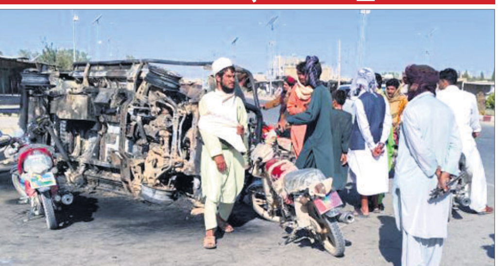
ଆଫଗାନିସ୍ତାନର ଫାରାହ ସହରରେ ଆତକବାଦୀମାନେ ପୋଡ଼ି ଦେଇଥିବା ଗାଡ଼ିକୁ ଲୋକେ ଦେଖୁଛନ୍ତି।

ଉତ୍ତରପୂର୍ବୀଞ୍ଚଳରେ ଥିବା ଘାମୀୟ ସେନା ପୁଞ୍ଜୀଳୟକୁ କବ୍ଜା କରିଥିବା ଜଣେ ଅଧିକାରୀ ରୁସ୍ତୁକର କହିଛନ୍ତି। ବଡ଼ଖଣ୍ଡ, ଘୁରୁକ୍ଷା ପାଇଁ ଘାମୀୟ ସ୍ଵଳ୍ପମାନ ଆଜା ମହମ୍ମଦ ନୂର୍ ଏବଂ ତୁର୍କସ୍ତାନ ସେନାପତି ଅବଦୁଲ୍ ଉଲ୍ଲାହ୍ ଖାନ୍ ସମେତ ଅଲୋଚନା ଚଳାଇଛନ୍ତି। ତାଲିବାନ୍ ବିରୋଧୀ ମିଲିଆରିଆ ଅଜା କୁହାଯାଉଥିବା ମଜାର ଯଦି ଆତକବାଦୀଙ୍କ ଦଖଲକୁ ଚାଲିଯାଏ, ତେବେ ଆଫଗାନ ସରକାରଙ୍କ ପାଇଁ ମରଣାନ୍ତକ ଝଟକା ହେବ ଏବଂ ଉତ୍ତର ଆଫଗାନିସ୍ତାନ ଉପରୁ ସରକାରଙ୍କ ନିୟନ୍ତ୍ରଣ ବୃଦ୍ଧି ପଡ଼ିବ। ଆମେରିକା ଓ ନାଟୋ ସେନା ପ୍ରତ୍ୟାହାର ବୃତ୍ତାନ୍ତ ପର୍ଯ୍ୟାୟରେ ପହଞ୍ଚିଥିବାବେଳେ ତାଲିବାନ୍ ଆତକବାଦୀ ଦେଶର ପ୍ରାୟ ଦୁଇତୃତୀୟାଂଶକୁ ନିଜ ନିୟନ୍ତ୍ରଣକୁ ନେଇଯାଇଛନ୍ତି। ସେମାନେ ଆଉ ୩ଟି ପ୍ରାଦେଶିକ ରାଜଧାନୀ ସମେତ