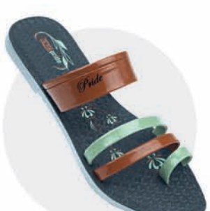
₹259.00 | 8198