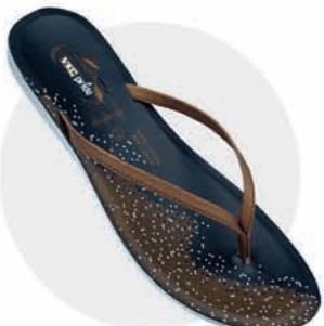
₹169.00 | LP1000