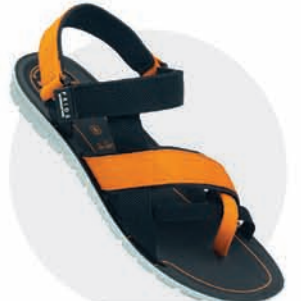
₹329.00 | 3522