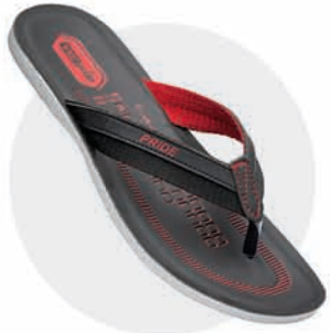
₹229.00 | 3381