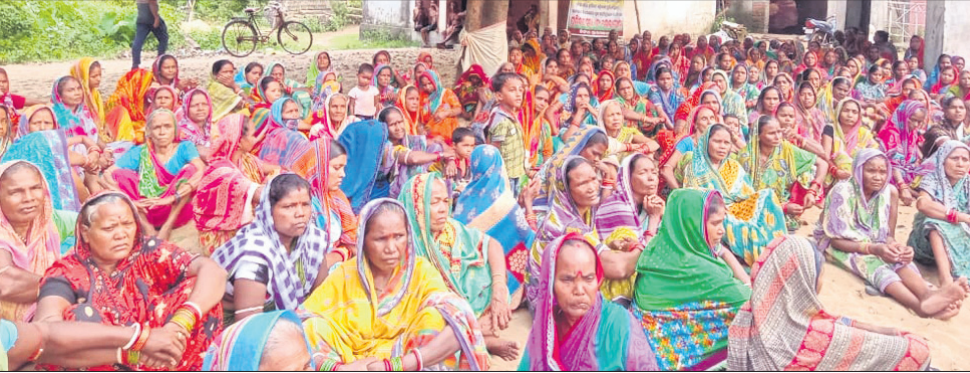
ପ୍ରତିବାଦ ସଭାରେ ଯୋଗ ଦେଇଥିବା ମହିଳାମାନେ।