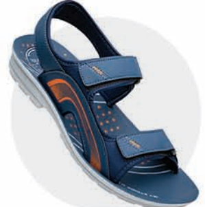
₹339.00 | 3523