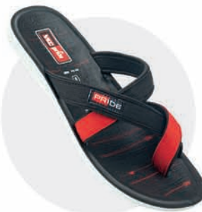
₹269.00 | 3082