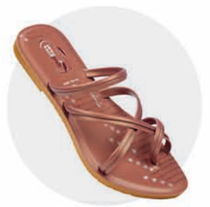
₹219.00 | 8399