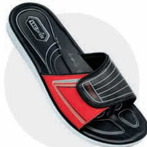
₹319.00 | 3792