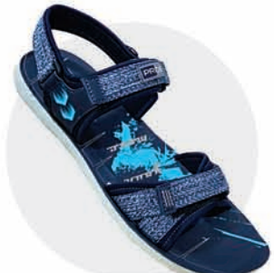
₹339.00 | 3542