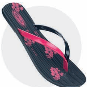
₹189.00 | 8337