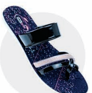
₹234.00 | LP1300