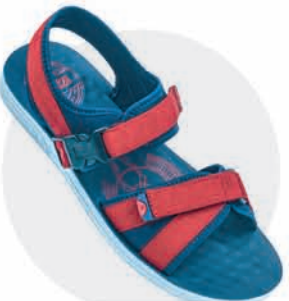
₹309.00 | 3525