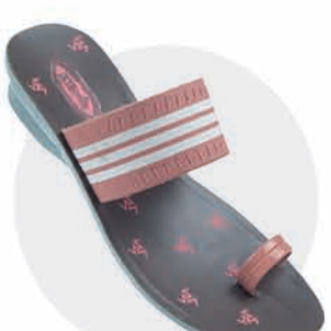
₹279.00 | 8195