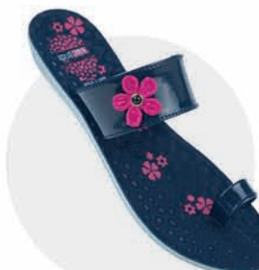
₹229.00 | 8199