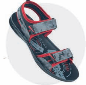
₹269.00 | 3536