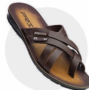
₹289.00 | 3290