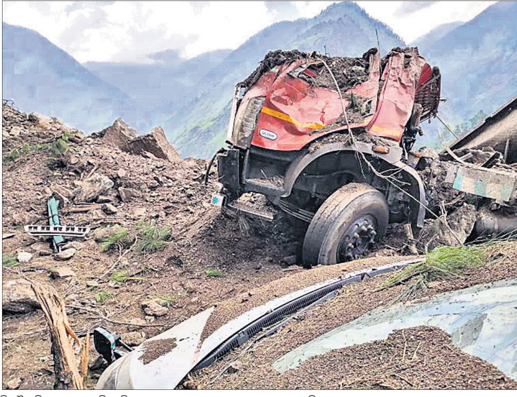
କିନୋର ଜିଲା ରେକୋର୍ଡ ପିଓ-ଶିମଲା ରାଜପଥରେ ଭୃଷ୍ଟକର୍ମ ଘଟଣାରେ ଚାପି ହୋଇଯାଇଥିବା ଟ୍ରକ୍ ଓ କାର୍।

ଠାକୁର କହିଛନ୍ତି। ପ୍ରଧାନମନ୍ତ୍ରୀ ନରେନ୍ଦ୍ର ମୋଦି ଏବଂ ସ୍ୱରାଷ୍ଟ୍ର ମନ୍ତ୍ରୀ ଅମିତ୍ ଶାହା ହିମାଚଳପ୍ରଦେଶ ମୁଖ୍ୟମନ୍ତ୍ରୀଙ୍କ ସହ କଥା ହୋଇଛନ୍ତି ଏବଂ ସମସ୍ତ ସମ୍ଭାଷଣ ସହାୟତା ଯୋଗାଇଦେବାର ପ୍ରତିଶ୍ରୁତି ଦେଇଛନ୍ତି। ହିମାଚଳ ସଡ଼କ ପରିବହନ ବସ୍ ସମେତ ଅନ୍ୟ କେତେକ ଗାଡ଼ି ଭୃଷ୍ଟକର୍ମ ଘଟଣା ମାଟି ଅତଡ଼ା ତଳେ ଯୋଡ଼ିହୋଇ ପଡ଼ିଥିବା ପୁଖ୍ୟମନ୍ତ୍ରୀ ଠାକୁର ବିଧାନସଭାକୁ ଜଣାଇଛନ୍ତି। ଉଦ୍ଧାର କାର୍ଯ୍ୟରେ ଏନ୍ଡିଆର୍କଏଫ୍, ଆଇଟିସିପି, ସିଆଇଏସ୍ଏଫ୍ ଏବଂ ଗ୍ଲାନାୟ ପୋଲିସ ନିୟୋଜିତ ହୋଇଥିବାବେଳେ ସେନା ପକ୍ଷରୁ ମଧ୍ୟ ସହାୟତା ପ୍ରଦାନ ଦିଆଯାଇଛି। ସୂଚନାଯୋଗ୍ୟ, ହିମାଚଳପ୍ରଦେଶରେ ଗତ କିଛି ସପ୍ତାହ ହେଲା ପ୍ରବଳ ବର୍ଷା ଲାଗି ରହିଥିବାରୁ ଏକାଧିକ ଭୃଷ୍ଟକର୍ମ ଘଟଣାଗଣା ଗତ ମାସରେ ୯୯ ପୁଣ୍ୟ-୨