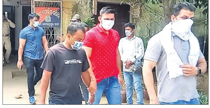
ବରା ରାମଚନ୍ଦ୍ରପୁର ଥାନାକୁ ପ୍ରାଚୀନଙ୍କୁ ନିଆଯାଇଛି ।