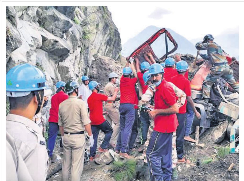
ହିମାଚଳ ପ୍ରଦେଶ କିନୋର ଜିଲ୍ଲାରେ ଭୂକମ୍ପର ମାଟି ଅତ୍ୟନ୍ତ ଚଳେ ଫସି ରହିଥିବା ଲୋକଙ୍କୁ ଆଇଡିପିଏ ସହାୟନ ଉଦ୍ଧାର କରୁଛନ୍ତି।

କେରଳରେ କୋଭିଡ୍ ଟିକାର ବୁଲଟି ତୋଡ଼ି ନେଇଥିବା ୪୦ ହଜାରରୁ ଉର୍ଦ୍ଧ୍ଵ ଲୋକ ପୁଣିଥରେ କରୋନାରେ ସଂକ୍ରମିତ ହୋଇଛନ୍ତି। ସମସ୍ତ ମାମଲାରେ ନମୁନା ଜିନୋମ୍ ସିକ୍ଵେନ୍ସିଂ ପାଇଁ ପଠାଇବାକୁ କେନ୍ଦ୍ର ସରକାର କେରଳକୁ ନିର୍ଦ୍ଦେଶ ଦେଇଛନ୍ତି। ଯଦି ଭୁତାଣୁ ଅଧିକ ନୁଆ ରୂପ ନେଉଥାଏ, ତେବେ ଏହା ବାସ୍ତବରେ ଡିଙ୍ଗାର କାରଣ। ତେବେ ଏହି ସଂକ୍ରମଣ ତେଜ୍ଵ ଭାରିଆଣ୍ଡ ଯୋଗୁ ହୋଇଛି କି ନାହିଁ ତାହା ଜଣାପଡ଼ିନାହିଁ। ଟିକା ନେବା ପରେ କରୋନାରେ ସଂକ୍ରମଣ ହେବା ମାମଲା କେରଳର ପଥନମ୍ପୁଡ଼ାରେ ସର୍ବାଧିକ ଦେଖାଯାଇଛି। ଉକ୍ତ ଜିଲ୍ଲାରେ ପ୍ରଥମ ତୋଡ଼ି ନେଇଥିବା ୧୪,୯୭୪ ଜଣ ଏବଂ ଦ୍ଵିତୀୟ ତୋଡ଼ି ନେଇଥିବା ୫,୦୪୨ ଜଣ ସଂକ୍ରମିତ ହୋଇଛନ୍ତି।