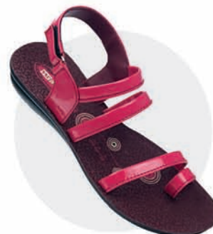
₹279.00 | 8570