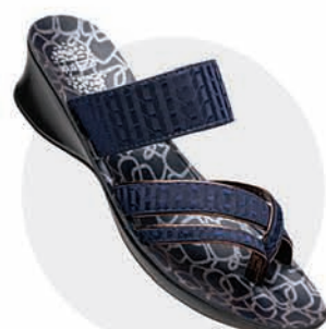
₹269.00 | 8148