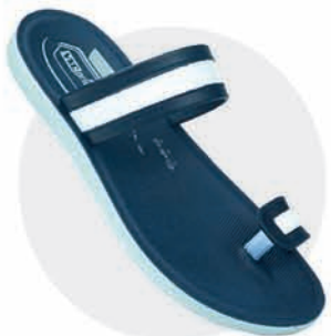
₹279.00 | 3062