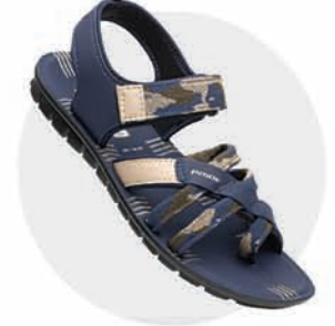
₹289.00 | 3507