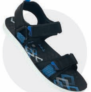
₹309.00 | 3535