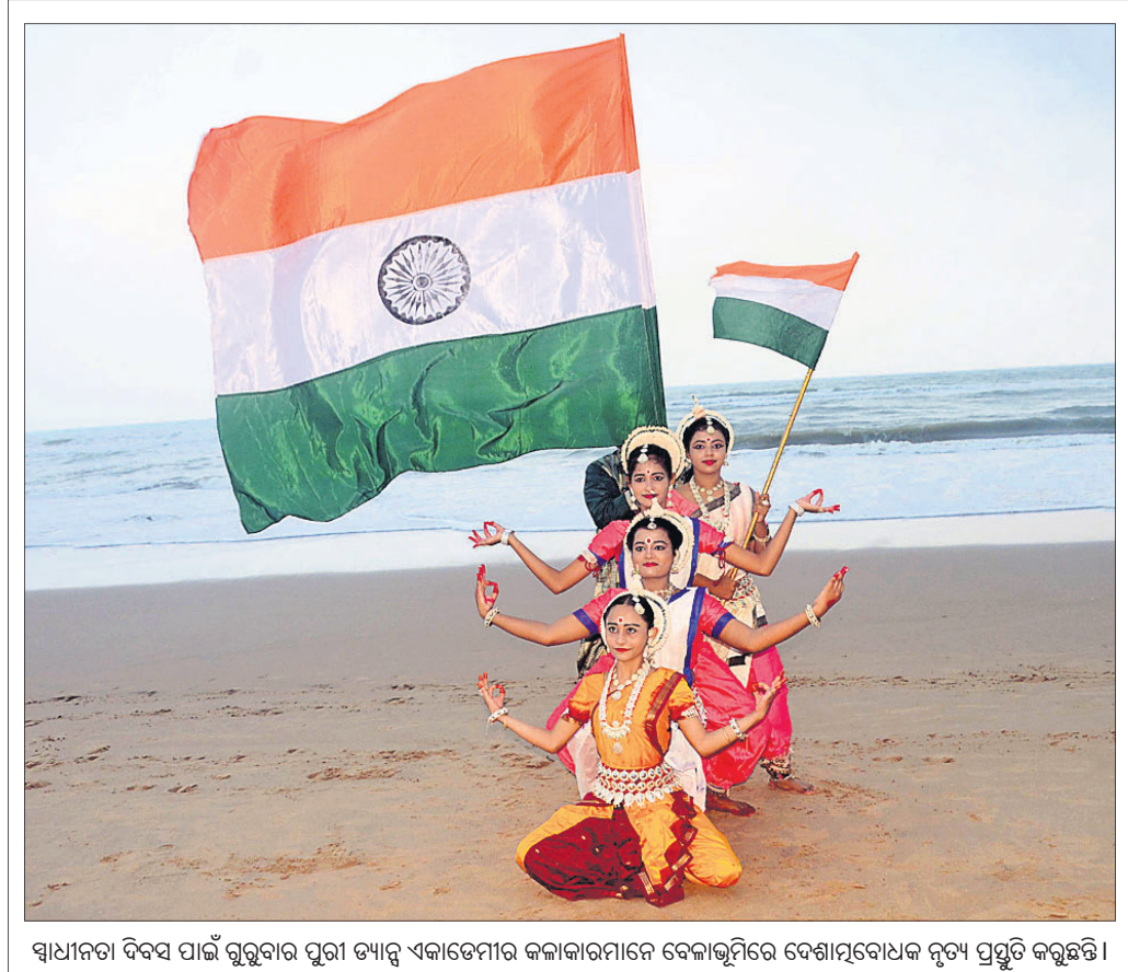
ସାଧାରଣ ଦିବସ ପାଇଁ ଗୁରୁବାର ପୁରୀ ତ୍ୟାଗ୍ ଏକାଡେମୀର କଳାକାରମାନେ ଦେଶାତ୍ମୀୟତା ଦେଖାଯାଉଥିବା ନୂଆ ପ୍ରସ୍ତୁତି କରୁଛନ୍ତି।

କଟକ ଅପ୍ରେଲ, ୧୨।୮: ପୌର ନିର୍ବାଚନ ବିଳମ୍ବ ହେଉଛି। ତୁରନ୍ତ ଏହି ନିର୍ବାଚନ କରାଯାଏ ପାଇଁ ନିର୍ଦ୍ଦେଶ ଦେବାକୁ ହାଇକୋର୍ଟରେ ଗୁରୁବାର ମାମଲା ଦାଏର ହୋଇଛି।