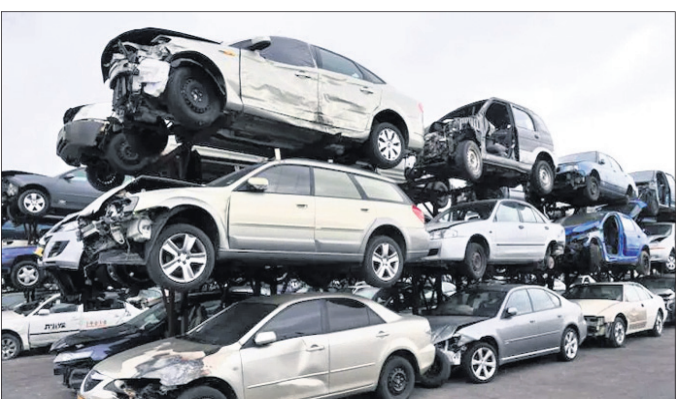
ଉତ୍ପାଦନ କଲେ ମୋଦି, ମୁକ୍ତବର୍ଣ୍ଣ, କ୍ଷୁଦ୍ରଶୁଦ୍ଧ ଯୋଜନାରେ ସାମିଲ ହେବାକୁ ଆହ୍ଵାନ

ପ୍ରଧାନମନ୍ତ୍ରୀ ନରେନ୍ଦ୍ର ମୋଦି ଶୁକ୍ରବାର ଭେଜନିକ ସ୍ତ୍ରୀପେଜ୍ ନୀତିକୁ ଶୁଭାରମ୍ଭ କରିଛନ୍ତି। ଏହା ଦେଶର ବିକାଶ ଯାତ୍ରାରେ ଏକ ମାଇଲ ଖୁଣ୍ଟ ହେବ ବୋଲି କୁହାଯାଇଛି। ମୁକ୍ତବର୍ଣ୍ଣ ଏବଂ କ୍ଷୁଦ୍ରଶୁଦ୍ଧ ଏହି କାର୍ଯ୍ୟକ୍ରମରେ ଯୋଗଦେବାକୁ ମୋଦି ଆହ୍ଵାନ ଜଣାଇଛନ୍ତି। ଦେଶରେ ଯାନ ସ୍ଵାଧିନୀ କରାଯିବ। ଭଜନେଶ୍ଵରୀ ପ୍ରମାଣ ପତ୍ର ପ୍ରଦାନ କରାଯାଇଛି। ସେ କହିଛନ୍ତି, ନୂଆ ପଦକ୍ଷେପ ଦ୍ଵାରା ପ୍ରତ୍ୟକ୍ଷ ସୃଷ୍ଟିକାରୀ ଏବଂ ଫିକ୍ସ ନ ଥିବା ଯାନଚାଳକ ପରିବେଶ ଉପଯୋଗୀ ଉପାୟରେ ବଜାରରୁ ହଟାଇ ଦିଆଯିବ। ସମସ୍ତ ଏକାଦାବରକ ଲାଗି ଏକ ଭାଲ୍ୟୁ ଆଣିବା ଦିଗରେ କାର୍ଯ୍ୟକ୍ରମ ହାତକୁ ନିଆଯିବ।