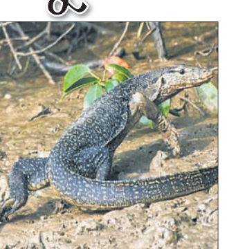
ଖିଟର ନିବିନ ଲିଜାର୍

ଭୁବନେଶ୍ଵର: ଆଜି ଖୁଲିତ ଲିଜାର୍ ଡେ'। ପ୍ରତିବର୍ଷ ଅଗଷ୍ଟ ୧୪ରେ ଏହି ଦିବସ ପାଳନ କରାଯାଏ। ବିଶେଷ ପ୍ରାୟ ହଜାର ଲିଜାର୍ ପ୍ରକାରି ସରାସୁପ ଦେଖାଯାନ୍ତି। କିନ୍ତୁ ବିଭିନ୍ନ କାରଣରୁ ଏମାନଙ୍କ ମଧ୍ୟରୁ ଅଧିକାଂଶ ସଙ୍କଟରେ ଅଛନ୍ତି। ଗୋଧୂକୁ ଆରମ୍ଭ କରି ଏକ୍ସପ୍ରେସି, ଝିଟିଟି ପର୍ଯ୍ୟନ୍ତ ସବୁ ଲିଜାର୍ ପ୍ରକାରିରେ ଅଛନ୍ତି। ତେବେ ଏଥିରେ ବହୁ ପ୍ରାଣୀ ଭାରତୀୟ ବନାମ୍ପ୍ରାଣୀ (ସଂରକ୍ଷଣ) ଆଇନ, ୧୯୭୨ ଅଧିକ୍ଷକ। କିନ୍ତୁ ଚୋରା କାରବାର ଯୋଗୁ ଏମାନଙ୍କ ଶିକାର ବଢ଼ିବାର ଲାଗିଛି। ଓଡ଼ିଶାରେ ବିଶେଷ କରି ଗୋଧୂର ଚୋରା କାରବାର ହେଉଥିବା ଦେଖାଯାଇଛି। ଓଡ଼ିଶାରୁ ପଶ୍ଚିମବଙ୍ଗ, ବାଂଲାଦେଶ ଗୋଧୂ ବେପାର ହେଉଥିବା ଜଣାପଡ଼ିଛି। ଗୋଧୂ ମାଂସ ଖାଇବା ପାଇଁ ଏବଂ ଡା' ଚମଡ଼ାକୁ ବିଭିନ୍ନ ଯୋଗ୍ୟାନ୍ ବିଶେଷ ସହ ବ୍ୟବହାର ପିଆରି କରିବା ପାଇଁ ଏହାର ଶିକାର ହୋଇଥାଏ। ଏହା ମୁଖ୍ୟତଃ ଖଞ୍ଜିର ବ୍ୟବହାର କରାଯାଇଥାଏ। ଓଡ଼ିଶାରେ ୩ ପ୍ରକାରର ଗୋଧୂ ଦେଖାଯାଆନ୍ତି। ଭିତରକନିକା ହେଉଛି ବନରେ ଖୁବ୍ ସମାପନ କରିଥାଏ ଏବଂ ରାଜ୍ୟର ଅନ୍ୟ ସ୍ଥାନରେ ଦେଖାଯାନ୍ତି ନିବିନ ଓ ଯେଲୋ ନିବିନ ଲିଜାର୍ ଦେଖାଯାନ୍ତି। ଏହି ୩ ପ୍ରକାର ଗୋଧୂ