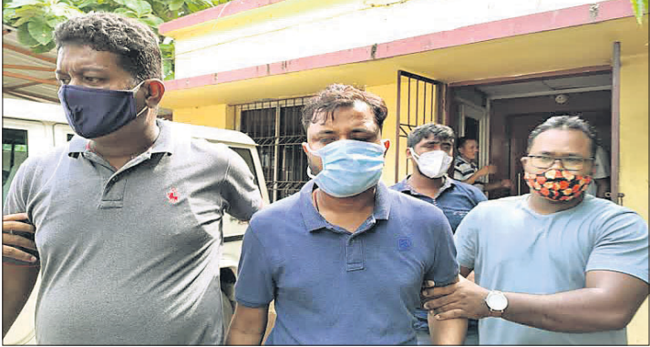
ଗିରଫ ଅଭିଯୁକ୍ତ ।

ମେଡିକାଲ କଲେଜ, ଇଞ୍ଜିନିୟରିଂ କଲେଜଠାରୁ ଆରମ୍ଭ କରି ବିଭିନ୍ନ ଶିକ୍ଷାନୁଷ୍ଠାନରେ ନାମ ଲେଖାଇ ଦେବାକୁ