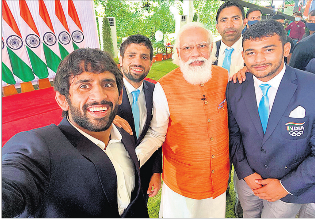
ସୋମବାର ନୂଆଦିଲ୍ଲୀରେ ଆୟୋଜିତ ସମ୍ବର୍ଦ୍ଧନା ଉତ୍ସବ ଅବସରରେ ଚୋକିଓ ଅଲିମ୍ପିକ୍ସରେ ଅଂଶଗ୍ରହଣ କରିଥିବା ଚେସଲର ବକରଜ ପୁନିଆ, ରବି ଦହିୟା ଓ ଦୀପକ ପୁନିଆଙ୍କ ସହ ପ୍ରଧାନମନ୍ତ୍ରୀ ନରେନ୍ଦ୍ର ମୋଦି।

କୋହଲି ଇନିଂସ ଘୋଷଣା କରିଥିଲେ। ସେତେ ବେଳକୁ ସାନି ୬୦ ବଲ୍କୁ ୬ ଚୋକା ଓ ୧ ଛକା ସହାୟତାରେ ୫୬ ଏବଂ କୁମ୍ଭାର ୬୪ ବଲ୍କୁ ୩ ଚୋକା ସହିତ ୩୪ ରନରେ ଅପରାଜିତ ରହିଥିଲେ। ଦ୍ୱିତୀୟ ଇନିଂସ ଆରମ୍ଭରେ ଇଂଲଣ୍ଡ ବ୍ୟାଟିଂ ବିପର୍ଯ୍ୟୟର ସମ୍ମୁଖୀନ ହୋଇଥିଲା। ମାତ୍ର ୬୭ ରନରେ ଦଳ ୫ ଉଇକେଟ ହରାଇ ବିପକ୍ଷରେ ପଡ଼ିଥିଲା। ଦୁଇ ଓପନର ରୋବି ବର୍ଣ୍ଣ ଓ ଡମ୍ ସିଭଲେ ଗୋଲ୍ଡେନ ଡକ୍(୦)ରେ ଆଉଟ ହୋଇଥିବାବେଳେ ହସାବ ହସିବ ୯, ଜନି ବେୟାରସ୍ଟୋ ୨ ଓ ଅଧିନାୟକ ଜୋ ରୁଟ୍ ୩୩ ରନ କରି ଆଉଟ ହୋଇଥିଲେ। କୋସି ବଟଲର ଓ ମୋଜନ ଅଲୀ ସତକିତାର ସହ ଭାରତୀୟ ବୋଲରକୁ ପୁରାବିଳା କରି ଓଭର ଗଢ଼ାଇବାରେ ମନୋନିବେଶ କରିଥିଲେ। ମାତ୍ର ଷ୍ଟୋର ୯୦ ଥିବାବେଳେ ମହମ୍ମଦ ସାନିର ଜୁମାଗତ ୨ଟି ବଲ୍ରେ ମୋଜନ (୧୩ ରନ, ୪୨ ବଲ୍, ୨ ଚୋକା) ଓ ସାମ୍ କୁରାନ(୦)ଙ୍କୁ ଆଉଟ କରି ଭାରତ ପାଇଁ ପୁଣି ଆଶା ଉଜ୍ଜୀବିତ କରିଥିଲେ। ଜୋସି ବଟଲର ଓ ଓଲି ରବିନ୍ଦ୍ରନାଥ ୭୬ ବଲ୍କୁ ୩୦ ରନ ଯୋଗକରି ଭାରତୀୟ ବୋଲରଙ୍କ ଯୈର୍ଯ୍ୟ ପରାସ୍ତା କରିଥିଲେ। ତେବେ ଷ୍ଟୋର ୧୨୦ ଥିବାବେଳେ ଏହି ୨ ଉଇକେଟର ପତନ ପୁଣି ଭାରତର ପଲ୍ଲୀ ଭାରି କରି ଦେଇଥିଲା। ସମାନ ଷ୍ଟୋରରେ ଜେମ୍ସି ଆଣ୍ଡରସନ ମଧ୍ୟ ଆଉଟ ହୋଇ ଯାଇଥିଲେ।