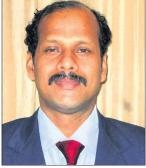
ଜୀବନ ବଲ୍‌ଭଲ୍ ସମାଜ

ଭୁବନେଶ୍ୱର, ୧୬୮ (କ୍ରୀଡ଼ା ପ୍ରତିନିଧି) ଟୋକିଓ ପାରାଲିମ୍ପିକ୍ସରେ ମ୍ୟାଚ ପରିଚାଳନା କରିବା ପାଇଁ ସୁଯୋଗ ପାଇଛନ୍ତି ଓଡ଼ିଶାର ଅନ୍ତର୍ଜାତୀୟ ଟେନିସ୍ ଟେନିସ୍ ଅସୋସିଏସନ୍ ଜୀବନ ବଲ୍‌ଭଲ୍ ଟେନିସ୍ ଫେଡେରେଶନ ଅଫ୍ ଇଣ୍ଡିଆ ପକ୍ଷରୁ ଟାଙ୍କୁ ମନୋନୀତ କରାଯାଇଛି। ଟୋକିଓ ମେଗ୍ରୋପଲିଟାନ ଇମ୍ପ୍ରୋଭମେଣ୍ଟ ପ୍ରତିଯୋଗିତା ଚଳିତମସ ୨୪ରୁ ସେପ୍ଟେମ୍ବର ୫ ପର୍ଯ୍ୟନ୍ତ ଅନୁଷ୍ଠିତ ହେବ। ଭାରତର ଏକମାତ୍ର ଟେନିସ୍ ଟେନିସ୍ ଅଫିସିଆଲଭାବେ ଜୀବନ ବଲ୍‌ଭଲ୍