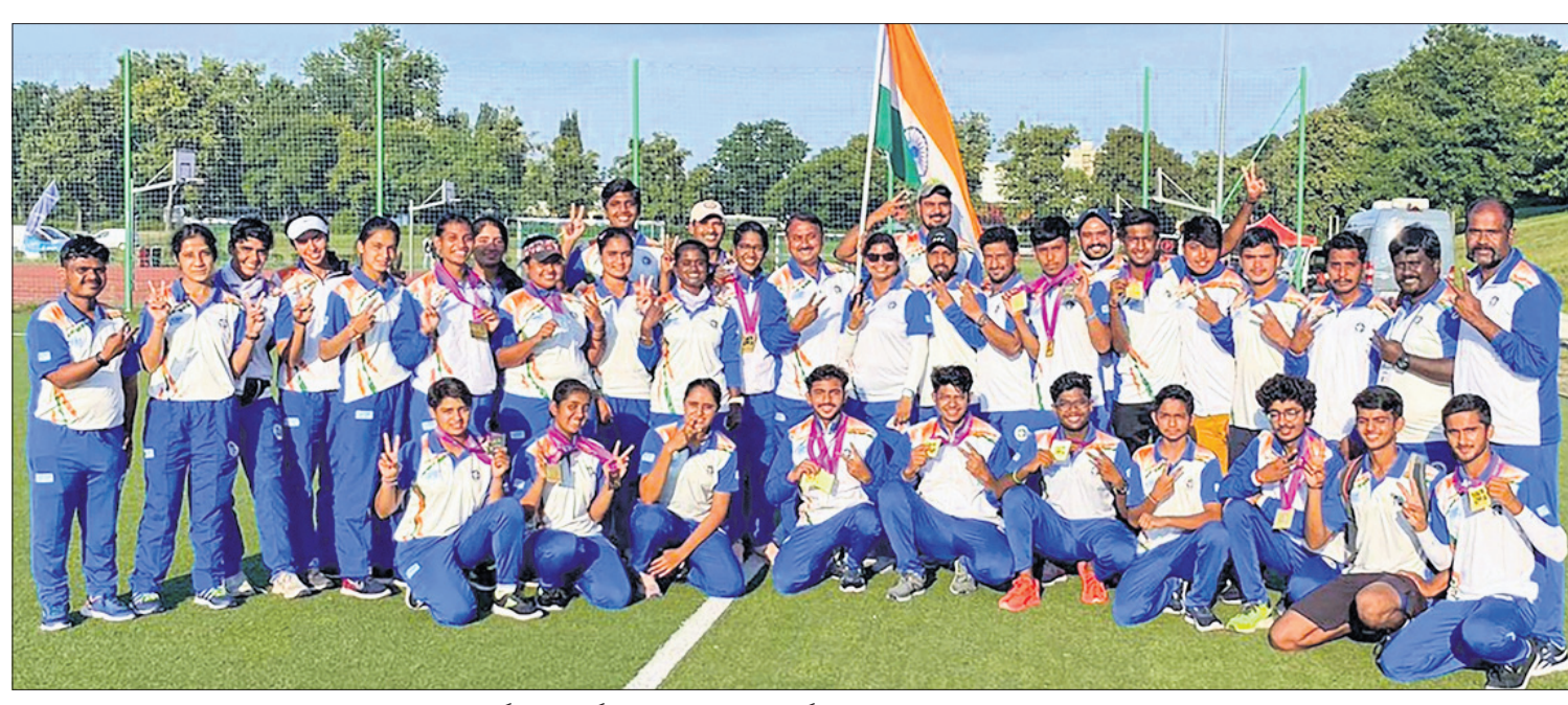
ରୋଲ୍‌କାରେ ଅନୁଷ୍ଠିତ ଖାର୍‌ସ୍ଟୁୟୁ ଆର୍ଟିସ୍ଟ ଚାମ୍ପିୟନଶିପ୍ରେ ୮ ସର୍ବ୍ସ୍ ସହ ୧୫ ପଦକ ହାସଲ କରିଥିବା ଭାରତୀୟ ପ୍ରତିନିଧି ଦଳ।