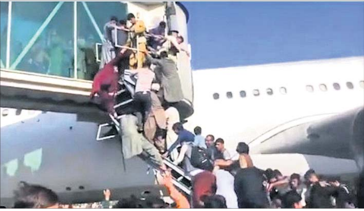
ଆଫଗାନିସ୍ତାନ ରାଜଧାନୀ କାବୁଲ ବିମାନବନ୍ଦରରେ ସୋମବାର ଦେଶ ଛାଡ଼ି ଚାଲିଯିବା ଉଦ୍ଦେଶ୍ୟରେ ଲୋକମାନେ ଆମେରିକାର ବାୟୁସେନା ବିମାନରେ ବ୍ୟାକୁଳ ହୋଇ ଚଢ଼ିବାକୁ ପ୍ରୟାସ କରୁଛନ୍ତି।