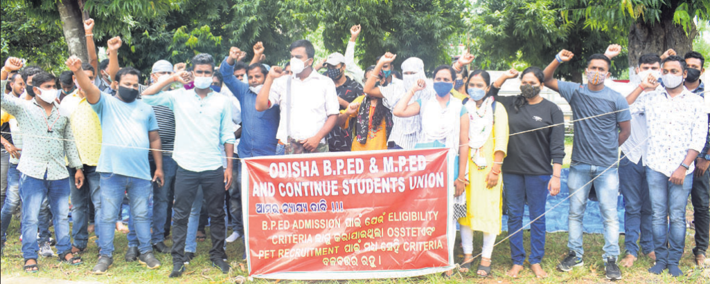
ଓଡ଼ିଶା ବିପିଏସ୍ ଆଣ୍ଡ ଏମ୍‌ପିଏସ୍ ଏବଂ କର୍ମଚାରୀ ସ୍ତୁତେଶ୍ୱର ଯୁନିୟନ ପକ୍ଷରୁ ଯୋଗଦାନ ଭୁବନେଶ୍ୱର ଲୋକସଭା ପିଏମ୍‌ଜିରେ ବିରୋଧ ପ୍ରଦର୍ଶନ।