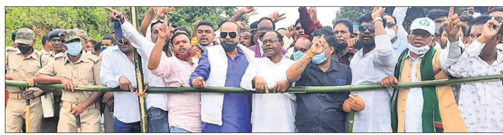
ଫାନ୍ସୁସନେରି ଗ୍ରାମର ଆନ୍ଧ୍ର-ଓଡ଼ିଶା ସୀମାରେ ଏକତ୍ରିତ ହୋଇଥିବା ୩ ରାଜନୈତିକ ଦଳର ନେତା, ପ୍ରଶାସନିକ ଅଧିକାରୀ ଓ ପୋଲିସ୍।

କୋରାପୁଟ ଜିଲ୍ଲା ପଞ୍ଚାଙ୍ଗ ବ୍ଲକ ଅନ୍ତର୍ଗତ କୋଟିଆ ପଞ୍ଚାୟତକୁ ହାତକୋରୀ ପାଇଁ ଉଦ୍ୟମକୁ ରୋକି ଲଗାଇଛି ଓଡ଼ିଶା। କୋରାପୁଟ ଜିଲ୍ଲା ପ୍ରଶାସନ ଏବଂ ରାଜ୍ୟର ବିଭିନ୍ନ ରାଜନୈତିକ ଦଳର ନେତାଙ୍କ ଭେଦରେ ଫାନ୍ସୁସନେରି ଗ୍ରାମ ସୀମା ଭିତରେ ପଶି ପାରିନାହିଁ ଆନ୍ଧ୍ର। ଓଡ଼ିଶା ପ୍ରଶାସନର କଡ଼ା ନଜର ଥିବା ସୂଚନା ପାଇ ଆନ୍ଧ୍ର ଚା'ର ପୂର୍ବ ନିର୍ଦ୍ଧାରିତ କାର୍ଯ୍ୟକ୍ରମକୁ ବାଟିକ କରିବାକୁ ବାଧ୍ୟ ହୋଇଛି।