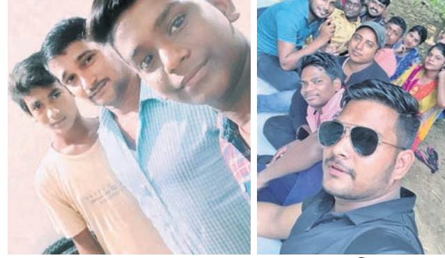
@ ରସାନନ୍ଦ @ ସମ୍ପଦା