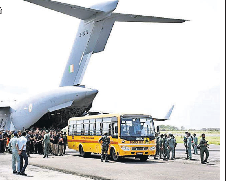
ଭାରତର ନାଗରିକଙ୍କୁ ଆଇଏଏଫ୍ ବିମାନ ସି-୧୭ ମଙ୍ଗଳବାଦୀ କାରୁଣ୍ୟ ରୁ ଆଣି ଜାମିନଗରକୁ ଅପରିଚାଳିତ ଭାବରେ ପହଞ୍ଚାଇ ଦିଆଯାଇଛି।

କାରୁଣ, ୧୭୮୩: ଆଫଗାନିସ୍ତାନ ତାଲିକାଙ୍କ ଦଖଲ କରିବା ପରେ ବି ଆତଙ୍କବାଦୀଙ୍କ ଆଗରେ ଆତ୍ମସମର୍ପଣ କରିବେ ନାହିଁ ବୋଲି କହିଛନ୍ତି। ପରିବର୍ତ୍ତନ ଉପରାଷ୍ଟ୍ରପତି ଅମରୁକ୍ତା ସାଲେହା ତାଙ୍କୁ ଦାବି କରୁଛନ୍ତି।