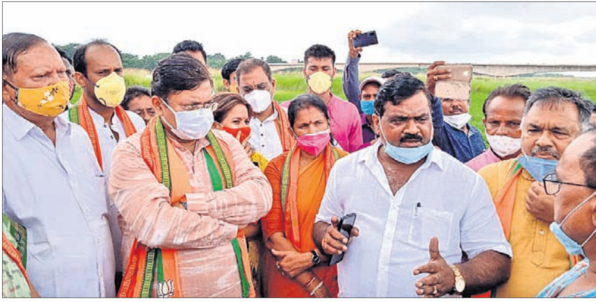
ଝରସୋଡ଼ା ନଦୀର ପ୍ରକଳ୍ପ ସ୍ଥଳରେ ଭାରତୀୟ ନବୀନ ମନ୍ତ୍ରୀ ଉପସ୍ଥିତ।

କେନ୍ଦ୍ରାପଡ଼ା ଅଧିକାରୀଙ୍କୁ ନିର୍ଦ୍ଦେଶ ଦିଆଯାଇଛି ଯେ ଦାମ୍ ପାଇଁ ବିପତ୍ତୀପୂର୍ଣ୍ଣ ପରିସ୍ଥିତିରେ ପ୍ରକଳ୍ପ କାର୍ଯ୍ୟକ୍ରମ ଯୋଜନା କରିବେ।