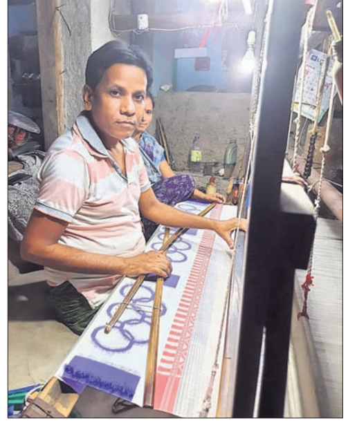
ରୁଣାକାର ସ୍ମାରକୀ ପ୍ରସ୍ତୁତ କରୁଛନ୍ତି ।

ଭୁବନେଶ୍ୱର, ୧୭୮ (ବୁଧବାର) ଟୋକିଓ ଅଲିମ୍ପିକ୍ସରେ ଉଭୟ ପୁରୁଷ ଓ ମହିଳା ଭାରତୀୟ ହକି ଦଳ ଉଲ୍ଲେଖନୀୟ ପ୍ରଦର୍ଶନ କରି ସମଗ୍ର ଦେଶରୁ ପ୍ରଶଂସା ସାଉଁଟିବାରେ ଲାଗିଛନ୍ତି । ଏହାକୁ ଦୃଷ୍ଟିରେ ରଖି ଓଡ଼ିଶାର କାରିଗର ଏବଂ ରୁଣାକାରମାନେ ସ୍ୱତନ୍ତ୍ର ହସ୍ତଶିଳ୍ପ ଓ ହସ୍ତତନ୍ତ ଉତ୍ପାଦ ପ୍ରସ୍ତୁତ କରିଛନ୍ତି । ମଙ୍ଗଳବାର ସନ୍ଧ୍ୟାରେ ଆୟୋଜିତ ସମର୍ପଣ ଉତ୍ସବରେ ପୁଷ୍ୟମନ୍ତ୍ରୀ ନବୀନ ପଟ୍ଟନାୟକ ଖେଳାଳୀମାନଙ୍କୁ ଅଭିନନ୍ଦନ ସ୍ୱରୂପ ବିଶେଷ ରୂପେ ପ୍ରସ୍ତୁତ ଏହି ହସ୍ତତନ୍ତ ଓ ହସ୍ତଶିଳ୍ପ ଉତ୍ପାଦଗୁଡ଼ିକୁ ପ୍ରଦାନ କରିଥିଲେ । ଟୋକିଓ ଅଲିମ୍ପିକ୍ସରେ ଉଭୟ ହକି ଦଳର ପ୍ରଦର୍ଶନ ଦେଖିବାପାଇଁ ଆନନ୍ଦିତ କରିଥିଲେ । ଏହି ପରିପ୍ରେକ୍ଷାରେ ରାଜ୍ୟର କାରିଗର ଏବଂ ରୁଣାକାରମାନେ ରୂପା ଚାନ୍ଦିକରି ହୋଇଥିବା ଆଲମ୍ପିକ୍ସ ବୃତ୍ତ ଏବଂ ଓଡ଼ିଶା ବାନ୍ଧ କାମ ପ୍ରସ୍ତୁତ ଉତ୍ତରୀୟରେ ସ୍ମାରକୀମାନ ପ୍ରସ୍ତୁତ କରିଥିଲେ । କାରିଗର ଏବଂ ରୁଣାକାରମାନେ ବହୁ ଶ୍ରମ ଦାନ କରି ନିର୍ଦ୍ଦିଷ୍ଟ ସମୟସୀମା ମଧ୍ୟରେ ଉତ୍ପାଦ ପ୍ରସ୍ତୁତ