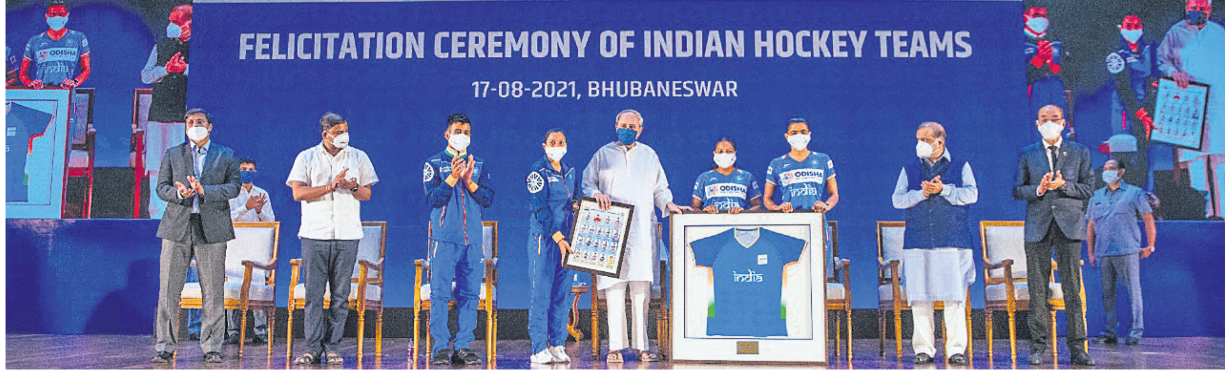
ମଙ୍ଗଳବାର ଲୋକସେବା ଭବନରେ ଆୟୋଜିତ ସମର୍ପଣ ଉତ୍ସବ ଅବସରରେ ମହିଳା ଓ ପୁରୁଷ ହକି ଦଳ ପକ୍ଷରୁ ପୁଷ୍ୟମନ୍ତ୍ରୀ ନବୀନ ପଟ୍ଟନାୟକଙ୍କୁ ଖେଳାଳିଙ୍କ ସ୍ୱାକ୍ଷରିତ ଜର୍ସି ଏବଂ ସ୍ମାରକୀ ପ୍ରଦାନ କରାଯାଇଛି । ନିକଟରେ ଅଛନ୍ତି ଅନ୍ତର୍ଜାତୀୟ ହକି ଫେଡେରେସନର ସଭାପତି ନରିନ୍ଦର ଧୂବ ବାହା, କ୍ରୀଡାମନ୍ତ୍ରୀ ତୁଷାରକାନ୍ତି ବେହେରା ଓ ଓଡ଼ିଶା ହକି ପ୍ରମୋଶନ କାର୍ଯ୍ୟକ୍ରମ ଅଧ୍ୟକ୍ଷ ଦିଲୀପ ଚିକା ।