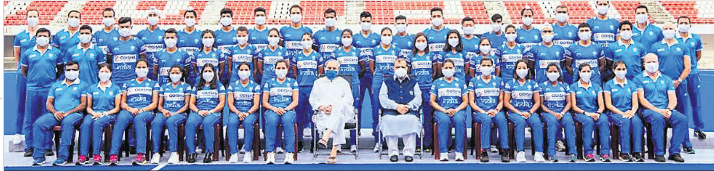
କଳିଙ୍ଗ ଷ୍ଟାଡିୟମରେ ଉଭୟ ମହିଳା ଓ ପୁରୁଷ ହକି ଦଳର ଖେଳାଳିଙ୍କ ସହ ପୁଷ୍ୟମନ୍ତ୍ରୀ ନବୀନ ପଟ୍ଟନାୟକ ଓ ଏସ୍.ଆଇ.ଏସ୍ ସଭାପତି ନରିନ୍ଦର ଧୂବ ବାହା ।