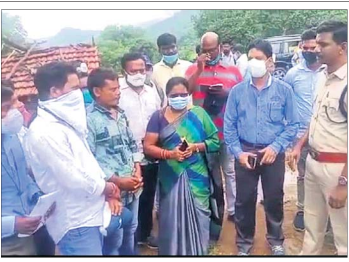
ଆଶ୍ର ଅଧିକାରୀମାନେ ଗ୍ରାମବାସୀଙ୍କ ସହ ଆଲୋଚନା କରୁଛନ୍ତି।

ପ୍ରଥମ ପୃଷ୍ଠା... ଡିଜେଲ ୨୪ପଇସା... ଲିଟର ପିଛା ୮୯.୪୭ ଟଙ୍କା ରହିଛି। ଦିଲ୍ଲୀରେ ମଧ୍ୟ ବୁଧବାର ଡିଜେଲ ୨୦ ପଇସା କମିଥିବା ସୂଚନା ମିଳିଛି। ସେହିପରି ନୂଆଦିଲ୍ଲୀରେ ପେଟ୍ରୋଲ ଦର ଘୁରି ରହିବା ସହ ଲିଟର ପିଛା ୧୦୧.୮୪ ଟଙ୍କାରେ ବିକ୍ରି ହେଉଛି। ପ୍ରକାଶ ଯେ, କୋଭିଡ୍ ମହାମାରୀ ସମୟରେ କ୍ରମାଗତ ଟେକ ଦର ବୃଦ୍ଧିକୁ ନେଇ ପଲ୍ଲୀରୁ ପାଲୀମେଣ୍ଡ ସଂଯମକ ଏହାକୁ ନେଇ ଚର୍ଚ୍ଚା ହେଉଥିଲା। ଏପରିକି ମହାମାରୀର ମାନ୍ୟତା ସମୟରେ ଡିଜେଲ ଦର ରେକର୍ଡସ୍ତର ଛୁଇଁବା ଯୋଗୁ ତା'ର ପ୍ରଭାବ ସବୁ କ୍ଷେତ୍ର ଉପରେ ପଡ଼ିଛି। ଏହାକୁ ନେଇ ବିରୋଧୀ ଓ ଖାଉଟି ଏପରିକି ବିଭିନ୍ନ ସଙ୍ଗଠନ ପକ୍ଷରୁ ମଧ୍ୟ କେନ୍ଦ୍ର ସରକାରଙ୍କ ବିରୋଧରେ ଅସନ୍ତୋଷ ପ୍ରକାଶ ସହ ବିରୋଧ ପ୍ରଦର୍ଶନ କରାଯାଇଥିଲା।