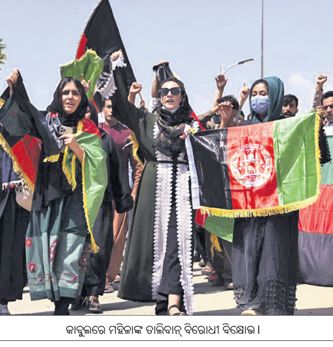
କାବୁଲରେ ମହିଳାଙ୍କ ତାଲିବାନ୍ ବିରୋଧୀ ବିକ୍ଷୋଭ।

କରିଥିବା ଅନେକ ବ୍ୟକ୍ତିଙ୍କ ବାବଦରେ ସମସ୍ୟା ଦେଖାଦେଇଛି। ତେବେ ଯେ ପଡ଼ିଲେ ଅଗଷ୍ଟ ୩୧ ପରେ ମଧ୍ୟ କାବୁଲରେ ରହିବେ ବୋଲି ରାଷ୍ଟ୍ରପତି ଜେ ବାଇଡେନ୍ କହିଛନ୍ତି। ସୈନ୍ୟ ପ୍ରତ୍ୟାହାର ନିଷ୍ପତ୍ତି ଠିକ୍ ବୋଲି ଦୋହରାଇ ବାଇଡେନ୍ କହିଛନ୍ତି, ତାଲିବାନ୍ ଗୋଷ୍ଠୀ ଆମେରିକା ନାଗରିକଙ୍କୁ ସେଠାକୁ ଫେରିବାରେ ସହଯୋଗ କରୁଛନ୍ତି। କିନ୍ତୁ ଆମେରିକା ଭାରି କରାଯିବ ସେଥିରେ ଦଶାୟାଇଛି।