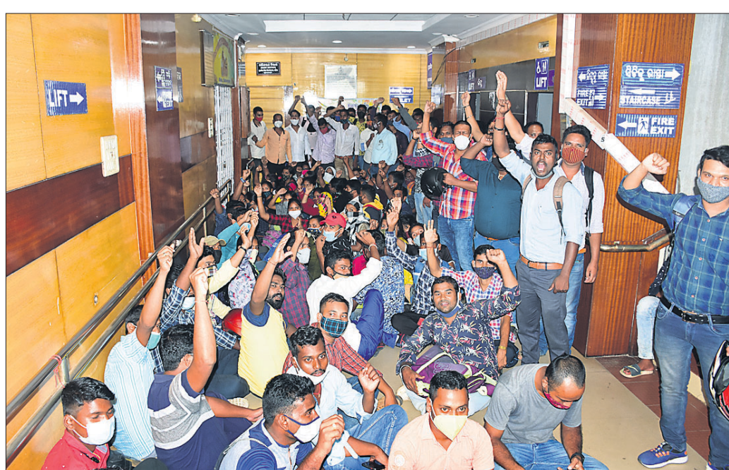
୯ ଟାଳା ସ୍ଥିତ ମାଧ୍ୟମିକ ଶିକ୍ଷା ନିର୍ଦ୍ଦେଶାଳୟ ପରିସର ମଧ୍ୟରେ ଗୁରୁବାର ପିଇଟି ଆଶାୟୀ ଛାତ୍ରାଛାତ୍ରୀମାନେ ବିରୋଧ ପ୍ରଦର୍ଶନ କରୁଛନ୍ତି।

ଭୁବନେଶ୍ୱର, ୧୯।୮ (ବୁଧବେଳା) ପିଇଟି ନିୟୁତ୍ତି ପ୍ରକ୍ରିୟାରେ ସଂଶୋଧନ ଦାବି କରି ଗୁରୁବାର ଅଲ୍ ଓଡ଼ିଶା ବିପିଇଟି ଓ ଏମ୍ପିଇଟି କ୍ଷୁଦ୍ର ଆସୋସିଏଟସ୍ ପକ୍ଷରୁ ନିର୍ଦ୍ଦେଶାଳୟ ଘେରାଉ କରାଯାଇଥିଲା। ସକାଳ ୮ଟାରୁ ଅପରାହ୍ଣ ୫ଟା ପର୍ଯ୍ୟନ୍ତ ଅଧିକ୍ ସମୁଦାୟ ଧାରଣା ଦିଆଯାଇଥିଲା। ପରେ ପୋଲିସ୍ ଡାକ୍ତରୀ ବଳପ୍ରୟୋଗ କରାଯିବାରୁ ଉଭେକନା ପ୍ରକାଶ ପାଇଥିଲା। ଏହି ସମୟରେ ଫିଜିକାଲ ଏକ୍ସକେଶନ ଚିତ୍ର (ପିଇଟି) ଆଶାୟୀ ଛାତ୍ରାଛାତ୍ରୀ ଓ ପୋଲିସ୍ ମଧ୍ୟରେ ଧସାଧସ ହୋଇଥିଲା। ଶେଷରେ ପୋଲିସ୍ ସେମାନଙ୍କୁ ଉଠାଇନେଇ ରିଟର୍ କରି ଛାଡ଼ିଥିଲା। ଏପରିକି ଛାତ୍ରାଛାତ୍ରୀଙ୍କୁ ମଧ୍ୟ ଦୁର୍ବ୍ୟବହାର କରାଯାଇଥିବା ଅଭିଯୋଗ ହୋଇଛି। ପୁଲିସ୍ ଯୋଗ୍ୟ, ଦୀର୍ଘ ୬ ବର୍ଷ ପରେ ଗତ ୧୩ ତାରିଖରେ ୧୨୭୦ ପିଇଟି ପୋଷ୍ଟ ପାଇଁ ବିଜ୍ଞପ୍ତି ପ୍ରକାଶ ପାଇଛି। ତେବେ ଏଥିରେ ସଂଶୋଧନ ଦାବି କରିଛନ୍ତି ବ୍ୟାଚେଲର ଅଫ୍ ଫିଜିକାଲ ଏକ୍ସକେଶନ (ବିପିଇଟି) ଓ ମାଷ୍ଟର ଅଫ୍ ଫିଜିକାଲ ଏକ୍ସକେଶନ (ଏମ୍ପିଇଟି) ଛାତ୍ରାଛାତ୍ରୀ। ବିଜ୍ଞପ୍ତି ଅନୁଯାୟୀ, ପିଇଟି ପଦବୀ ପାଇଁ