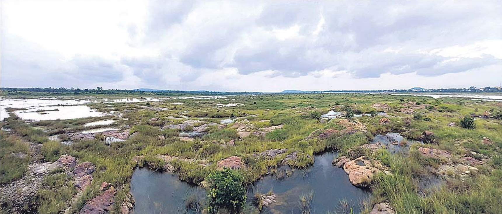
ଗ୍ରାବଣରେ ଶୁଖିଲା: ଗ୍ରାବଣ ଶେଷ ହେବାକୁ ବସିଥିବାବେଳେ ସମ୍ବଲପୁର ନିକଟ ମହାନଦୀ ଶୁଖିଲା ପଡ଼ିଛି।