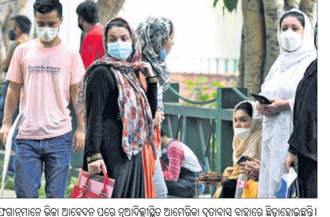
ଆଫଗାନୀୟାରେ ଭିନ୍ନ ଭିନ୍ନ ପ୍ରକାରର ଆନ୍ଦୋଳନ ହେବାରେ ଲାଗିଯାଇଛି। ଗୁରୁତ୍ୱ ଦେଖିବାରେ ଆସୁଥିବା ସମୟରେ ଆଫଗାନୀୟାରେ ବିଶେଷ କରି ଏହି ଅଞ୍ଚଳରେ ବହୁ ସଂଖ୍ୟାରେ ବାସ କରୁଛନ୍ତି। ଲକ୍ଷ୍ମପୁର ନଗରରେ 'ଲିଟଲ୍ କାବୁଲ' ନାମରେ ଏକ ରେଷ୍ଟୋରାଣ୍ଟରେ କାମ କରନ୍ତି ୨୩ ବର୍ଷୀୟ

ଦୁଆବିଲା, ୧୯୮୮: ୧୯୧୯ ପରଠାରୁ ପ୍ରତିବର୍ଷ ଅଗଷ୍ଟ ୧୯ରେ ସ୍ୱାଧୀନତା ଦିବସ ପାଇଁ ତାଲିବାନ କବଳକୁ ଦେଶ ତାଲିକା ସମୟରେ ପୁଣି ସିନା ସ୍ୱାଧୀନତା ଦିବସ ଫେରିଛି କିନ୍ତୁ ଆଫଗାନୀୟାରେ ଜାଣିଛି ଯେ ପୂର୍ବର ସେ ସ୍ୱାଧୀନତା ସେମାନଙ୍କ ପାଇଁ ସ୍ୱପ୍ନ ପାଇଟିବାକୁ ଯାଉଛି। ଭୟ ଓ ଆତଙ୍କର ବାତାବରଣରେ ସ୍ୱାଧୀନତା ଦିବସ ପାଇଁ ଉଦ୍ଧାସ ଦେଖାଯାଉଛି। ମନରେ ନ ଥିବାବେଳେ ଦିଲ୍ଲୀ 'ମିନି କାବୁଲ' କୁହାଯାଉଥିବା ଲକ୍ଷ୍ମପୁର ନଗର ସମେତ ଭାଗଲ ଏବଂ ହଜୁରତ ନିକାୟୁନରେ ମଧ୍ୟ ସମାନ ଦୁଶ୍ୱାସ ଦେଖାଯାଉଛି। ଆଫଗାନିସ୍ତାନରେ