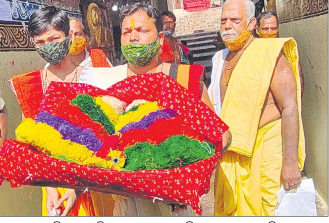
ମହାପ୍ରଭୁଙ୍କ ଲାଗି ପାଟରା ବିଶୋଭ ସେବକ ଶ୍ରୀମନ୍ଦିରକୁ ରାଖା ନେଉଛନ୍ତି।

ଶ୍ରୀମନ୍ଦିରରେ ରବିବାର ରକ୍ଷାବନ୍ଧନ ଉତ୍ସବ ଓ ପ୍ରଭୁ ବଳଭଦ୍ରଙ୍କ ଜନ୍ମ ନାତି ପାଳିତ ହୋଇଛି। ବଡ଼ଦେଉଳରେ ସ୍ୱତନ୍ତ୍ର ନୀତିକାଳି ହୋଇଥିବାବେଳେ ମହାପ୍ରଭୁ ଶ୍ରୀଜଗନ୍ନାଥ ଓ ବଡ଼ ଠାକୁର ପ୍ରଭୁ ବଳଭଦ୍ର ରାଖା ପିନ୍ଧିଛନ୍ତି।