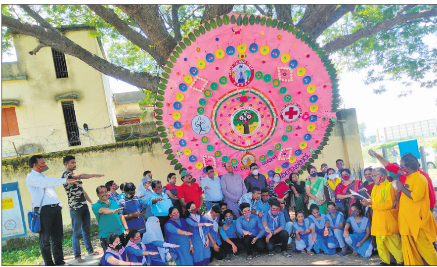
ବୌଦ୍ଧ ପଞ୍ଚାୟତ ମହାବିଦ୍ୟାଳୟ ପରିସରରେ ଏକ ଗଛରେ ବନ୍ଧାଯାଇଥିବା ରାଖୀ ।