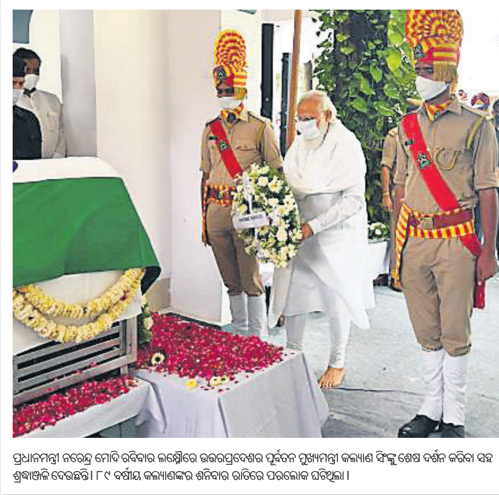
ପ୍ରଧାନମନ୍ତ୍ରୀ ନରେନ୍ଦ୍ର ମୋଦି ରବିବାର ଲକ୍ଷ୍ନୋରେ ଉତ୍ତରପ୍ରଦେଶର ପୂର୍ବତନ ମୁଖ୍ୟମନ୍ତ୍ରୀ କଲ୍ୟାଣ ସିଂଙ୍କୁ ଶେଷ ଦର୍ଶନ କରିବା ସହ ଶ୍ରଦ୍ଧାଞ୍ଜଳି ଦେଇଛନ୍ତି । ୮୯ ବର୍ଷୀୟ କଲ୍ୟାଣଙ୍କର ଶନିବାର ରାତିରେ ପରଲୋକ ଘଟିଥିଲା ।

ତାଲିବାନ୍ ଆତଙ୍କବାଦୀଙ୍କଠାରୁ ଛାତ୍ରୀଙ୍କୁ ସୁରକ୍ଷା ଦେବାକୁ ଆଫଗାନିସ୍ତାନର ଏକ ବାଲିକା ବୋର୍ଡ଼ ସ୍କୁଲର ପ୍ରତିଷ୍ଠାତା ସମସ୍ତ ରେକର୍ଡ଼ ଓ ଦସ୍ତାବିଜ ପୋଡ଼ି ନଷ୍ଟ କରୁଛନ୍ତି ।