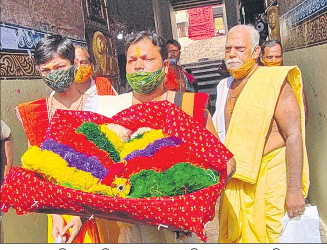
ମହାପ୍ରଭୁଙ୍କ ଲାଗି ପାଟରା ବିଶୋଭ ସେବକ ଶ୍ରୀମନ୍ଦିରକୁ ରାଖା ନେଉଛନ୍ତି।