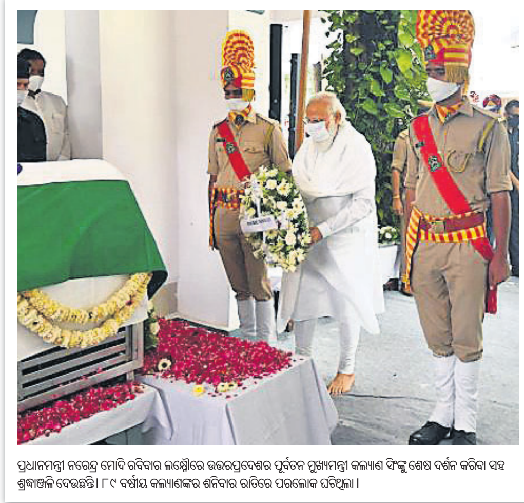
ପ୍ରଧାନମନ୍ତ୍ରୀ ନରେନ୍ଦ୍ର ମୋଦି ରିବିବାର ଲକ୍ଷ୍ମିପୁର ଉତ୍ତରପ୍ରଦେଶର ପୂର୍ବତନ ମୁଖ୍ୟମନ୍ତ୍ରୀ କଲ୍ୟାଣ ସିଂଙ୍କୁ ଶେଷ ଦର୍ଶନ କରିବା ସହ ଶ୍ରଦ୍ଧାଞ୍ଜଳି ଦେଇଛନ୍ତି । ୮୯ ବର୍ଷୀୟ କଲ୍ୟାଣଙ୍କର ଶନିବାର ରାତିରେ ପରଲୋକ ଘଟିଥିଲା ।

ବିକ୍ଷୋଭକାରୀ ଏବଂ ଇସ୍ତାଫକାର ସୁରକ୍ଷାଦଳ ମଧ୍ୟରେ ସାମାଜିକ ସଂଘର୍ଷ ଯୋଗୁ ଇସ୍ତାଫକାର ମୁକ୍ତ ବିମାନ ଗାଜାରେ ହମାସ୍ ଆତଙ୍କବାଦୀ ଗୋଷ୍ଠୀର କେତେକ ପୋଷ୍ଟ ଉପରେ ଶନିବାର ଆକ୍ରମଣ କରିଛି । ପାଲେଷ୍ଟାଇନ୍ ଗୁରୁତର ହୋଇଛନ୍ତି । ମଧ୍ୟ ଏବଂ ପଶ୍ଚିମ ଗାଜା ସ୍ତ୍ରୀମାନେ ଅନେକ ହମାସ୍ ପୋଷ୍ଟ ଓ ଭିତ୍ତିଭୂମି ନଷ୍ଟ ହୋଇଛି । ଇସ୍ତାଫକାର ସୈନ୍ୟଙ୍କ ଆକ୍ରମଣରେ ୪୧ ପାଲେଷ୍ଟାଇନ୍ ବାସିନ୍ଦା ଆହତ ହୋଇଥିବା ଗାଜା ହସିଗାଳ କର୍ତ୍ତୃପକ୍ଷ କହିଛନ୍ତି । ହମାସ୍ ପକ୍ଷରୁ କୁହାଯାଇଛି, ୨୦୦୭ରୁ ଇସ୍ତାଫକାର ସାହାଯ୍ୟରେ ଇସ୍ତାଫକାର ଗାଜା ଓ ଏହାର ଆଖପାଖ ଅଞ୍ଚଳରେ ଲୋକଙ୍କ ସମେତ ବିଭିନ୍ନ ସାମଗ୍ରୀ ପରିବହନ ଉପରେ କଟକଣା ଲାଗାଇଛି । ଏହା ବ୍ୟତୀତ ଇସ୍ତାଫକାର ହମାସ୍ ପ୍ରତିରୋଧକ କର୍ତ୍ତୃପକ୍ଷ ପକ୍ଷରୁ ଉପରେ କଟକଣା ଲାଗାଇଛି । ପୁରାଣରେ ସବୁଠାରୁ ବଡ଼ ମୁକ୍ତ କୁହାଯାଉଥିବା ମହାଭାରତରେ ବର୍ଷିତ ହୋଇଛି ଗାଜା ବିଷୟରେ । ଅର୍ଥାତ୍ ଆଫଗାନିସ୍ତାନ ଭାରତ(ସେପ୍ଟେମ୍ବର)ର ସମ୍ପର୍କ ହଜା