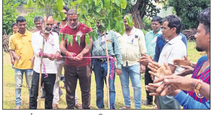
ଯୁବକ ଚୁର୍ଣ୍ଣାମେଣ୍ଟ ଉଦ୍‌ଘାଟନ କରାଯାଇଛି।

ଦେବଗଡ଼, ୨୩।୮ (ଡି.ଏନ୍.ଏ.) ବାରକୋଟ ବ୍ଲକ ରମେଇ ପଞ୍ଚାୟତ ଶିରୋତ୍ତମି (ସାନ) ଗ୍ରାମ ମା'ମଙ୍ଗଳା କୁବ ଆନୁଷ୍ଠାନରେ ଗ୍ରାମ ପଡ଼ିଆଠାରେ ସୋମବାରଠାରୁ ଆରମ୍ଭ ହୋଇଥିବା ତ୍ରିଦିବସୀୟ ଯୁବକ ଚୁର୍ଣ୍ଣାମେଣ୍ଟ ଆୟୋଜିତ ଶିରୋତ୍ତମି (ସାନ) ଗ୍ରାମ ମା' ମଙ୍ଗଳା କୁବ ବଡ଼କଟା, ସୁନ୍ଦରଗଡ଼ ଯୁବକ ଚୁର୍ଣ୍ଣାମେଣ୍ଟ ୧-୦ ଗୋଲରେ ପରାସ୍ତ କରିଥିଲା। ମ୍ୟାଚକୁ ରେଫରୀ ଭାବେ