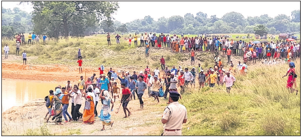
ଜନଶୁଣାଣିକୁ ଅନୁକରଣ କରି ପକ୍ଷରୁ ବିରୋଧ କରାଯାଇଛି।

ସୁନ୍ଦରଗଡ଼/ରାଜଗାଙ୍ଗପୁର/କୁତ୍ରା, ୨୩।୮ (ଡି.ଏନ୍.ଏ.)