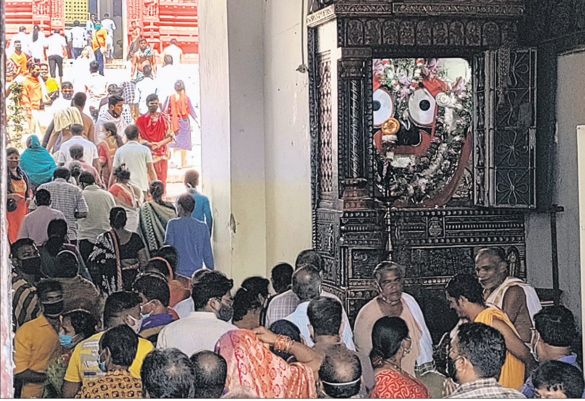
ଦୀର୍ଘ ୪ ମାସର ଅପେକ୍ଷା ପରେ ସୋମବାର ସର୍ବସାଧାରଣ ମହାପ୍ରଭୁଙ୍କ ଦର୍ଶନ ଲାଭିବେ।