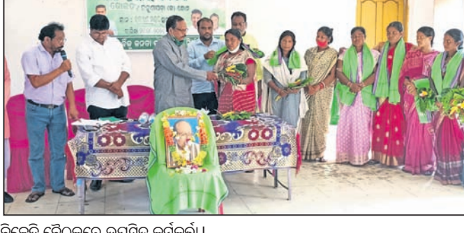
ବିଜେଡି ବୈଠକରେ ଉପସ୍ଥିତ କର୍ମକର୍ତ୍ତା।