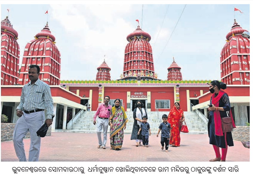
ଭୁବନେଶ୍ୱରରେ ସୋମବାରଠାରୁ ଧର୍ମାବଲମ୍ବୀ ଖୋଲିଥିବାବେଳେ ରାମ ମନ୍ଦିରରୁ ଠାକୁରଙ୍କୁ ଦର୍ଶନ କରି ଶ୍ରଦ୍ଧାଳୁମାନେ ବାହାକୁଛନ୍ତି।