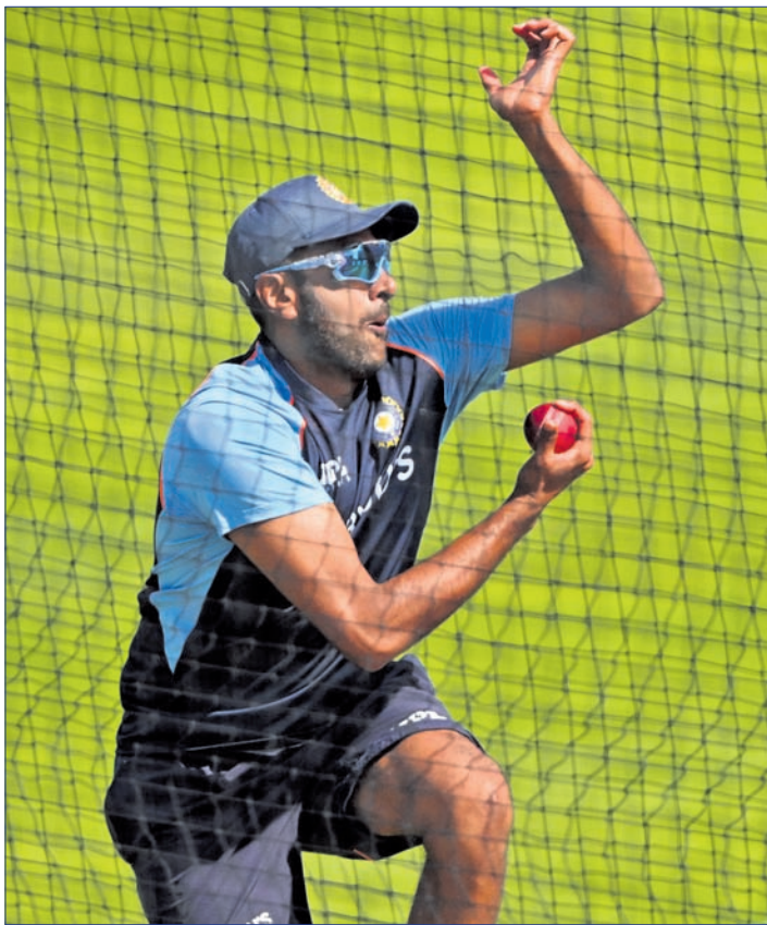
ମଙ୍ଗଳବାର ନେଟ୍‌ରେ ବୋଲିଂ ଅବସରରେ ଭାରତର ରବିନ୍ଦ୍ରନ ଅଶ୍ୱିନ।

ଅବଶ୍ୟ ଦଳ ପାଇଁ ଆଶ୍ଚର୍ଯ୍ୟ ଆଣିଦେଇଛି। ଭୁବନେଶ୍ୱରରେ ଚଳିଥିବା ଟେଷ୍ଟର ଶେଷ ଖେଳାଳିମାନେ ପୁଣି କେହି ପ୍ରତିକୂଳ ପରିସ୍ଥିତିରେ ଭିତ୍ତି ଟେକିବା ପାଇଁ ଚେଷ୍ଟା କରିଛନ୍ତି।