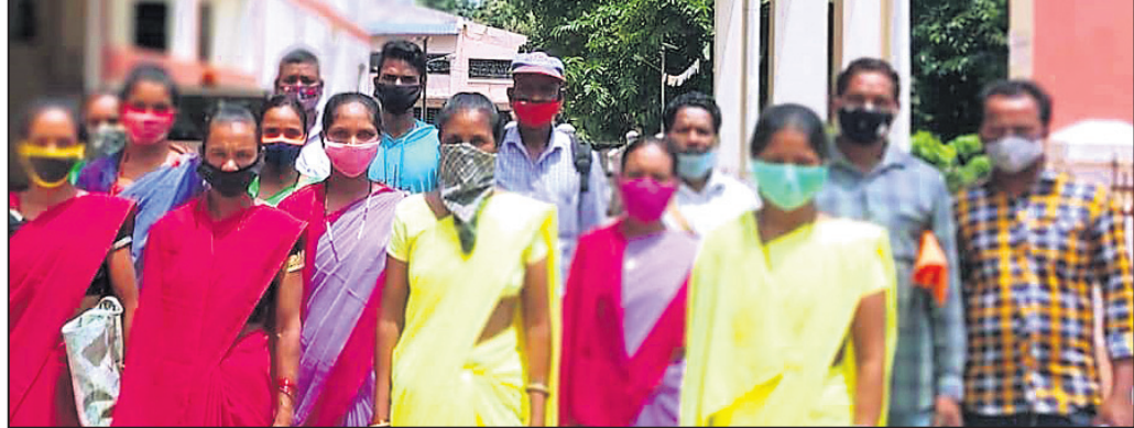
ଦାବିପତ୍ର ପ୍ରଦାନ କରିବାକୁ ଆସିଥିବା ଗ୍ରାମବାସୀ। ପାରଳାଖେମୁଣ୍ଡି, ୨୪୮୮ (ଡି.ଏନ.ଏ.)

ଗୁମ୍ମା ବ୍ଲକ୍ ପୁନିଃ ପଞ୍ଚାୟତ ଅନ୍ତର୍ଗତ ଟି.ବାରଙ୍ଗସିଂ ଗ୍ରାମରେ କମ୍ପ୍ୟୁଟିଟି ହଲ୍ ନିର୍ମାଣ ପାଇଁ ଗ୍ରାମବାସୀ ପ୍ରଶାସନର ଦାବିପତ୍ର ଗ୍ରହଣ କରିଛନ୍ତି।