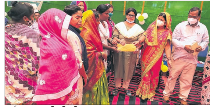
କାର୍ଯ୍ୟକ୍ରମରେ ଉପସ୍ଥିତ ବିଧାୟିକା ଓ ଅନ୍ୟମାନେ। ବେଗୁନିଆପଡ଼ା, ୨୪୮୮ (ଡି.ଏନ.ଏ.)

ବେଗୁନିଆପଡ଼ା ବ୍ଲକ୍ ପରିସରରେ ମିଶନ ଶକ୍ତି ଆନୁକୂଲ୍ୟରେ ମହିଳା ରଣ ପ୍ରଦାନ ମେଳା ମଙ୍ଗଳବାର ଅନୁଷ୍ଠିତ ହୋଇଯାଇଛି।