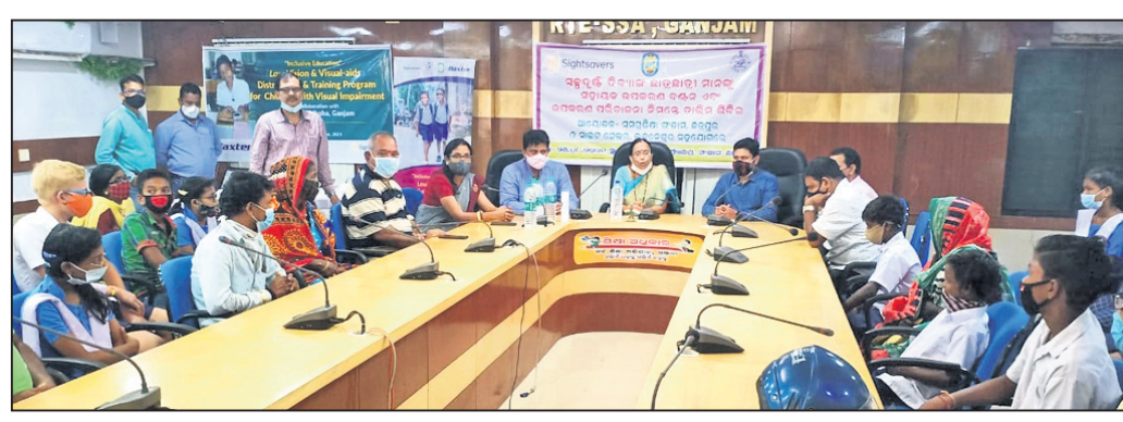
ସମଗ୍ର ଶିକ୍ଷା ଅଭିଯାନ କାର୍ଯ୍ୟାଳୟ ପରିସରରେ ଆଲୋଚନା ଚାଲିଛି। ଛତ୍ରପୁର, ୨୪୮୮ (ଡି.ଏନ.ଏ.)

ଗୁମ୍ମା ସମଗ୍ର ଶିକ୍ଷା ଅଭିଯାନ କାର୍ଯ୍ୟାଳୟ ପରିସରରେ ସମଗ୍ର ଶିକ୍ଷା ଓ ସାକ୍ଷର ସେଭରର ମିଳିତ ଆନୁକୂଲ୍ୟରେ ସ୍ୱଳ୍ପ ଦୃଷ୍ଟିବାଧିତ ଛାତ୍ରାଛାତ୍ରୀଙ୍କୁ ସହାୟକ ଉପକରଣ ବଣ୍ଟନ କରାଯାଇଛି।