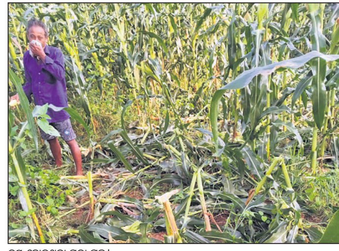
ନଷ୍ଟ ହୋଇଥିବା ମକା ଗଛ। ବୁଗୁଡ଼ା, ୨୪୮୮