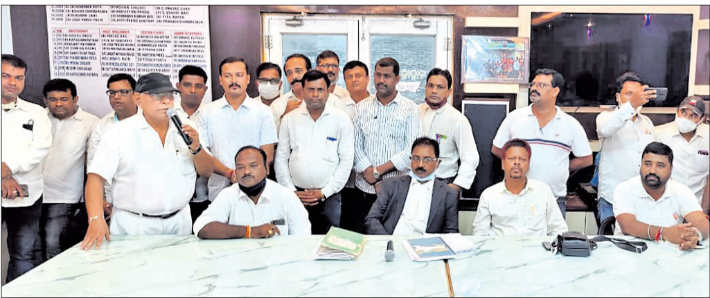
ବୈଠକରେ ଉପସ୍ଥିତ ସଂଘ କର୍ମକର୍ତ୍ତା।