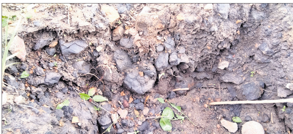
କଟିକିଆ ନିକଟ ରାସ୍ତା ପାର୍ଶ୍ୱ ମାଟି ତଳେ ବେଶା ଯାଉଥିବା କୋଇଲା।

କନ୍ୟାମାନଙ୍କୁ କୋଇଲା ଖଣିକ ସମ୍ପଦ ଉତ୍ତୋଳନ କରାଯାଇଥିଲା। ଉତ୍ତୋଳନ ସ୍ଥଳ ଥିବା ଖଣି ସଂରକ୍ଷିତ ଜଙ୍ଗଲରେ ଆସୁଥିବାରୁ ଏହାକୁ ବନ୍ଦ କରି ଦିଆଗଲା। ୨୦୦୦ ମସିହାରୁ ଜିଲ୍ଲାରେ ଖଣି ଖନନ କାର୍ଯ୍ୟ ସମ୍ପୂର୍ଣ୍ଣ ବନ୍ଦ ରହିଥିବା ବେଳେ ଏବେ ପୁଣି କାର୍ଯ୍ୟ ଆରମ୍ଭ କରିବାକୁ ସରକାରୀସ୍ତରରେ ଉଦ୍ୟମ ଚାଲିଛି। ଓଡ଼ିଶା ସେସ ଆୟିକେଶନ ସେକ୍ଟର (ଓଉସାକ୍) ଦ୍ୱାରା ବିଭିନ୍ନ ସମୟରେ ଡିଫରେନସିଆଲ ଗ୍ଲୋବାଲ ପୋଲିସିଂ ସିଷ୍ଟମ (ଡିଜିପିଏ) ସର୍ଭେ କରାଯାଇଛି। ସେହିପରି ଖଣି ବିଭାଗର ଭୂତତ୍ତ୍ୱ ଶାଖା ପକ୍ଷରୁ ମଧ୍ୟ ସର୍ଭେ କରାଯାଇଛି। ଜିଲ୍ଲାରେ ଭରପୁର କୋଇଲା ଥିବା ସମ୍ପାନ ମିଳିଛି। ଫୁଲବାଣୀ-ଗୋଲ୍ଡାପଡ଼ା ରାସ୍ତା କଟିକିଆ ବେଲ ସମ୍ପଲ୍ଲପୁର ପର୍ଯ୍ୟନ୍ତ କୋଇଲା ଖଣି ଥିବା ଅନୁମାନ ପରେ ବିଭିନ୍ନ ଖଣି ଉତ୍ତୋଳନକାରୀ ସମ୍ପ୍ରଦାୟ ଆସି ତାହାର ଗୁଣ ଏବଂ କେଉଁ ଅବସ୍ଥାରେ ରହିଛି ଆକଳନ କରୁଛନ୍ତି। ସେହିପରି ଜିଲ୍ଲାରେ ବକ୍ସାଇଟର ମଧ୍ୟ ସମ୍ପାନ ମିଳିଛି। ଏସବୁକୁ ଲକ୍ଷ୍ୟ କଲେ