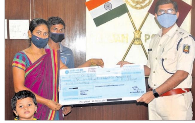
ଏସ୍ପି ତେଜ ପ୍ରଦାନ କରୁଛନ୍ତି।