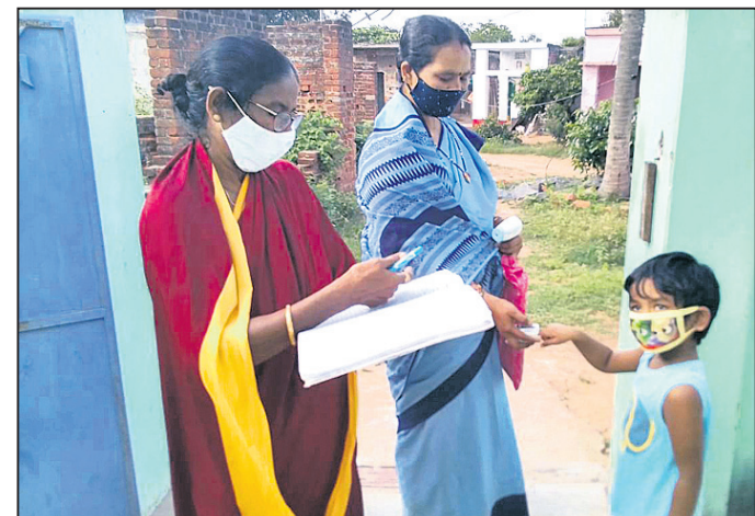
ଶିଶୁଙ୍କ ସ୍ୱାସ୍ଥ୍ୟ ସୁନି କରାଯାଇଛି। ସମ୍ଭାବନା ଥିବାରୁ ଏଭଳି ନିଷ୍ପତ୍ତି ଗ୍ରହଣ କରାଯାଇଛି।

କରୋନାର ସମ୍ଭାବ୍ୟ ତୃତୀୟ ଲହରୀରେ ବିଶେଷକରି ଶିଶୁମାନେ ସଂକ୍ରମିତ ହେବା ଆଶଙ୍କା ରହିଛି। ଏହି ପରିପ୍ରେକ୍ଷାରେ ଗଞ୍ଜାମ ଜିଲ୍ଲା ପ୍ରଶାସନ ପକ୍ଷରୁ ଆଗୁଆ ପଦକ୍ଷେପ ଗ୍ରହଣ କରି ମଙ୍ଗଳବାର ଘରକୁ ଘର ବୁଲି ଶିଶୁଙ୍କ ସ୍ୱାସ୍ଥ୍ୟ ସୁନି ପୁଣି ଆରମ୍ଭ ହୋଇଛି।