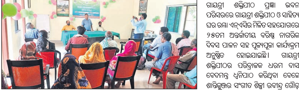
କାର୍ଯ୍ୟକ୍ରମରେ ଉପସ୍ଥିତ ଅତିଥି। ବୁଗୁଡ଼ା, ୨୪୮୮ (ଡି.ଏନ.ଏ.)

ବୁଗୁଡ଼ା ବନାଞ୍ଚଳ ଉନ୍ନୟନ ପ୍ରକଳ୍ପ ପକ୍ଷରୁ ଗୁମ୍ମା ବନାଞ୍ଚଳ ସଭା ପକ୍ଷରେ ମଙ୍ଗଳବାର ବନ ସୁରକ୍ଷା ସମିତି ନିମନ୍ତେ ଏକ ତାଲିମ ଶିବିର ଅନୁଷ୍ଠିତ ହୋଇଯାଇଛି।