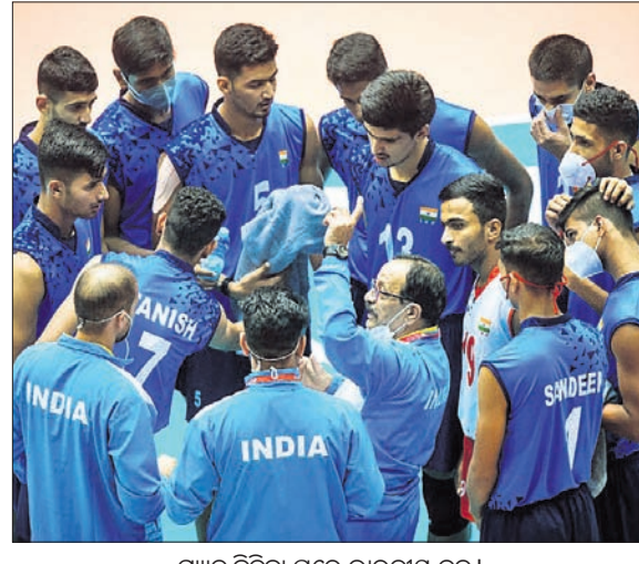
ମ୍ୟାଚ ଜିତିବା ପରେ ଭାରତୀୟ ଦଳ ।

ଭୁବନେଶ୍ୱର, ୨୪।୮ (କ୍ରୀଡ଼ା ପ୍ରତିନିଧି) ଭାରତୀୟ ଚଳିତା ଦଳର ୯୯ ବର୍ଷରୁ କମ୍ ବିଶ୍ୱ ଭଲିବଲ ଚାମ୍ପିୟନଶିପରେ ଭାରତ ବିଜୟ ହୋଇଛି । ସେପ୍ଟେମ୍ବର ୨ ପର୍ଯ୍ୟନ୍ତ ଚାଲିବାକୁଥିବା ଏହି ପ୍ରତିଯୋଗିତା ପାଇଁ କିଛି ବିଶ୍ୱବିଦ୍ୟାଳୟ ଭାରତୀୟ ଦଳର ଚୟନ ଗ୍ରାହଣ ଓ ଟ୍ରେନିଂ କ୍ୟାମ୍ପ ଅନୁଷ୍ଠିତ ହୋଇଥିଲା । ଭାରତ ପକ୍ଷରୁ ଚଳିତା ଚାମ୍ପିୟନଶିପରେ ୨୧ ପର୍ଯ୍ୟନ୍ତ ହାସଲ କରିଥିବାବେଳେ ଅନ୍ୟ ଦଳମାନଙ୍କୁ ୧୯ ପର୍ଯ୍ୟନ୍ତ ଅର୍ଜନ କରିଥିଲେ । ଭାରତୀୟ ଦଳ ପୂର୍ବ 'ଏ' ଗ୍ରୋପ୍ ଆୟୋଜକ ଜାଭାନ, ପୋଲଣ୍ଡ, ନାଲଜେରିଆ ଓ ଟାଓଗୋଲୀ ସହିତ ଗ୍ରାମ ପାଇଛି । ପରବର୍ତ୍ତୀ ମ୍ୟାଚରେ ଭାରତ ୨୫ ଡିସେମ୍ବରରେ ଭାରତକୁ ଭେଟିବ ।