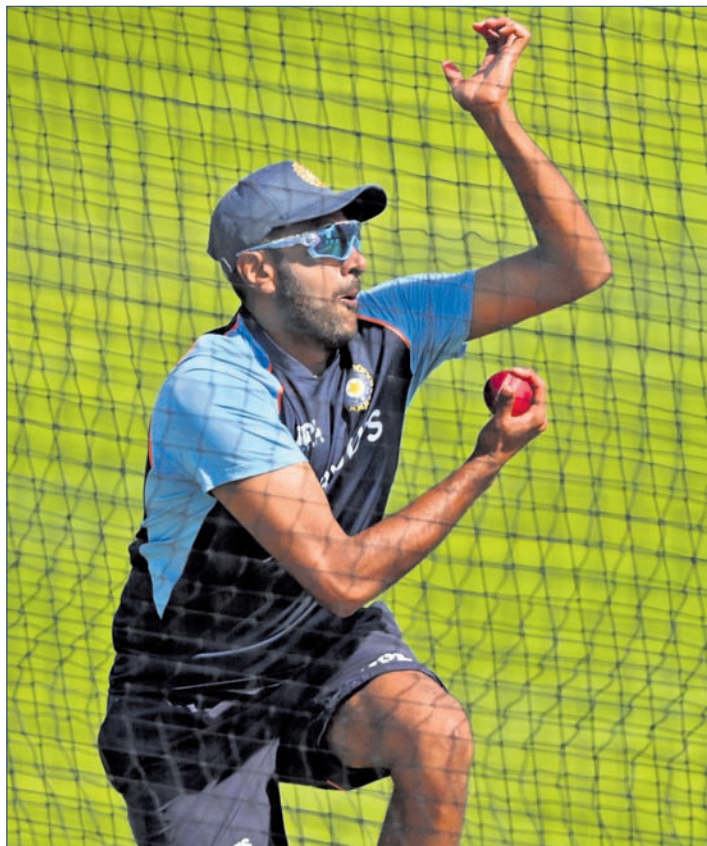
ମଙ୍ଗଳବାର ନେଟ୍‌ରେ ବୋଲିଂ ଅବସରରେ ଭାରତର ରବିନ୍ଦ୍ରନ ଅଶ୍ୱିନ।

ଅବଶ୍ୟ ଦଳ ପାଇଁ ଆଶ୍ଚର୍ଯ୍ୟ ଆଣିଦେଇଛି। ଭୁବନେଶ୍ୱରରେ ଚଳିଥିବା ଟେଷ୍ଟରେ ଭାରତ ପାଇଁ ସୁଯୋଗ ସୃଷ୍ଟି କରିଛି।