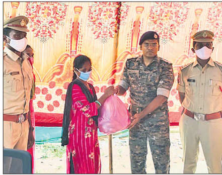
ପୋଲିସ ନିକଟରେ ଆତ୍ମସମର୍ପଣ କରିଥିବା ବୁଦ୍ଧି ଜିଲାର ସହକାରୀ ପୋଲିସ ଅଧିକାରୀଙ୍କ ନିକଟରେ ବୁଦ୍ଧି ଆତ୍ମସମର୍ପଣ କରିଥିଲେ। ସରକାରୀ ଶୁକ୍ରବାର ଛତିଶଗଡ଼ ଓ ତେଲଙ୍ଗାନା ରାଜ୍ୟରେ ୫୪୯୦ ବସ୍ତା ସୁରକ୍ଷା ସାର ଜବତ ମହିଳା ମାଓବାଦୀଙ୍କ ଆତ୍ମସମର୍ପଣ କରିଥିଲେ।