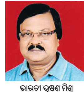
ଭାରତୀୟ ହକି ସେବାରେ

ଡ୍ରୋଞ୍ଚି ପଦକରେ ସମ୍ମାନ ସେବାକୁ ବାଧ୍ୟ ହେଲେ । ୧୯୭୬ର ମଣ୍ଟ୍ରିଲ ଗେମ୍ସରେ ଭାରତୀୟ ହକିର ଚରଣ ଅବନତି ଦେଖାଦେଲା ଓ ଦଳ ସମ୍ପୂର୍ଣ୍ଣ ସ୍ତରରେ ରହିଲା । ୧୯୮୦ ଅଲିମ୍ପିକ୍ସ କ୍ରୀଡ଼ାରେ ଆମେରିକା ଓ ଚୀନ ମିଡ୍ରୋଷ୍ଟମାନେ ରୁଷିଆର ମସ୍ୟା ଅଲିମ୍ପିକ୍ସକୁ ଶୀତଳ ମୁହଁ ପରିସ୍ଥିତିରେ ବାସ୍ତବ କରିବା ହେବୁ ଅପେକ୍ଷାକୃତ କମ୍ ଗୁରୁତ୍ୱ ବହନ କଲା ଅଲିମ୍ପିକ୍ସ । ଭାରତ ଏହି କ୍ରୀଡ଼ାରେ ସର୍ବ ପଦକ ହାସଲ କଲା ।