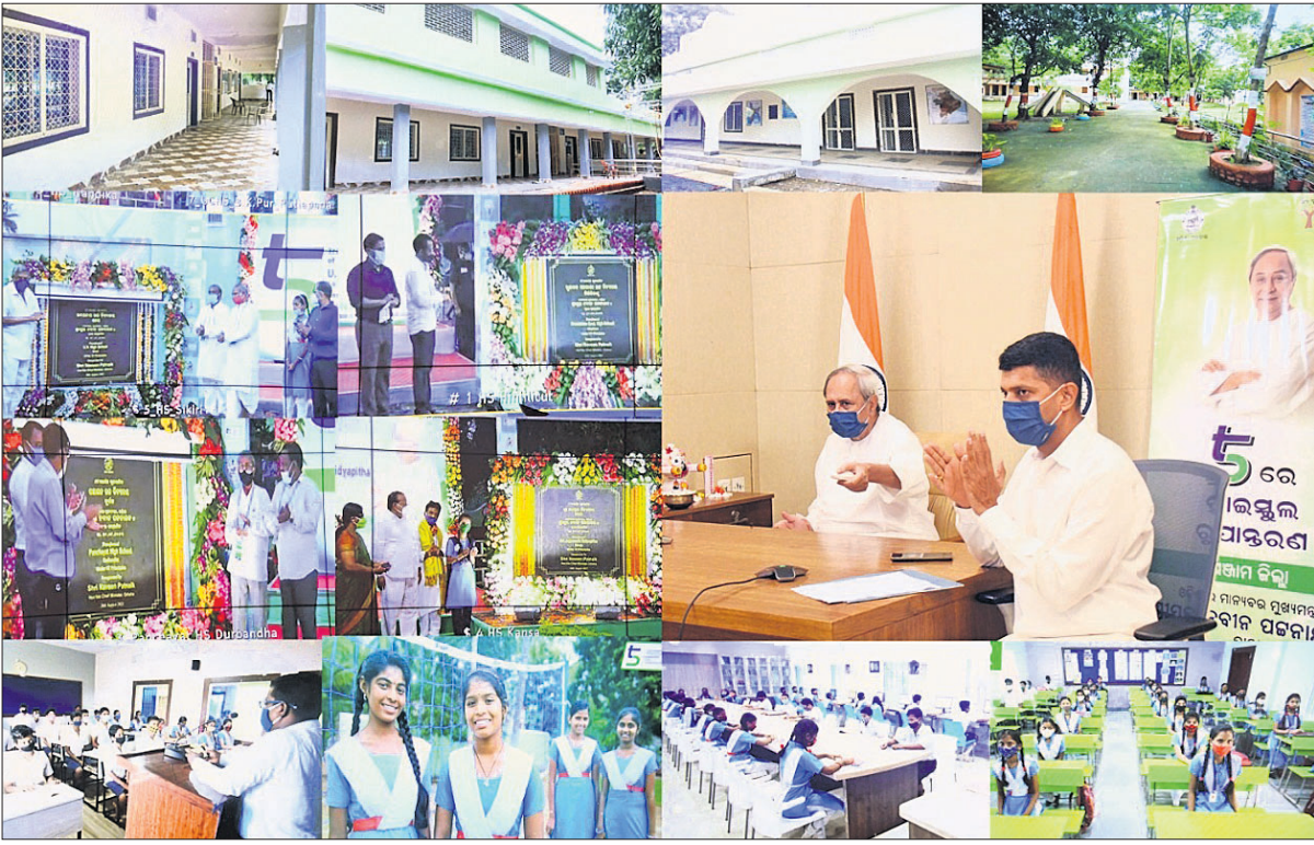
କିଛି କର୍ମଚାରୀଙ୍କୁ ମାଧ୍ୟମରେ ଶନିବାର ପୁଖ୍ୟମନ୍ତ୍ରୀ ନବୀନ ପଟ୍ଟନାୟକ ହିଞ୍ଜିଳିର ଆଇ ୧୦ ସ୍କୁଲକୁ ୫-ଟି ସ୍କୁଲ ରୂପାନ୍ତରଣ କାର୍ଯ୍ୟକ୍ରମକୁ ଉଦ୍‌ଘାଟନ କରୁଛନ୍ତି।