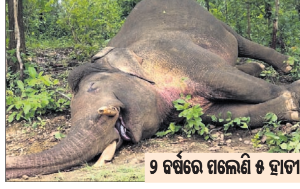
ରେଡ଼ାଖୋଲ, ୨୮ (ଡି.ଏନ.ଏ.)