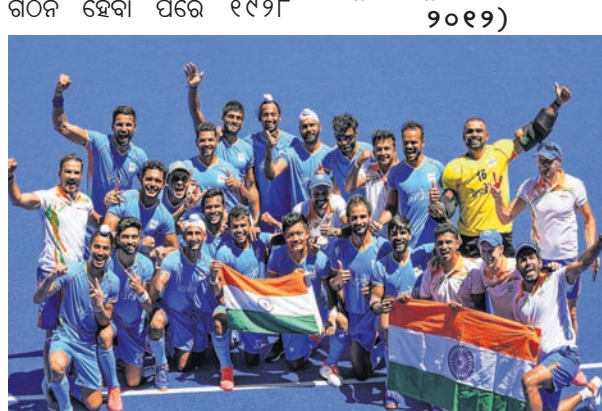
ଡ୍ରୋଞ୍ଚି ଅଲିମ୍ପିକ୍ସରେ ଡ୍ରୋଞ୍ଚି ପଦକ ବିଜୟୀ ଭାରତୀୟ ପୁରୁଷ ହକି ଦଳ ।

ସର୍ବୋତ୍ତମ ପର୍ଯ୍ୟାୟ (୧୯୨୮-୧୯୫୯) ଭାରତୀୟ ହକି ଫେଡରେଶନ ଗଠନ ହେବା ପରେ ୧୯୨୮