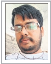
ପ୍ରତିକୃତ ପଲାଇ, କଟକ