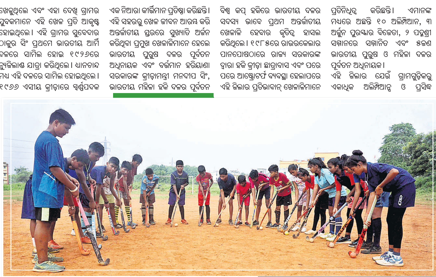
ଭାରତୀୟ ହକି ସେବାରେ ପ୍ରମୁଖ ଭୂମିକା ଗ୍ରହଣ କରିଥିବା ପଞ୍ଜାବର ସନ୍ଧ୍ୟାରପୁର, ହରିୟାଣାର ସାହାବାଦ ଏବଂ ଓଡ଼ିଶାର ସୁନ୍ଦରଗଡ଼ ବିଶେଷରେ କିଛି ଆଲୋଚନା କରିବା ପ୍ରାସଙ୍ଗିକ ମନେହୁଏ ।

ଅଲିମ୍ପିକ୍ସରେ ଭାରତୀୟ ହକିର ପୁରସ୍କୃତ ଯୁଗ ଆରମ୍ଭ ହୋଇଥିଲା ୧୯୨୮ ଆମଷ୍ଟରଡ଼ାମ ଅଲିମ୍ପିକ୍ସ କ୍ରୀଡ଼ାକୁ ଏବଂ ଏହାର ପୁଷ୍ପ କର୍ଣ୍ଣଧାର ଥିଲେ ହକିର ସର୍ବକାଳୀନ ମହାନ ଖେଳାଳି ମେଜର ଧ୍ୟାନଚାନ୍ଦ । ୧୯୮୦ ମସିହା ଅଲିମ୍ପିକ୍ସରେ ଭାରତ ଶେଷଥରପାଇଁ ସର୍ବ ପଦକ ଜିତିଥିଲା । ତେବେ ଏହାପରେ ଅଧଃପତନ ଆରମ୍ଭ ହୋଇ ଯାଇଥିଲା । ଦୀର୍ଘ ୪୧ ବର୍ଷ ପରେ ସନ୍ଧ୍ୟା ସମାପ୍ତ ହେବାରୁ ଅଲିମ୍ପିକ୍ସ କ୍ରୀଡ଼ାରେ ଭାରତୀୟ ପୁରୁଷ ହକି ଦଳ (ଡ୍ରୋଞ୍ଚିପଦକ) ଏବଂ ମହିଳା ହକି ଦଳ (୪ର୍ଥ ପ୍ଲେସ)ର ପ୍ରଭାବା ପ୍ରଦର୍ଶନ ଭାରତୀୟ ହକି ପାଇଁ ନୂଆ ଆଶା ସୃଷ୍ଟି କରିଛି । ଏହି ପରିସ୍ଥିତିରେ ବିଗତ ୯୩ ବର୍ଷ (୧୯୨୮ରୁ ୨୦୧୧) ଅଲିମ୍ପିକ୍ସ ହକି ଇତିହାସରେ ଭାରତୀୟ ହକି ପାଇଁ ଉଲ୍ଲେଖନୀୟ ସେବା ପ୍ରଦାନ କରିଥିବା ପଞ୍ଜାବର ସନ୍ଧ୍ୟାରପୁର, ହରିୟାଣାର ସାହାବାଦ ଏବଂ ଓଡ଼ିଶାର ସୁନ୍ଦରଗଡ଼ ବିଶେଷରେ କିଛି ଆଲୋଚନା କରିବା ପ୍ରାସଙ୍ଗିକ ମନେହୁଏ ।