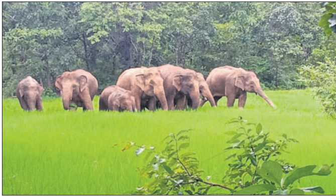
ନଡ଼ପୁର ଜଙ୍ଗଲରୁ ବାହାରି ଧାନକ୍ଷେତରେ ପଶିଛନ୍ତି ହାତୀପଲଙ୍କ।

ମୟୂରଭଞ୍ଜ ଜିଲ୍ଲା ବେତନଟା ରେଞ୍ଜ ଅଞ୍ଚଳରେ ହାତୀପଲଙ୍କ ଉପଦ୍ରବ ଚଳାଇଛନ୍ତି। ଦିନତମାମ ଜଙ୍ଗଲରେ ରହି ଅପରାହ୍ନରେ ଚଳପ୍ରଚଳ କରୁଛନ୍ତି। ଉକ୍ତ ଅଞ୍ଚଳରେ ଥିବା ଧାନ ଓ ପରିବା କ୍ଷେତକୁ ମାଡ଼ି ଫସଲ ନଷ୍ଟ କରିବା ସହ ବ୍ୟାପକ କ୍ଷତି ଘଟାଇଛନ୍ତି। ହାତୀଗୁଡ଼ିକ ଖାଦ୍ୟ ଅନୁଷ୍ଠାନରେ ଜଙ୍ଗଲ ଛାଡ଼ି ଗ୍ରାମ୍ୟ ଜଙ୍ଗଲ ମୁହାଁ ହେଉଥିବାରୁ ଲୋକେ ଆତଙ୍କିତ ଅବସ୍ଥାରେ ରହୁଛନ୍ତି। ପ୍ରକାଶ ଯେ, ୧୫ ଦିନ ପୂର୍ବେ ଝାଡ଼ଖଣ୍ଡରୁ ଆସିଥିବା ୨୫ଟିହାତୀ ହାତୀପଲଙ୍କ ଦାକ୍ଷିଣ୍ୟ-ଚିତ୍ରା ଅଞ୍ଚଳର ଦୁର୍ଗାପୁର ଜଙ୍ଗଲ ଏବଂ ଶିମିଳିପାଳକୁ