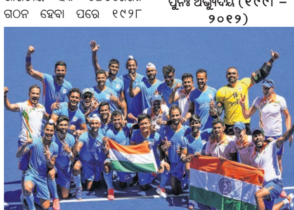
ଡ୍ରୋଞ୍ଚି ଅଲିମ୍ପିକ୍ସରେ ଡ୍ରୋଞ୍ଚି ପଦକ ବିଜୟୀ ଭାରତୀୟ ପୁରୁଷ ହକି ଦଳ ।

ସର୍ବମୁଖ୍ୟ ପର୍ଯ୍ୟାୟ (୧୯୨୮-୧୯୫୯) ଭାରତୀୟ ହକି ଫେଡରେଶନ ଗଠନ ହେବା ପରେ ୧୯୨୮