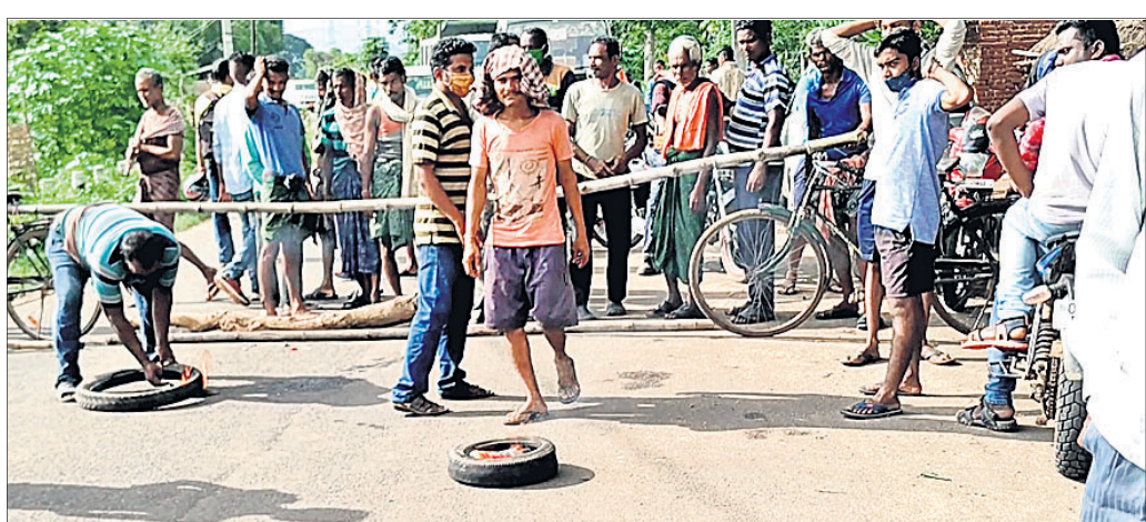
ଉଦ୍ଧୃତ ଲୋକେ ବାଉଁଶପୋଖରୀ ନିକଟସ୍ଥ ହିମୋଲ-ଅନୁଗୋଳ ରାସ୍ତା ଅବରୋଧ କରିଛନ୍ତି।

ଦେଢ଼ାମାଳ ଜିଲା ହିମୋଲ ବୁକ୍ ବାଉଁଶପୋଖରୀ ପଞ୍ଚାୟତରେ ହାତୀ ଉପଦ୍ରବ ବଢ଼ିବାରେ ଲାଗିଛି। ବାରମ୍ବାର ଅଭିଯୋଗ ସତ୍ତ୍ୱେ ବନ ବିଭାଗ ପକ୍ଷରୁ ହାତୀ ଘଉଡ଼ାଇବା ଲାଗି ଆଖିବୁଜିଆ ପଦକ୍ଷେପ ନିଆଯାଇନାହିଁ।