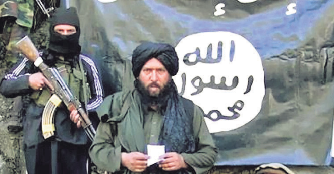
ଖୋରାକ୍ ଯୋଗାଇଥିଲା। ୨୦୧୪ରେ ପାକିସ୍ତାନରେ ଆଇଏସ୍‌କେ ଏବଂ ବିଭାଜିତ ଶାଖା ଆଇଏସ୍‌କେ ଗଠନ କରାଯାଇଥିଲା। ଏହା ଇସ୍ଲାମିକ୍ ଷ୍ଟେଟ୍ ଅଫ୍ ଇରାକ୍ ଆଂସ ଦି ଲିଭାଂ-ଖୋରାସାନ ପ୍ରକ୍ରିୟା (ଆଇଏସ୍‌କେ) କେପି ବା ଆଇଏସ୍‌କେପି) ନାମରେ ମଧ୍ୟ ଜଣାଯାଏ।

ନୂଆଦିଲ୍ଲୀ, ୨୮ ଟି : ଆତ୍ମନିୟନ୍ତ୍ରଣ ବିମାନବନ୍ଦର ଗୁରୁବାର ସନ୍ଧ୍ୟାରେ ବିସ୍ଫୋରଣ ଚଳିତ ବର୍ଷର ସବୁଠାରୁ ଭୟଙ୍କର ଆକ୍ରମଣ ମଧ୍ୟରୁ ଅନ୍ୟତମ। ୧୩ ଆମେରିକୀୟ ସୈନ୍ୟଙ୍କ ସମେତ ଶତାଧିକ ଆତ୍ମନିୟନ୍ତ୍ରଣ ଏଥିରେ ପ୍ରାଣ ହରାଇଥିବାବେଳେ ଆହତ ହୋଇଛନ୍ତି ୨ ଶହରୁ ଊର୍ଦ୍ଧ୍ୱ। ଇସ୍ଲାମିକ୍ ଷ୍ଟେଟ୍ ଖୋରାସାନ (ଆଇଏସ୍‌କେ) ଆତ୍ମନିୟନ୍ତ୍ରଣ ଫରୋ କାରି କରି ବିସ୍ଫୋରଣ ପାଇଁ ନିଜକୁ ଦାୟୀ କରିଛି। ତାଲିବାନ୍ ସହ ଶତ୍ରୁତା ଥିବାରୁ ଏହାର ଛବି ଖରାପ କରିବାକୁ ଆତଙ୍କବାଦୀ ସଙ୍ଗଠନ ଆଇଏସ୍‌କେ ଏପରି ବିସ୍ଫୋରଣ ଯୋଜନା କରିଥିବା କୁହାଯାଇଛି। ୨୦୧୩ରେ ଇରାକ୍ ଉପରେ ଆମେରିକାର ଆକ୍ରମଣ, ସିଆ ମିଲିସିଆ ସଙ୍ଗଠନକୁ ଇରାନର ସମର୍ଥନ, ଏହି ଅଞ୍ଚଳରେ ରାଜନୈତିକ ଇସ୍ଲାମର ଉପସ୍ଥିତି ଆଇଏସ୍‌କେ ଏବଂ ଗଠନରେ ଭୂମିକା ଥିବା କୁହାଯାଏ। ସିରିଆ ଗୃହଯୁଦ୍ଧ ଆଇଏସ୍‌କେ ଏବଂ ତାଲିବାନ୍ ନିଜକୁ ଇସ୍ଲାମିକ୍ ପ୍ରକୃତ ପ୍ରତିନିଧି ବୋଲି କହିଥାନ୍ତି। ଉଭୟ ସଂଗଠନ ହିଂସା ଏବଂ