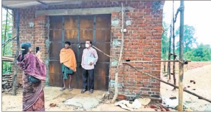
ସିଲ୍ ହୋଇଥିବା ଗୋଦାମ।

ପରଭାରତୀୟା କରୁଛନ୍ତି। ସେମାନେ ସହରର ଅନିମା ସିନ୍ଦ୍ୱ ନାମକ ଡିଲରକାଠାରୁ ୬୨୦ ବସ୍ତା ସୁରକ୍ଷା ସାର ଆଣିଥିବା ଏକ କାରକ ଦେଖାଇଥିଲେ ଓ ସକାଳେ ୮୦ ବସ୍ତା ସାର ଅନ୍ୟତ୍ର ନେଇଥିବା ବୟାନ ଦେଇଥିଲେ ବୋଲି କୁଣ୍ଡି ବିଭାଗର ଜଣେ ଅଧିକାରୀ କହିଛନ୍ତି। ସେ ଆହୁରି କହିଛନ୍ତି, ସକାଳେ ରାତିରେତା ଗ୍ରାମର କ୍ଷମାସାଗର ସ୍କୁଲ ନିର୍ମାଣ କରିଥିବା ଗୋଦାମ କୁହରେ ବେଆଇନ ଭାବେ ଯୁକ୍ତିଆ ସାର ରହିଥିବା ସୂଚନା ମିଳିଥିଲା। ପରେ