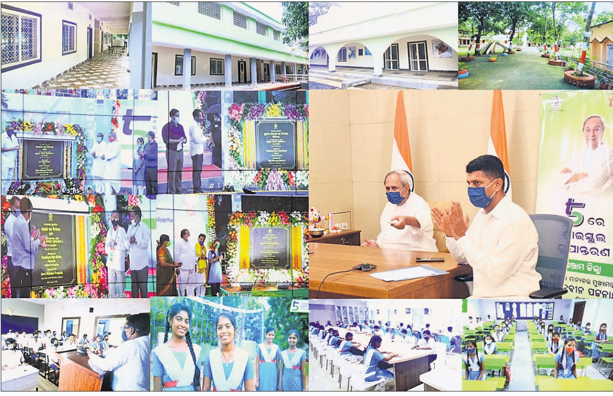
କିଡ଼ିଏ କମ୍ପରେସ୍ ମାଧ୍ୟମରେ ଶନିବାର ପୁଖ୍ୟମନ୍ତ୍ରୀ ନବୀନ ପଟ୍ଟନାୟକ ହିଓଲିର ଆଉ ୧୦ ସ୍କୁଲକୁ ୫-ଟି ସ୍କୁଲ ରୂପାନ୍ତରଣ କାର୍ଯ୍ୟକ୍ରମକୁ ଉଦ୍‌ଘାଟନ କରୁଛନ୍ତି।

ଶନିବାର ରାତି ୧୦ଟା ସୁଦ୍ଧା (+ ଅନ୍ୟ ରୋଗରେ କରୋନା ଆକ୍ରାନ୍ତ ମୃତ୍ୟୁ) ତଥ୍ୟ: https://www.worldometers.info/coronavirus/ ଏବଂ ଓଡ଼ିଶା ସରକାର