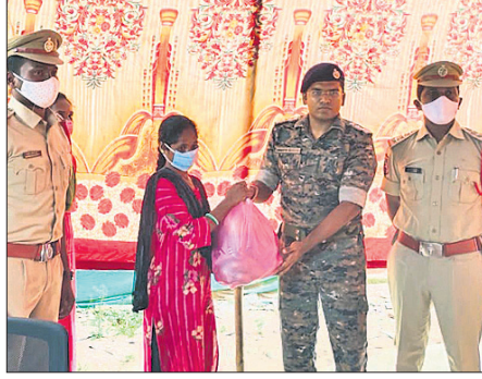
ପୋଲିସ୍ ନିକଟରେ ଆତ୍ମସମର୍ପଣ କରିଥିବା ବୁଦ୍ଧି ଜିଲାର ସହକାରୀ ପୋଲିସ୍ ଅଧିକାରୀଙ୍କ ନିକଟରେ ବୁଦ୍ଧି ଆତ୍ମସମର୍ପଣ କରିଥିଲେ। ସରକାରୀ ଶୁକ୍ରବାର ଛତିଶଗଡ଼ ଓ ତେଲଙ୍ଗାନା ରାଜ୍ୟରେ ୫୪୯୯ କ୍ୟାଡର ମାଓବାଦୀ ଆତ୍ମ ସମର୍ପଣ କରିଥିଲେ।