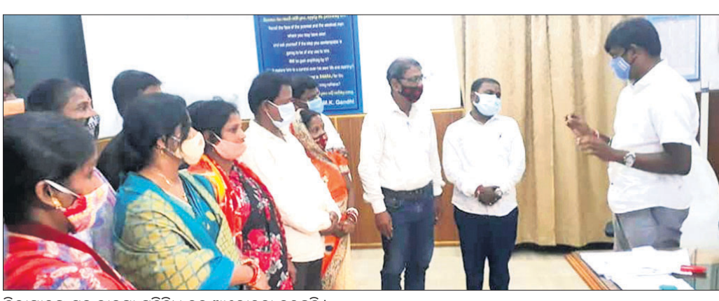
ଜିଲାପାଳଙ୍କ ସହ ଭାଜପା ପ୍ରତିନିଧିଙ୍କ ଆଲୋଚନା କରୁଛନ୍ତି ।

ବାଲେଶ୍ୱର ଜିଲା ସଦର ବ୍ଲକରେ ପ୍ରଧାନମନ୍ତ୍ରୀ ଆବାସ ଯୋଜନା ଚୟନରେ ଅନିୟମିତତା ହୋଇଥିବା ଅଭିଯୋଗ ହୋଇଛି ।