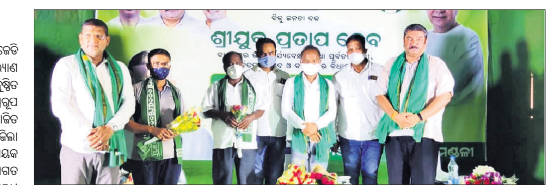
ବିଜେତ କର୍ମୀ ବୈଠକରେ ଉପସ୍ଥିତ ନେତୃବର୍ଗ ।

ବାଲେଶ୍ୱର ନିର୍ବାଚନମଣ୍ଡଳ ବିଜେତ ପକ୍ଷରୁ ଶନିବାର ସ୍ଥାନୀୟ ବିଜେତ କଲ୍ୟାଣ ମଣ୍ଡପରେ ଏକ କର୍ମୀ ବୈଠକ ଅନୁଷ୍ଠିତ ହୋଇଯାଇଛି ।