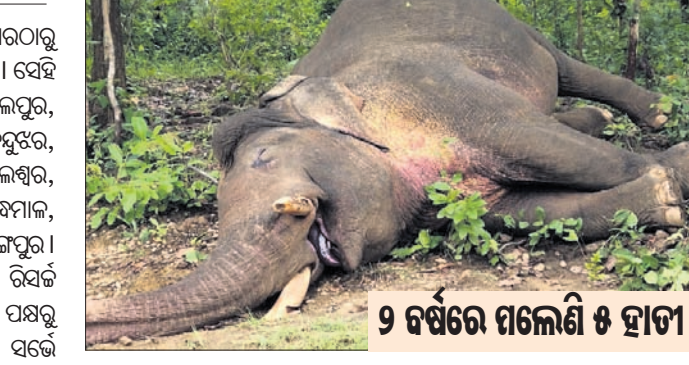
୨ ବର୍ଷରେ ମଲେଣି ୫ ହାତୀ