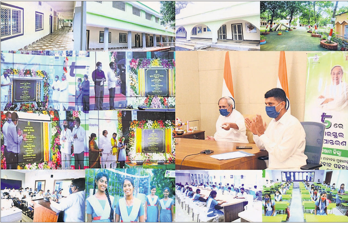
କିଡିଓ କମ୍ପରେଟିଭ ମାଧ୍ୟମରେ ଶନିବାର ପୁଖ୍ୟମନ୍ତ୍ରୀ ନବୀନ ପଟ୍ଟନାୟକ ହିଞ୍ଜିଲିର ଆଇ ୧୦ ସ୍କୁଲକୁ ୫-ଟି ସ୍କୁଲ ରୂପାନ୍ତରଣ କାର୍ଯ୍ୟକ୍ରମକୁ ଉଦ୍‌ଘାଟନ କରୁଛନ୍ତି।

ଶନିବାର ରାତି ୧୦ଟା ସୁଦ୍ଧା (+ ଅନ୍ୟ ଭୋଗରେ କରୋନା ଆକ୍ରାନ୍ତ ମୃତ୍ୟୁ) ତଥ୍ୟ: https://www.worldometers.info/coronavirus/ ଏବଂ ଓଡ଼ିଶା ସରକାର