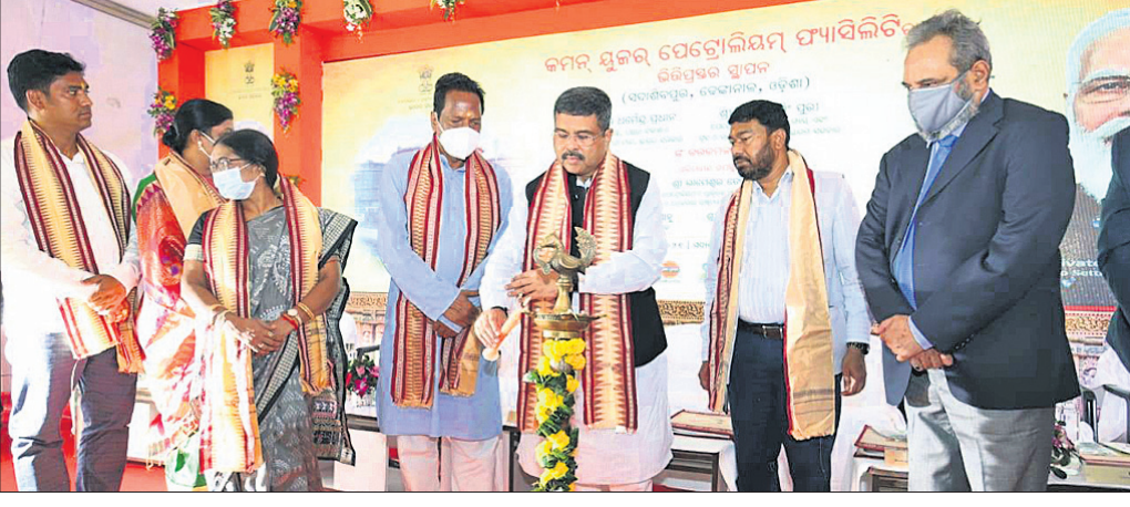
କେନ୍ଦ୍ରମନ୍ତ୍ରୀ ଧର୍ମେନ୍ଦ୍ର ପ୍ରଧାନ ପ୍ରଦୀପ ପ୍ରଜ୍ୱଳନ କରି ପ୍ରକଳ୍ପର ଶିଳ୍ପାୟନ କରୁଛନ୍ତି।