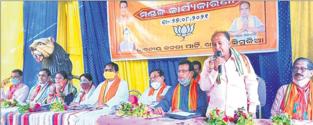
କାର୍ଯ୍ୟକାରୀ ବୈଠକରେ ଭାଗପା କର୍ମକର୍ତ୍ତା।