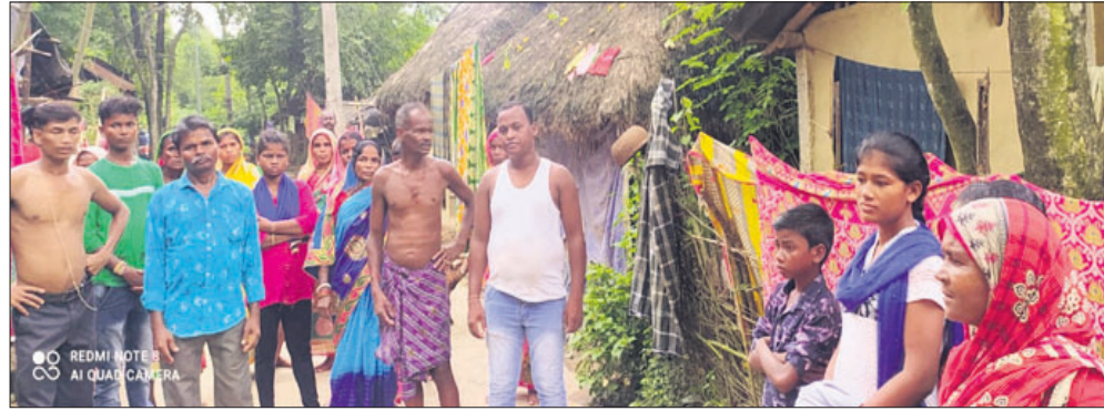
ଆବାସ ଯୋଗାଇ ଦେବାକୁ ଲୋକେ ଦାବି କରୁଛନ୍ତି।

ବାଲେଶ୍ୱର ଜିଲ୍ଲା କଲେଶ୍ୱର ବ୍ଲକରେ ବହୁ ଯୋଗ୍ୟ ହିରାଧିକାରୀ ବିଭିନ୍ନ କାରଣରୁ ଆବାସ ଯୋଜନାରୁ ବଞ୍ଚିତ ହେଉଛନ୍ତି। ରାଜବଣିଆ ଅଞ୍ଚଳ ମାଳିଡିଆ ପଞ୍ଚାୟତର ଗୋପାଳ ପ୍ରସାଦ ଗାଁରେ ୨୨ଟି ପରିବାର ଏକ ସାହି କରି ଦୀର୍ଘ ୨୦/୮୦ବର୍ଷ ଧରି ବଂଶାନୁକ୍ରମିକ ଭାବେ ସରକାରୀ ଜାଗାରେ ରହି ଆସୁଛନ୍ତି। ସମସ୍ତେ ଖିରିଆ ମଜୁରିଆ ହୋଇଥିବାରୁ କାହା ଘର ଉପରେ ପଲିଥିନ ପଡ଼ିଛି ତ ଆଉ କାହାର ନଡ଼ା ଛପର। ପ୍ରତ୍ୟେକଙ୍କ ଘରେ ବର୍ଷାପାଣି ପଡୁଥିବା ବେଳେ କାହା ଘରୁ ଦିନରେ ଖରା ଓ ଋତୁରେ ଭିଜିବା ଆବାସ, ପ୍ରଧାନମନ୍ତ୍ରୀ ଆବାସ, ବିଜୁ ପଟ୍ଟନାୟକ ଲାଗି ଆବେଦନ କରି ଅଧିକାରୀଙ୍କୁ, ଏମାନଙ୍କୁ ଏଯାବତ୍ ଆବାସ ଯୋଜନାରେ ଘର ଖଣ୍ଡିତ ମିଳିପାରୁନା। ସରକାରୀଙ୍କ ନୀତି ନିୟମ ଅନୁଯାୟୀ