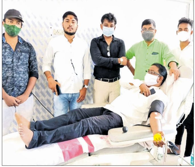
ଶିବିରରେ ଜଣେ ଯୁବକ ରକ୍ତଦାନ କରୁଛନ୍ତି ।