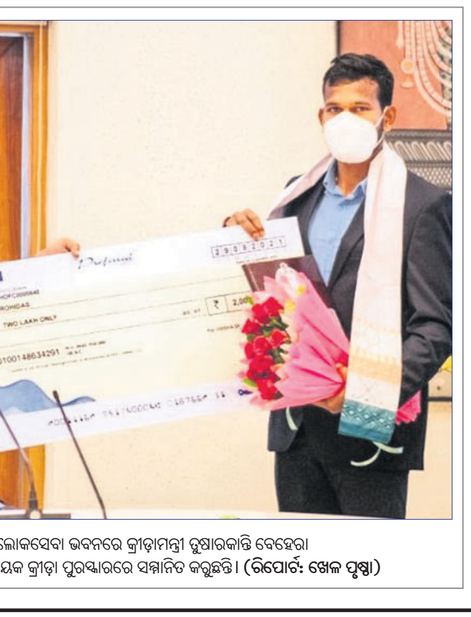
କ୍ରୀଡ଼ା ଦିବସ ଅବସରରେ ରବିବାର ଲୋକସେବା ଭବନରେ କ୍ରୀଡ଼ାମନ୍ତ୍ରୀ ଚୁଷାଚକ୍ରାନ୍ତି ବେହେରା ହକ୍ ଚାରକା ଅମିତ ରୋହିତାଙ୍କୁ ବିକ୍ରମ ପଦକମାନଙ୍କୁ କ୍ରୀଡ଼ା ପୁରସ୍କାରରେ ସମ୍ମାନିତ କରୁଛନ୍ତି। (ବିପୋର୍ଟ: ଖେଳ ପୃଷ୍ଠା)