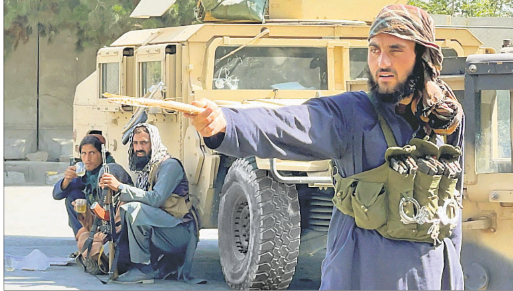
କାବୁଲ ଏୟାରପୋର୍ଟ ବାହାରେ ତାଲିବାନ୍ ପ୍ରହାରୀ।