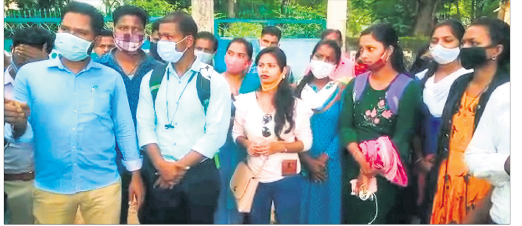
ଚିଟିଲାଗଡ଼ରେ ପରୀକ୍ଷା କେନ୍ଦ୍ର ଠିକଣା ବଦଳୁ ନେଇ ଅତି ରହିଥିବା ପରୀକ୍ଷାର୍ଥୀ।

ବଲାଙ୍ଗୀର ଅଫିସ୍/ଚିଟିଲାଗଡ଼, ୨୯।୮ (ଡି.ଏନ୍.ଏ.)