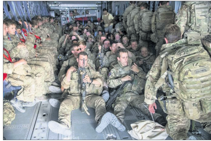
ପ୍ରତ୍ୟାହାର ପ୍ରକ୍ରିୟାରେ ସହାୟତା କରୁଥିବା ବ୍ରିଟିଶଙ୍କୁ ଫେରାଇନେବା ଅଭିଯାନ ଆଫଗାନିସ୍ତାନରେ ବ୍ରିଟିଶ ରାଷ୍ଟ୍ରପ୍ତ ସକାଳେ ବ୍ରିଟିଶ ପ୍ରଧାନମନ୍ତ୍ରୀ ବୋରିସ୍ ଜନସନ୍ କହିବା ସହ ଏହାର ଏକ ଭିଡ଼ିଓ ରୁଲଟରରେ ପୋଷ୍ଟ କରିଛନ୍ତି।

କାବୁଲରୁ ବ୍ରିଟିଶ ସୈନ୍ୟ ପ୍ରତ୍ୟାହାର ରବିବାର ସମ୍ପୂର୍ଣ୍ଣ ହୋଇଛି। ତାଲିବାନ ସମ୍ପର୍କୀତ ଦଖଲ କରିବା ପରେ ଆଫଗାନିସ୍ତାନରେ ବ୍ରିଟିଶର ୨୦ ବର୍ଷର ସୈନ୍ୟ ଅଭିଯାନର ପୂର୍ଣ୍ଣସମାପ୍ତି ପଡ଼ିଛି। ଅଗଷ୍ଟ ୩୧ ସୁଦ୍ଧା ଆମେରିକା ଆଫଗାନିସ୍ତାନରୁ ସୈନ୍ୟ ପ୍ରତ୍ୟାହାର କରିନେବା ଲାଗି ସମୟସୀମା ଘୋଷଣା କରିଥିବାବେଳେ ଏହାର ୧୫ ଦିନ ପୂର୍ବରୁ ତାଲିବାନ୍ ଆତଙ୍କବାଦୀ ଦେଶର ସମସ୍ତ ବୃହତ୍ ସହର ସମେତ ରାଜଧାନୀ କାବୁଲକୁ ଦଖଲ କରିଥିଲା। ୧୫ ହଜାର ନାଗରିକଙ୍କୁ ଫେରାଇନେବା ପରେ ବ୍ରିଟିଶର ରୟାଲ ଏୟାରଫୋର୍ସ ବିମାନ ଶିବିରର ରାତିରେ କାବୁଲ ବିମାନବନ୍ଦର ଛାଡ଼ି ଅକ୍ଟୋବର୍-ଶାହାଦର ଆରବ୍-ସାଏଟ୍ ବ୍ରିକ ନର୍ଦ୍ଦନରେ ପହଞ୍ଚିଛି। ସୈନ୍ୟ