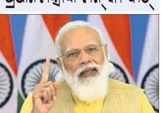
ପ୍ରଧାନମନ୍ତ୍ରୀଙ୍କ ମନ୍ କା ବାଟ୍

ନୂଆଦିଲ୍ଲୀ, ୨୯୮୮ ମହାମାରୀ ସମୟରେ ସ୍ଵଳ୍ପ ଭାରତ ଅଭିଯାନକୁ ଆଗେଇ ନେବା ପାଇଁ ପ୍ରଧାନମନ୍ତ୍ରୀ ନରେନ୍ଦ୍ର ମୋଦି ରବିବାର 'ମନ୍' କା ବାଟ୍'ରେ ବେଶବାସୀଙ୍କୁ ପରାମର୍ଶ ଦେଇଛନ୍ତି। ମୁବ ସମାଜର ସଶକ୍ତୀକରଣ ଉପରେ ପ୍ରଧାନମନ୍ତ୍ରୀ ଗୁରୁତ୍ଵ ଦେଇଛନ୍ତି। ମୁବ-ପିଢ଼ିକ୍ ମାନସିକତାରେ ପରିବର୍ତ୍ତନ ଘଟିଛି ଓ ସେମାନେ କିଛି ନୂଆ କରି ଦେଖାଇବାକୁ ଚାହୁଁଛନ୍ତି। ସେମାନଙ୍କ ପାଇଁ ଦେଶର ସ୍ଵର୍ଗ-ଅପ୍ ସଂସ୍କୃତିରେ ଚମକ ଆସିଛି। ମହାକାଶ କ୍ଷେତ୍ରରେ ସଂସ୍କାର ଜନସାଧାରଣଙ୍କ କଳ୍ପନାକୁ ବାସ୍ତବ ରୂପ ଦେବାକୁ ଯାଉଛି। ଆଗାମୀ ଦିନରେ ବିଶ୍ଵବିଦ୍ୟାଳୟ ଓ ଅନ୍ୟ ସେକ୍ଟରର ମୁବ-ବର୍ଗିକ ଦ୍ଵାରା ବହୁସଂଖ୍ୟାରେ ସାଚେଲାଭର୍ ବିକଶିତ ହେବା ନେଇ ପ୍ରଧାନମନ୍ତ୍ରୀ ଦୃଢ଼ୋକ୍ତି ପ୍ରକାଶ କରିଥିଲେ। ରବିବାର ମେଜର