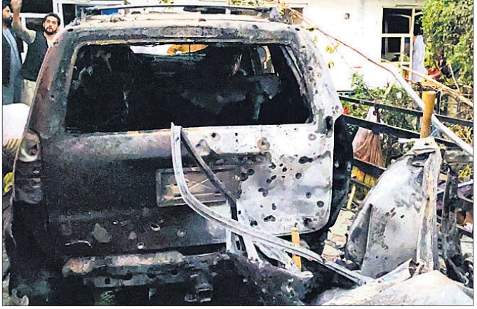
ଆମେରିକା ଏୟାରସ୍ତ୍ରୀକରଣରେ କାବୁଲ ଏୟାରପୋର୍ଟ ନିକଟରେ ଧ୍ଵଂସ ଏକ କାର।

ନ ପାରେ ସେ ଦିଗରେ ଅଭିଯାନ ଆରମ୍ଭ ହେବ ବୋଲି ସେ କହିଛନ୍ତି। ଆମେରିକାର ଏଭଳି ଆଭିମୁଖ୍ୟକୁ ଯୋଜନା କରିପାରେ ବୋଲି ବାଇଡେନ୍ ଆଶଙ୍କା କରିଛନ୍ତି। ସେପଟେ ଅଗଷ୍ଟ ୩୧ ପରେ ଆମେରିକା ଆଫଗାନିସ୍ତାନରେ ଛାଡ଼ିଲେଣି। ଆଗାମୀ ୪ ମାସ କରିପାରିବନି ବୋଲି ତାଲିବାନ୍ କହିଛି। ଅନ୍ୟପକ୍ଷରେ କାବୁଲ ବିସ୍ଫୋରଣରେ ପ୍ରାଣ ହରାଇଥିବା ଆମେରିକା ସୈନ୍ୟଙ୍କ ମୃତଦେହକୁ ଆଫଗାନିସ୍ତାନରୁ ନିଆଯିବାକୁ ସ୍ଥିର ହୋଇଛି। ମୃତକଙ୍କୁ ଶ୍ରଦ୍ଧାଞ୍ଜଳି ଦେବା ସହ ସେମାନଙ୍କ ପରିବାରକୁ ବାଜଡେନ୍ ଓ ତାଙ୍କ ସ୍ତ୍ରୀ ଜିଲ୍ ଡେଡିଭେ ବୋଲି ସ୍ଵାଇଚ୍‌ହାଉସ୍ ଦାୟିତ୍ଵ ନେବାକୁ ଉକ୍ତ ସମ୍ପ୍ରଦାୟ ପରାମର୍ଶ ଦାଖଲ କରିଛନ୍ତି। ଆମେରିକା ସୈନ୍ୟ ଏକ ବଡ଼ ଧରଣର ଏୟାର ଲିଫ୍ଟ୍ ଶେଷ କରିବାକୁ ଯାଉଛନ୍ତି। ସେଠାରେ ପ୍ରାୟ ୩ ଶହ ଆମେରିକାୟା ଫସିବିଲିଟି। ତେଡ଼ଲାଲନ୍ ପୂର୍ବରୁ ସେମାନଙ୍କ ସମେତ ସମସ୍ତ ଆଫଗାନ ସହଯୋଗୀଙ୍କୁ ଉଦ୍ଧାର କରିନିଆଯିବ ବୋଲି ଆମେରିକା ପରାମର୍ଶ ସଚିବ ଆଣ୍ଡୋନି ବ୍ରିକେନ୍ କହିଛନ୍ତି। ଆମେରିକା ବିମାନବନ୍ଦର ଛାଡ଼ିବା ପରେ ତାଲିବାନ୍ ଏହାକୁ ନିଜ ନିୟନ୍ତ୍ରଣକୁ ନେବା ଅପେକ୍ଷାରେ ରହିଛି।