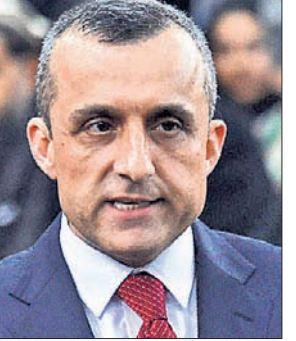
ପକାଇଥିଲେ। ଏହା ପରେ ସାଲେହ ସମ୍ବିଧାନ ଅନୁସାରେ ନିଜକୁ କାମତକା ରାଷ୍ଟ୍ରପତି ଘୋଷଣା କରିଛନ୍ତି।