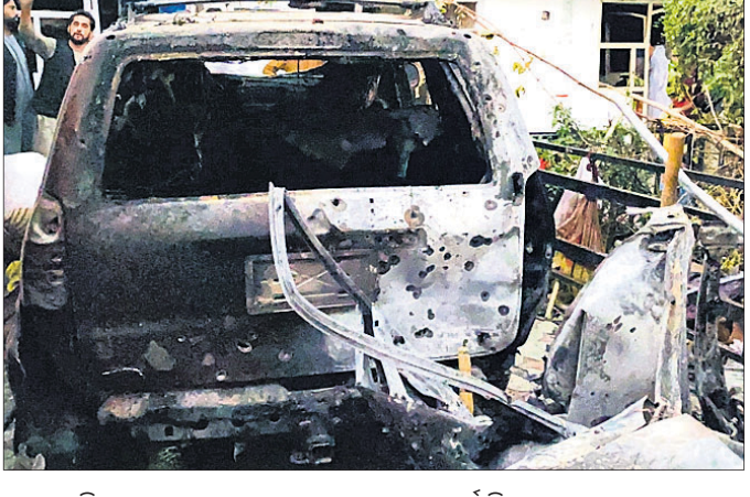
ଆମେରିକା ଏୟାରସ୍ତ୍ରୀମାନଙ୍କୁ କାବୁଲ ଏୟାରପୋର୍ଟ ନିକଟରେ ଧ୍ୱସ୍ତ ଏକ କାର୍।

ନ ପାରେ ସେ ଦିଗରେ ଅଭିଯାନ ଆରମ୍ଭ ହେବ ବୋଲି ସେ କହିଛନ୍ତି। ଆମେରିକାର ଏଭଳି ଆଭିମୁଖ୍ୟକୁ ଯୋଜନା କରିପାରେ ବୋଲି ବାଇଡେନ୍ ଆଖିଆ କରିଛନ୍ତି। ସେପଡେ ଅଗଷ୍ଟ ୩୧ ପରେ ଆମେରିକା ଆଫଗାନିସ୍ତାନର କୋରଦାଏର ଆକ୍ରମଣ କିମ୍ବା ସ୍ତ୍ରୀମାନଙ୍କୁ ନିଆଯିବାକୁ ସ୍ଥିର ହୋଇଛି। ମୁତକଙ୍କୁ ଶ୍ରଦ୍ଧାଞ୍ଜଳି ଦେବା ସହ ସେମାନଙ୍କ ପରିବାରକୁ ବାଜଡେନ୍ ଓ ତାଙ୍କ ସ୍ତ୍ରୀ ଜିଲ୍ ଭେଟିବେ ବୋଲି ସ୍ୱାଇଜହାଡ଼ସ୍ ଦେଖିବାକୁ ରକ୍ତ ସମ୍ପୂର୍ଣ୍ଣ ପତୋଣୀ ପକ୍ଷରୁ କାର୍ଯ୍ୟସୂଚୀ ଜାରି କରାଯାଇଛି। ଆମେରିକା ସୈନ୍ୟ ଏକ ବଡ଼ ଧରଣର ଏୟାର ଲିଫ୍ଟ୍ ଶେଷ କରିବାକୁ ଯାଉଛନ୍ତି। ସେଠାରେ ପ୍ରାୟ ୩ ଶହ ଆମେରିକାୟା ଫସିବହିଛନ୍ତି। ତେଡ଼ଲାଇନ୍ ପୂର୍ବରୁ ସେମାନଙ୍କ ସମେତ ସମସ୍ତ ଆଫଗାନିସ୍ତାନ ସହଯୋଗୀଙ୍କୁ ଉଦ୍ଧାର କରିନିଆଯିବ ବୋଲି ଆମେରିକା ପରାଷ୍ଟ୍ର ସଚିବ ଆଣ୍ଡ୍ରୋନି ରୁଟକେ କହିଛନ୍ତି। ଆମେରିକା ବିମାନବନ୍ଦର ଛାଡ଼ିବା ପରେ ତାଲିବାନ୍ ଏହାକୁ ନିଜ ନିୟନ୍ତ୍ରଣକୁ ନେବା ଅପେକ୍ଷାରେ ରହିଛି।