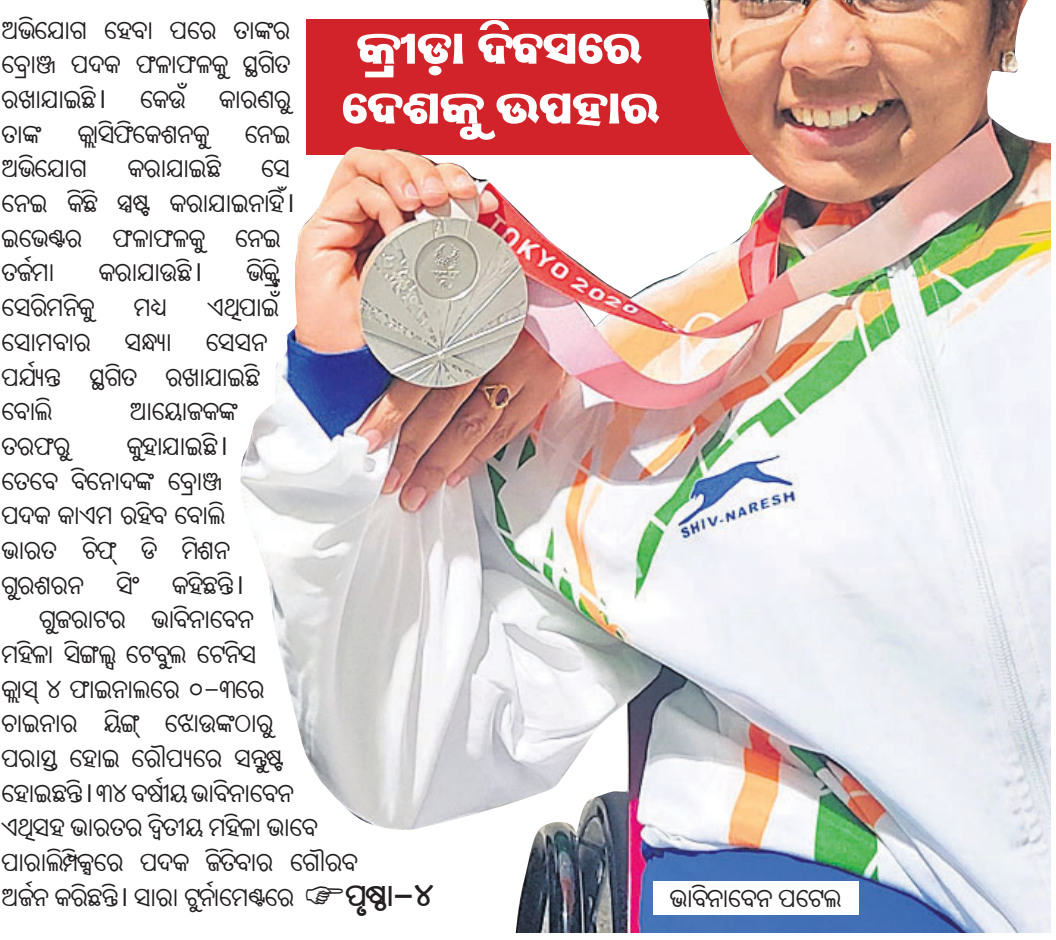
କ୍ରୀଡ଼ା ଦିବସରେ ଦେଶକୁ ଉପହାର

ଟୋକିଓ, ୨୯।୮ ଜାତୀୟ କ୍ରୀଡ଼ା ଦିବସରେ ଟୋକିଓ ପାରାଲିମ୍ପିକ୍ସରେ ଭାରତର ୩ଜଣ ଖେଳାଳି ପଦକ ଜିତି ଦେଖିବାକୁ ଉପହାର ପ୍ରଦାନ କରିଛନ୍ତି। ସୁଲଭା ଆଥଲେଟ ରୌପ୍ୟ ଓ ଜଣେ ଟ୍ରୋଫି ପଦକ ହାସଲ କରି ଦେଶ ପାଇଁ ଗୌରବ ଆଣିଦେଇଛନ୍ତି। ରବିବାର ମହିଳା ପାରା ଟେବୁଲ୍ ଟେନିସ୍ ଖେଳାଳି ଭାବିନାବେନ ପଟେଲ ଓ ପୁରୁଷ ହାଲଜର୍ମିନ ନିଷାଦ କୁମାର ଚାନ୍ଦିପିକେଶନକୁ ନେଇ ଭାବିନାବେନ, ନିଷାଦଙ୍କୁ ରୌପ୍ୟ, ବିନୋଦଙ୍କୁ ଟ୍ରୋଫି କୁମାର ରୌପ୍ୟ ପଦକ ଜିତି ଇତିହାସ ସୃଷ୍ଟି କରିଛନ୍ତି। ସେହିପରି ବିନୋଦ କୁମାର ଡିସ୍କସ୍ ପ୍ରୋ'ରେ ଟ୍ରୋଫି ପଦକ ଜିତିଛନ୍ତି। ପାରାଲିମ୍ପିକ୍ସର ଏହି ୧୬ତମ ସଂସ୍କରଣରେ ଗୋଟିଏ ଦିନରେ ଭାରତର ଆଥଲେଟମାନେ ୩ଟି ପଦକ ହାସଲ କରିଛନ୍ତି। ଅପରପକ୍ଷରେ ବିନୋଦଙ୍କ ଡିକାରିଟି କ୍ଲାସିଫିକେଶନକୁ ନେଇ