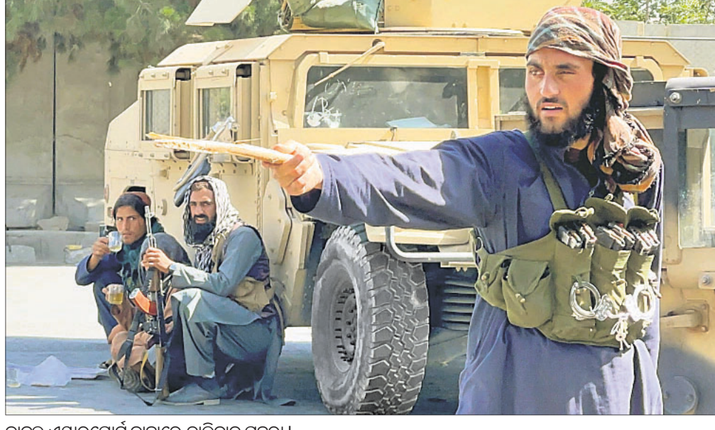
କାବୁଲ ଏୟାରପୋର୍ଟ ବାହାରେ ତାଲିବାନ୍ ପ୍ରହାରୀ।

ପକାଇଥିଲେ। ଏହା ପରେ ସାଲେହ ସମିଧାନ ଅନୁସାରେ ନିଜକୁ କାମତକା ରାଷ୍ଟ୍ରପତି ଘୋଷଣା କରିଛନ୍ତି।