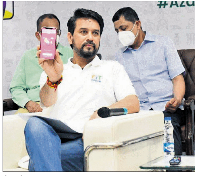
ଫିଟ୍ ଇଣ୍ଡିଆ ମୋବାଇଲ୍ ଆଫ୍ ଲାଷ୍ଟ୍ ଅବସରରେ କେନ୍ଦ୍ର କ୍ରୀଡ଼ାମନ୍ତ୍ରୀ ଅନୁରାଗ ଠାକୁର।

ଗୋକିଓ ପାରାଲିମ୍ପିକ୍ସରେ ଚେଷ୍ଟା ଚେନିସ୍ (ଡିଟି)ରେ ରୌପ୍ୟ ପଦକ ହାସଲ କରିଥିବା ଭାବିନାବେନ ପଚେଲଙ୍କୁ ଗୁଜରାଟ ସରକାର ୩ କୋଟି ଟଙ୍କା ଆର୍ଥିକ ପୁରସ୍କାର ପ୍ରଦାନ କରିବେ। ରବିବାର ଏ ନେଇ ସରକାରଙ୍କ ତରଫରୁ ଘୋଷଣା କରାଯାଇଛି। ଏହି ଅସାଧାରଣ ସଫଳତା ପାଇଁ ଗୁଜରାଟ ମୁଖ୍ୟମନ୍ତ୍ରୀ ବିଜୟ ରୁପାନୀ ତାଙ୍କୁ ଅଭିନନ୍ଦନ ଜଣାଇଛନ୍ତି। ରାଜ୍ୟ ସରକାରଙ୍କ 'ଦିବ୍ୟାଙ୍ଗ' ଖେଳପ୍ରତିଭା ପ୍ରୋତ୍ସାହନ ପୁରସ୍କାର ଯୋଜନା ଅନୁସାରେ ତାଙ୍କୁ ୩ କୋଟି ଟଙ୍କା ପୁରସ୍କାର ଦେବାକୁ ମୁଖ୍ୟମନ୍ତ୍ରୀ ଘୋଷଣା କରିଛନ୍ତି। ଭାବିନାବେନ ଗୁଜରାଟ ଏବଂ ସାରା ଦେଶ ପାଇଁ ଗର୍ବ ଓ ଗୌରବ ଆଣିଦେଇଛନ୍ତି ବୋଲି ସେ କହିଛନ୍ତି।