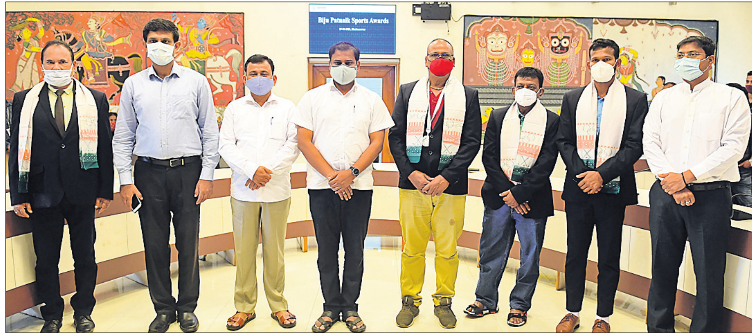
ଜାତୀୟ କ୍ରୀଡ଼ା ଦିବସ ଅବସରରେ ରବିବାର ଲୋକସେବା ଭବନରେ କ୍ରୀଡ଼ାମନ୍ତ୍ରୀ ତୁଷାରକାନ୍ତି ବେହେରା ଓ ଅନ୍ୟ ଅତିଥିଙ୍କ ସହ ବିଜୁ ପଟ୍ଟନାୟକ କ୍ରୀଡ଼ା ଓ ସାହସିକତା ପୁରସ୍କାରରେ ସମ୍ମାନିତ ବ୍ୟକ୍ତିମାନେ ।