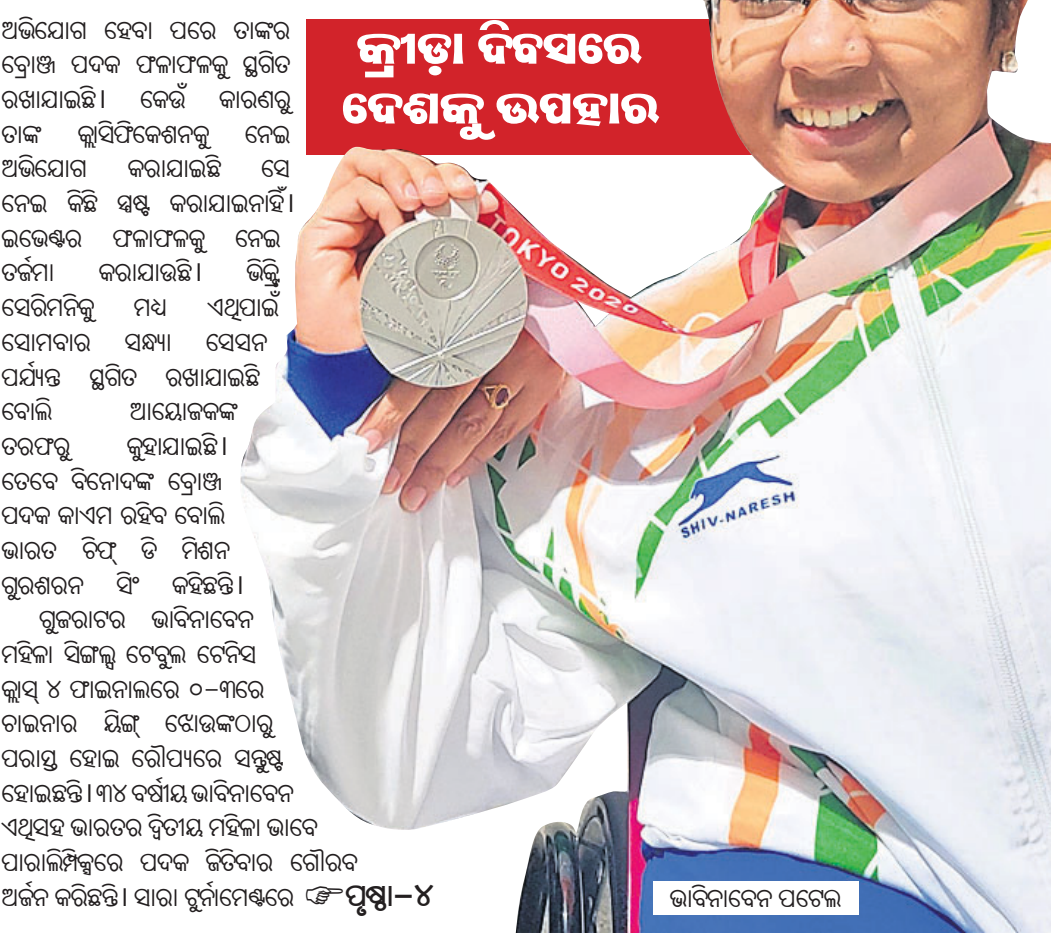
କ୍ରୀଡା ଦିବସରେ ଦେଶକୁ ଉପହାର