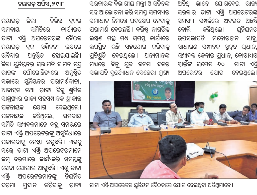
ଡାଟା ଏଣ୍ଡ୍ ଅପରେଟର ଯୁନିୟନ ବୈଠକରେ ଯୋଗ ଦେଇଥିବା ଅତିଥିମାନେ।