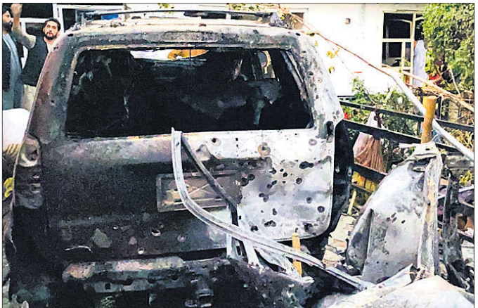
ଆମେରିକା ଏୟାରସ୍ତ୍ରୀକରଣରେ କାବୁଲ ଏୟାରପୋର୍ଟ ନିକଟରେ ଧ୍ୱସ୍ତ ଏକ କାର୍।