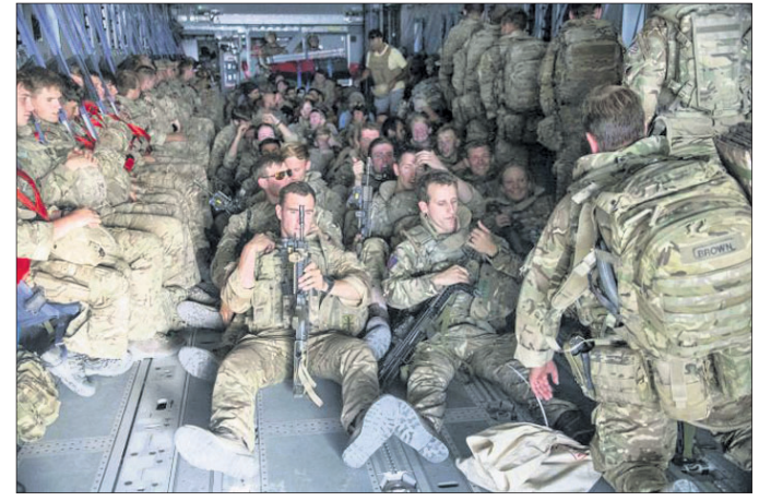
ପ୍ରତ୍ୟାହାର ପ୍ରକ୍ରିୟାରେ ସହାୟତା କରୁଥିବା ବ୍ରିଟିଶଙ୍କୁ ଫେରାଇନେବା ଅଭିଯାନ ଆଫଗାନିସ୍ତାନରେ ବ୍ରିଟେନ ରାଷ୍ଟ୍ରପତି ଶେଷ ହେଲା ବୋଲି ରବିବାର ସୂଚନା ମିଳିଥିଲା। ବ୍ରିଟେନ ସମେତ ସମସ୍ତ ଅଧିକାରୀ ଓ ସୈନ୍ୟ ଫେରିଯାଇଛନ୍ତି। ଅପରେଶନ ପିଟ୍ (ଆଫଗାନିସ୍ତାନରୁ

କାବୁଲରୁ ବ୍ରିଟିଶ ସୈନ୍ୟ ପ୍ରତ୍ୟାହାର ରବିବାର ସମ୍ପୂର୍ଣ୍ଣ ହୋଇଛି। ତାଲିବାନ ସମ୍ପତ୍ତି ଦଖଲ କରିବା ପରେ ଆଫଗାନିସ୍ତାନରେ ବ୍ରିଟେନର ୨୦ ବର୍ଷର ସୈନ୍ୟ ଅଭିଯାନର ପୂର୍ଣ୍ଣସ୍ଥେର ପଡ଼ିଛି। ଅଗଷ୍ଟ ୩୧ ସୁଦ୍ଧା ଆମେରିକା ଆଫଗାନିସ୍ତାନରୁ ସୈନ୍ୟ ପ୍ରତ୍ୟାହାର କରିନେବା ଲାଗି ସମୟସୀମା ଘୋଷଣା କରିଥିବାବେଳେ ଏହାର ୧୫ ଦିନ ପୂର୍ବରୁ ତାଲିବାନ୍ ଆତଙ୍କବାଦୀ ଦେଶର ସମସ୍ତ ବୃହତ୍ ସହର ସମେତ ରାଜଧାନୀ କାବୁଲକୁ ଦଖଲ କରିଥିଲା। ୧୫ ହଜାର ନାଗରିକଙ୍କୁ ଫେରାଇନେବା ପରେ ବ୍ରିଟେନର ରୟାଲ ଏୟାରଫୋର୍ସ ବିମାନ ଶିବିରର ରାତିରେ କାବୁଲ ବିମାନବନ୍ଦର ଛାଡ଼ି ଅକ୍ଟୋବର୍-ଶାହାଦର ଆରବ୍-ସାଏଟ୍ ବ୍ରିକ ନର୍ଦ୍ଦନରେ ପହଞ୍ଚିଛି। ସୈନ୍ୟ