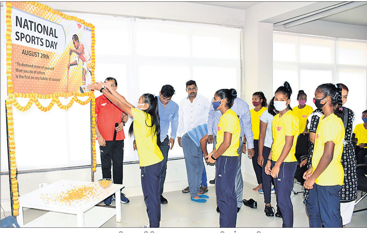
ଖେଳାଳିମାନେ ହକି କିମ୍ବଦନ୍ତୀ ଧ୍ୟାନରାଜଙ୍କୁ ଶ୍ରଦ୍ଧାଞ୍ଜଳି ଅର୍ପଣ କରୁଛନ୍ତି ।