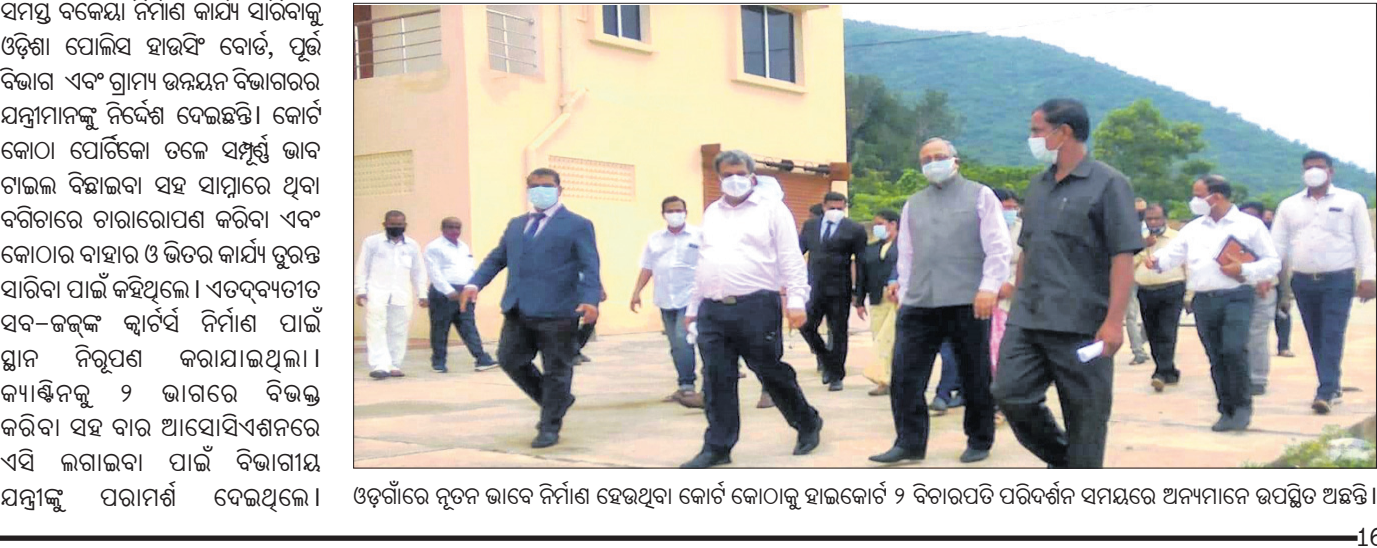
ଓଡ଼ିଶାରେ ବୃତ୍ତ ଭାବେ ନିର୍ମାଣ ହେଉଥିବା କୋର୍ଟ କୋଠାକୁ ହାଇକୋର୍ଟ ୨ ବିଚାରପତି ପରିଦର୍ଶନ ସମୟରେ ଅନ୍ୟମାନେ ଉପସ୍ଥିତ ଅଛନ୍ତି।

ନୟାଗଡ଼ ଅତିସ, ୨୯୮୮ ଉପଦେଶ ପ୍ରକାଶ କଲା କ୍ରିୟାନ୍ୱୟାନ କମିଟି କଟରାଝରୀରୁ ଶିଖରପୁର ୩ କିମି ରାସ୍ତା ବାଇପାସ୍ ହେଉ