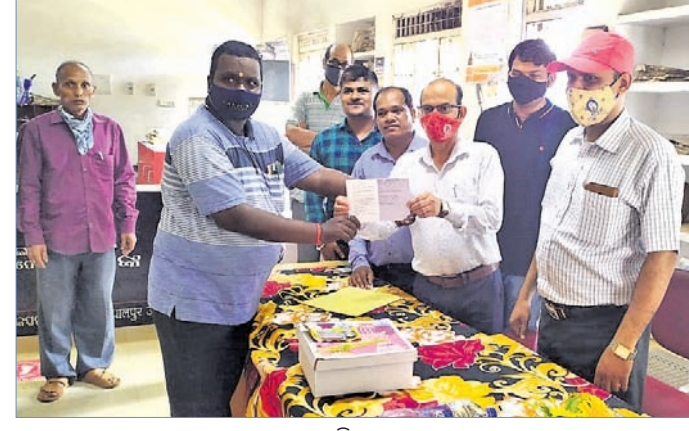
ଉଦ୍‌ଘାଟନା ଉତ୍ସବରେ ଯୋଗଦେଇଥିବା ଅତିଥିମାନେ।

ପରବର୍ତ୍ତୀ ସମୟରେ ସେମାନଙ୍କ ଦେଖା ଦେଖି ମିଳି ନ ଥିବା ଅଭିଯୋଗ ହେଉଛି। ତେବେ ବିଭିନ୍ନ ସ୍ଥାନରେ ପ୍ରଶିକ୍ଷଣ ପ୍ରଦାନ କରି ପ୍ରଶିକ୍ଷକମାନଙ୍କର ଦକ୍ଷତା ବୃଦ୍ଧି କରିବା ସହ ସେମାନଙ୍କୁ ଡ୍ରେସିଂକୋଡ୍ ଓ ଷ୍ଟାଇଲପେଣ୍ଡ ପ୍ରଦାନ କରାଯିବା ବାବଦରେ କେନ୍ଦ୍ର ସରକାର ଲକ୍ଷ୍ୟାତ୍ମକ ଟଙ୍କା ବ୍ୟୟ କରୁଥିଲେ।