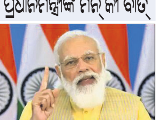
ପ୍ରଧାନମନ୍ତ୍ରୀଙ୍କ ମନ୍ ଡା ବାଟ୍

ମହାମାରୀ ସମୟରେ ସ୍ୱଚ୍ଛ ଭାରତ ଅଭିଯାନକୁ ଆଗେଇ ନେବା ପାଇଁ ପ୍ରଧାନମନ୍ତ୍ରୀ ନରେନ୍ଦ୍ର ମୋଦି ରବିବାର 'ମନ୍ ଡା ବାଟ୍'ରେ ବେଶ୍‌ବାସୀଙ୍କୁ ପରାମର୍ଶ ଦେଇଛନ୍ତି। ସୁବ ସମାଜର ସଶକ୍ତୀକରଣ ଉପରେ ପ୍ରଧାନମନ୍ତ୍ରୀ ଗୁରୁତ୍ୱ ଦେଇଛନ୍ତି। ସୁବ-ପିଡ଼ିକ୍ ମାନସିକତାରେ ପରିବର୍ତ୍ତନ ଘଟିଛି ଓ ସେମାନେ କିଛି ନୂଆ କରି ଦେଖାଇବାକୁ ଚାହୁଁଛନ୍ତି। ସେମାନଙ୍କ ପାଇଁ ଦେଶର ସ୍ୱର୍ଗ-ଅପ୍ ସଂସ୍କୃତିରେ ଚଳକ ଆସିଛି। ମହାକାଶ କ୍ଷେତ୍ରରେ ସଂସ୍କାର ଜନସାଧାରଣଙ୍କୁ କଳ୍ପନାକୁ ବାସ୍ତବ ରୂପ ଦେବାକୁ ଯାଉଛି। ଆଗାମୀ ଦିନରେ ବିଶ୍ୱବିଦ୍ୟାଳୟ ଓ ଅନ୍ୟ ସେକ୍ଟରର ସୁବ-ବର୍ଗିକ ଦ୍ୱାରା ବହୁସଂଖ୍ୟାରେ ସାମାଜିକ ବିକଳିତ ପ୍ରାଣୀମାନଙ୍କୁ ଦୂରୋଦ୍ଧି ପ୍ରକାଶ କରିଥିଲେ। ରବିବାର ମେଜର