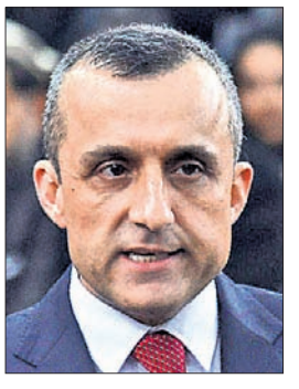
ସାଲେହଙ୍କୁ ରୋକିବାକୁ ତାଲିବାନ୍ ଉଦ୍ୟମ

ପଞ୍ଜାବରେ ପ୍ରତିରୋଧୀ ବଳର ଶକ୍ତି କମାଇବାକୁ ଏବଂ ଆଫଗାନିସ୍ତାନର ଗାଦିକୁ ଉପରାଷ୍ଟ୍ରପତି ଅମରୁଲ୍ ସାଲେହଙ୍କୁ ଚୁକ୍ତ ଉପରେ ରୋକ ଲଗାଇବାକୁ ତାଲିବାନ୍ ପଞ୍ଜାବର ଉପତ୍ୟକାରେ ଇଣ୍ଟରନେଟ ସେବା ବନ୍ଦ କରାଇଛି। ଆଜି ପର୍ଯ୍ୟନ୍ତ ତାଲିବାନ୍ ଦଖଲ କରିପାରି ନ ଥିବା ଆଫଗାନିସ୍ତାନର ଏହି ଉପତ୍ୟକାରେ ପ୍ରତିରୋଧୀ ଦଳ ଏକାଠି ହୋଇଛନ୍ତି। ତାଲିବାନ୍ ବିରୋଧରେ ଲଢ଼େଇ ପାଇଁ ସାଲେହଙ୍କ ସମେତ ବିଦ୍ରୋହୀ କମାଣ୍ଡର ଅହମ୍ମଦ ଶାହ ମାସୁଦ୍‌ଙ୍କ ପୁଅ ଅହମ୍ମଦ ମାସୁଦ ବଳଗୋଟାଇବାରେ ଲାଗିଛନ୍ତି।