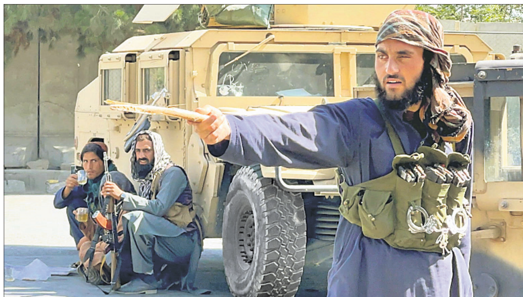
କାବୁଲ ଏୟାରପୋର୍ଟ ବାହାରେ ତାଲିବାନ୍ ଲଢୁଆଳ କଡ଼ା ପ୍ରହର।