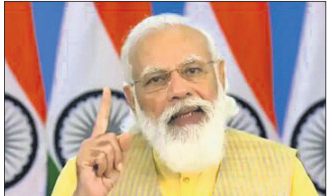
ପ୍ରଧାନମନ୍ତ୍ରୀଙ୍କ ମନ୍ ଡା ବାଟ୍

ନୂଆଦିଲ୍ଲୀ, ୨୯୮୮ ମହାମାରୀ ସମୟରେ ସ୍ୱଳ୍ପ ଭାରତ ଅଭିଯାନକୁ ଆଗେଇ ନେବା ପାଇଁ ପ୍ରଧାନମନ୍ତ୍ରୀ ନରେନ୍ଦ୍ର ମୋଦି ରବିବାର 'ମନ୍ ଡା ବାଟ୍'ରେ କେଶବାସୀଙ୍କୁ ପରାମର୍ଶ ଦେଇଛନ୍ତି। ସୁବ ସାମରିକ ସଶକ୍ତୀକରଣ ଉପରେ ପ୍ରଧାନମନ୍ତ୍ରୀ ଗୁରୁତ୍ୱ ଦେଇଛନ୍ତି। ସୁବପିଡ଼ିକ୍ ମାନସିକତାରେ ପରିବର୍ତ୍ତନ ଘଟିଛି ଓ ସେମାନେ କିଛି ନୂଆ କରି ଦେଖାଇବାକୁ ଚାହୁଁଛନ୍ତି। ସେମାନଙ୍କ ପାଇଁ ଦେଶର ସ୍ୱର୍ଗ-ଅର୍ପ୍ ସଂସ୍କୃତିରେ ଚମକ ଆସିଛି। ମହାକାଶ କ୍ଷେତ୍ରରେ ସଂସ୍କାର ଜନସାଧାରଣଙ୍କ କଳ୍ପନାକୁ ବାସ୍ତବ ରୂପ ଦେବାକୁ ଯାଉଛି। ଆଗାମୀ ଦିନରେ ବିଶ୍ୱବିଦ୍ୟାଳୟ ଓ ଅନ୍ୟ ସେକ୍ଟରର ସୁବବର୍ଗିକ ଦ୍ୱାରା ବହୁସଂଖ୍ୟାରେ ସାଚେଲାଭର୍ ବିକଶିତ ହେବା ନେଇ ପ୍ରଧାନମନ୍ତ୍ରୀ ଦୃଢ଼ୋକ୍ତି ପ୍ରକାଶ କରିଥିଲେ। ରବିବାର ମେଜର