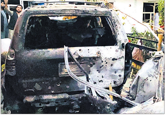
ଆମେରିକା ଏୟାରଷ୍ଟ୍ରାଇକ୍‌ରେ କାବୁଲ ଏୟାରପୋର୍ଟ ନିକଟରେ ଧ୍ୱସ୍ତ ଏକ କାର୍।

ସେପଟେ ଅଗଷ୍ଟ ୩୧ ପରେ ଆମେରିକା ଆଫଗାନିସ୍ତାନରେ କୌଣସି ପ୍ରକାର ଆକ୍ରମଣ କିମ୍ବା ସ୍ତ୍ରାଇକ୍ କରିପାରିବନି ବୋଲି ତାଲିବାନ୍ କହିଛି। ଅନ୍ୟପକ୍ଷରେ କାବୁଲ ବିସ୍ଫୋରଣରେ ପ୍ରାଣ ହରାଇଥିବା ଆମେରିକା ସୈନ୍ୟଙ୍କ ମୃତଦେହକୁ ଆଫଗାନିସ୍ତାନରୁ ନିଆଯିବାକୁ ସ୍ଥିର ହୋଇଛି। ମୃତକଙ୍କୁ ଶ୍ରଦ୍ଧାଞ୍ଜଳି ଦେବା ସହ ସେମାନଙ୍କ ପରିବାରକୁ ବାଇଡେନ୍ ଓ ତାଙ୍କ ସ୍ତ୍ରୀ ଜିଲ୍ଲା ଭେଟିବେ ବୋଲି ସ୍ୱାଇଚ୍‌ହାଉସ୍ ପକ୍ଷରୁ କାର୍ଯ୍ୟସୂଚୀ ଜାରି କରାଯାଇଛି।