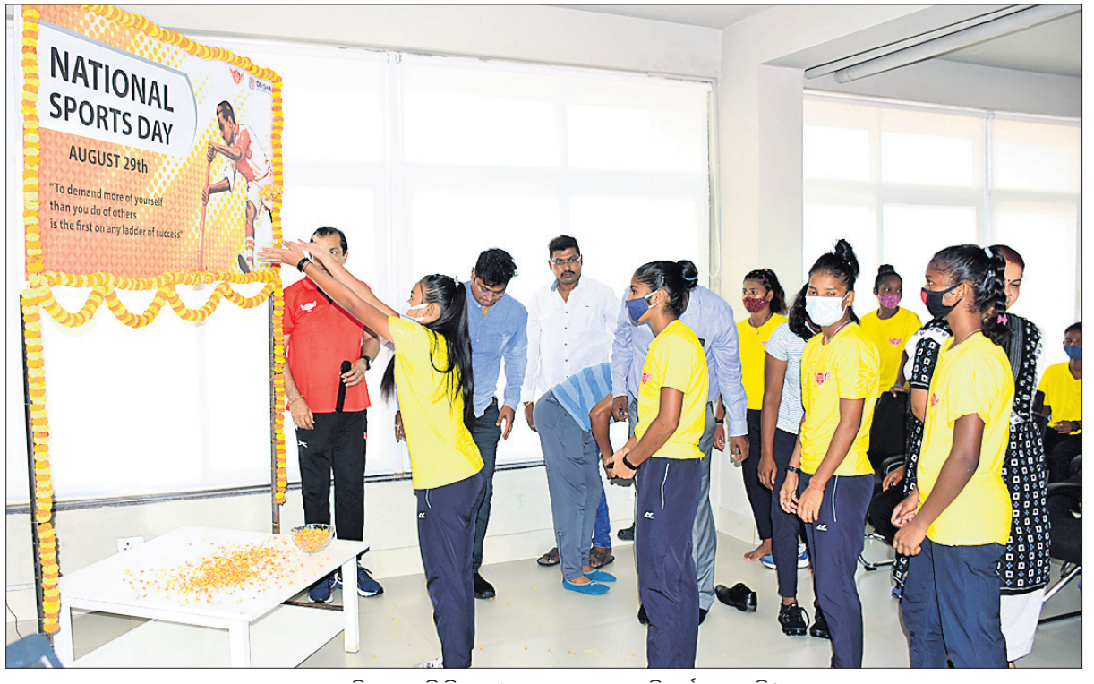
ଖେଳାଳିମାନେ ହକି କିମ୍ବଦନ୍ତୀ ଧ୍ୟାନରାଜଙ୍କୁ ଶ୍ରଦ୍ଧାଞ୍ଜଳି ଅର୍ପଣ କରୁଛନ୍ତି।

ଭୁବନେଶ୍ୱର, ୨୯।୮ (କ୍ରୀଡ଼ା ପ୍ରତିନିଧି) ହକି କିମ୍ବଦନ୍ତୀ ମେଜର ଧ୍ୟାନରାଜଙ୍କ ଜନ୍ମଦିବସ ଜାତୀୟ କ୍ରୀଡ଼ା ଦିବସ ଅବସରରେ ରବିବାର ରାଜ୍ୟବ୍ୟାପୀ ବିଭିନ୍ନ କାର୍ଯ୍ୟକ୍ରମ ଅନୁଷ୍ଠିତ ହୋଇଛି। କଳିଙ୍ଗ ଷ୍ଟାଡ଼ିୟମରେ ପୂର୍ବରୁ କ୍ରୀଡ଼ା ଛାତ୍ରାବାସ ଏବଂ ନାଭାଲ ଟାଟା ହକି ଏକାଡେମୀ ହାଇପରଫୋମାଟ୍ ସେକ୍ଟର ଖେଳାଳି ଏବଂ ଓଡ଼ିଶା ହକି ପ୍ରମୋଶନ କାଉନ୍ସିଲ୍ ଚେୟାରମ୍ୟାନ ଦିଲୀପ ତିର୍କୀଙ୍କ ଉପସ୍ଥିତିରେ କାର୍ଯ୍ୟକ୍ରମ ଅନୁଷ୍ଠିତ ହୋଇଥିଲା। ମେଜର ଧ୍ୟାନରାଜ ଫଟୋଗ୍ରାଫିରେ ପୁଷ୍ପ ଅର୍ପଣକୁ କାର୍ଯ୍ୟକ୍ରମ ଆରମ୍ଭ ହୋଇଥିଲା। ଉପସ୍ଥିତ ପ୍ରତିଭାସମ୍ପନ୍ନ ଖେଳାଳିଙ୍କୁ ଦିଲୀପ ହକିର ବିଭିନ୍ନ କଳାକୌଶଳ ଶିଖାଇବା ସହ ଭାବର ଆଦାନ ପ୍ରଦାନ କରିଥିଲେ। ଏହାପରେ ପିଲାମାନଙ୍କ ମଧ୍ୟରେ ଏକ ପ୍ରଦର୍ଶନୀ ମ୍ୟାଚ ଆୟୋଜିତ ହୋଇଥିଲା। ଏହି ଅବସରରେ ହକି ଖେଳାଳିଙ୍କୁ ଉତ୍ସାହିତ କରିବା ପାଇଁ ଏକ ସଙ୍ଗୀତ ଭିଡିଓ ଡିଏଲ୍ ପିଲାପିଲିଆ ଲୋକାର୍ପଣ କରିଥିଲେ। ରାଜ୍ୟ ସରକାର ଏବଂ