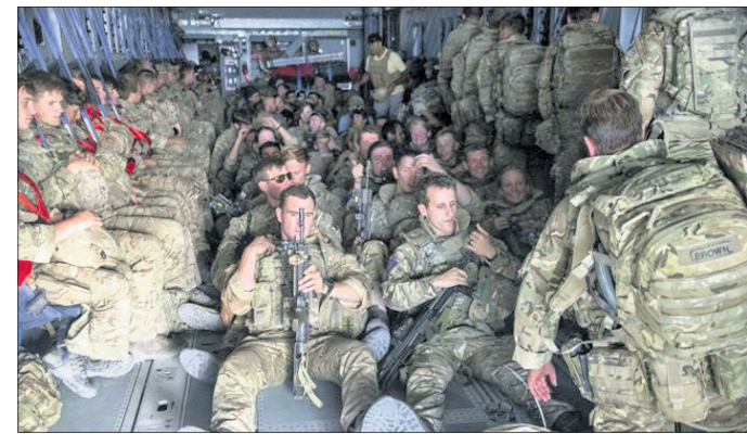
ଅପରେଶନ ପିଟ୍‌ଜ (ଆଫଗାନିସ୍ତାନରୁ ବ୍ରିଟିଶଙ୍କୁ ଫୋରାଇନେବା ଅଭିଯାନ) ଜନସମ୍ମତ କହିବା ସହ ଏହାର ଏକ ଶେଷ ହେଲା ବୋଲି ରବିବାର ଭିଡିଓ ଟୁଇଟ୍‌ରେ ପୋଷ୍ଟ କରିଛନ୍ତି।

ଲଣ୍ଡନ, ୨୯୮୮(ପି.ବି.): କାବୁଲରୁ ବ୍ରିଟିଶ ସେନା ପ୍ରତ୍ୟାହାର ରବିବାର ସମ୍ପୂର୍ଣ୍ଣ ହୋଇଛି। ତାଲିବାନ୍ କ୍ଷମତା ଦଖଲ କରିବା ପରେ ଆଫଗାନିସ୍ତାନରେ ବ୍ରିଟିଶର ୨୦ ବର୍ଷର ସେନା ଅଭିଯାନର ପୂର୍ଣ୍ଣରୂପେ ପଡ଼ିଛି। ବ୍ରିଟିଶ ନିଜର ୧୫ ହଜାର ନାଗରିକଙ୍କୁ ଫୋରାଇନେବା ପରେ ରୟାଲ ଏୟାରଫୋର୍ସ ବିମାନ ଶନିବାର ରାତିରେ କାବୁଲ ବିମାନବନ୍ଦର ଛାଡ଼ି ଅଳ୍ପଦୂରତାରେ ଯୋଗାଯିବ। ବ୍ରିଟିଶ ନିଜର ପହଞ୍ଚିଛି। ସେନା ପ୍ରତ୍ୟାହାର ପ୍ରକ୍ରିୟାରେ ସହାୟତା କରୁଥିବା ଆଫଗାନିସ୍ତାନରେ ବ୍ରିଟିଶ ରାଷ୍ଟ୍ରପତି ସାର୍ ଲାଉଡି ବ୍ରିଷ୍ଟୋକ୍ ସମେତ ସମଗ୍ର ଅଧିକାରୀ ଓ ସୈନ୍ୟ ଫେରିଯାଇଛନ୍ତି।