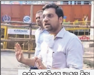
କର୍ନଲ ଏସ୍‌ପିଏମ୍ ଆୟୁଷ ସିହ୍ନା ହେବା ପରେ ବିଭିନ୍ନ ମହଲରେ ଏହାକୁ ସମାଲୋଚନା କରାଯାଇଛି। ଭାଜପା ଏମ୍ପି ବରୁଣ ଗାନ୍ଧୀ ମଧ୍ୟ ଏସ୍‌ପିଏମ୍‌ଙ୍କ ଏଭଳି କାର୍ଯ୍ୟକୁ ନିନ୍ଦା କରିଛନ୍ତି।