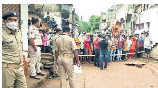
ହତ୍ୟାକାଣ୍ଡ ଘଟିଥିବା ସ୍ଥାନ

ପରିବାର ଲୋକଙ୍କ ଆଗରେ ସନାତନଙ୍କ ଜୀବନ ଗଲା। ଗୋଟିଏ ପରିବାରର ୬ ଗିରଫ, ମୁଖ୍ୟ ଅଭିଯୁକ୍ତ ଫେରାର। ହତ୍ୟାରେ ବ୍ୟବହୃତ ଛୁରି ଓ ଅନ୍ୟାନ୍ୟ ସାମଗ୍ରୀ ଜବତ