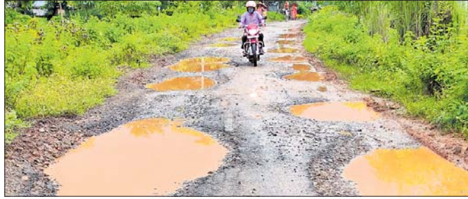
ରାସ୍ତାରେ ଖାଲ ବୃଦ୍ଧି ହୋଇଛି।