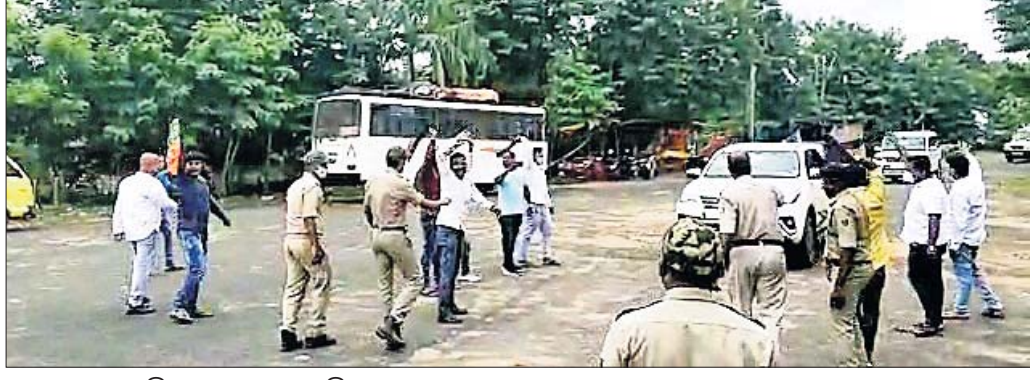
ଭାଜପା ପକ୍ଷରୁ ବିରୋଧ କରାଯାଇଛି।