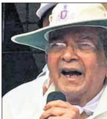
ପୁରୁଷ, ୩୦/୮ (ପି.ଟି.): ପୁରୁଷ ବିଶ୍ୱ କ୍ରିକେଟ କୋର୍ ପରଞ୍ଜିପେକ ଦେହାନ୍ତ