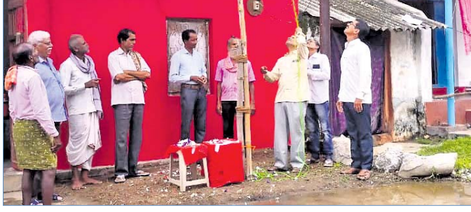
ସମ୍ମିଳନୀ ସ୍ଥଳରେ ପତାକା ଉତ୍ତୋଳନ କରାଯାଇଛି।