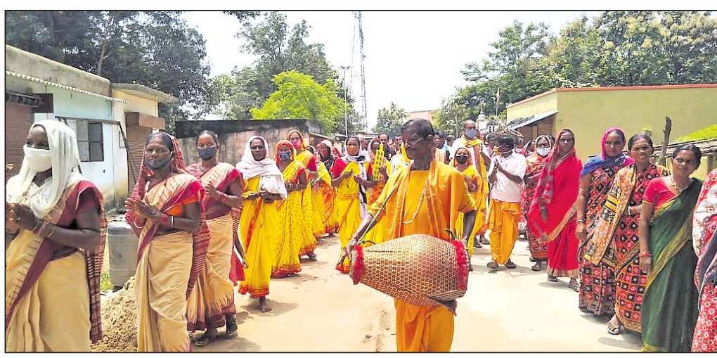
ସଂକୀର୍ତ୍ତନ କରି ଅତିଥିମାନଙ୍କୁ କଳାକାରମାନେ ପାଞ୍ଚୋଟି ନେଇଛନ୍ତି।

ଉଚ୍ଚ ପ୍ରଶିକ୍ଷଣ ଶିବିରରେ ପ୍ରଶିକ୍ଷଣ ଲୋକଙ୍କ ନିକଟରେ ପଞ୍ଚୋଟି ପାରିବ ସେ ନେଇଥିବା ବରିଷ୍ଠ କଳାକାରମାନେ ସେ ସମ୍ପର୍କରେ ଗ୍ରାମାଞ୍ଚଳ କଳାକାରଙ୍କୁ ସଚେତନ କରାଇବା ଓ ନିଜ ଅଞ୍ଚଳରେ କୋଭିଡ଼ ରକ୍ଷା ପରିକ୍ରମା କରାଇବା ସହିତ ବିଭିନ୍ନ ଜନସଚେତନ ବାର୍ତ୍ତା କେମିତି