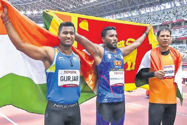
ବାମକୁ ସୁମିତ ସିଂ ଗୁର୍ଜର, ଶ୍ରୀଲଙ୍କାର ଓ ଦାନ୍ତେଶ ପ୍ରିୟନ ହେରାଥ ଓ ଦେବେନ୍ଦ୍ର ଝାଝରିଆ।

ପୂର୍ବରୁ ୨ଥର ପାରାଲିମ୍ପିକ୍ସ ସ୍ୱର୍ଣ୍ଣ ପଦକ ହାସଲ କରିଥିବା ଅଭିଜିତ ଜାଭେଲିନ ଥ୍ରୋୟର ଦେବେନ୍ଦ୍ର ଝାଝରିଆ ଏଥର ରୌପ୍ୟ ପଦକ ହାସଲ କରିଛନ୍ତି। ଏଥିସହ ସେ ପାରାଲିମ୍ପିକ୍ସରେ ମୋଟ ଦ୍ୱିତୀୟ ପଦକ ଜିତିଛନ୍ତି। ସେହିପରି ଅନ୍ୟତମ ଭାରତୀୟ ଜାଭେଲିନ ଥ୍ରୋୟର ସୁମିତ ସିଂ ଗୁର୍ଜର ଝାଝରିଆଙ୍କ ପଛକୁ ରହି ବ୍ରୋଞ୍ଜ ପଦକ ଜିତିଛନ୍ତି। ଉଭୟ ପୁରୁଷ ଜାଭେଲିନ ଥ୍ରୋ ଏଫ୍.୬୪ ଫାଇନାଲରେ ଦମଦାମ ପ୍ରଦର୍ଶନ କରି ପଦକ ହାସଲ କରିଛନ୍ତି। ଯେଉଁ ଆଥଲେଟମାନଙ୍କ ବାହୁରେ ଅକ୍ଷୟ, ମାଂସପେଶୀରେ ଦୁର୍ବଳତା ଥିବା ସେମାନଙ୍କୁ ଏଫ୍.୬୪ ବର୍ଗରେ ସାମିଲ କରାଯାଇଥାଏ। ୪୦ ବର୍ଷୀୟ ଝାଝରିଆ ପୂର୍ବରୁ ୨୦୦୪ ଓ ୨୦୧୨ ଅଲିମ୍ପିକ୍ସରେ ସ୍ୱର୍ଣ୍ଣ ପଦକ ହାସଲ କରି ଭାରତର ଶ୍ରେଷ୍ଠ ପାରାଲିମ୍ପିଆନ ବିବେଚିତ ହୋଇଆସୁଛନ୍ତି। ସେ ବ୍ୟକ୍ତିଗତ ଶ୍ରେଷ୍ଠ ୬୪. ୩୫ ମିଟର