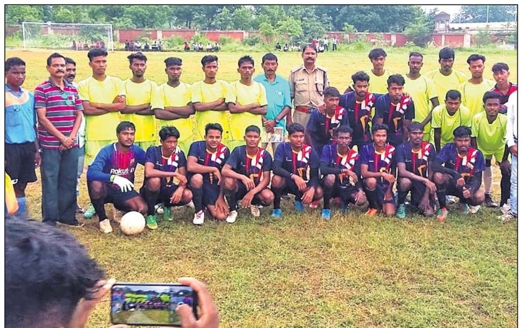
ପ୍ରତିଭା ଚୟନ ଫୁଟବଲ ଟୁର୍ନାମେଣ୍ଟ ଉଦ୍‌ଯାପନାରେ ଅତିଥିକ ସହ ଖେଳାଳି।