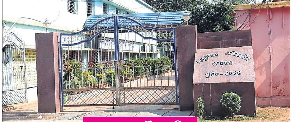
ୱାଲିଟୋନ ଏକ୍ସପେକ୍ଟେସନ୍ ପୌରପାଳିକା କେନ୍ଦ୍ରପାଟଣା ପୌରପାଳିକା ଓ ବେଲିଫୋନ ଏକ୍ସପେକ୍ଟେସନ୍ ପୌରପାଳିକା ମାଲକୋଟା ସ୍ଵାକ୍ଷିତି ସେକ୍ସନ୍, ମିନି ପାଠ, ବ୍ୟସ୍ତ ଉପକ୍ରମକରଣ, ରାସ୍ତା ଥର ଖର୍ଚ୍ଚ କରାଯାଉଥିଲେ ହେଁ ଲୋକଙ୍କ ଦୈନିକ ସମସ୍ୟାକୁ ଅଣଦେଖା କରାଯାଉଥିବାରୁ ଅଧିକାରୀ ଲାଗିରହିଛି। ବର୍ଷା ହେଲେ ବିଭିନ୍ନ ସାଧନରେ ସାଧାରଣ ଲୋକ ତଥା ସରକାରୀ ଲୋକଙ୍କ କ୍ଵାର୍ଟର ଏପରିକି ଖୋଦ ପୌରପାଳିକା ଅଧିକାରୀଙ୍କ ଘର ଭିତରେ ଛେନ ପାଣି ପଡ଼ୁଥିଲେ ହେଁ ସ୍ଥାନୀୟ ସମାଧାନ ହେଉନାହିଁ। ବିଦ୍ୟୁତ୍ କରଣ, ବ୍ରେକ ଓ ରାସ୍ତା ନିର୍ମାଣରେ ମଧ୍ୟ ବ୍ୟାପକ ଅର୍ଥ ବ୍ୟୟ ହେଉଥିଲେ ହେଁ ସମାଧାନ ନାଁ ଥୁଲିଛି।

୧୯୫୧ ମସିହାରେ ଘାଟିତ ହୋଇଥିଲା କେନ୍ଦ୍ରପାଟଣା ପୌରପାଳିକା। ଏହାର ଖର୍ଚ୍ଚ ସଂଖ୍ୟା ୧୨୭୦ ୨୧୯୯ ରୁଁ ଥିଲା। ଏବେ ରାସ୍ତା, ବ୍ରେକିଙ୍ଗ ସମସ୍ୟା ସାଙ୍ଗକୁ ସ୍ଵାସ୍ଥ୍ୟ ଓ ପରିମଳ ବ୍ୟବସ୍ଥା ଶୋଚନୀୟ ହୋଇ ପଡ଼ିଛି। ପକ୍ଷରେ ନଗରବାସୀଙ୍କ ଅଧିକାର ବଢ଼ୁଛି। ବିଭିନ୍ନ ସାଧନ ଯୋଗ୍ୟତାକୁ ଅବହେଳିତ ହୋଇ ରହିଥିବା ବେଳେ ସେସବୁର ପୁରରୁଦ୍ଧାର ନିୟମ ସଫେଳ ନିୟମିତ ହେଉନଥିବାରୁ ଲୋକେ ବାଧ୍ୟ ହୋଇ ଚାହାନ୍ତି ବ୍ୟବହାର କରୁଛନ୍ତି। ଅନେକ ନବ ନିର୍ମିତ ଗୋଷ୍ଠାଗତ ପାଇଖାନା ନିର୍ମାଣ ହୋଇଛି କିନ୍ତୁ ସେସବୁରେ ତାଲା ଝୁଲୁଥିବାରୁ ବାହାରେ ଲୋକେ ଶୌଚ କରୁଥିବାରୁ ପରିମଳ ବ୍ୟବସ୍ଥା ଶୋଚନୀୟ ହୋଇ ପଡ଼ିଛି। ଅସୁରକ୍ଷିତ ଅବସ୍ଥାରେ ଗାଣାଞ୍ଚଳ