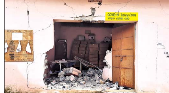
କ୍ଷତ୍ତ୍ୱ ଧକାରେ କରୋନା ପରୀକ୍ଷାକେନ୍ଦ୍ର ଭାଙ୍ଗିଯାଇଛି।