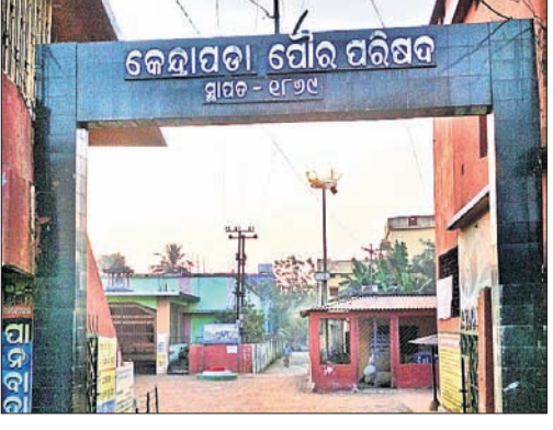
ସହନ କରୁଛି। ଏବେ ବି ଜଳ ନିଷାସନ, ରାସ୍ତା, ଟ୍ରାଫିକ୍ ସମସ୍ୟା ମଧ୍ୟରେ ସହରବାସୀ ଜୀବନ ଅତିବାହିତ କରୁଛନ୍ତି।

୧୮୮୫ ମେ ୧୮ରେ ଲଡ଼ି ରିପନ ସ୍ଵାୟତ୍ତ ଶାସନ ପ୍ରାଥମ ଆରମ୍ଭ କରିଥିଲେ। ତେବେ ଏହା ପୂର୍ବରୁ ଓଡ଼ିଶାର ପ୍ରଥମ ସ୍ଵାଧୀନତାବାଦୀ କେନ୍ଦ୍ରପାଟଣାରେ ୧୮୬୯ ମାର୍ଚ୍ଚ ୧୦ରେ ପ୍ରତିଷ୍ଠା ହୋଇଥିଲା। ଆଖପାଖ ୬.୪୭ ବର୍ଗ କିଲୋମିଟର ମଧ୍ୟରେ ୧୮୮୭ରେ ଲୋକାଳ ଗୋଟି ଗଠନ ହୋଇଥିଲା। ପ୍ରଥମ ଥର ଖର୍ଚ୍ଚ କାର୍ଯ୍ୟକାରୀ ନିର୍ବାଚନ ୧୯୧୧ରେ ଅନୁଷ୍ଠିତ ହୋଇଥିଲା। ୧୮୮୫-୮୭ ରେ ଏହାର ଲୋକସଂଖ୍ୟା ମାତ୍ର ୧୫,୭୧୯ ଥିଲା। ସମ୍ପ୍ରତି ଏହି ସ୍ଵାଧୀନତାବାଦୀ ପରିବର୍ତ୍ତନ ହୋଇ ୨୧ ଖର୍ଚ୍ଚରେ ପରିଣତ ହୋଇଛି। ସେହିପରି ଲୋକ ସଂଖ୍ୟା ୫୪ ହଜାରରୁ ଅଧିକ ପହଞ୍ଚିଛି। ୧୫୨ ବର୍ଷର ଏହି ସ୍ଵାଧୀନତାବାଦୀ ମଧ୍ୟରେ ବୁଦ୍ଧିବା ଶ୍ରେଣୀପଦ୍ଧତି ଶ୍ରୀବଳଦେବଜୀଉକ ମନ୍ଦିର ରହିଛି। ମହାକାଳ ଶିଖା ଏବଂ ପାଇଁ ଓଡ଼ିଶାର ପ୍ରଥମ ଫେକର ବାଳିକା ବିଦ୍ୟାଳୟ ଏଠାରେ ଅଛି। ଏହାବ୍ୟତୀତ ଡାକମେଣ୍ଟ ଗୁରୁଜୀ ପାଠାଗାର, ସୂର୍ଯ୍ୟ ଘଡ଼ି ଆଦି ଇତିହାସର ସ୍ଵାସର