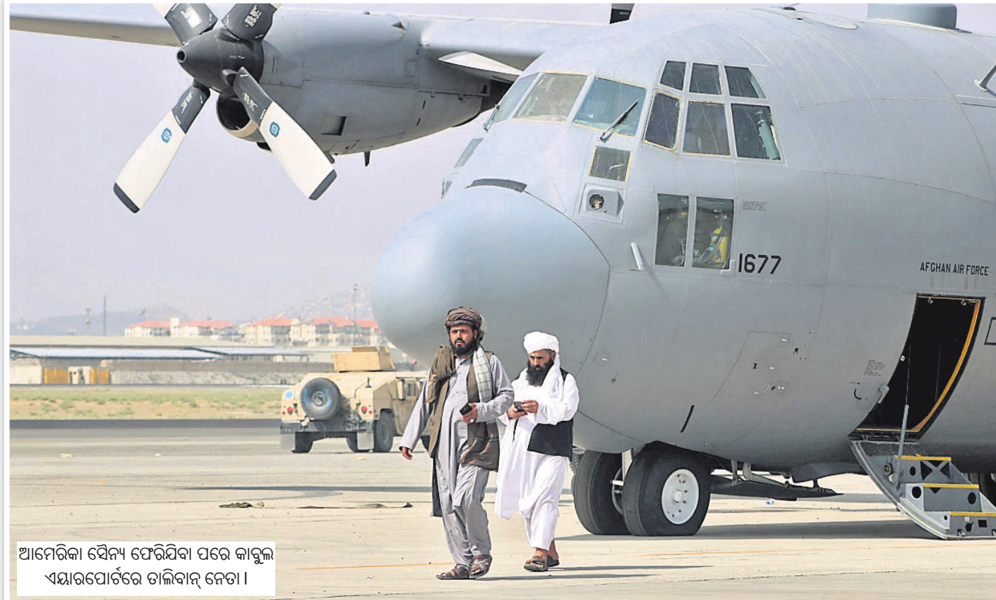
ଆମେରିକା ସୈନ୍ୟ ଫେରିଯିବା ପରେ କାବୁଲ ଏୟାରପୋର୍ଟରେ ତାଲିକାନ୍ ନେତା।

ଆଧୁନିକ ବିଶ୍ୱର ଅନ୍ୟତମ ଲକ୍ଷ୍ୟ ଯୁଦ୍ଧରେ ପୂର୍ଣ୍ଣସ୍ୱେଚ୍ଛା ଜୀବନର ୨ ଦଶନ୍ଧି ବିତାଇବା ପରେ ସ୍ୱଦେଶକୁ ପ୍ରତ୍ୟାବର୍ତ୍ତନ କରିଛନ୍ତି ଆମେରିକୀୟ ସୈନ୍ୟ। ଆଫଗାନିସ୍ତାନ ମାଡ଼ିରେ ଛାଡ଼ି ଯାଇଛନ୍ତି ଅନେକ ସତ୍ତକ, ଅଭୁଳା ଅତୀତ। ଯେଉଁ ତାଲିକାନ୍ ଆରମ୍ଭ ହୋଇଥିଲା କାହାଣୀ ସେଇ ତାଲିକାନ୍ ହାତରେ ଆଜି ଇସ୍ଲାମିକ୍ ଏମିରେଟ୍ସ ଅଫ୍ ଆଫଗାନିସ୍ତାନର ଶାସନ। ଏଥର ତାଲିକାନ୍ ଆସିଛି ନେଇ ନୂଆ ଚେହେରା ନୂତନ ସଂସ୍କରଣ ସହ। ସବୁଠି ଚର୍ଚ୍ଚାରେ ଆତଙ୍କବାଦୀ ସଙ୍ଘଠନର ମିଥ୍ୟା ଅହିଂସା ଘୋଷଣା ଓ ଚତ୍ତନିତ ଭଦ୍ର ଅଭିନୟ। ଯା' ଭିତରେ ଛିଡ଼ା ହୋଇଛି ଗୋଟିଏ ପ୍ରଶ୍ନ: ଆମେରିକା ବିରୋଧରେ ଯୁଦ୍ଧ ଶେଷ ହୋଇଗଲା ସିନା; ଦାରିଦ୍ର୍ୟ, ଦୁର୍ନୀତି, ଆତଙ୍କ, ଅସ୍ଥିରତା ବିରୋଧରେ ଚ୍ୟାଲେଞ୍ଜକୁ କିପରି ସାମ୍ନା କରିବ ଆଫଗାନିସ୍ତାନ।