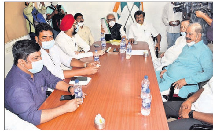
ବିଧାନସଭା ମୌସୁମୀ ଅଧିବେଶନ ପୂର୍ବରୁ ମଙ୍ଗଳବାର ଅନୁଷ୍ଠିତ ବିଜେଡି, ଭାଜପା ଓ କଂଗ୍ରେସ ବିଧାୟକ ଦଳ ବୈଠକ ।