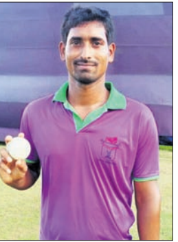
ଆଦିତ୍ୟ କେ ବାବା