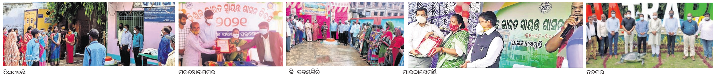
ବିନପହଣ୍ଡି ପୁରୁଷୋତ୍ତମପୁର ଡି. ଉପଯନ୍ତରି ପାରଳାଖେମୁଣ୍ଡି ଛତ୍ରପୁର ପୁଲବାଣୀ ଗୋପାଳପୁର ଭଞ୍ଜନଗର ହିଞ୍ଜିଳିକାବୁ ବୁରୁଡ଼ା