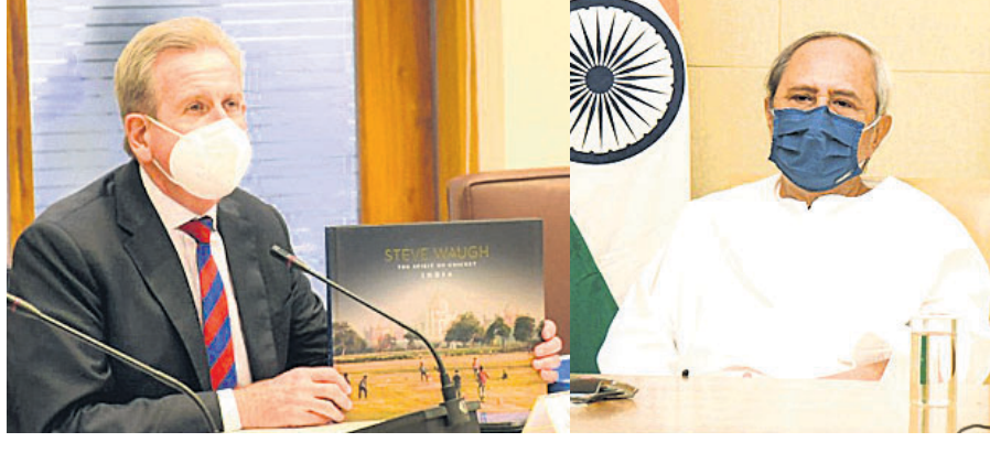
ଜୁଜନେଶ୍ୱର, ୩୧୮ (ବ୍ୟବସାୟ)