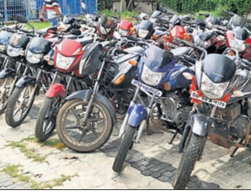
ଗିରଫ ଅଭିଯୁକ୍ତ ଓ ଜବତ ବାଇକ୍, ଷ୍ଟୁଟି।