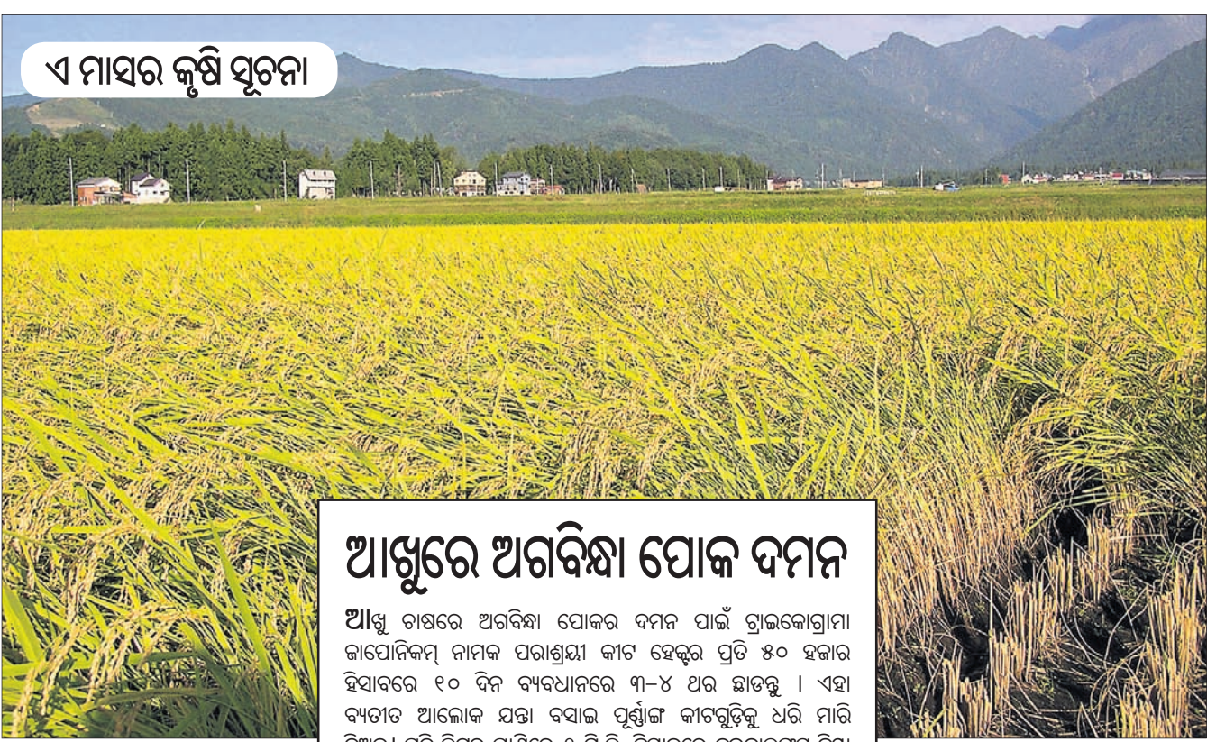
ଏ ମାସର କୃଷି ସୂଚନା